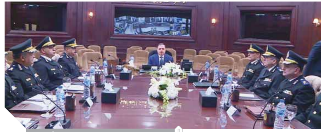
وزير الداخلية خلال اجتماعه مع القيادات الأمنية

اللزامة لتأمين تلك المنشآت واتخاذ جميع الإجراءات لإحكام الرقابة والسيطرة الأمنية على الطرق المحيطة والمؤدية إليها، لافتاً إلى أهمية تحلى القوات بالجاهزية التامة والكفاءة العالية ونشر الدوريات الأمنية وخدمات المرور والتجدة وتعزيز الأمانة بما يمكنها من التعامل مع مختلف المواقف الطارئة والمحتملة، كما شدد على استمرار ومواصلة جهود الأجهزة الأمنية في الضربات الاستباقية للناصر والتنظيمات الإرهابية، واستهداف البؤر الإجرامية والتشكيكات العصابية وضبط عناصرها بجميع محافظات الجمهورية، وتنفيذ الأحكام القضائية مع مواصلة الجهود الأمنية لتنفيذ جميع قرارات إزالة التعديات على أراضى وأماكن الدولة بلا تهاون وبالتنسيق الكامل مع الأجهزة الإدارية بالمحافظات. ووجه الوزير بالتواجد الميداني لجميع المستويات الإشرافية والقيادية لتابعة سير الأداء الأمنى وتنفيذ الخطط الأمنية بكل دقة وجدية، مشدداً على الالتزام بحسن معاملة المواطنين ومراعاة البعد الإنساني لدى التعامل مع الجماهير أثناء تنفيذ