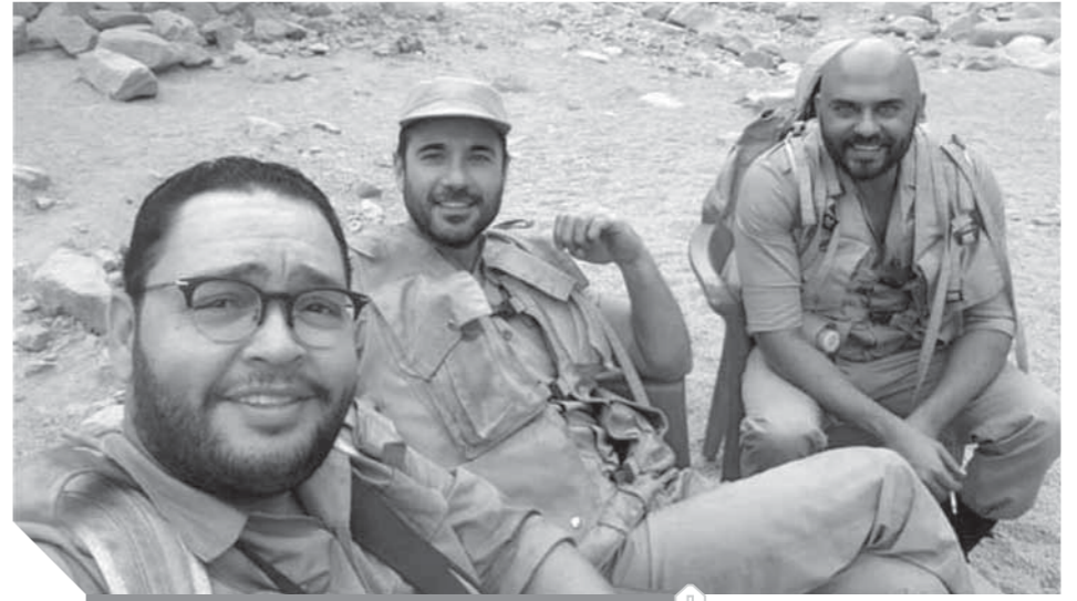
أحمد عز وأحمد رزق وأحمد صلاح حسنى من فيلم «الممر»