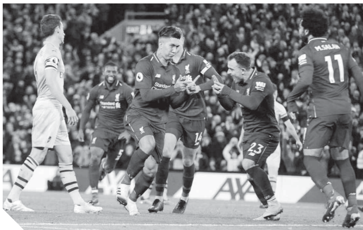
محمد صلاح تائق مع فيرمينو وماني في فوز الريدرز