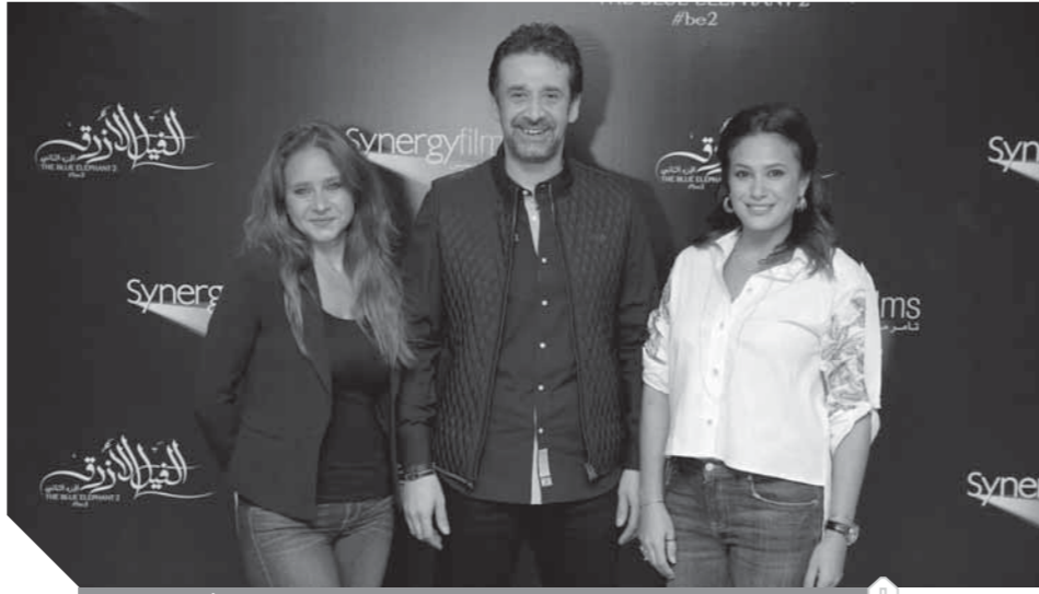
كريم عبد العزيز مع هند صبرى ونيللى كريم أثناء تصوير «الفيل الأزرق 2»

يبدو أن 2019 سيكون عاماً سينمائياً فريداً ومميزاً على المستويين الفني والجمهوري، بعد سنوات عانت فيه السينما المصرية العديد من الإخفاقات التي تسببت في عزوف المنتجين عن الإنتاج السينمائي، والتي خلفت وراءها مشكلات لا تحل بين ليلة وضحاها؛ إذ نجح صناع السينما في الخروج بالسينما المصرية من عق الزجاجة خلال عام 2018، والخروج بأعمال متميزة نافست على الجوائز الكبرى في المهرجانات الدولية والمحلية، في ظل الأزمات السينمائية كالتوزيع والقرصنة وقلة الإنتاج التي تحيطها من كل ناحية، وهذا النجاح سوف يصل إلى ذروته بحلول عام 2019، المقرر أن تشهد فيه صناعة السينما حالة من الازدهار تتمثل في الإنتاج الضخم لعدد من أفلامها التي دخلت معالق التصوير مبكراً تمهيداً لعرضها في أول يناير القادم، وأخرى يتم تجهيز لها.