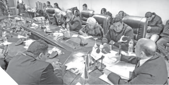
جانب من المؤتمر