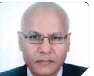
د. مصطفى عبدالرازق

مكسحة، دون أن يوضح لنا هل تركها على الوضع ذاته.. مكسحة أم ماذا؟.. عارضنا لنا في ملف أهرام الجمعة ما اعتبره «مدرسة السادات الاستراتيجية»! إذا كان الشئ بالشئ يذكر، فإن الأمر يقتضى الإشارة إلى أن ملف جريدة «الوطن» غرّد خارج السرير، ومثل نوعاً من المحاكمة للرئيس الراحل. وبدا ذلك من عنوانه: «مائة عام من العزلة»، مستوحياً عنوان رائعة ماركيز «مائة عام من العزلة»، حيث انتقد ديمقراطية السادات التي وصفها الملف بديمقراطية الأناب وأنه انتقل بمصر من مرحلة التنظيم الواحد إلى التعددية المقيدة.. «وكانك يا أبو زيد ما غزيت» في إشارة إلى عدم وجود تغيير يذكر على الصعيد التحول الديمقراطي، فيما اعتبر الملف من خلال مصداقه انتقاد للسادات الذي وصف في الأدبيات الشعبية بأنه «انتفاخ السداح مداح».. إصلاح ضل الطريق فانهى الأمر بانتفاضة الخبز، مشيراً إلى أن سياساته سلمات رقبة مصر إلى أمريكا! ما يؤخذ من أسلوب الاحتفاء هو أنه يتم وفق مقولة «الدروا محاسن موتاكم».. ولو أن هذا المبدأ يجوز في التعامل على مستوى الحياة الخاصة فإنه يبدو غير مقبول من الحياة العامة. وإذا لم نختلف على أن الرجل كان له الكثير من الإيجابيات والتجاوؤ فقد لا نختلف في الوقت ذاته على أنه كان له الكثير من السلبيات والأخفاقات، بتعبير آخر أن السادات بقدر ما كان بطلا للحرب والسلام وفق التوصيف الذى كان يحوّله ولغيره، فإنه أخطأ كذلك فى الحرب، وتراجع بنا على السلم، ومؤدى ذلك أن الاحتفاء الحقيقي به يجب أن يكون وفق روى موضوعية تتجاوز حالة خلق أساطير حوله قد لا يكون لها أساس من الصحة.