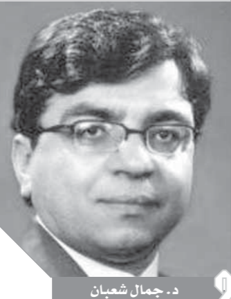
د. جمال شعبان

مربع الخطر وعرضه للأزمات القلبية. ويضيف الدكتور جمال شعبان أن أي إنسان لديه تاريخ عائلي بالنسبة لضغط الدم المرتفع أو السكر أو أمراض القلب بالعائلة، ينبغي له أن يبحث عن قلبه بعد سن العشرين، أما الذي ليس عنده تاريخ عائلي فيصغر أن يصل سن الأربعين عليه أن يفحص قلبه، فقد أثبتت الدراسات الحديثة أنه بعد سن الأربعين تبدأ كل عام 1% من عضلة القلب في الضمور والتليف، ويكون هناك احتمال كبير بحدوث اختلال في كهرباء القلب، والسبب الرئيسي للأزمات القلبية المفاجئة أو السكتة القلبية هو اختلال كهربائي مفاجئ وغالباً ما يكون ارتجافاً بطيئياً وفي بعض الأحيان يكون أسرع من الطب تحدثت حالات الوفاة المفاجئة في حالات كثيرة من المصابين به والارتجاف البطيئ يرتعش فيه البطين بشكل سريع جداً كأنه لا يتقبض ويظهر في شكل رسم القلب كتعرجات ثم يتحول لشكل خط مستقيم ويتوقف القلب عن الخفقان وتكون نهاية الحياة وإذا لم يتم التعامل السريع بالإلتعاش للقلب الصناعي والضغط المستمر على عضلة القلب لحين الإنعاش وتوفر جهاز الصدمات الكهربائية تكون هناك السكتة القلبية أو الموت المفاجئ.