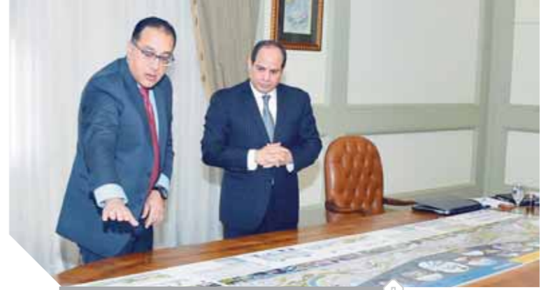
السياسى يستعرض مع مديولى المشروعات العملاقة

«السياسى» يوجه بتقييم برنامج الإصلاح الاقتصادى