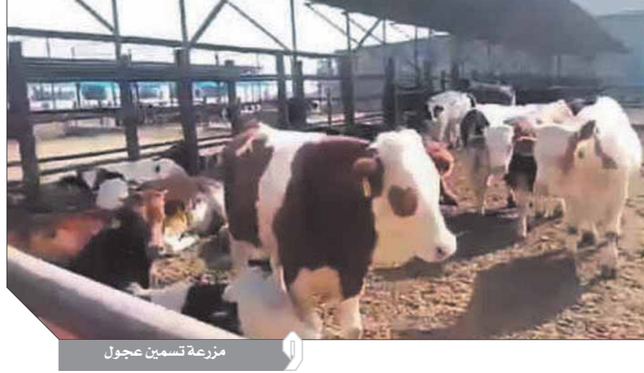
مزرعة تسمين عجول

زمنياً للاتفاقية تمتد على مدار عام، يتم خلالها تحقيق كافة الأهداف التي يسعى إليها البنك الزراعي وفق مخرجات محددة وجدولاً زمنياً واضحة. ولقت «القصير» إلى أن البنك يشهد مرحلة مهمة لإعادة هيكلة شاملة وذلك بدعم كبير من البنك المركزي المصري تشمل تطوير منظومة تكنولوجيا المعلومات، وإعادة هيكلة الموارد البشرية وبناء القدرات، رفع كفاءة إدارة الأصول، تطوير بيئة العمل وتحسين الصورة الذهنية من خلال تطوير حزم المنتجات التي تلبى احتياجات كافة شرائح العملاء، وتنوع قنوات التوزيع علاوة على العمل على توفير الخدمات الإلكترونية ومعالجة الدين غير المنتظمة وتقديم كل ما يدعم دور البنك في تحقيق التنمية الريفية والزراعية.