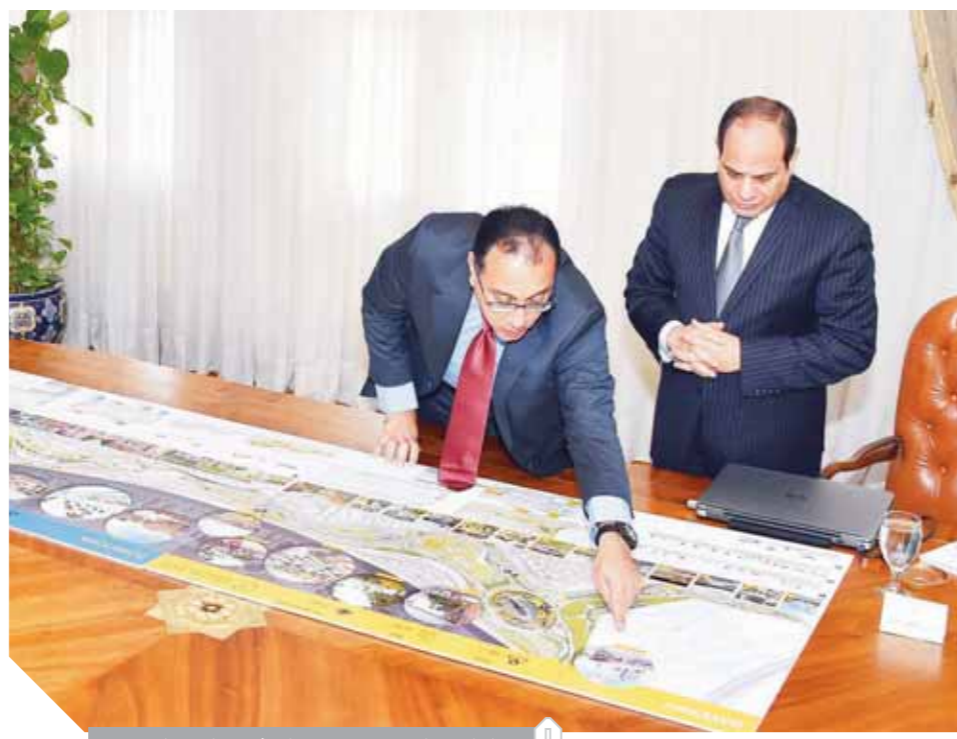
الرئيس السيسي يستمع إلى شرح رئيس الوزراء

عقد الرئيس عبدالفتاح السيسي أمس لقاءً مهماً مع الدكتور مصطفى مدبولي رئيس مجلس الوزراء، وطابق عامر محافظ البنك المركزي. وصرح السفير بسام راضى، المتحدث الرسمي باسم رئاسة الجمهورية، بأن الرئيس وجه خلال الاجتماع وتقييم الإجراءات المتخذة في هذا الإطار بشكل دوري لضمان تحقيق المستهدفات المالية والاقتصادية المنشودة، وبما يحافظ على التحسن المستمر في المؤشرات الاقتصادية وزيادة ثقة المجتمع الدولي في قدرة الاقتصاد المصري على النمو. كما وجه السيسي بمواصلة اتخاذ كل الإجراءات اللازمة لتنفيذ الإصلاحات الهيكلية الهادفة للحفاظ على الاستقرار النقدي والصرفي، فضلاً عن التنسيق بين كل أجهزة الدولة المعنية للعمل على خفض الدين العام والحد من التضخم. وأوضح المتحدث الرسمي أن الاجتماع تناول أهم تطورات برنامج الإصلاح النقدي وديناميات النقد الأجنبي إلى مصر التي وصلت إلى نحو 163.5 مليار دولار خلال السنوات الثلاث الماضية، وكذلك الزيادة التي طرأت على موارد البنوك المصرية من 8.3 مليار دولار إلى 88.5 مليار دولار في الفترة البينية منذ اتخاذ قرار تحرير سعر الصرف، وذلك بالرغم من التراجع السلبى لأحداث الأسواق الناشئة في العالم، كما عرض محافظ البنك المركزي موقف حساب ميزان المدفوعات خلال الثلاثة أشهر الأولى من السنة المالية