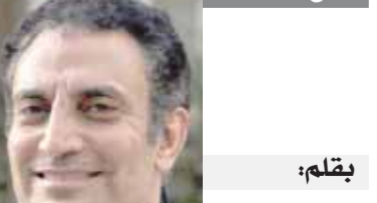
بقلم: صبري حافظ