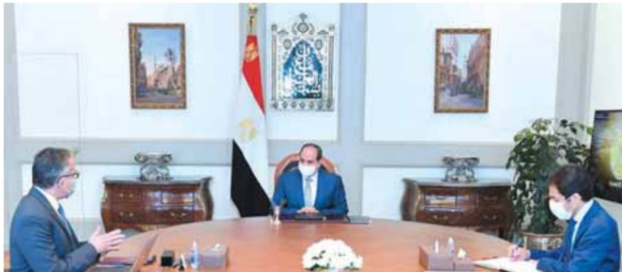
الرئيس خلال اجتماعه مع وزير السياحة والآثار

اجتمع الرئيس عبدالفتاح السيسى أمس مع الدكتور خالد العنانى وزير السياحة والآثار. وصرح السفير بسام راضى المتحدث الرسمى باسم رئاسة الجمهورية بأن الاجتماع تناول متابعة أنشطة ومشروعات وزارة السياحة والآثار. وقد عرض الدكتور خالد العنانى موقف حركة السياحة خلال الفترة الحالية، والإجراءات التي اتخذتها الحكومة لترويج للمقاصد السياحية المصرية لاستغلال ما تمتلكه مصر من مقومات فريدة ومتنوعة، خاصة مع بدء موسم السياحة الشتوى، فضلاً عن التنسيق المستمر بين مختلف الوزارات والجهات المعنية لضمان تغطية القطاع السياحى بشكل سريع من تداعيات جائحة كورونا، بما فى ذلك ما تم مؤخراً من إطلاق خط الطيران المباشر بين مدينتي الأقصر وشم الشيخ، والذي يهدف لربط السياحة الأثرية بالشواطئ، وبما يتكامل مع المنظومة الجديدة لشبكات الطرق والسكك الحديدية التي تربط مختلف المحافظات والمقاصد السياحية على مستوى الجمهورية. وقد وجه الرئيس بتعزيز عدد الأطقم الطبية بمطارات المدن السياحية لإجراء المسحات الطبية