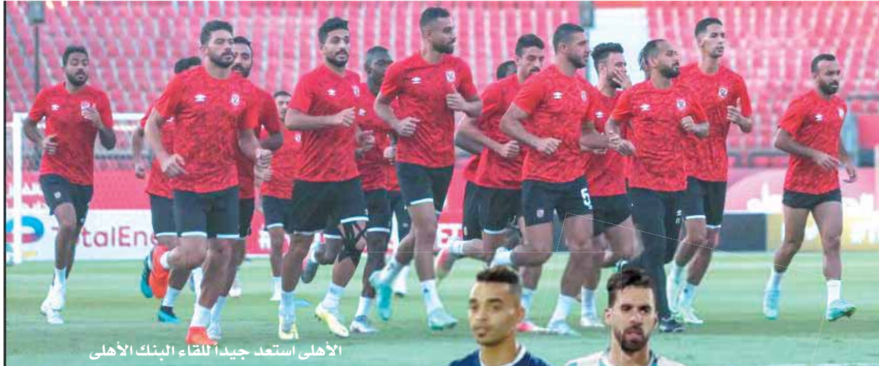
الأهلي استعد جيداً للقاء البنك الأهلي