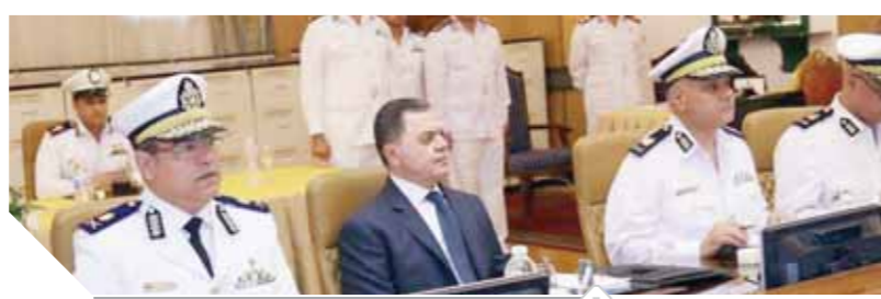
وزير الداخلية فى كشف الهيئة بإكاديمية الشرطة