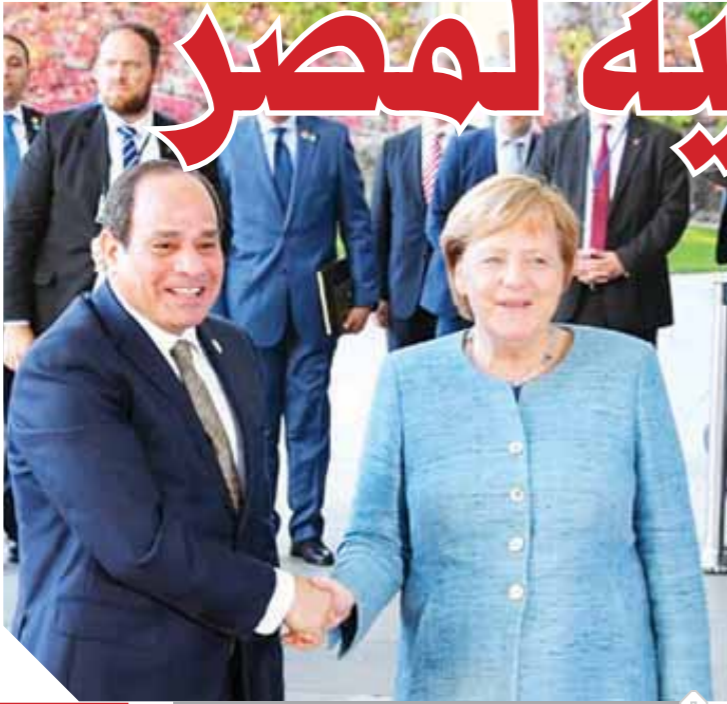
استقبال حافل لرئيس السيسى من المستشار الألمانية