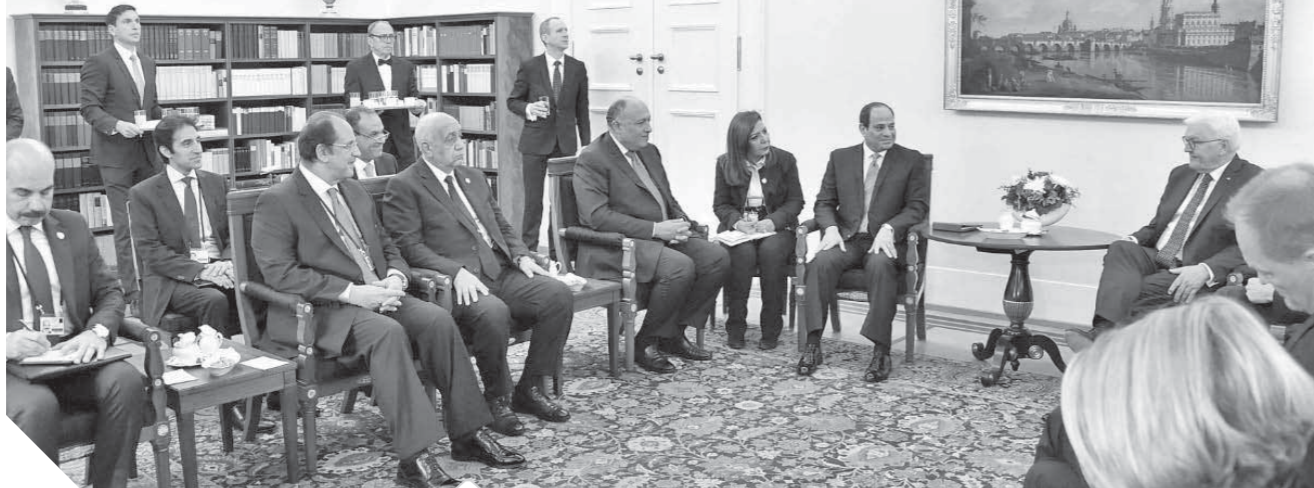
لقاءات خارجية مكثفة للرئيس

وصف خبراء في السياسة والعلاقات الدولية أن النشاط الخارجي المكثف للرئيس عبدالفتاح السيسي الذي يزور ألمانيا حالياً بعد عدد من الزيارات التي أجراها لكل من دول «اليونان وقبرص وروسيا والسودان» في وقت قياسي، بأنها زيارات ناجحة ومدعومة بسبب تعافي الاقتصاد المصري واستقرار الوضع السياسي والأمني في مصر وتوجيهاً للعمل المتواصل في الداخل لتطوير البنية التحتية وتوفير فرص العمل وإقامة المشروعات الوطنية.