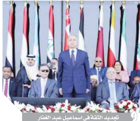
تجديد الثقة في إسماعيل عبد الغفار

أسفرت اجتماعات مجلس وزراء النقل العرب، عن تجديد الثقة في الدكتور إسماعيل عبد الغفار، رئيس الأكاديمية، لمدة عامين، تقديراً لدوره خلال فترة ولايته وما حققه من إنجازات على الصعيد العربي والدولي. جاء ذلك خلال اجتماعات الجمعية العامة للأكاديمية على المستوى الوزاري في دورتها 23 العادية، والتي أقيمت على هامش اجتماعات مجلس وزراء النقل العرب في دورته 31 العادية بقرع الأكاديمية في أبي فير بالإسكندرية. وشارك الدكتور إسماعيل عبد الغفار برئاسة الأكاديمية العربية للعلوم والتكنولوجيا والنقل البحري اعتباراً من يوم 25- 10- 2011 بناءً على قرار الجمعية العامة للجامعة الدول العربية. ويمتلك عبدالغفار رصداً ومسيرة حافلة في