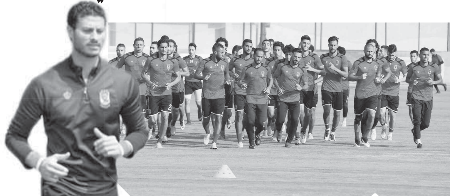
الأهلي يدخل مسكوره في برج العرب اليوم