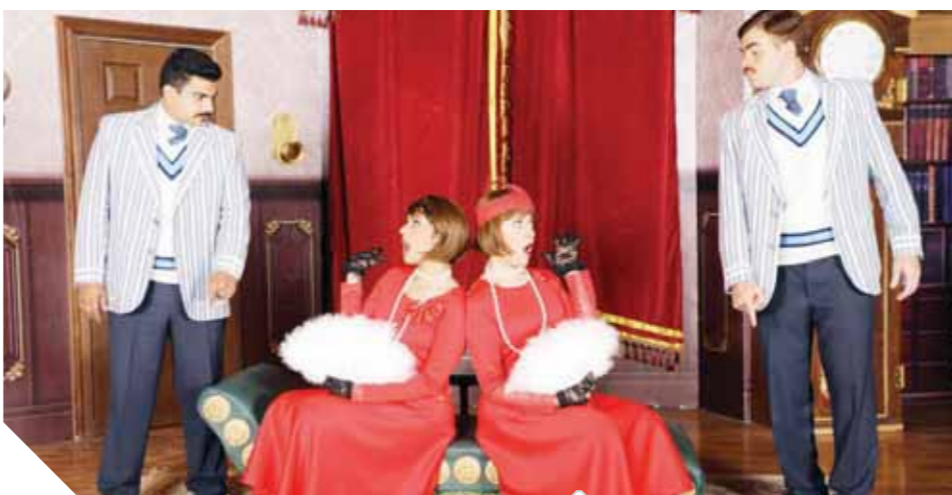
جانب من مسرحية «جريمة في المعادي»

لا يريد هذا الأمر أن يحصل، كما لفت إلى أن كل العاملين في المسرح سواء القائمون على الديكورات أو الإضاءة هم مسرحيون بالفعل، مشيراً إلى أنه اختارهم من أكثر من مكان، فهو دائماً حريص على التواجد في مساحر الدولة، وتم اختيارهم من أكثر من عرض، وأنه يجب أن يدعم