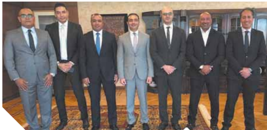
لقاء بين المصرية للاتصالات وفايبر مصر