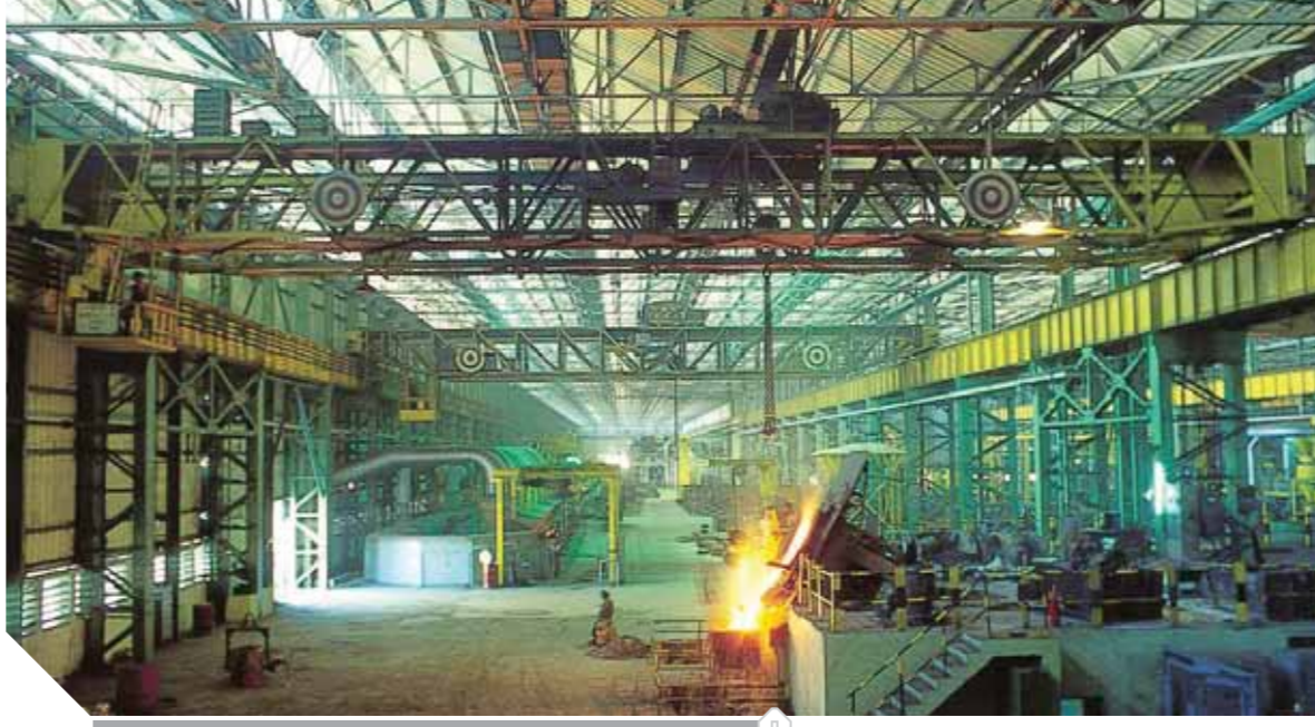
معاينة شركة الحديد والصلب لاتزال مستمرة!!