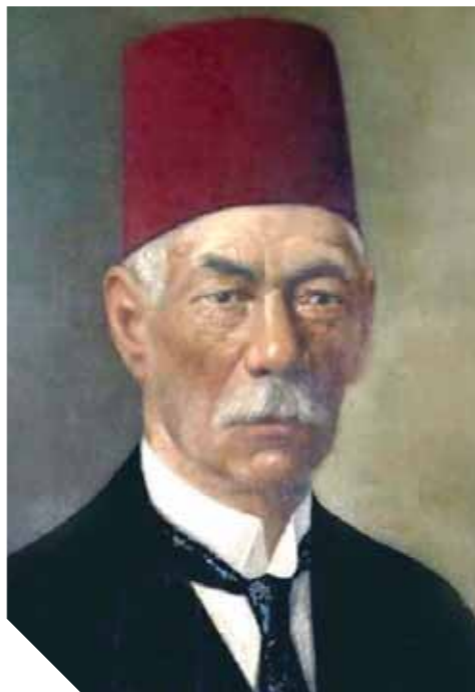
سعد باشا زغلول

الثورات، جذور ثورة 1919، وقائع الثورة، الموقف الدولي من ثورة 1919، الثورة وتغيير المجال السياسي، ثورة 1919 والمجتمع المصري، ثورة 1919 والبناء القانوني للدولة المصرية، ثورة 1919 والنضالات الثقافية الإبداعية، قرارات ثورة 1919. أما المحور الأخير فيتناول أسئلة الثورة ومنها: ما الذي تبقى من ثورة 1919؟ ما الدروس المستفادة من ثورة 1919؟ من صنع الثورة؟ القادة أم الشعوب؟ ماذا تبقى من الثورة في ذاكرة الأجيال؟ ويتم التسجيل للمشاركة في 1 في المنتدى بداية من 1 نوفمبر 2018، على أن يكون آخر موعد للتسجيل هو 1 ديسمبر 2018، وسيتم الإعلان عن الأوراق المقبولة 15 في ديسمبر 2018.