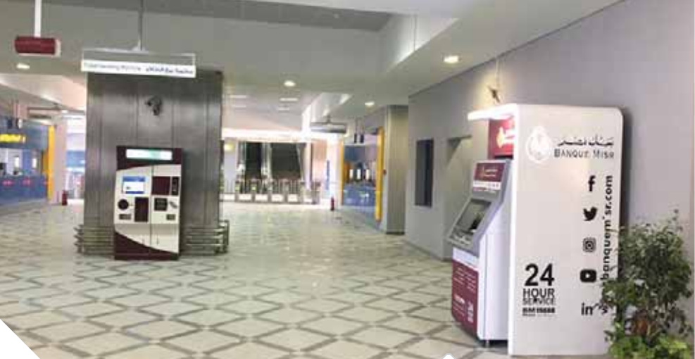
ماكينات الصرف الآلي بمحطات مترو الأنفاق

بجانب شبكة واسعة من المرسلين تغطي جميع بلدان العالم. ويولى بنك مصر اهتماماً كبيراً بتقديم الخدمات المصرفية الرقمية وذلك لتلبية احتياجات العملاء المتنوعة وتعزيزاً لجهود الدولة في تحقيق الشمول المالي، وعليه فقد قام البنك باتخاذ خطوات عدة نحو التحول الرقمي منها على سبيل المثال: التحديث والتطوير المستمر لخدمة الإنترنت البنكي BM Online، بإتاحة باقة جديدة من الخدمات المصرفية التي يمكن للعملاء الحصول عليها، هذا كما أطلق البنك لعملائه الخدمات البنكية الإلكترونية عبر الهاتف المحمول من خلال تطبيق الموبايل البنكي، ويعد البنك من أوائل البنوك المقدمة لخدمات الدفع عن طريق الهاتف المحمول من خلال تطبيق محفظة بنك مصر BM Wallet، كما قام بنك مصر مؤخراً ولأول مرة في مصر باستخدام تكنولوجيا الذكاء الاصطناعي «المساعد الآلي Chat Bot» من خلال موقعه الإلكتروني وذلك لخدمة العملاء على مدار الساعة.