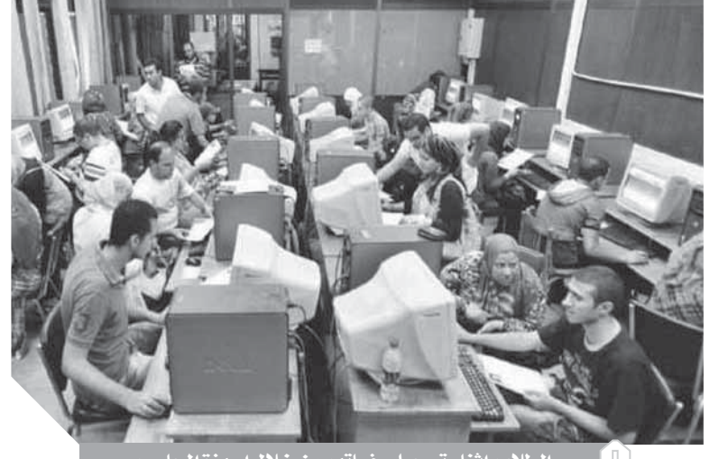
الطلاب أثناء تسجيل رغباتهم من خلال أجهزة الحاسب

٩٨.٤%، وتبقى أماكن خالية بكليات الهندسة. رشح للقبول بالكليات والمعاهد ١٤٨ ألف طالب وطالبة، و٤٨ ألفاً و١٤٥ علمى، و١٠ ألف أدبى، ويتخلف عن لقبول المرحلة ٢٢٩ طالباً وطالبة، اعتلت كلية طب المنصورة صدارة كليات الطب بمجموع ٤٠٦.٥ درجة، وجاءت طب القاهرة في الترتيب الرابع بمجموع ٤٠٦ درجات، وبلغ الحد الأدنى لقبول طلاب الأدبى بكليات الاقتصاد ٢٩٤.٥ درجة والأسنان ٢٩٠.٤ درجة، والإعلام ٢٨٨ درجة، وبلغ الحد الأدنى لقبول بالكليات الجامعية ١٤٨ ألفاً و٦٩٩ طالباً وطالبة، منهم ٨٨ ألفاً و٦٢٥ علمى و١٠٠ ألف و١٢٧ أدبى، ورشح لقبول بالمعاهد ٣٨٤ طالباً وطالبة منهم ١٧٧ علمى و٢١٧ أدبى.