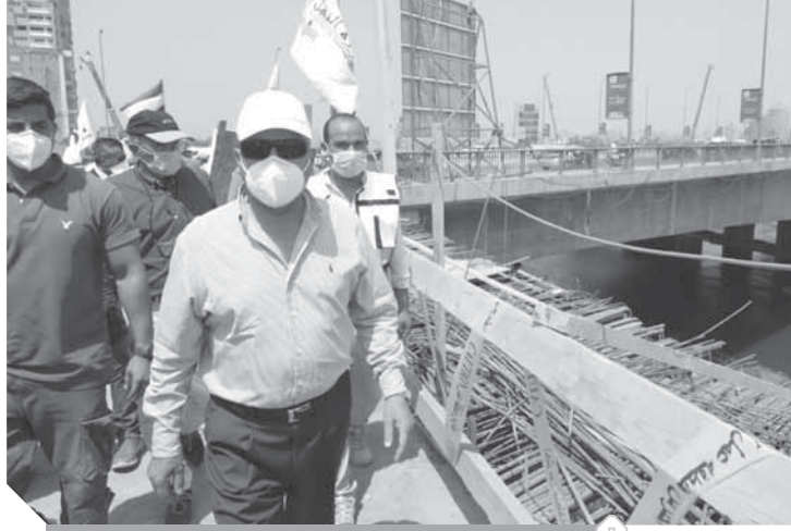
وزير النقل يتفقد أعمال تطوير الطريق الدائري

جاء ذلك خلال جولة تفقدية لوزير النقل أجراها أمس الأحد، لمتابعة تنفيذ أعمال التطوير والصيانة