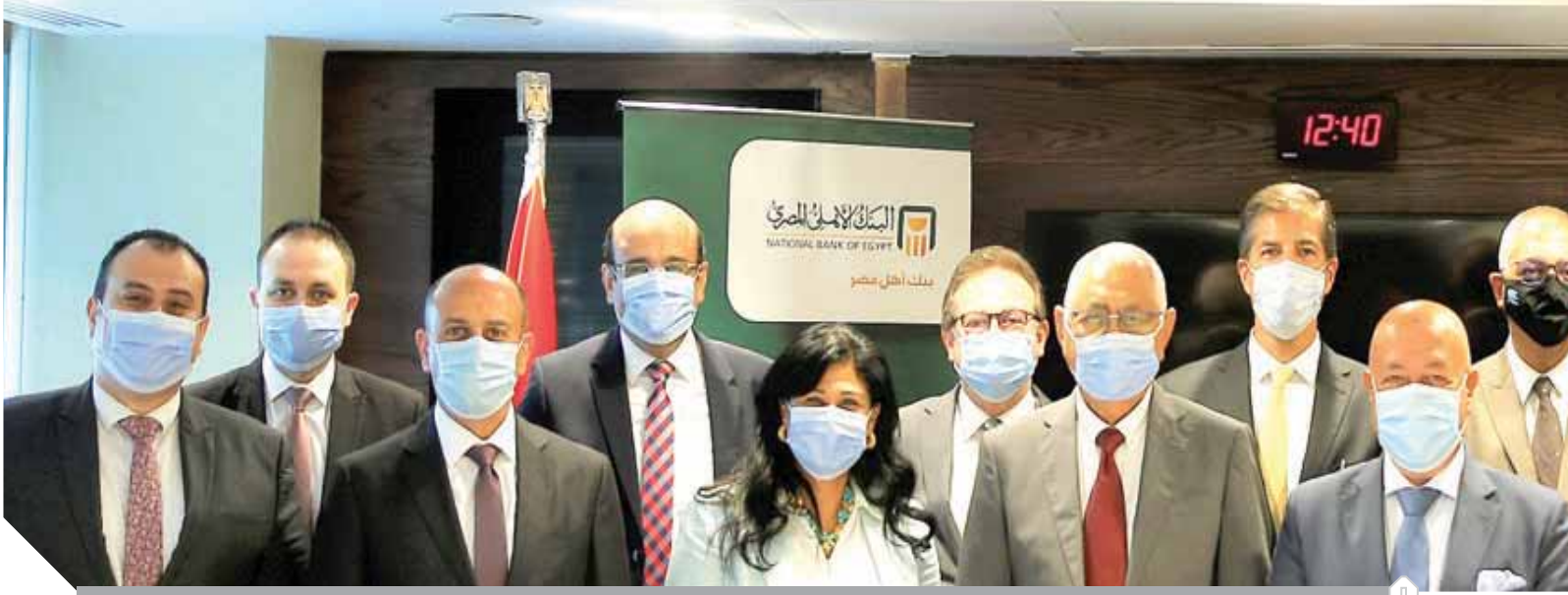
قيادات البنك والشركة بعد توقيع العقد

ومعامل التحاليل، حيث بلغ عدد عملاء الشركة من الصيدليات نحو ٣٠ ألف صيدلية بكافة محافظات مصر في حين بلغت مبيعات مجموعة شركات فارما أفرسيز خلال عام ٢٠١٩ نحو ٨.٢ مليار جنيه، وتهدف الشركة إلى التوسع في نشاطها وتوطيد سبل التعاون مع البنك الأهلي المصري من خلال ترشيح الشركة لتصديقات والمستشفيات والمراكز الطبية ومعامل التحاليل ومراكز الأشعة المطلوب تمويلها بهدف دراسة طلبات التمويل وتقديم الخدمات المصرفية الأخرى على أن تتولى الشركة توفير احتياجات تلك المشروعات من المستحضرات الدوائية ضمانًا لتحقيق أفضل النتائج.