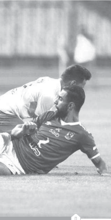
الأشعة تحسم مدة غياب السولية

وانشجرت ثورة غضب فايلر بعد الفوز على المصري بعد أن وجه له أحد الصحفيين تساؤلاً عن استمرار الانتقادات وتراجع الأداء رغم الظروف الصعبة التي يواجهها الفريق، مؤكداً أنه لا يوجد فريق في العالم يفوز دائماً وفي كل مباراة وهذا ليس موجوداً في قاموس كرة القدم.