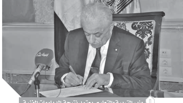
وزير التربية والتعليم يعتمد نتيجة الدبلومات الفنية

وبلغ أعداد الطلاب المتقدمين للامتحان ونسب النجاح بمدراس التعليم الفنى نظام السنوات الثلاث، التعليم التجارى ٢٢٢٢٣٤ بنسبة نجاح ٨٨.٨٨% بانخفاض ٤.٢٨% عن العام الماضى، والتعليم الفندقى ١٥٦٨٠