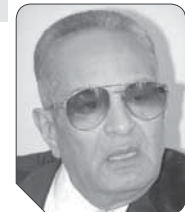
بهاء الدين أبو شقة