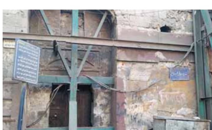
أعمال ترميم مسجد الأمير زين الدين مقبل لا تزال كما هى منذ سنوات

وتابعت: «فى حين أن الحفر غير المشروع والتعدى والتطوير العقارى غير المخطط له قد أضر بالتراث المصرى القديم، ولا سيما فى السنوات الأحدى عشرة الماضية، إلا أن مصر لديها تاريخ طويل من الترميمات المعيبة للآثار الإسلامية، والتي تشمل الهدم وطول الإعمار والإضافات غير التاريخية».