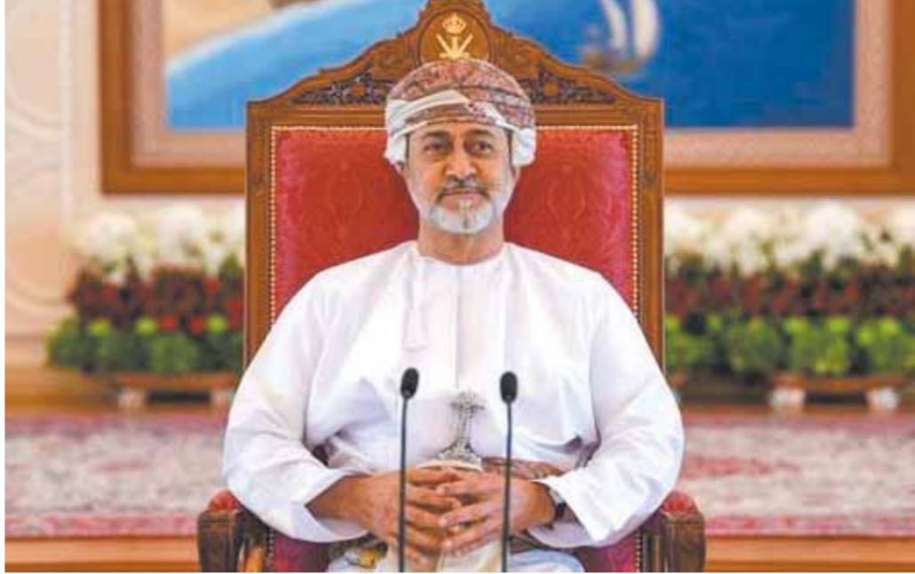
السلطان هيثم بن طارق يحكم عمان «مؤسس النهضة العمانية المتجددة،

وكانت دولة الإمارات من أوائل الدول التي قدمت الإمدادات الطبية إلى موريتانيا لتعزيز تدبيرها مع مكافحة الجائحة، ففي أبريل ٢٠٢٠ تم إرسال ٢ طائرات تحمل على متنها نحو ٣٢,٢ طنا من الإمدادات الطبية، تتضمن لقاحات مضادة لفيروس كورونا وطاقمًا طبيًا لتقديم خبراته وتدعيم قدرات الطواقم الطبية، بالإضافة إلى أجهزة فحص للفيروس، وأجهزة الاختص. تجدر الإشارة إلى أن دولة الإمارات أرسلت حتى اليوم أكثر من ٢٢٠٠ طن من المواد والمستلزمات الطبية إلى أكثر من ١٢٦ دولة.