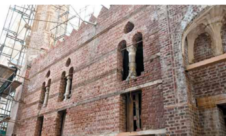
صور أرشيفية لأعمال ترميم مسجد الحلى بالجيزة