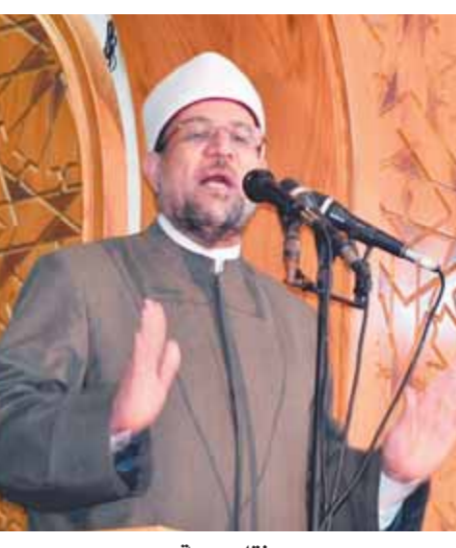
د. مختار جمعة

الى الحق العام وحرصه على استرداد الدولة حق الدولة، كما أوجه التحية لقواتنا المسلحة الباسلة وشرطةنا الوطنية والأجهزة الرقابية فى حفاظهم على المال العام والحق العام واسترداد حقوق الدولة والمجتمع، مختلفًا معاليه بالتاكيد على أن المال العام حق لنا جميعًا وعلينا جميعًا جيشًا وشرطة وقضاة وتفتيشيين وپرلمانيين أن نقتف حجزًا صليًا فى وجه كل من تسول له نفسه الاعتداء على المال العام، وأن الاعتداء على المال العام جريمة شرعية وطنية، ومن سهّل الاعتداء على المال العام فهو والمعتمدى سواء، وأنه يستوى فى تحمل هذا الجرم كل من المعتمدى ومن سهل له الاعتداء، فكل موظف عام أو خاص بغض الطرف أو يسهل الاعتداء على المال العام ، فهو شريك فى جريمة الاعتداء على المال العام ، ولا يمكن لدولة أن تنهض بفساد بين أهلها فواجبنا جميعًا التصدى للفساد ، وهذا ليس واجب رئيس الدولة وحده ولا الحكومة وحدها ولا القضاء وحدهم ، نريد أن نتحول بمواجهة الفساد إلى ثقافة شعب يقف كل إنسان عند حقه ، وقد عظم الإسلام شأن وثواب من يعمل للصالح العام ويعمل على تعظيم المال العام والحفاظ عليه.