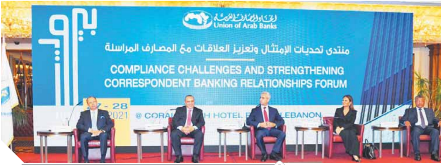
الجلسة الافتتاحية لمنتدى تحديات الامتثال ببيروت

أكد وسام فتوح، الأمين العام لاتحاد المصارف العربية، أن العقوبات الاقتصادية وما يتبعها من تجميد للأصول وتحقيقات مالية وجنائية، باتت تستخدم اليوم كسيف مسلط وسلاح مدمر على دول العالم كله، تلجأ إليه الدول العظمى للدفاع عن مصالحها السياسية والاستراتيجية بدلاً من اللجوء إلى حروب طاحنة تكبدتها خسائر بشرية وأضرار كبيرة، ويساعدها في ذلك إسماها بالمفاصل الأساسية للاقتصاد العالمي. وقال إن عدم الامتثال للقوانين والتشريعات الدولية المرعية والصادرة عن الهيئات الرقابية وخاصة الأمريكية منها والمتعلقة بقوانين مكافحة غسل الأموال وتمويل الإرهاب ومخاربه الفساد ينتج عن ذلك مخاطر سمعة كبرى للدول بشكل عام، والمصارف والمؤسسات المالية بشكل خاص، قد تؤدي إلى قطع علاقاتها مع المصارف المرسلات أو حتى إلى زوالها من الوجود. جاء ذلك خلال افتتاح منتدى «تحديات الامتثال وتعزيز العلاقات مع المصارف المرسلات» الذي عقد ببيروت مؤخراً.