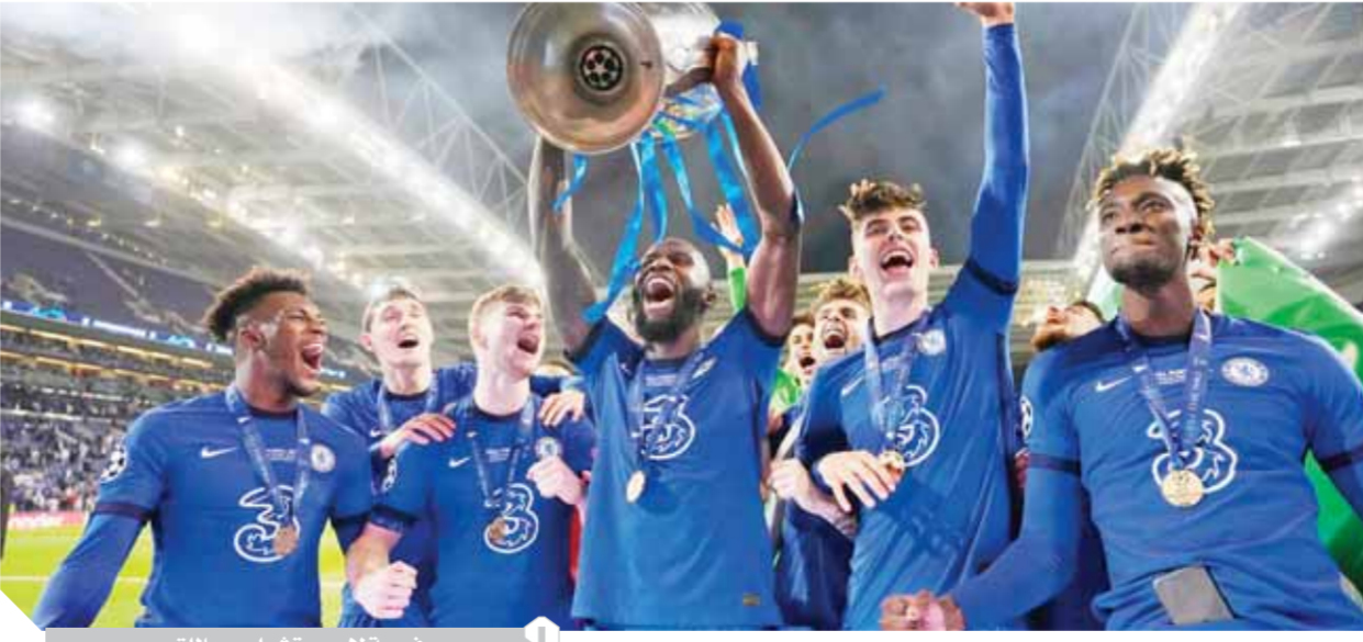
فرحة لاعبي تشيلسى باللقب

ولكن قطعاً المشاعر مختلفة. كنا نشعر بأننا جيدون للغاية، وكنا نتحسن فى كل يوم. كنا نحتاج أن نقطع الجميع خطوة للأمام اليوم، وهذا ما حدث». فى المقابل، قال جوارديولا: «كان موسماً