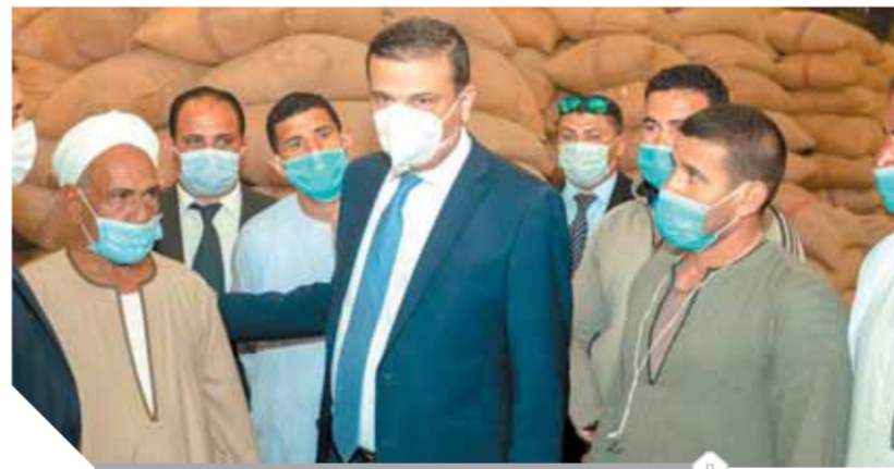
فاروق، خلال متابعة توريد القمح

أكد علاء فاروق، رئيس مجلس إدارة البنك الزراعي المصري، أن حصيلة توريد القمح المحلى للمحلى والشون والسعات التخزينية التابعة للبنك في كافة محافظات الجمهورية بلغت نحو ٥٠٤ آلاف طن قمح بقيمة ٢ مليار و٤٢٥ مليون جنيه منذ بداية الموسم وحتى الآن، متفهماً زيادة كميات الأقمح المستلمة هذا الموسم بالمقارنة بالمواسم الماضية. وأشار «فاروق» إلى أن أعمال توريد القمح المحلى هذا الموسم تسير بشكل جيد وتتحقق نتائج إيجابية بشكل كبير نتيجة للاستعدادات المبكرة لاستقبال موسم توريد القمح وتطبيق منظومة متكاملة جديدة لاستقبال القمح بهدف التيسير على المزارعين والموردين وذلك في إطار سعي البنك الزراعي المصري لمساندة جهود الدولة في استلام محصول القمح الاستراتيجي والحفاظ عليه وفق المواصفات والمعايير التي حددتها وزارة التموين والتجارة الداخلية، ضمن استراتيجية الدولة لزيادة معدلات التوريد من القمح المحلى. وقال رئيس البنك الزراعي المصري إن البنك يقوم هذا الموسم بتطبيق منظومة متكاملة لاستقبال الأقمح يتم إدارتها بالكامل إلكترونياً من خلال توفير مكينات نقاط البيع «POS»، في كافة المواقع التخزينية، يتم خلالها توفير قاعدة بيانات لحظية تشمل على معلومات خاصة بكل مورد والكمية الموردة ودرجة الفرز وغيرها من البيانات التي يتم ربطها بإشادات عرض مترتبة بالمركز الرئيسي والشون وكافة فروع البنك بالمحافظات للاطلاع على الكميات الموردة أولاً بأول لكل شونة ومراقبة الأداء بها، مشيراً إلى أن البنك قام بإنشاء غرفة عمليات خاصة بموسم توريد القمح المحلى لمراقبة وتنظيم عمليات التوريد، كما يشارك البنك في عضوية غرفة العمليات المركزية بوزارة التموين.