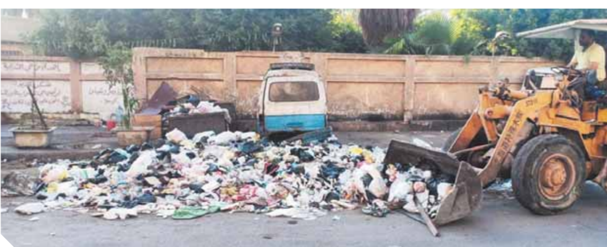
حملات إزالة القمامة من الشوارع لا تكفى