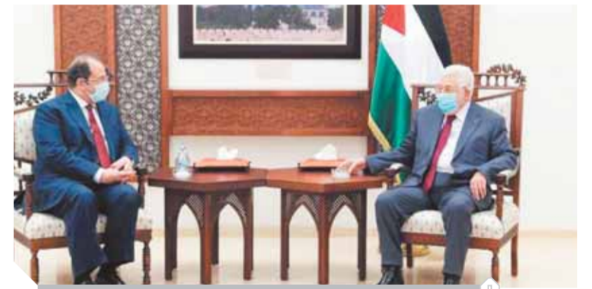
الوزير اللواء عباس كامل خلال لقائه مع الرئيس الفلسطينى

وجه الرئيس السيسي باستمرار الجهود والاجتماعات لحل مشكلة الأسرى والمفقودين بين حركة حماس وإسرائيل. وأوفد الرئيس وفداً أمنياً رفيع المستوى، إلى إسرائيل والأراضي الفلسطينية، لبحث تثبيت وقف إطلاق النار وإعادة الإعمار ومناقشة سبل التوصل لتهدئة شاملة بالصفة الغربية وقطاع غزة. وأجرى الوزير اللواء عباس كامل، رئيس المخابرات العامة، مباحثات مع رئيس الوزراء الإسرائيلى بنيامين نتنياهو والجهات المعنية فى إسرائيل حول تثبيت وقف إطلاق النار والتطورات الأخيرة على الساحة الفلسطينية.