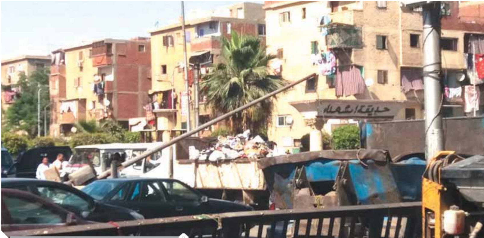
عربة القمامة تقطع الطريق العام