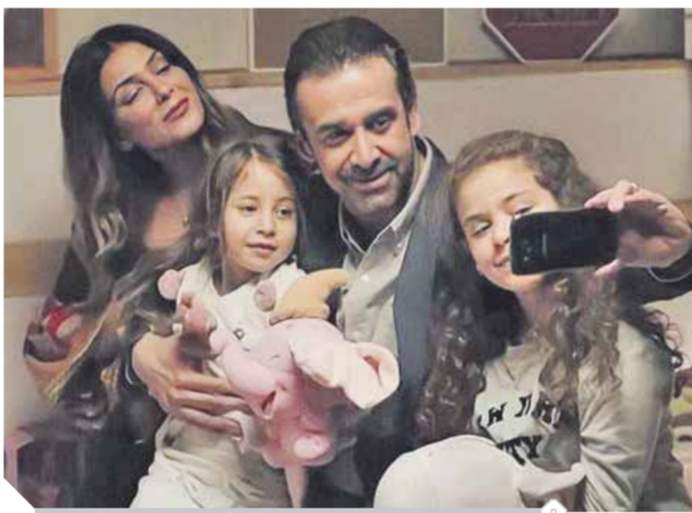
الاختيار ٢، نموذجاً لتعزيز دور المرأة كأم وزوجة وصانعة أبطال

تظهر بشكل مجسد على شاشات التلفزيون، ولكن تميزت مسلسلات هذا العام بجرأة في تناول قضايا الجاسوسية والتخاطر ضد مصر وما يحاك لها من مؤامرات وكان لهذا تناول دور كبير في رفع وعي الجمهور والشباب بما يحاك من مؤامرات ضد مصر، ويعزز الشعور بالانتماء وخاصة الأدوار التي قامت بها المرأة في تلك المسلسلات كأم وزوجة لرجال الشرطة والجيش والأجهزة السيادية. كما أشاد التقرير بأسلوب تناول قضية المرأة والطفلة المعاقة إعاقه خفية والمصابة بمرض ADHD حيث أوجد حالة من الوعي بين فئات المجتمع بوجود هذا المرض وسرعة تشخيصه من الأهل، وأشاد التقرير أيضاً بتناول بعض المشكلات التي تعاني منها المرأة داخل المجتمع وللمرة الأولى تناقش كموضوع الطلاق الشفوي وجرائم الابتزاز الإلكترونية وتدابير جرائم الاعتصاب وسوء متابعة الأبناء في الأسرة، وبالنسبة لنتائج الاستبيان اتضح أن ٧٠٪ ممن أجرى عليهم الاستبيان غير راضيات عن صورتهم التي تقدم في المسلسلات ويطلبن منتجى الدراما بقضايا المرأة الحقيقية الواقعية للمرأة المصرية. وطالب التقرير في نهايته منتجي الدراما بالاهتمام بقصص نجاح السيدات في مسلسلات العام القادم، والتركيز على موضوعات من شأنها تنمية الأسرة وتمكين المرأة المصرية.