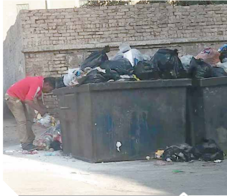
انتشار النباشين في منطقة الزاوية الحمراء

ببعض شركات النظافة يعانون عدم صرف رواتبهم من شهر ١١ لعام ٢٠٢٠، بسبب عدم صرف المستحقات من المحافظة، ومن هنا بدأت مشكلة تراكم القمامة، خاصة بعد الاستغناء عن جامعي القمامة من المنازل والحواري، حيث لجأت المحافظات للشركات الأجنبية غير القادرين على العمل أو التعامل مع المواطنين في جمع القمامة، وهناك شبهة محسوسات لحصول الشركات الأجنبية على توقيع عقد جمع القمامة من المحافظات، مؤكداً أن قانون الحليات والمحافظة هما المقبة الوحيدة في حياة المواطن المصري، بالإضافة إلى أن هناك