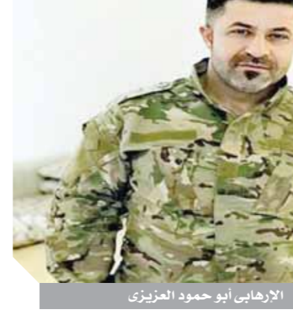
الإرهابى أبو حمود الميزرى

نجح الجيش الوطنى الليبى فى توجيه ضربة موجعة إلى الميليشيات الإرهابية التابعة للنظام التركى فى ليبيا، بعد مقتل أحد أكبر القادة الموالين لأنقرة وحكومة الوفاق.