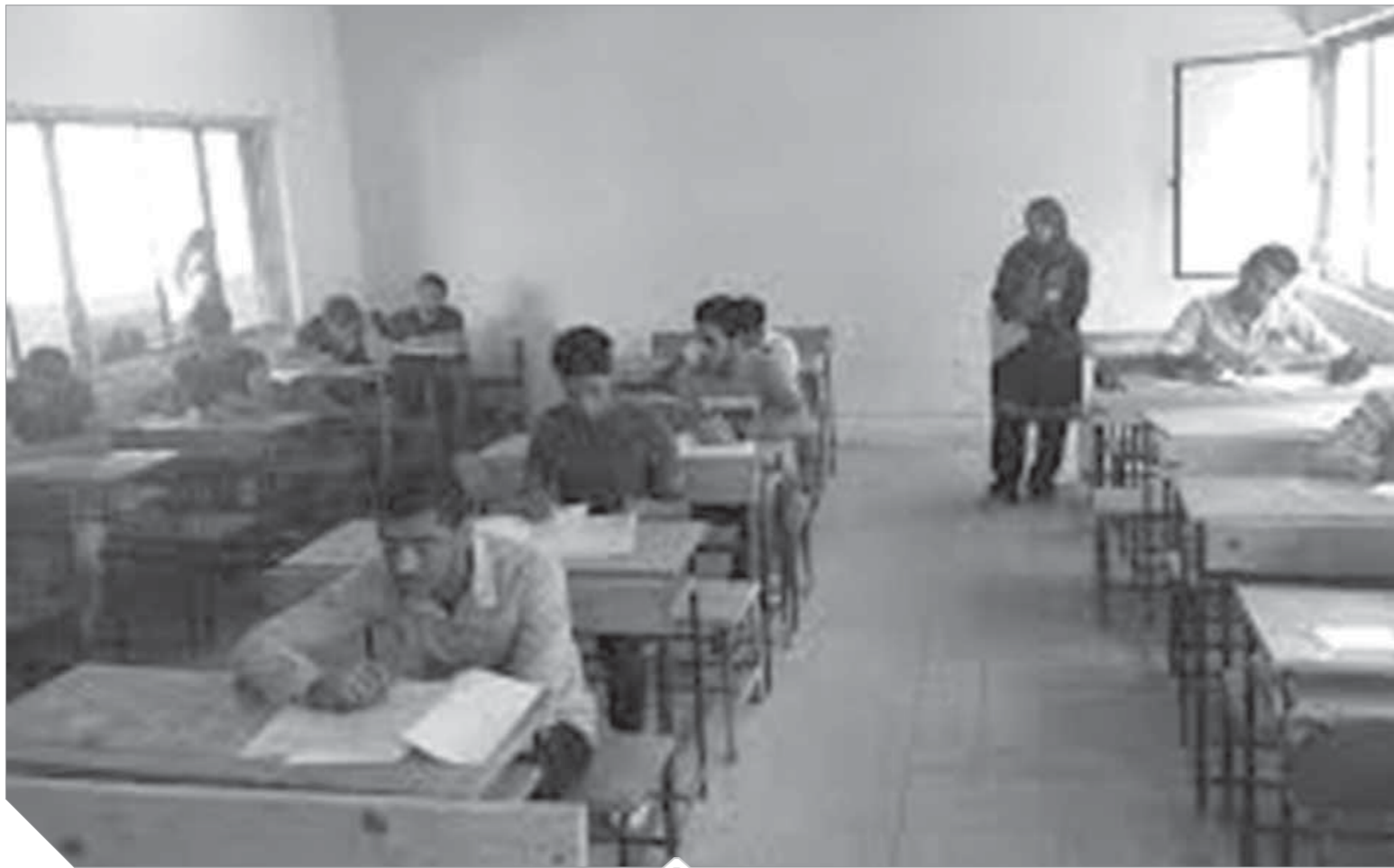
الهدوء والتركيز أهم عوامل النجاح