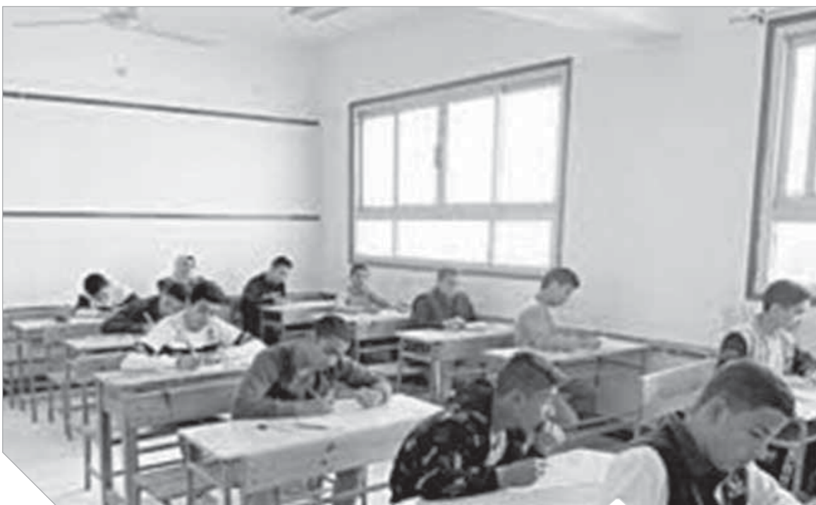
إجراءات احترازية وتباعد اجتماعي داخل اللجان في الامتحانات المقبلة