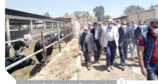
وزير الزراعة خلال زيارته لكفر الشيخ