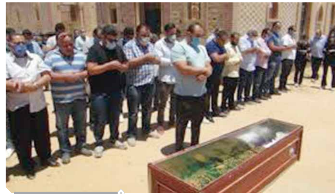
صلاة الجنازة على فقيد الفن حسن حسنى