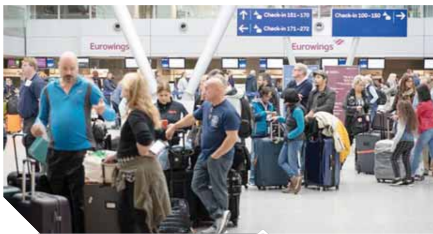
المطارات العالمية تستعد لعودة حركة الركاب

التنفيذ لشركة اريان إير مايكل أوليري أن الجدول العادي للرحلات الجوية التجارية لن يعود حتى ١٧ يونيو. وكذلك تعمل حكومة قبرص على إعادة حركة الطيران بالمطارات بجدول زمني كامله بعد ٩ يونيو، اعتماداً على كيفية انتشار الوباء محلياً وفي الخارج، وتحاول السلطات وضع خطط لإعادة المصطافين إلى قبرص بأمان، حيث تمثل السياحة ١٢٪ من الناتج المحلي الإجمالي.