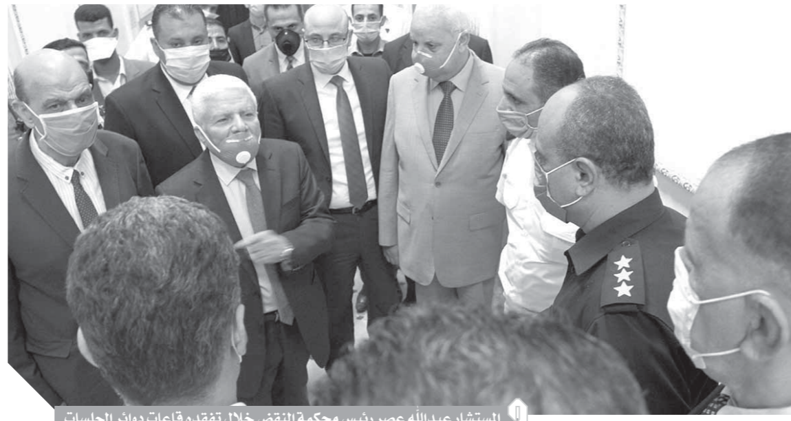
المستشار عبدالله عصر رئيس محكمة النقض خلال تفقده قاعات دوائر الجلسات

وتابع رئيس المحكمة سير العمل في الأقسام الإدارية، وأطلع على سير العمل في مركز المعلومات القضائية لتسهيل المهمة على المتقاضين. وشملت الإجراءات الاحترازية والوقائية قبل وأثناء العمل في المحكمة، تعقيم المبنى وقاعات الجلسات