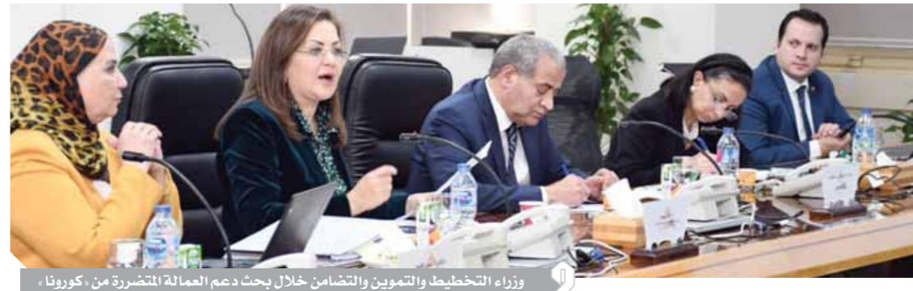
وزراء التخطيط والتموين والتضامن خلال بحث دعم العمالة المتضررة من كورونا