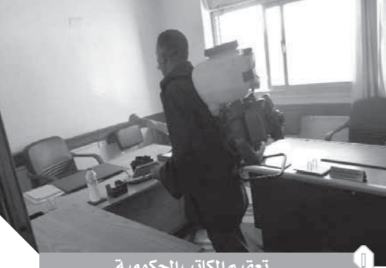
تعميم المكاتب الحكومية