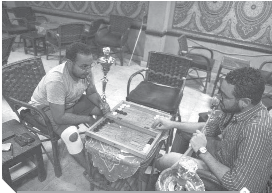
مخالفات قرارات غلق المقاهى يعرض الجميع للخطر