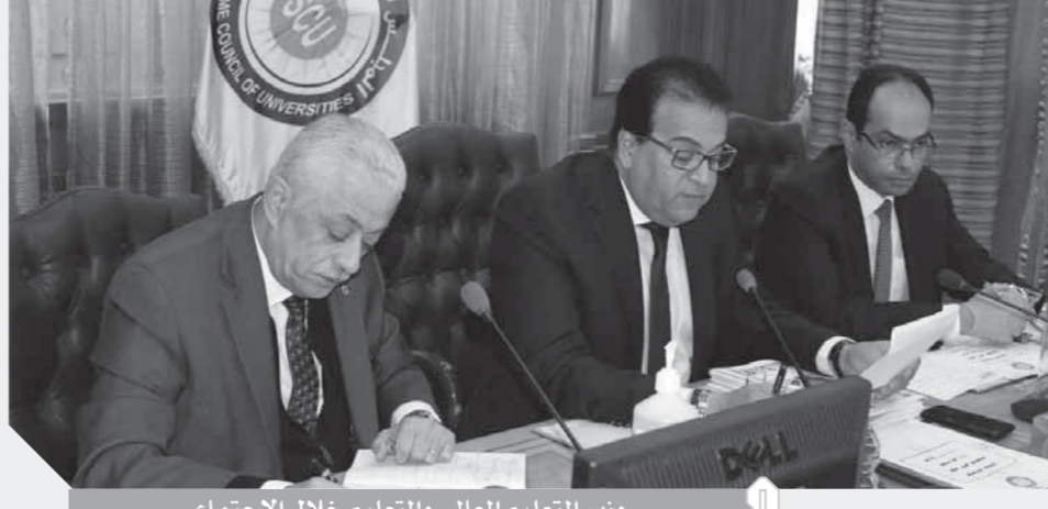
وزير التعليم العالى والتعليم خلال الاجتماع

وشدد رؤساء الجامعات على أن فترة تعليق الدراسة ليس مقصود بها إجازة دراسية، وضرورة الالتزام فى متابعة المحاضرات أون لاين من خلال المنصات التي أتاحتها الجامعة وتم الإعلان عنها لمتابعة المواد الدراسية.