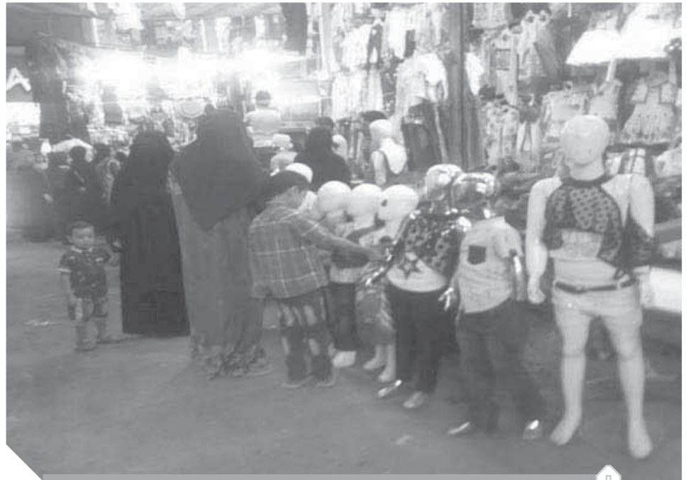
الزحام خطر وتحاليل على إجراءات الحماية