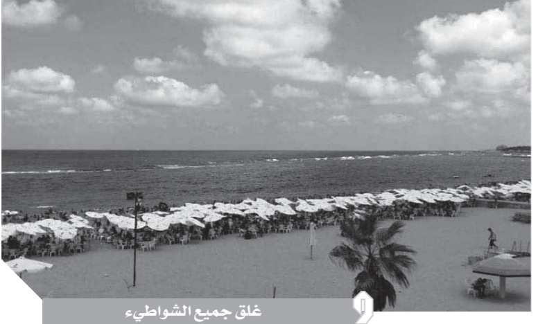
خلق جميع الشواطئ

من جانبه، أوضح اللواء جمال رشاد، أنه تم التواصل مع بعض الأسر المتواجدة على الشواطئ للاستفسار عن أسباب تواجدهم حيث أعربوا أنهم يتواجدون على الشواطئ كنوع من التنقيص في ظل الظروف الحالية. وأكد أنه تم التوعية والتثبية على جميع المتواجدين بالشواطئ بحظورة التجمعات أبأ كان موقعها. وقد تفهم الجمهور ودواعي ذلك وغلق الشواطئ. وكانت الإسكندرية قد اتخذت عدة قرارات ضمن الإجراءات الاحترازية للحد من انتشار فيروس كورونا، حيث تم تنفيذ كافة تعليمات رئاسة الوزراء من تخفيض عدد العمال بدوان المحافظة والأحياء، وتطبيق الإجراءات الوقائية من التعقيم والتطهير لها، وتكثيف الأحياء لحملات ضبط المخالفين لقرار الغلق ومواصلة غلق المراكز التعليمية والحضانات وصلات الجيم ومحلات الألعاب الإلكترونية، وتم غلق أكثر من ٩٠٠ منشأة متنوعة إلى الآن، منع الحمام، بالإضافة إلى تكثيف الحملات بالأحياء لمنع تجمعات الأسواق اليومية. كما تم إصدار تعليمات مشددة بالتواجد المبداي والمتابعة اللحظية للأحياء، وتكثيف الحملات على المقاهي والكافتريات لمنع تدخين الشيشة، وتم غلق المقاهي المخالفة بالشمع الأحمر، وتوقيع عقوبة مالية فورية على مخالفين قرار الغلق تصل إلى ١٠ آلاف جنيه، متتابعة أعمال رفع القمامة ومدارمة أعمال تطهير صناديق القمامة والحوايات ومراكز تجميع القمامة على مستوى الأحياء.