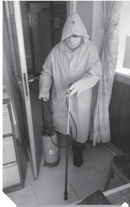
تطهير المنشآت الحكومية