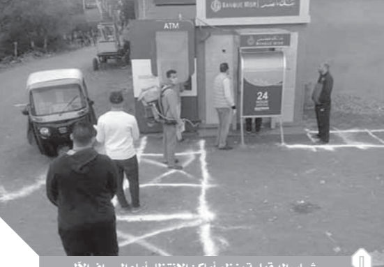
شباب الدقهلية ينظم أماكن الانتظار أمام الصراف الآلي