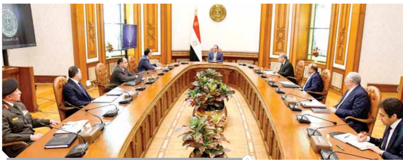
الرئيس خلال لقائه مع مديولى وعدد من الوزراء