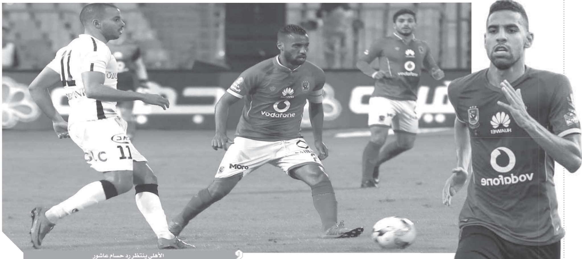
الأهلى ينتظر رد حسام عاشور