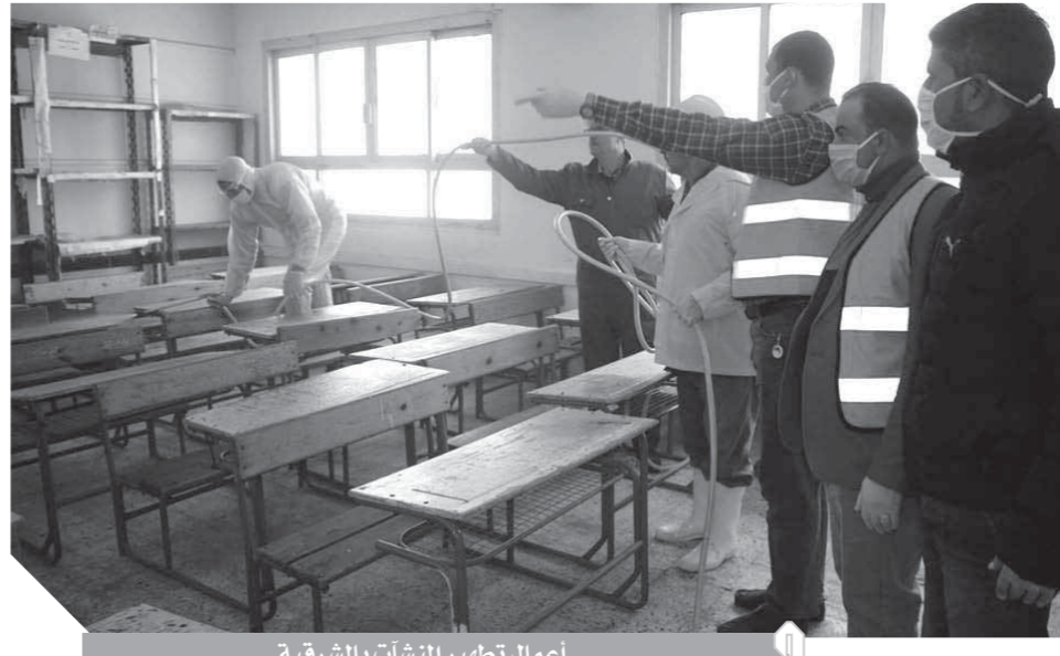
أعمال تطهير المنشآت بالشرقية

قامت الأجهزة التنفيذية بالمحافظات بإطلاق العديد من الخدمات للمواطنين على مدار الأيام الماضية، منذ إعلان مجلس الوزراء فرض حظر التجوال داخل البلاد، وكان على رأس الخدمات المقدمة تسهيل وتيسير أعمال الخدمات المقدمة داخل المديرية المختلفة للجمهور من خلال شبكة الإنترنت وكذا استمرار أعمال التطهير للمنشآت العامة والحيوية والشوارع والميادين الرئيسية. وأيضاً تعاون الجهات المعنية مع مؤسسات المجتمع المدني من توجيه قوافل طبية للكشف على المواطنين داخل المنازل وكذا إنشاء مظلات وإستراحات أمام ماكينات الصراف الآلي