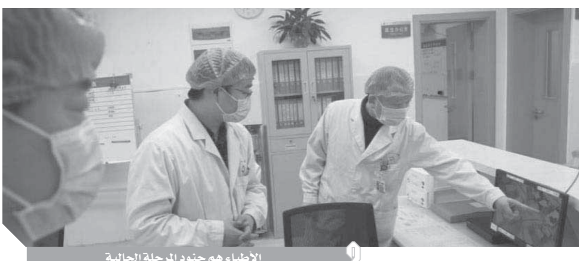
الاطباء هم جنود المرحلة الحالية

للفيروس، فقد حصد كورونا حياة ٤٦ شخصاً طبيياً، وفق بيان رسمي نشرته وكالة أنباء أسسا الحكومية، السبت الماضي. كما سجلت فرنسا ٥ ضحايا من الأطباء بسبب فيروس كورونا.