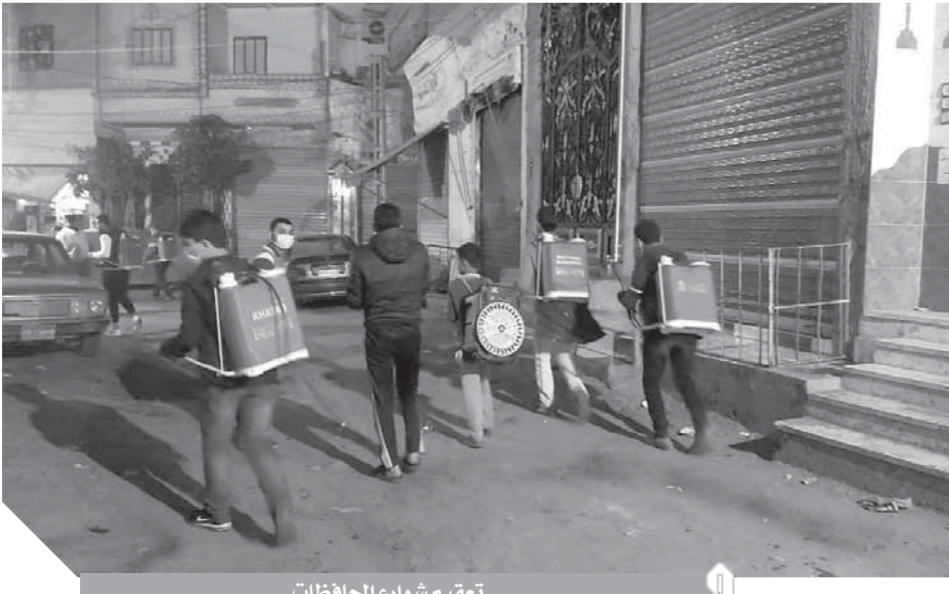
تعميم شوارع الحياضات