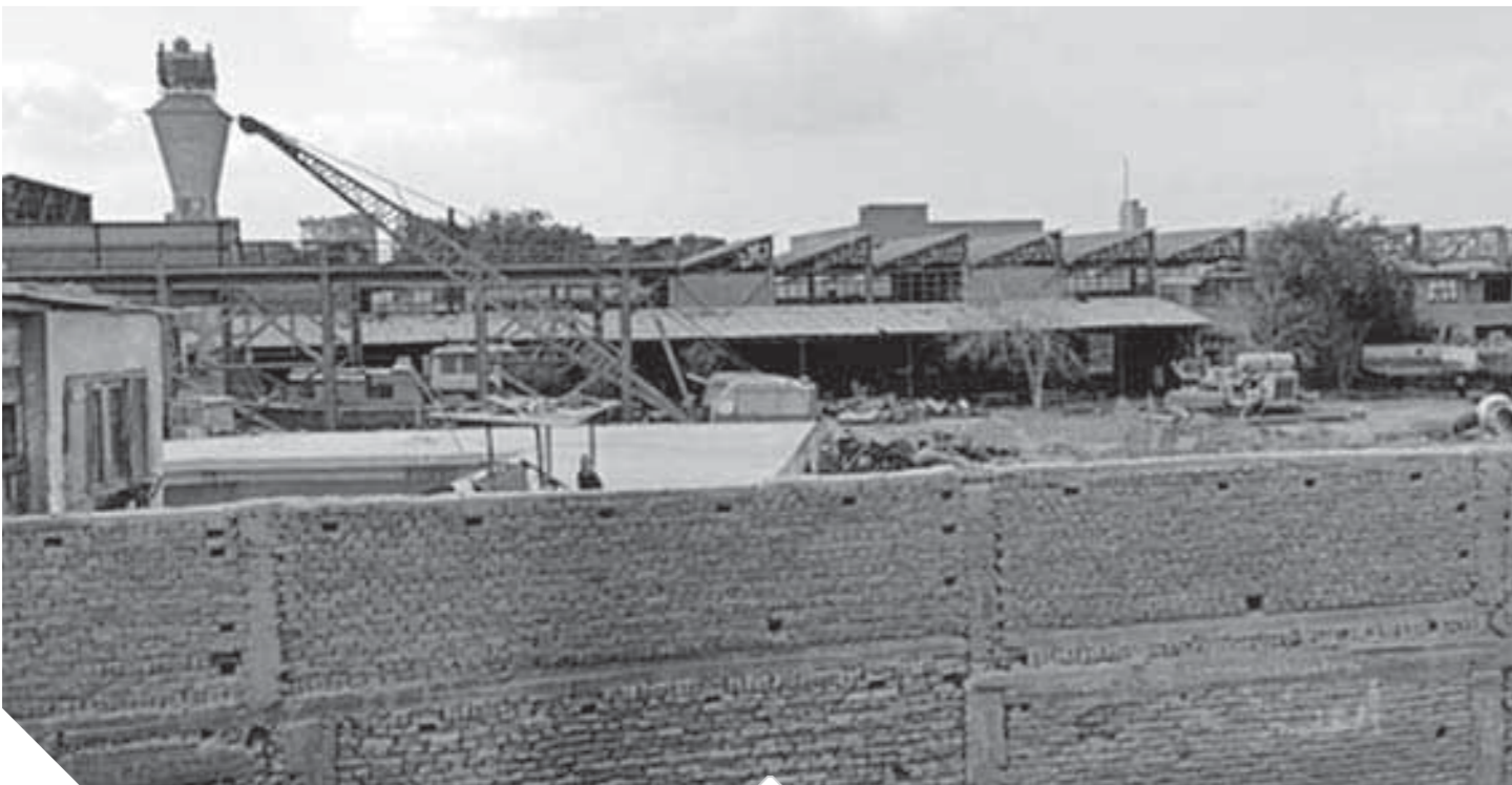
مصنع الشركة الأهلية للحديد والصلب ثروة قومية دمرها الإهمال

في الوقت التي تبحث فيه الدولة عن سبيل لتطوير الصناعات الثقيلة في مصر يقف مصنع أبوزعبل للصلب وإن صح التعبير مثل خيال مائة يسكنه الكلاب والقطط وتعشش فيه اليوم والغربان ويتعرض للسراقات، بالإضافة إلى الصدا الذي تراكم على معدات يتعدى ثمنها النصف مليار جنيه وقيمة الأرض المقام عليها تتعدى المليار جنيه بمساحة تصل إلى ١٠٦ مبانى مدينة كاملة.