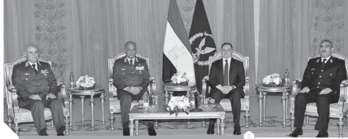
وزير الدفاع ورئيس الأركان يتقدمان التهنية لوزير الداخلية بمناسبة عيد الشرطة

استقبل محمود توفيق وزير الداخلية، أمس، بمقر وزارة الداخلية، الفريق أول محمد زكى القائد العام للقوات المسلحة وزير الدفاع والإنتاج الحربى، والفريق محمد فريد رئيس أركان حرب القوات المسلحة ووفداً من كبار قادة القوات المسلحة لتقديم التهنة لهيئة الشرطة بمناسبة الاحتفال السنوى بعيد الشرطة. فى بداية اللقاء أشار الفريق أول محمد زكى القائد العام للقوات المسلحة وزير الدفاع والإنتاج الحربى إلى أن بطولات رجال الشرطة فى معركة الإسماعيلية تؤكد أنهم رجال أعلا بمسودهم أمام المعتدى قيم العزة والكرامة والفاء، وأن الاحتفال بتلك الذكرى الوطنية الخالدة يبرهن أنه فى تاريخ الأمم مراحل فارقة وفى حياة الرجال لحظات حاسمة، واليوم تظل القيم على ثباتها وتتجدد طاقات العمل والعطاء لتبقى مصر على مر الزمان وطناً عزيزاً، ويظل شعبها وجيشها وشرطةها يذن الله تعالى فى رباط إلى يوم الدين، معبداً عن تقديره ورجال القوات المسلحة للدور الوطنى الذى تضطلع به هيئة الشرطة فى تأمين الجبهة الداخلية وبذل كل غال ونفيس فى سبيل الإسهام الجاد والمتواصل