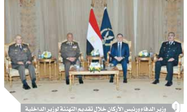
وزير الدفاع ورئيس الأركان خلال تقديم التهنية لوزير الداخلية