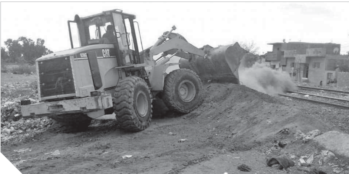
جانب من إزالة الطرق العشوائية من فوق خطوط السكك الحديدية

وتم الإعلان عن طرحه في مزاد واشتره مستثمر إماراتي بجهة تطويره وبلغ سعره في المزاد ٤٦٠ مليون جنيه إلا أن المستثمر تضرر في السداد وانهار المصنع وأغلق أبوابه بعد أن تساقمت المشاكل بسبب سوء الإدارة. عام ٢٠١٤ وافق المهندس إبراهيم محلّب، رئيس مجلس الوزراء وقتها على الطلب المقدم من محمود بدر وكيل مؤسسى حزب الحركة الشعبية العربية «تصد»، والخاص