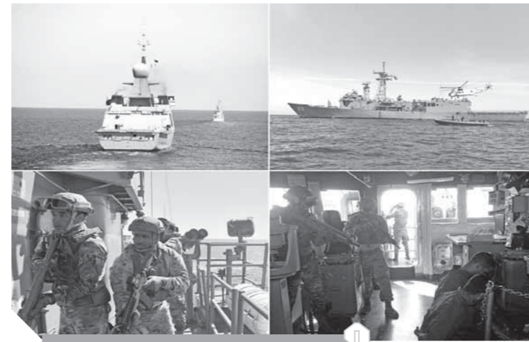
جانب من التدريب البحرى المصرى السعودى

وأظهرت مدى قدرتها على اتخاذ أوضاعها بدقة وسرعة عالية. كما نفذت القطع البحرية المشاركة تدريباً للرمية بالذخيرة الحية لصد وتدمير الأهداف السطحية المعادية، وتأمين الوحدات البحرية ضد الأهداف الجوية المعادية كما تم التدريب على الإمداد والتزود بالوقود بالبحر وإجراء بيانات عملية على تعرض الوحدات البحرية للتهديدات غير التمهية. كما نفذت عناصر القوات الخاصة للبحرية المصرية والبحرية السعودية بياناً عملياً لأعمال حق الزيارة والتفتيش والاقترام الرأسى والأفضى كما تم التدريب على الإغارة على إحدى الجزر المعادية المجهزة بالمنوع والسيطرة عليها. حضر المرحلة الرئيسية للتدريب عدد من قادة القوات المسلحة المصرية والسعودية.