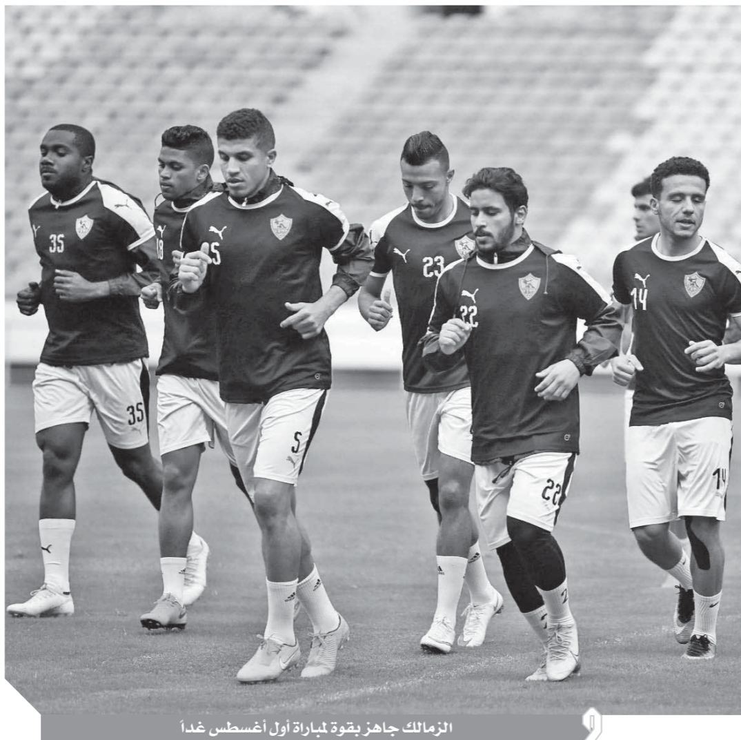
الزمالك جاهز بقوة لمباراة أول أغسطس غداً

أطالب وزير الرياضة بعدم تعيين لجنة من الأسماء الحالية التي لا ترغب في صالح اللعبة ومشغلة بالحروب الشخصية بعد أن أكد الوزير في أكثر من تصريح أنه لن يطبق غير القانون، ولن يتستر على أحد ما يؤكد أن هناك الاتحاد ومستقلين سوف تتم إحلتهم للنيابة العامة وأعتقد أن البعض إذا لم يسد ما عليه سوف يطبق عليه القانون، ولن يتنع فيها أنا باشا أو أستاذ أو دكتور.