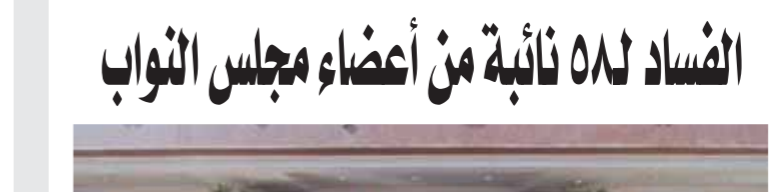
اختتام فعاليات البرنامج التدريبي في مكافحة الفساد 58 نائبة من أعضاء مجلس النواب