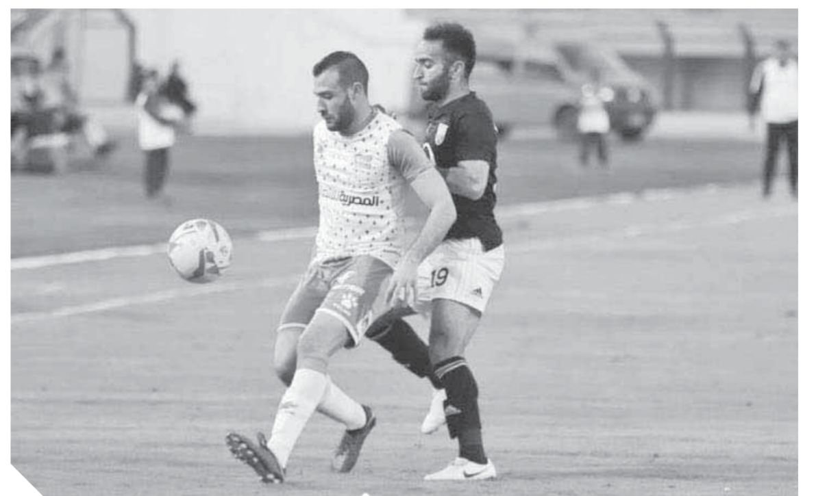
المصري سقط أمام الجونة في الجولة الـ ١٠ للدوري