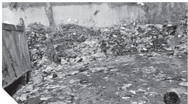
شارع السوق القديم بالبايجور تحول إلى مقلب قمامة