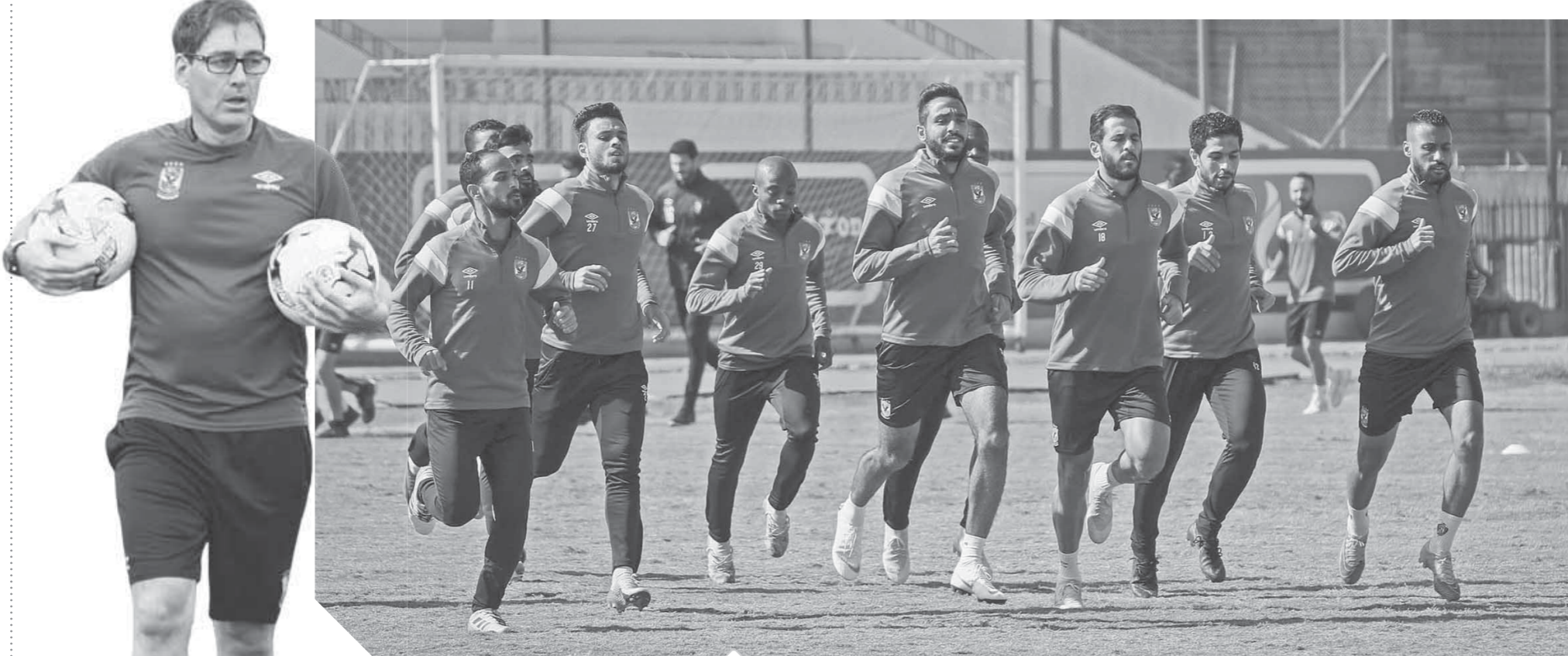
الأهلي جاهز لمواجهة الهلال