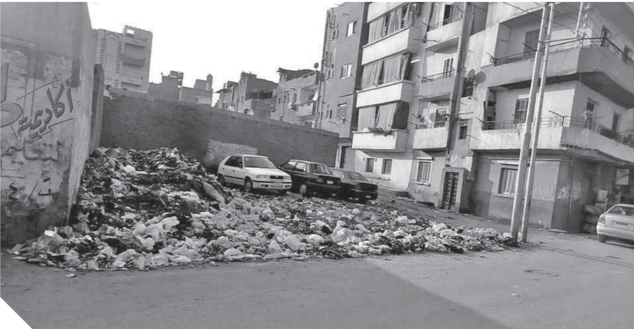
أكوام القمامة تحاصر شوارع الدقهلية

وأكد محمد نصر من أبناء مدينة المنصورة، على إرسال العديد من الشكاوى والاستغاثات إلى غرب المنصورة بسبب انتشار القمامة ولكن لا حياة لمن تنادى. ويعيش محمود الشيخ، من أبناء مركز أجا، أن تراكم القمامة والنفايات الطبية بالشوارع يهدد بانتشار الأمراض والأوبئة بسبب انتشار الحشرات الناقلة للأمراض. وطالب المواطنين الدكتور مصطفى مديولى رئيس مجلس الوزراء والدكتور أمين مختار محافظ الدقهلية بضرورة التدخل العاجل لإنقاذ أهالى مدن وقرى الدقهلية من الأمراض والأوبئة التى تهددهم بسبب تراكم أكوام القمامة بمحافظة الدقهلية.