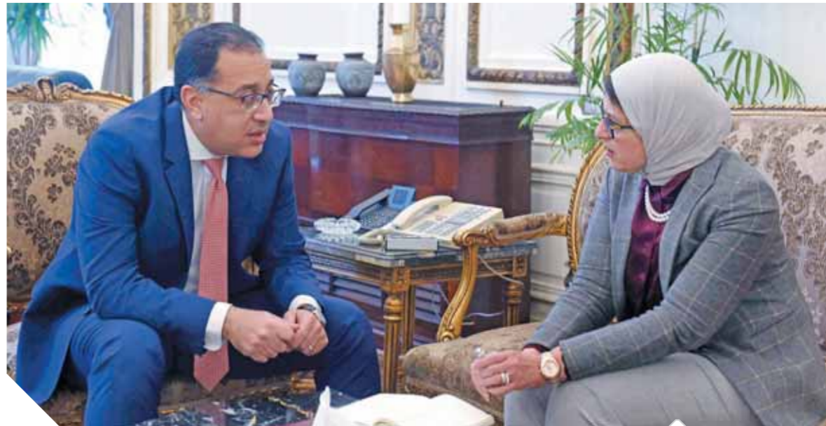
رئيس الوزراء يبحث مع وزيرة الصحة الاستعداد لمواجهة كورونا