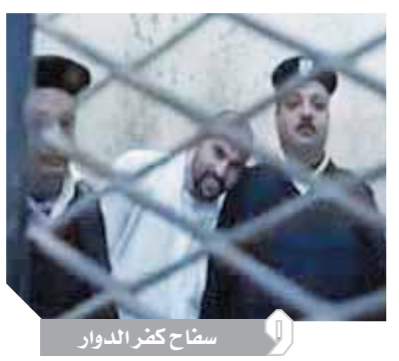
سفاح كفر الدوار