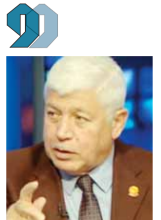
الواء نصر سالم

وأكد اللواء نصر سالم، رئيس جهاز الاستطلاع المصري سابقاً، أن ما تفعله قوات الاحتلال الإسرائيلي من استهداف المدنيين والأطفال والعزل والطواقم الطبية هو نهج استعماري من أجل بث الرعب والخوف وتكدير المزاج الديموجرافي لأهالي غزة، ليجرم على ترك منازلهم وترك قطاع غزة.