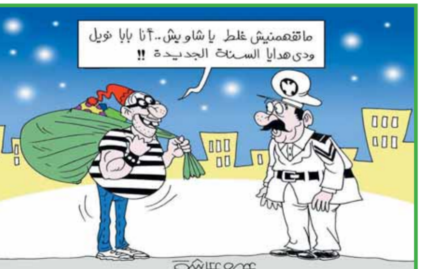
ما تقهمنيش غلط يا شاويش.. آنا بابا نويل ودي هدايا السنك الجديدة !!

كتب - هدير وجلي: صدر عن الهيئة العامة لتقصير الثقافة برئاسة عمرو البسيوني، العدد الجديد من الإصدار الإلكتروني لجريدة «مصرنا»، ٨٥٢، ونقرأ في المتابعات والأخبار تقريراً خبرياً لهتم مصطلحي عن عرض «الحلم نور» مشروع تخرج الفرقة الرابعة لمسرح التربية بالزقازيق، ويكتب رنا رأفت عن كتاب «مواطن في قاعة المسرح» للكاتب والشاعر يسرى حسان والذي يصدر قريباً عن المجلس الأعلى للثقافة، ويكتب همت مصطلحي عدة تقارير ومتابعات عن عرض «توبيا» للمخرجة كريمة بدير في ليلة منفردة على مسرح سيد درويش بالإسكندرية، ويصدر مجموعة مسرحيات «المملكة والشملك» للكاتب والناقد إبراهيم الحسيني عن الهيئة العربية للمسرح، ونتائج المسابقة المسرحية للشباب الطلابي بجامعة المنصورة. وفي قسم الحوارات والتحقيقات يستهل بتحقيق أجرته روفية خليفة مع الحاصلين على جوائز مهرجان شرم الشيخ للمسرح الشبابي، وتحوار إيناس العيسوي الباحث والناقد. د. عمرو دوار بعد حصوله على درج سميحة أيوب من مهرجان شرم الشيخ، وفي قسم رؤى يكتب جمال الشفاوي «هيبين» عن اللحمة الشعرية للإبادة، ويكتب د. محمود كحيلة عن أطفال التربية الخاصة بالتعليم المصري يقدمون هطولة وحيلة القاضي، ويكتب د. وهام كمالو عن «الغامرة»