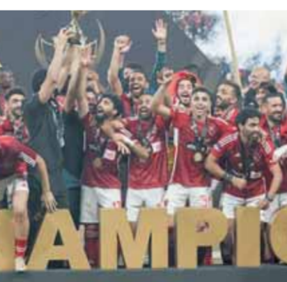
لاعبو الأهلي يحتفلون بكأس السوبر

الأهلي يصرف مكافآت السوبر.. و«الخطيب» يجتمع مع «كولر» لحسم الصفقات