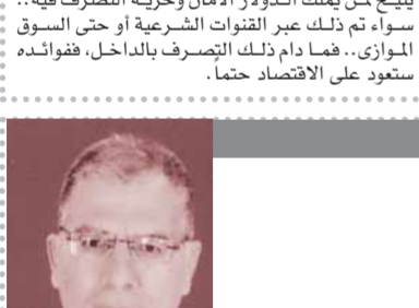
د. مصطفى محمود