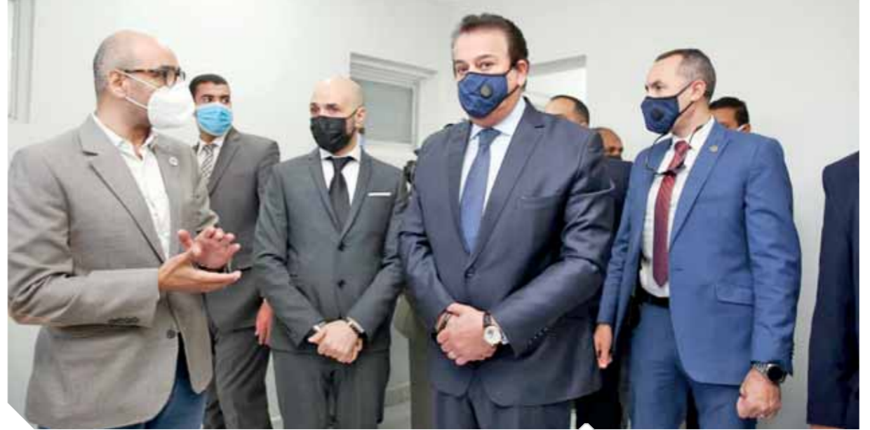
وزير التعليم العالي والي جواره الدكتور خالد الطوخى