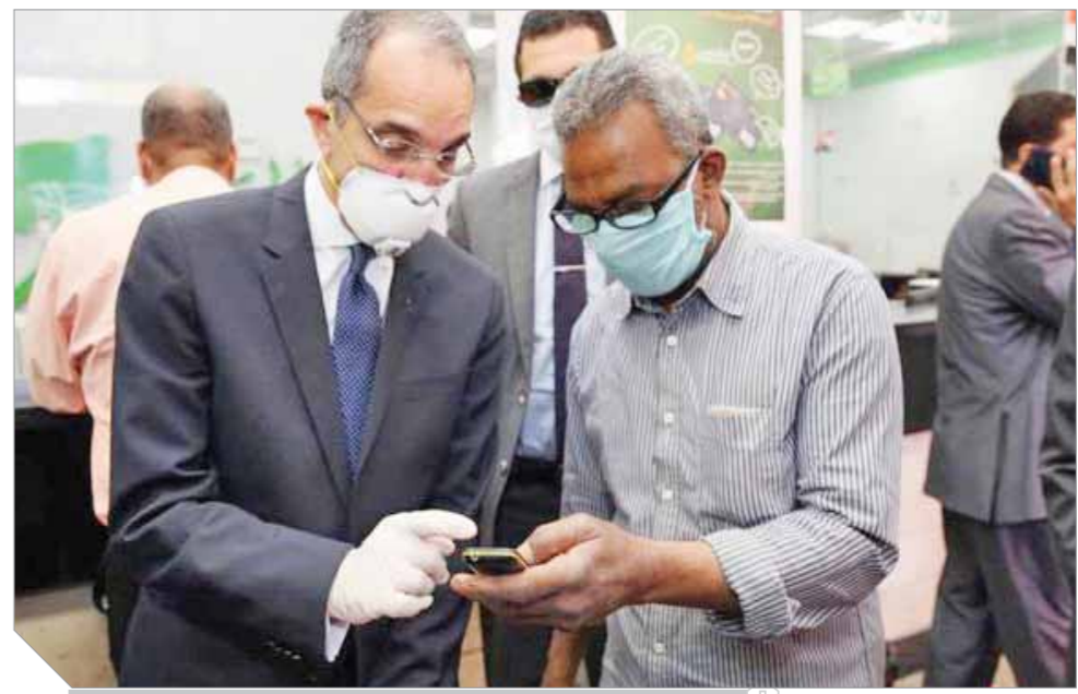
وزير الاتصالات يتابع مع أحد المواطنين أثناء تفقده مكاتب البريد