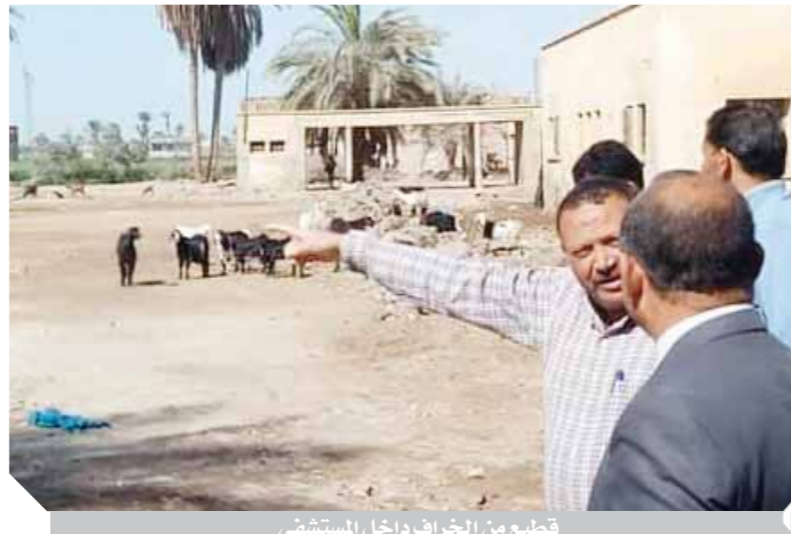
قسط من الخراف داخل المستشفى