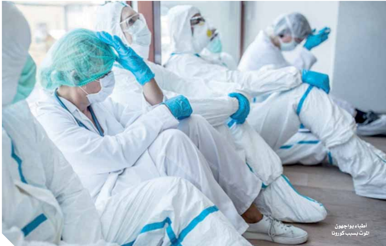
أطباء يواجهون الموت بسبب كورونا

إننا في معركة شرسة ضد هذا الوباء ونحتاج أن نكون جميعاً على قلب رجل واحد، وأن نتخذ من الإجراءات الوقائية ما يلزم لحماية أنفسنا وغيرنا، ربنا أفرغ علينا صبراً لمواجهة هذا الوباء وثبت أقدامنا، ربنا ارفع الغمة عن الأمة.