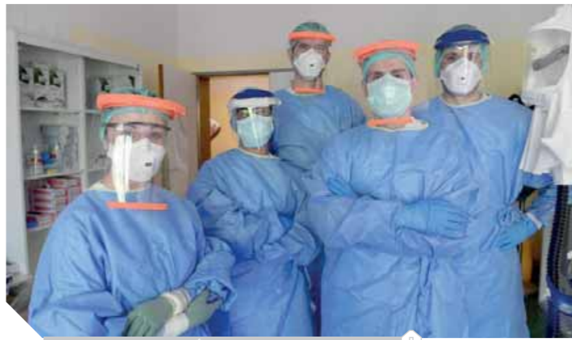
جيش مصر الأبيض

٥٠ مليوناً وأكثر من المصابين بكورونا في العالم