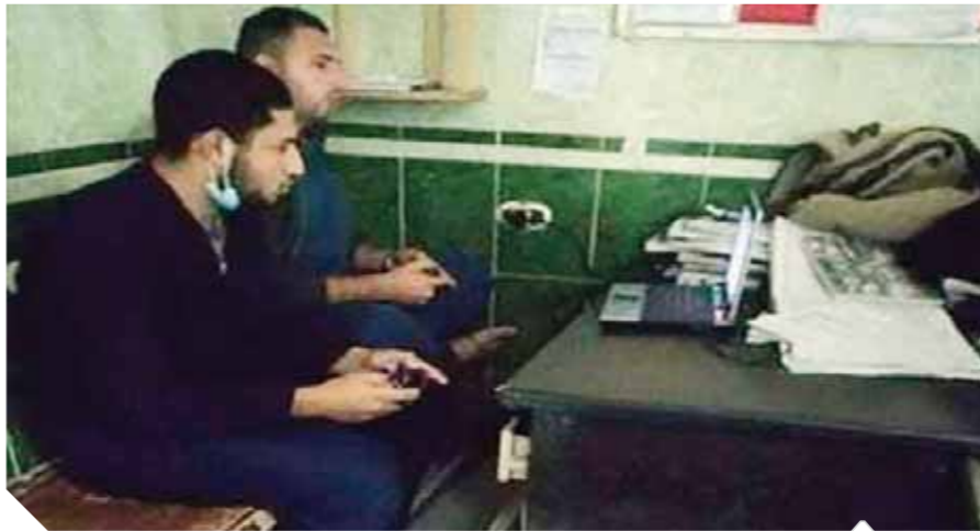
الموظفان أثناء العيب داخل المستشفى العام

وعلق أحد رواد موقع التواصل الاجتماعى فيس بوك على الصورة التي تجمع الاثنين قائلًا: «تجربتي لمستشفى الحمودية لإنهاء إجراءات غسل وتكفين والد صدقني المتوفى بفيروس كورونا، بصحة المتبرع بالغسل والتكفين تقسم الاستقبال للاستفسار عن عامل المشرحة ففوجئت بهما تاركين العمل ويلعبان ببلاى ستيش».. نون مراعاة لندوى الحالات المرضية المتردة على المستشفى أو شعور أهالي المتوفين بفيروس كورونا، خاصة أن المستشفى يشهد يوميًا استقبال حالات إصابة ووفاة بفيروس كورونا.