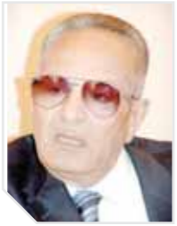
بهاء الدين أبو شقة