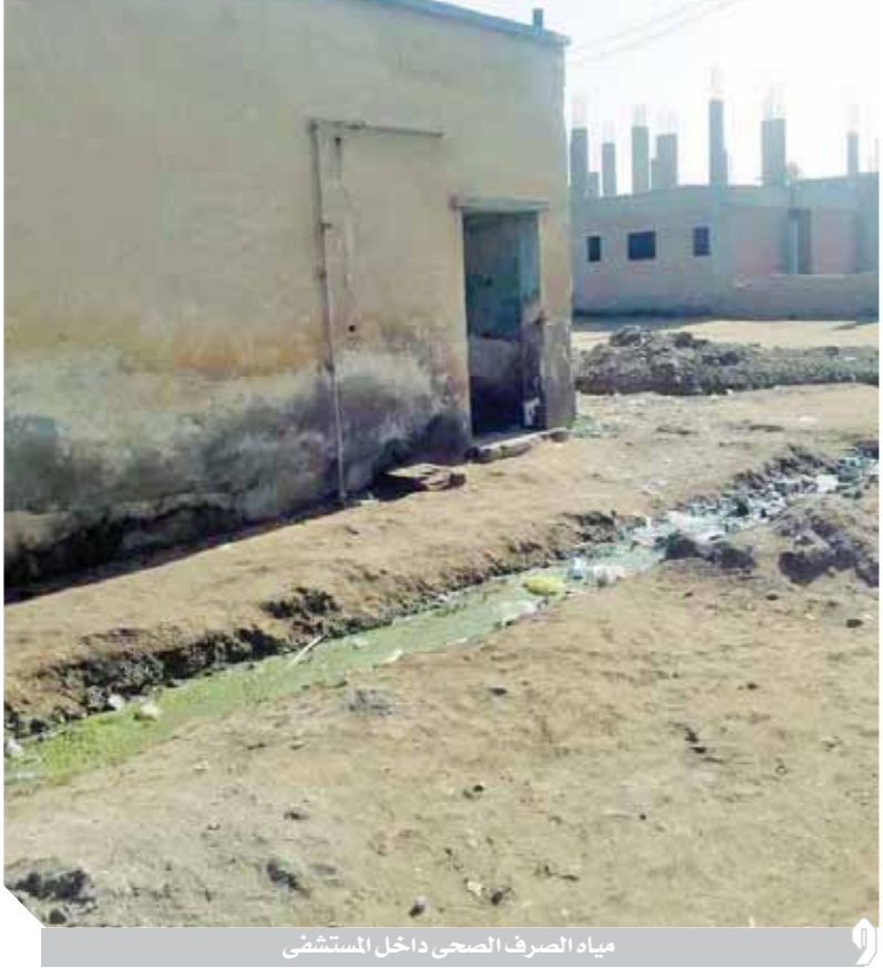
مياه الصرف الصحي داخل المستشفى