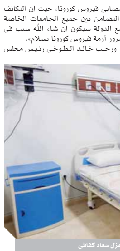
جانب من دار عزل سعاد كفاي