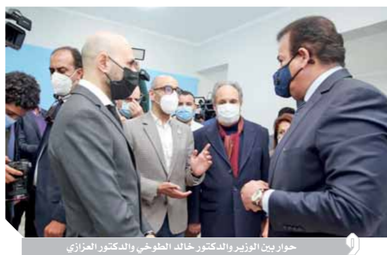
حوار بين الوزير والدكتور خالد الطوخى والدكتور العزازي

أمناء جامعة مصر للعلوم والتكنولوجيا، بالدكتور خالد عبدالغفار، وزير التعليم العالي، والدكتور حسام عبدالغفار، أمين عام المستشفيات الجامعية، قائلاً: «أهلاً بكم في بيتكم»، وأردف: «الذين حضروا معنا الافتتاح منذ ٥ أشهر يعلم أن الفكرة قامت على هدف مشترك الجامعة للدولة، من أجل المساهمة في علاج مرضى فيروس كورونا، وبمجرد العرض على وزير التعليم العالي وافق مباشرة والآن نحن في حاجة لهذا الدار خاصة مع ارتفاع عدد الإصابات بفيروس كورونا بين المواطنين».