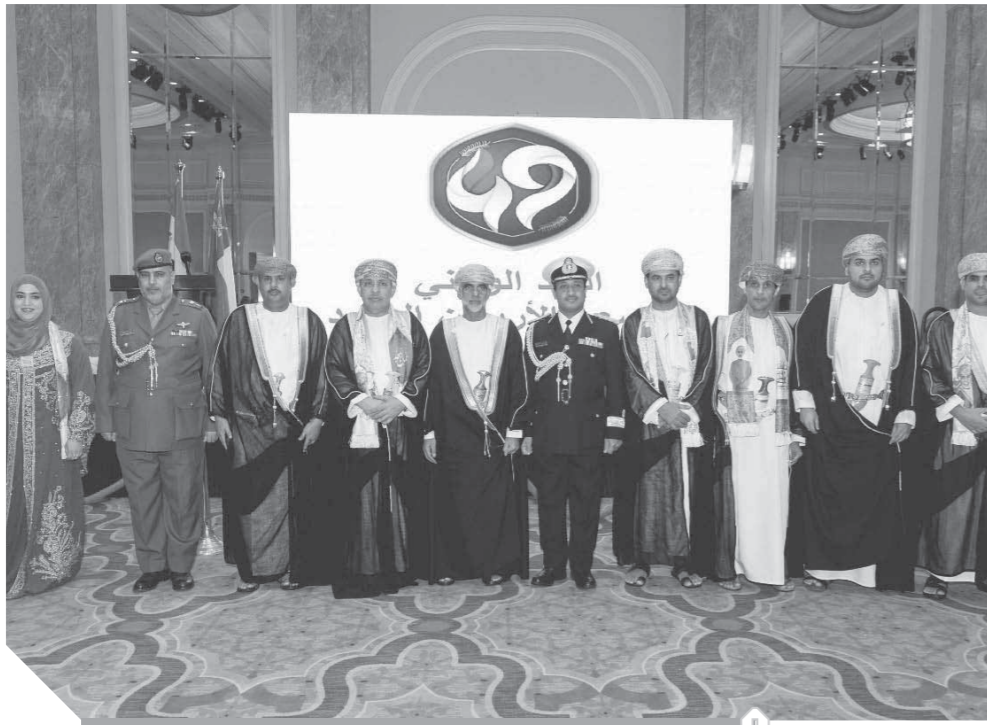
مشاهد من حفل الاستقبال على نيل القاهرة