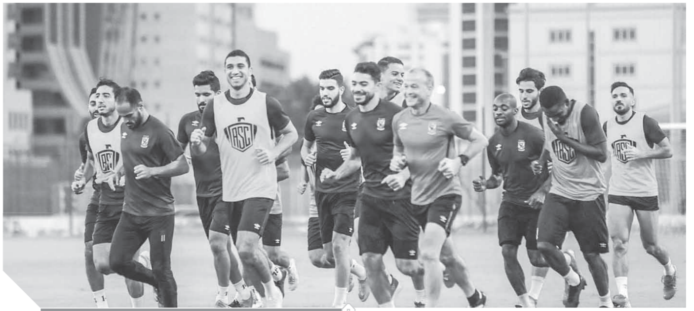
الأهلي يبدأ استعداداته غدا للقاء بنى سوف في الكأس