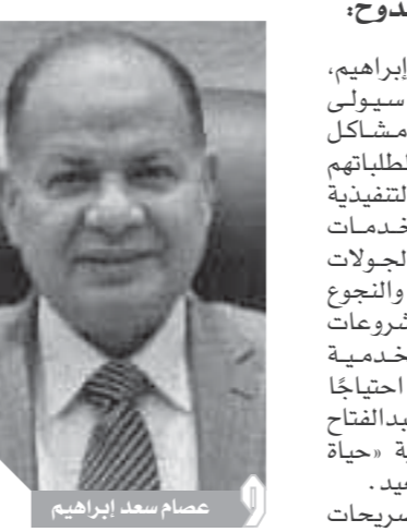
عصام سعد إبراهيم

الشبابية لتولي المناصب القيادية بالمحليات فضلاً عن إعلاء قيم الشفافية والنزاهة ومحاربة الفساد تنفيذاً لخطة التنمية المستدامة ورؤية مصر ٢٠٢٠. وأضاف اللواء عصام سعد إنه سيعرض نصب عينيه القضاء على ظاهرة التآمر وحل جميع النزاعات والخضومات بالتنسيق مع الجهات الأمنية لأنها السبيل لتحقيق التنمية بالقرى والتجوع فضلاً عن استكمال برامج محو الأمية وتعليم الكبار وتنفيذ برامج الاستهداف الجغرافي للقرى الأكثر احتياجاً وسد الثغرات التنموية من خلال المشاركة المجتمعية للمؤسسات والجمعيات الأهلية فضلاً عن دعم الحكومة لقطاعات مياه الشرب والصرف الصحي والصحة والأبنية التعليمية والرى والكهرباء والمرافق فضلاً عن محاربة البطالة.