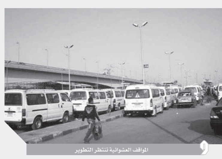
المواقف العشوائية تنتظر التطوير

الاجهزة التنفيذية فشلت في التصدي لتلك الظاهرة. ومن الملفات المهمة أمام المحافظ الجديد العقارات الخالفة حيث تحولت قرارات الإزالة إلى حبر على ورق داخل عوامص المدن، خاصة العاصمة شبين بجانب