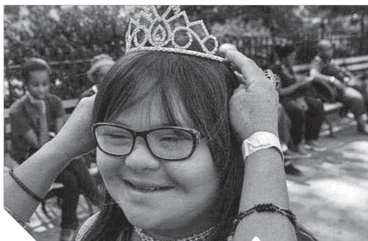
أمل الشفاء للمصابين بمتلازمة داون

يشكل الأطفال المصابون بمتلازمة قللاً للأباء حول كيفية العناية بهم، وتدريبهم على الاعتماد على أنفسهم، خاصة مع الاعتقاد السائد طيلة عقود، بأن التأخر الذهني الذي يعانيه المصابون بمتلازمة «داون» غير قابل للعلاج، لكن قبل أيام ظهرت بشرى طيبة تحمل الأمل بالشفاء للمصابين بمتلازمة داون، ويان حالتهم الذهنية قد تتغير تماماً في المستقبل بفضل هذا الإنجاز الطبي في أمريكا.