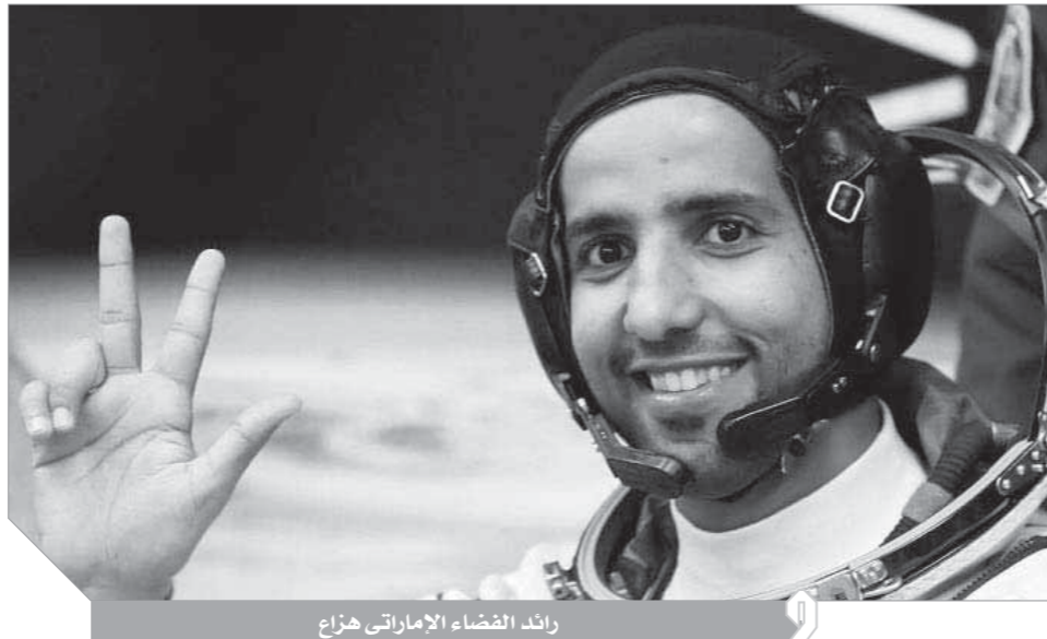
رائد الفضاء الإماراتي هزاع

المركبة «سويوز أم إس ١٢» يوم ٢٣ أكتوبر ٢٠١٩، ومحطة الفضاء الدولية شهدت عام ١٩٩٨ وبيدات باستقبال رواد الفضاء في نوفمبر ٢٠٠٠ وهي عبارة عن مختبر يشغله فريق دولي في مدار على ارتفاع ٣٩٠ كيلومتراً عن سطح كوكب الأرض، وهدفها تحضير الإنسان لتضحية أوقات طويلة في الفضاء، وكذلك إجراء التجارب خارج منطقة الجاذبية الأرضية، وتشكل المحطة المشروع العلمي والتكنولوجي الأكثر تعقيداً على الإطلاق في تاريخ استكشاف الفضاء، ويبلغ وزنها نصف مليون كجم، وسرعته ٢٨ ألف كم في الساعة، وهي تكمل دورة واحدة حول الأرض كل ٩٠ دقيقة، وتشرق الشمس الشمس على روادها وتغرب ١٦ مرة خلال اليوم الواحد.