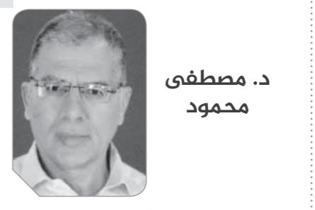
د. مصطفى محمود

قال اللواء عصام سعد إسيوط، إنه سيولي اهتماماً كبيراً لحل مشاكل المواطنين والاستجابة لطلباتهم بمشاركة كافة الجهات التنفيذية بالمحافظة وتحسين الخدمات المقدمة لهم فضلاً عن الجولات الميدانية بجميع القرى والتجوع والوقوف على تنفيذ المشروعات القومية والتنموية والمشروعات وخاصة بالقرى الأكثر احتياجاً تفصيلاً لمبادرة الرئيس عبدالفتاح السيسي رئيس الجمهورية «حياة كريمة» وبرنامج تنمية الصعيد. وأعلن المحافظ في تصريحات صحفية عن فتح جميع الملفات وتفعيل اللقائات الجماهيرية مع المواطنين وحل المشكلات بمشاركة الجميع وتكثيف حملات الرقابة والمتابعة على كافة القطاعات للوقوف على الخدمات المقدمة