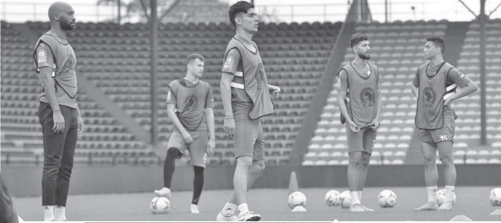
الزمالك جاهز لمواجهة مازيمبي