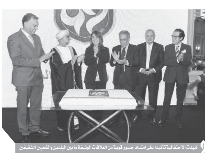
شهدت الاحتفالية تأكيداً على امتداد جسور قوية من العلاقات الوثيقة ما بين البلدين والشعبين الشقيقتين

وفي مختلف العواصم العربية والعالمية أقامت سفارات السلطنة حفلات مماثلة. وفي واشنطن شهد ووربرت أوبراين مستشار الأمن القومي الأمريكي، الاحتفال الذي أقامته سفارة السلطنة لدى الولايات المتحدة الأمريكية بمناسبة العيد الوطني.