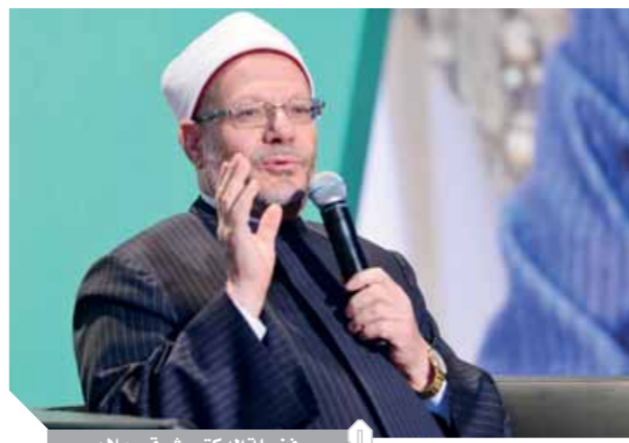
فضيلة الدكتور شوقي علام