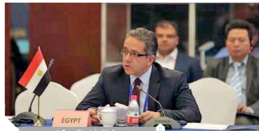
العناني أمام منتدى بكين