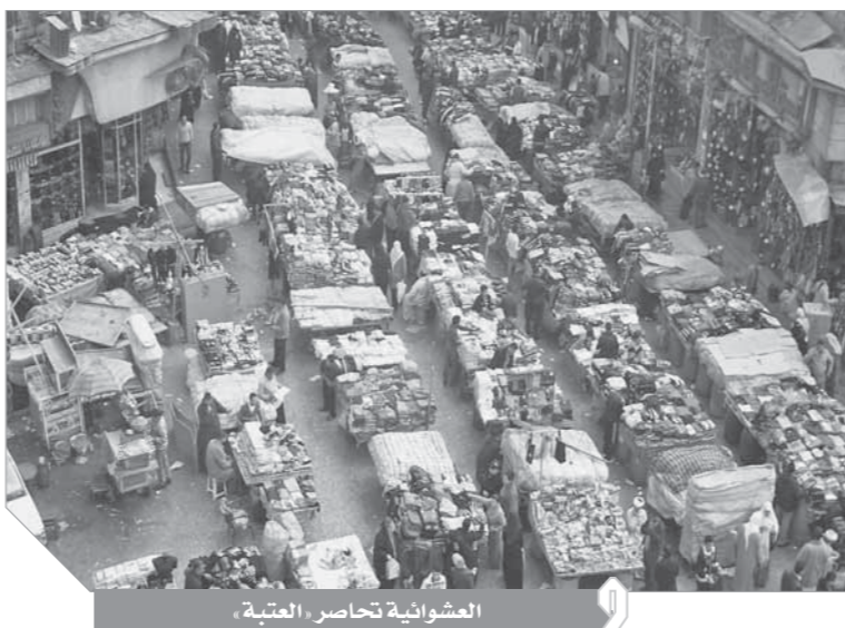
العشوائية تحاصر العتبة