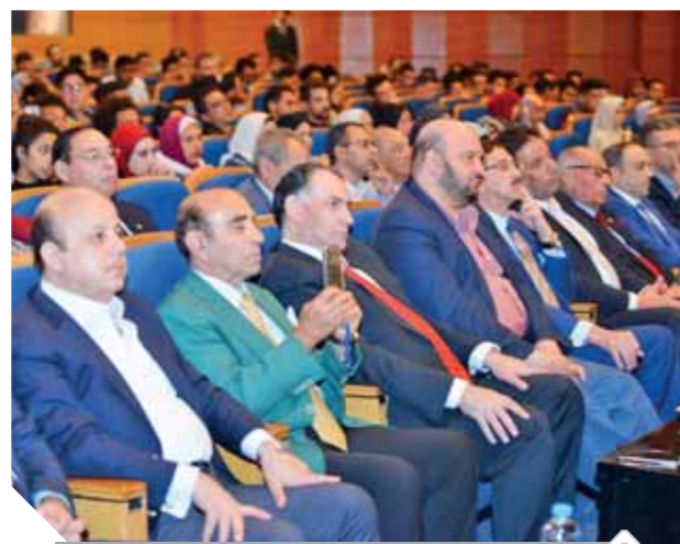
جانب من حضور الندوة

كان بورقيبة زعيمًا مسلمًا حين شجع في النصف الأول من القرن الماضي على سن تشريعات تقيد تعدد الزوجات، وتحدد من ظاهرة الطلاق، وتمنح المرأة الحق في العمل. واستند السبسي إلى تفسيرات دينية، وهو يشرع للمساواة بشروط في الإرث بين الجنسين، فيما الأزهر ما زال يجادل في وقوع الطلاق الشفوي، ويعترض على الدعوة لتوثيقه. وفي خطوة غير محسوبة، سارع الأزهر إلى تقديم مشروع قانون للاحوال الشخصية للبرلمان، أثار كثيرًا من الجدل، ليس فقط بسبب نصوصه، ولكن أيضًا بمدى قانونية اجراء اإقدامه على ذلك، وبدت تلك الخطوة ردًا على إعلان وزارة العدل تشكيل لجنة حكومية لإعداد قانون للاحوال الشخصية، فضلًا عن وجود نحو أربعة مشاريع أخرى مقدمة لمجلس النواب من قبل بعض أعضائه، رغم ما تحمله من مخالفة صريحة لنصوص الدستور، الذي لا ينطوي على أي نص يجيز للأزهر أن يقدم بمشاورين قوانين للبرلمان، فإن أراد ذلك فيتم عن طريق الحكومة. وإذا صح ما نسب للدكتور أحمد الطيب قوله بأن الاحوال الشخصية، لا يُقبل أن يترك الحديث فيها لمن هب ودب، ووصفه قول المعارضين على خطوته بأنه عبث لا يليق بمن يحترم نفسه ويحترم غيره، إن صح ذلك فالحق مقبول على معركة بين الحكومة والبرلمان والمجتمع المدني من جهة، وبين مؤسسة الأزهر من جهة ثانية في حال تمسكت الأخيرة بمشروعها، فمن يتحمل يا ترى وزن ذلك من يتمسكون بالدستور أم من يتجاهلوه يربغون في العصف به؟