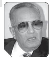
بهاء الدين أبوشقة