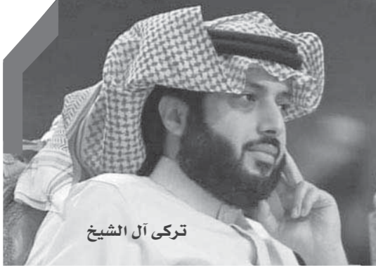
تركي آل الشيخ

وسينمائية وحفلات غنائية وموسيقية جماهيرية شارك فيها نجوم وفرق عربية وعالمية، بجانب معارض للفنون التشكيلية، وفنون أخرى.. وجذبت هذه الفعاليات، زائرين من السعوديين والوافدين المقيمين، بجانب السياح الذين بدأوا بالتوافد حديثاً على المملكة التي بدأت بمنح مواطني ٤٩ دولة تأشيرات دخول فورية.