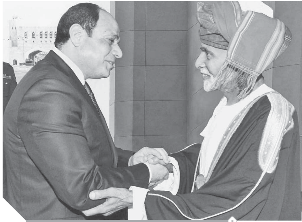
الرئيس عبدالفتاح السيسي والسلطان قابوس بن سعيد

ما بين القاهرة ومسقط وواشنطن والعواصم العربية والعالمية تتتابع الاحتفالات بالعيد الوطني التاسع والأربعين لسلطنة عُمان. فعلى ضفاف نيل القاهرة تواصلت فعاليات احتفالية أقامتها سفارة السلطنة حيث عبرت عن قوة الصلات الوثيقة بين البلدين.