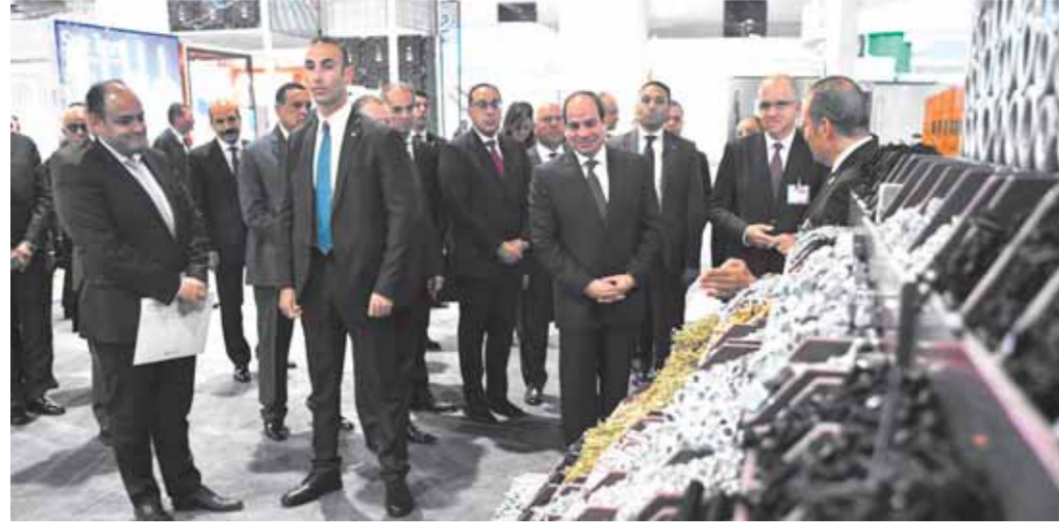
الرئيس السيسي يفتتح المعرض والملتقى الدولي للصناعة بحضور كبار المسؤولين في مصر والعالم.

وأكد الرئيس، في الوقت نفسه، أن هناك الكثير من الأنشطة تحتاج بالفعل إلى دراسات، موضحاً