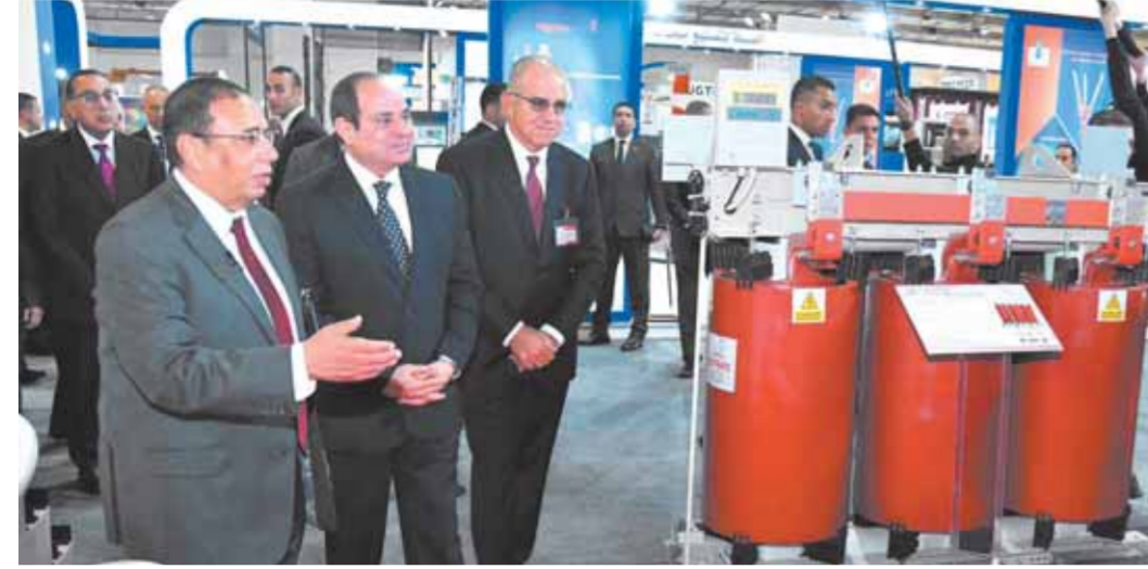
الرئيس السيسي يفتتح المعرض والملتقى الدولي للصناعة بحضور كبار المسؤولين في مصر والعالم.

يأتي ذلك في إطار تعزيز علاقات التعاون العسكري بين القوات المسلحة والألمانية في العديد من المجالات العسكرية.