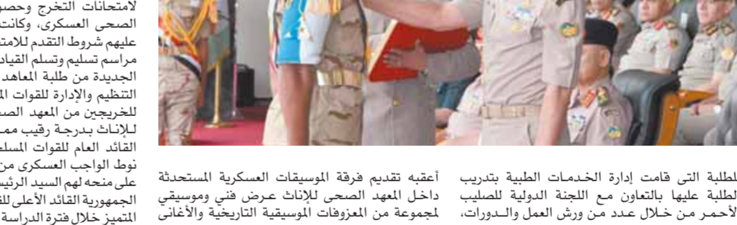
وزير الدفاع يشهد الاحتفال بتخريج دفعات جديدة من المعاهد الصحية، بحضور كبار المسؤولين في وزارة الدفاع.

دفعه رقيب شهيد سعد إبراهيم عبدالجواد، والدفعة الخامسة من المعهد الصحي للإناث دفعه رقيب شهيد مصطفي العزب خليل العزب، وذلك بحضور الفريق أسمية عسكري رئيس أركان حرب القوات المسلحة وقادة الأفرع الرئيسية وعدد من كبار قادة القوات المسلحة.