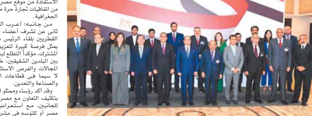
الرئيس السيسي يلتقي رابطة رجال الأعمال القطريين في القاهرة، بحضور كبار المسؤولين في مصر وقطر.

كما أشاد الرئيس بالتطورات الإيجابية التي شهدتها العلاقات الاقتصادية والتجارية بين البلدين الشقيقين خلال الفترة الماضية، موضحاً سيادته في هذا الصدد ما يوفره المشروعات العملاقة الجارية تنفيذها في مصر من فرص استثمارية متنوعة، وفي مقدمتها محور تنمية منطقة قناة السويس، والذي يتضمن عدداً من المناطق الصناعية واللوجستية الكبرى، وهو ما يوفر فرصاً واعدة للشركات القطرية الرابطة في