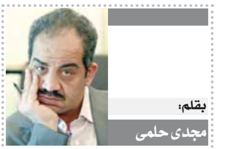
يقلم: مجدى حلمي

لمزيد من الأخبار والتقارير المصورة ALWAFD.NEWS