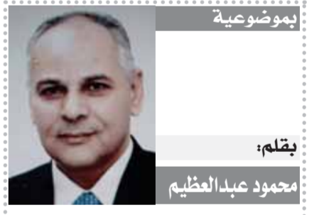
يقلم: محمود عبد العظيم

إن مواجهة التضليل المعلوماتي مسؤولية الحكومات أولاً، ويجب أن تحرك مجتمعة لإضخام مواقع التواصل الاجتماعي للقواعد والقيود الأخلاقية للصحافة والإعلام التي تعاقب الصحفي والإعلامي والوسيلة، ولكن القوانين تعاقب المدون أو المفرد ولا تستطيع معاقبة الوسيلة، في حين القوانين في الغرب تعاقب هذه المواقع التي سددت في السنوات الماضية ملايين اليوروهات غرامات وتعويضات للحكومات هناك. مواجهة التضليل المعلوماتي لا تكون إلا بمزيد من الحرية واحترام حرية الرأي والتعبير والمصارحة والمكاشفة في كل شيء يهيم المواطن والوطن، واحترام التنوع والتعدد الإعلامي ودعمه بكل الوسائل المتاحة لمواجهة ما هو ات من حملات تضليلية مكثفة.