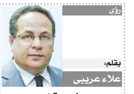
بقلم: علاء عربي