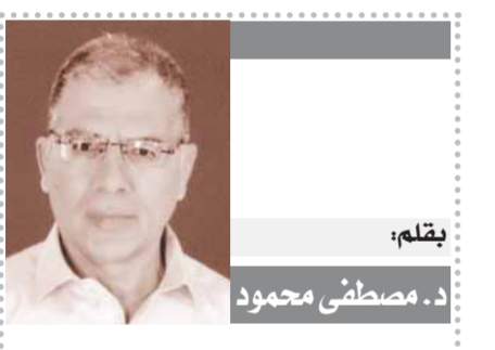
بقلم: مصطفى محمود