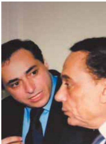
أكرم السعدني مع عادل إمام