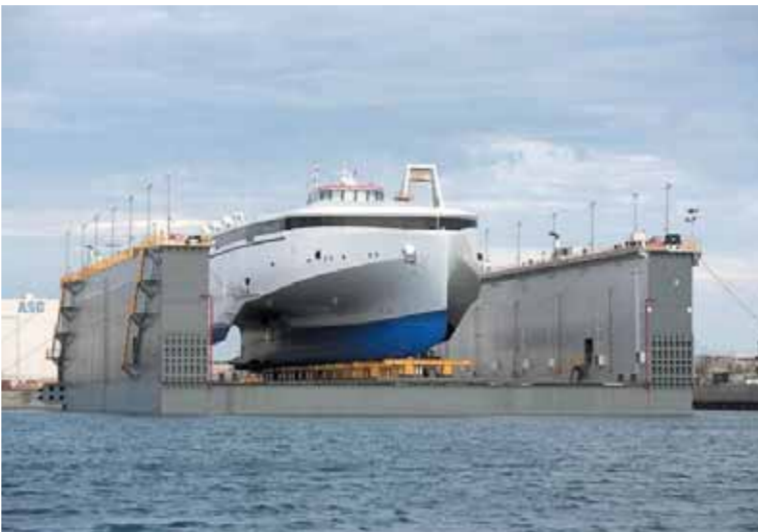
الموانئ العُمانية تواصل أداءها التشغيلي واللوجستي بكفاءة عالية

فقد كان حسن خنفي في محاضراته ولقاءاته مثله في كتاباته منذ أن حرصاً على تحريض غفول طلابه ومستعبيه على التفكير المستقل وإبداء الرأي وكان يستخدم في ذلك كل روي ومناجع البلاغة عبر عصور الفلسفة المختلفة ولا يغيب عنه أي إرث إرثي في فيلسوف من غير المشاهير في تاريخ الفلسفة فتجد إجازته حاضرة من مصادر الفيلسوف الأصيل، وكان السؤال الذي ما إن لفتاه في القاهرة التي يعادها إلى مهمة علمية هنا أو هناك، فقد كانت شهرة حسن خنفي الدولية توفق بمراحل شهرته المحلية والإقليمية لدرجة أنهم كانوا يعرفونها في الخارج بل أنها من قبله كان حسن خنفي؟