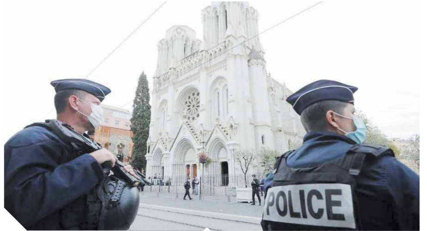
الشرطة الفرنسية أثناء تأمينها محيط كنيسة نيس.

لحافة أعمال العنف والتطرف والكراهية والتعصب. وحذر الأزهر من تصاعد خطاب العنف والكراهية، داعياً إلى تغليب صوت الحكمة والعقل والالتزام بالمسئولية المجتمعية خاصة عندما يتعلق الأمر بعقائد وأرواح الآخرين. وأدان الدكتور شوقى علام مفتى الجمهورية، رئيس الأمانة العامة لدور وهيئات الإفتاء فى العالم، الهجوم الإرهابى، وشدد مفتى الجمهورية على رفض الشريعة الإسلامية القاطع لكل أشكال الاعتداءات الإرهابية الأثمة وترويع الأمنيين والأبرياء دون وجه حق، أو الإساءة للرموز والمقدسات الدينية، ضاربة سبيل ربه بالحكمة والموعظة الحسنة، وليس بالقتل وسفك الدماء. وأكد مفتى الجمهورية أن هذه الجريمة يرفضها الإسلام رفضاً قاطعاً، وأن هذا العمل الإرهابى ليس