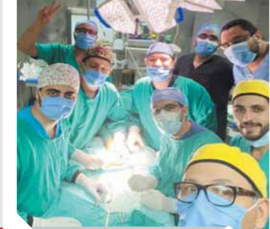
فريق جامعة طنطا المشارك في العملية