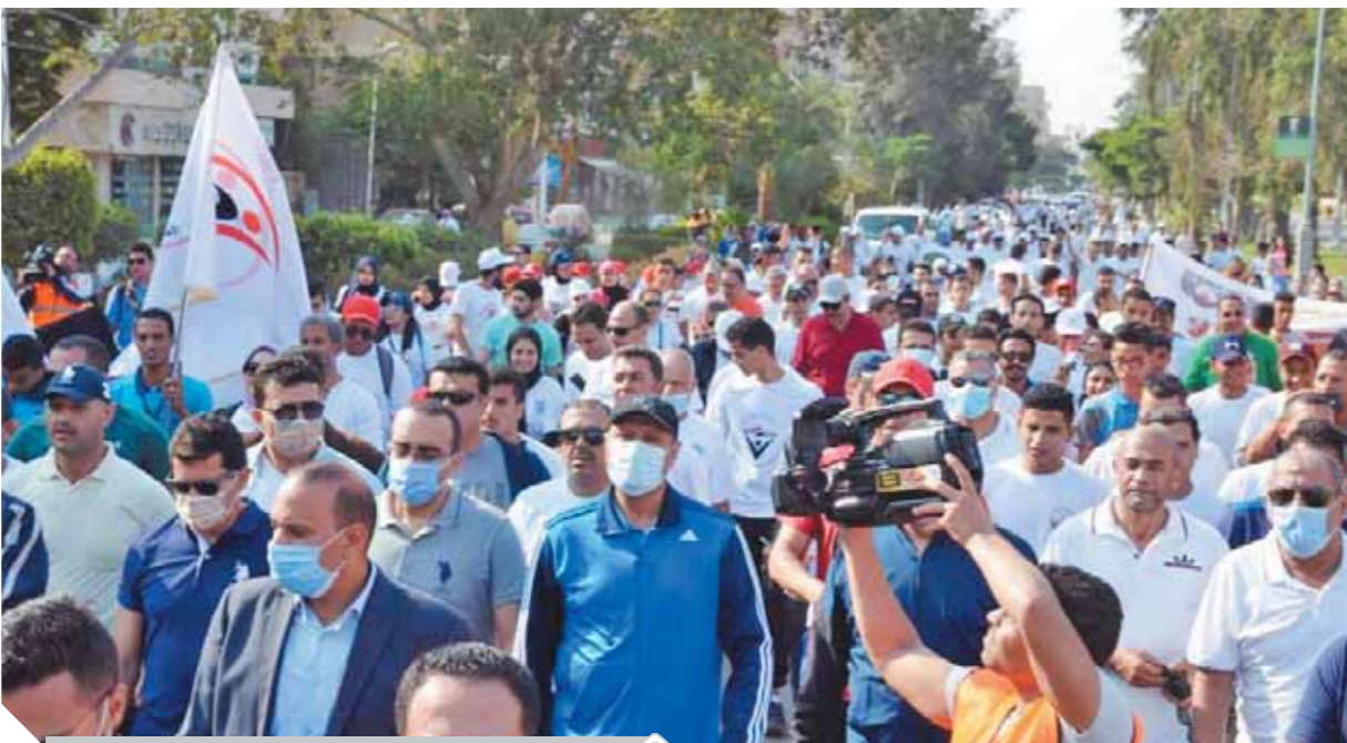
أشرف صبحي خلال مشاركته ماراثون المشى بالإسماعيلية