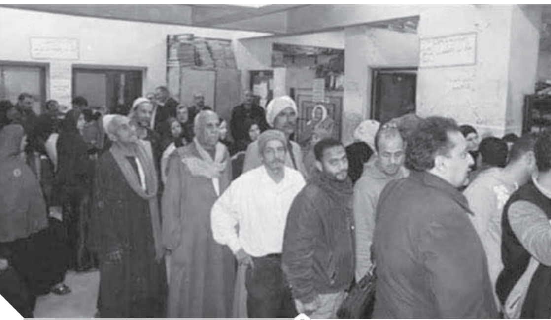
الازدحام افة الروتين القديم

التحول الرقمي هو عبارة عن مشروع قومي بدأت فيه الحكومة منذ ما يقرب من ٤ سنوات، ويهدف لاصلاح الجهاز الإداري للدولة المتضخم، والقضاء على ما به من ازمات. وساهم التحول الرقمي في توفير الكثير من البيانات التي تمكن الحكومة من خلق هوية رقمية لكل مواطن من خلالها. ويتطلب التحول الرقمي ضرورة توافر بنية معلوماتية وشبكة ألياف ضوئية، وتسمى الحكومة لتطبيق نظام الشبكات الواحد ورقمنة الخدمات الحكومية، وإتاحتها للمواطنين من خلال تمثيل بعض التطبيقات على الهواتف، وذلك من خلال التعاون مع العديد من الوزارات، حيث يقوم المواطن بتحميل بعض التطبيقات التي وفرتها الحكومة، وإدخال الرقم القومي، والاسم الاول للوالدة ورقم المحمول، والنظام سينتج كوداً من ٦ ارقام يرسل في رسالة النظم، ويتم اجراء العملية بنجاح، وهذا النظام يتيح خدمة تبييه