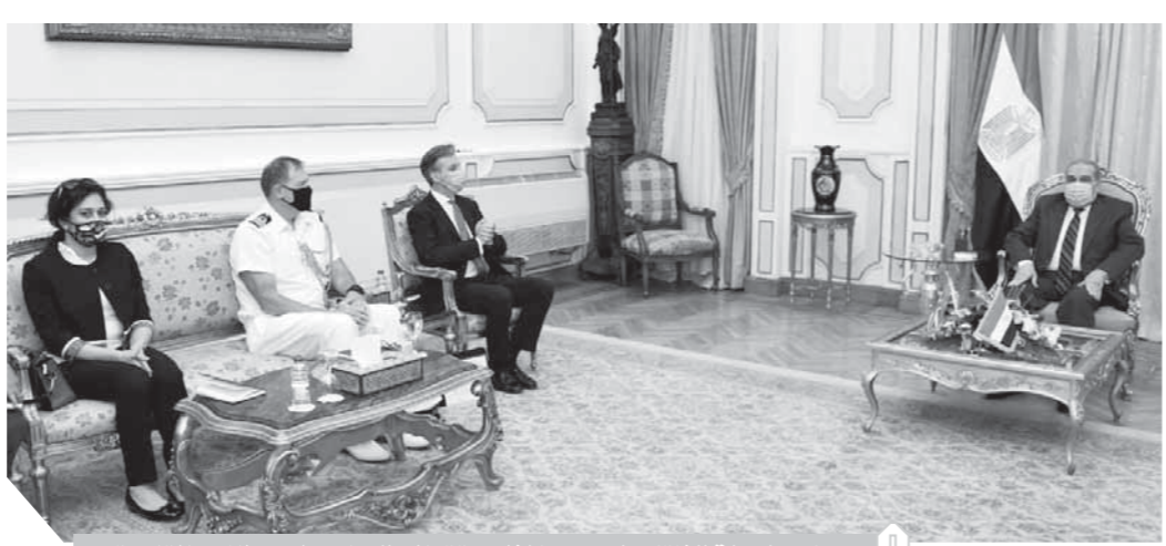
وزير الدولة للإنتاج الحربى خلال استقباله للسفير البريطانى بالقاهرة

الهام الذى تقوم به وزارة الإنتاج الحربى لدعم خطة الدولة المصرية فى التنمية والتطوير، كما أكد «آدامز» أن العلاقات الثنائية تشهد تطوراً إيجابياً ووعية فى إقامة شركات صناعية فى مختلف المجالات، خاصة فى ظل اهتمام الدولة المصرية بتوفير المناخ الداعم للاستثمار وجذب المزيد من استثمارات الشركات العالمية وزيادة أنشطتها فى مصر.