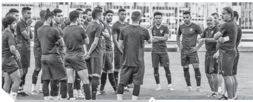
الزمالك يستعد لمواجهة الرجاء

قرار الاتحاد الأفريقي لكرة القدم «كاف» بشأن تأجيل موعد مباراة نصف النهائى أمام الرجاء المقرر إقامته بعد غد الأحد بعدما تقدمت مصر بطلب لتأجيل المباراة النهائية، لكن مازالت هناك حالة من الغموض حول موعد مباراة نصف النهائى الذى قد يتم تأجيله مرة أخرى، بعدما سبق وقرر الكاف تأجيله نظراً للظروف الصحية لفريق الرجاء بوجود إصابات في صفوف الفريق فيفروس كورونا. على الجانب الآخر قرر مجلس إدارة نادى الزمالك تقديم طعن إلى مركز التسوية والتحكيم باللجنة الأولمبية، على قرار اللجنة الأولمبية بإلغاء لأئحة النادي وإيقاف الحكم لحنين البت فيه خاصة أن اللائحة تم اعتمادها في صيف ٢٠١٩ مما يؤكد أن هناك محاولة لهد استقرار النادي.