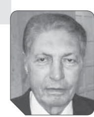
لواء سعد الجمال