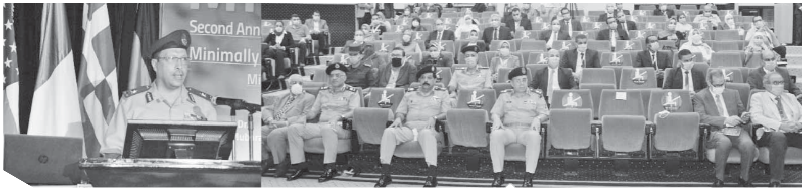
جانب من مؤتمر المناظير الدقيقة للمسالك البولية بالأكاديمية الطبية للقوات المسلحة

كما تتضمن أوجه التعاون المشترك فى مجال تدريب المعلمين، والاستفادة والمشاركة فى المحتوى الرقوى الذى تمتلكه مصر، ونظام الامتحانات المصرى.