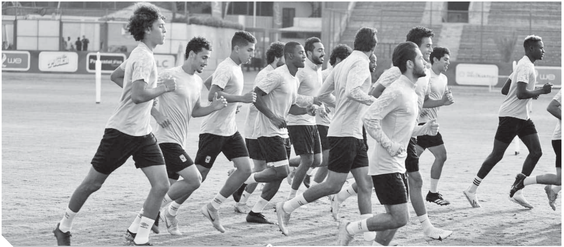
الأهلي يحتتم استعداداته لمواجهة الطلائع