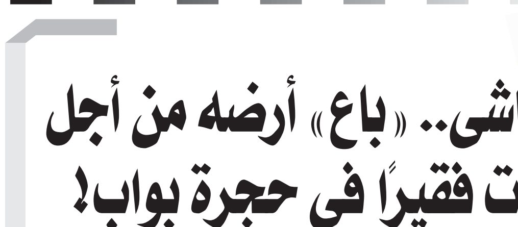
مصطفى القشاشي.. «باع» أرضه من أجل الصحافة.. ومات فقيراً فى حجرة بواب!

وقد أصابني مرض الزماني الفرشاش ثلاث سنوات كاملة اضطرتت خلالها إلى بيع منزلى بشارة الهرم ثم إلى بيع المبنى الذي كنت أنشأته لإدارة جريدتي سنة ١٩٢٤ وأخيرا في سنة ١٩٥١ اضطرتت إلى بيع الثلاثة عشر فدانا التي كانت آخر ما أملكه لتسديد خسارة جريدتي التي انشغلت عنها لمباشرة أعمال نقابة الصحفيين وأعضائها، وكل ما أذكره تويده سجلات الشهر العقارى، ورغم بيع كل ما نملكه احتفظنا بفكرتنا، وكراهيتنا للحزبية مازلنا نسد في باقية ديون تراكمت علينا بسبب الخسائر التي تكبدناها، وفي البنوك كمبيالات مستحقة علينا تشهد بصحة كل هذا الذي نقره.. ثم ختم الرجل شكواه التي أرسل منها نسخة إلى مصطفى أمين الذي كان يساند الثورة حتى هذا الوقت! قائلًا: «وهذا ولم تنشر في صحيفتنا طول الخمسة وثلاثين عامًا التي قضيناها في العمل بالصحافة كلمة تتنافى مع فكرتنا القومية وصالح البلاد.. والسلام عليكم ورحمة الله وبركاته».. وبعد هذا الخطاب جلس الرجل يسترجع مشوار حياته وذكرياته وكفاحه من أجل مهنة الصحافة وكرامتها وماضيها منذ انتخابه سكرتيرًا عامًا للثقافة في ٥ ديسمبر/ كانون الأول ١٩٤١ وكذلك الصحف التي أصدرها ومنها صحيفة أبو الهول التي تبنت فكرة بناء ستوديو مصر ونجحت في ذلك.