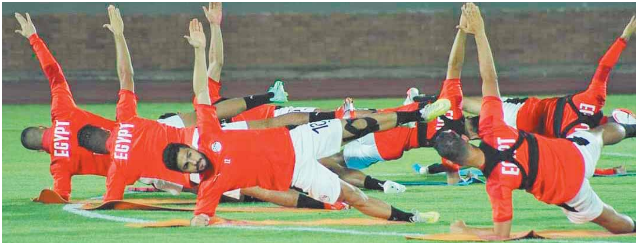
المنتخب استعد جيداً لمواجهة ليبيريا ودياً

الزمالك يواجه بيراميدز ودياً قبل الصدام الإفريقي ومن المقرر أن يخوض الزمالك مباراة ودية أخرى يوم ٨ أكتوبر المقبل، ولكن لم يتم الاتفاق على طرف المباراة الثانية حتى الآن. ويسمى إيهاب جلال المدير الفني لبيراميدز لتجربة أكبر عدد من اللاعبين في ظل غياب اللاعبين الدوليين وتطبيق طريقة اللعب التي سيعتمد عليها في الموسم الجديد، قبل الاستقرار على القوام الأساسي في ظل امتلاك الفريق لعدد كبير من النجوم في كل مركز.