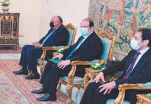
الرئيس خلال استقباله أمس لمستشار الأمن القومي الأمريكي

استقبل الرئيس عبد الفتاح السيسي أمس جيك سوليفان مستشار الأمن القومي الأمريكي، وذلك بحضور سامح شكري وزير الخارجية وعباس كامل رئيس المخابرات العامة، وكذلك كل من بريت ماكجورك منسق الشرق الأوسط بمجلس الأمن القومي الأمريكي، وأريانا برينجورث كبيرة مستشاري مستشار الأمن القومي الأمريكي، وجوشوا هاريس مدير إدارة شمال إفريقيا بمجلس الأمن القومي الأمريكي، ونيكول شامبين نائبة سفير الولايات المتحدة بالقاهرة.