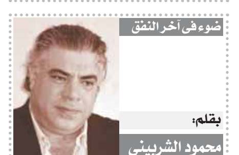
صوة في آخر البنق