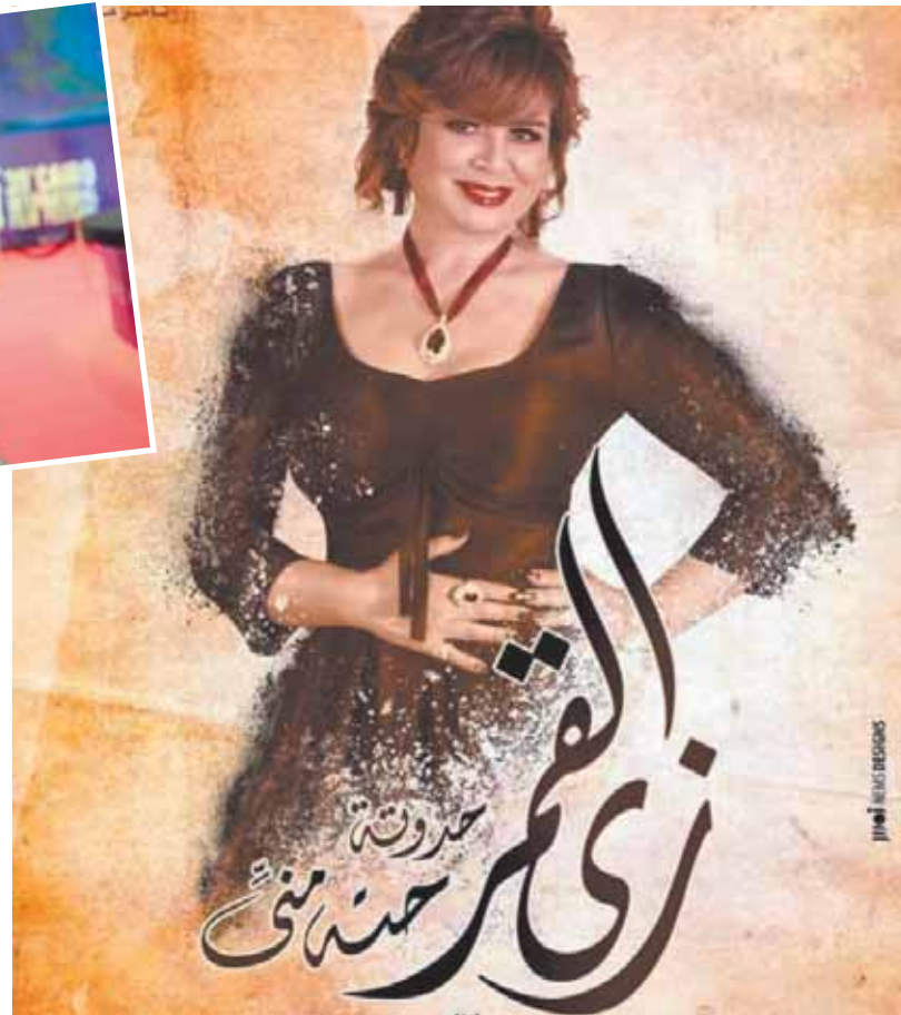
جمال عبد الناصر

عندما يصلان لعمر معين، لا يسمح للرجل أن يبحث عن سيدة أخرى، العمل ملء بالقضايا الإنسانية الكثيرة وهذا ما جذبني بشكل كبير أنه يتناول مشكلات السيدات والقضايا التي تقابلن، ويوجد رهي والحوار وطريقة تقديم المشكلة، وخلال ٥ حلقات، لكل نهاية حلقة يوجد حدث يغير مسار الأحداث، والعمل لا توجد به توقعات من الجمهور، فهدفت قرائتي للحلقات الثلاث من العمل لم أعجب من شيء، ولكن في الحلقة الرابعة وجدت الأحداث خارج توقعاتي تماماً، لأنني إذا كنت من الجمهور أشاهد المسلسل مثل أي مشاهد آخر فلن أتوقع هذه النهاية.