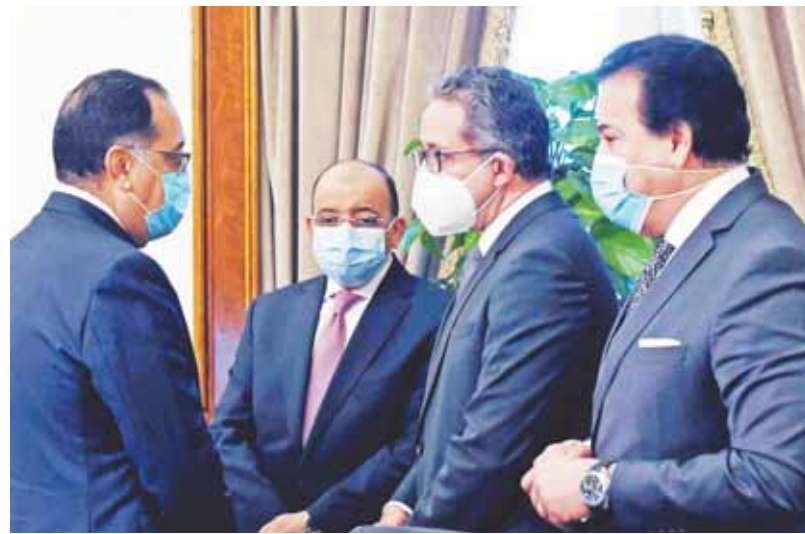
«مدبولي»، خلال حديثه مع وزراء التعليم العالي والسياحة والتنمية المحلية

مشيراً إلى أن ذلك يعكس الجهد الذي تقوم به الدولة حالياً في مجال التحول الرقمي في مختلف القطاعات.