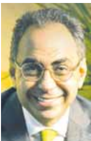
بقلم: د. هاني سري الدين