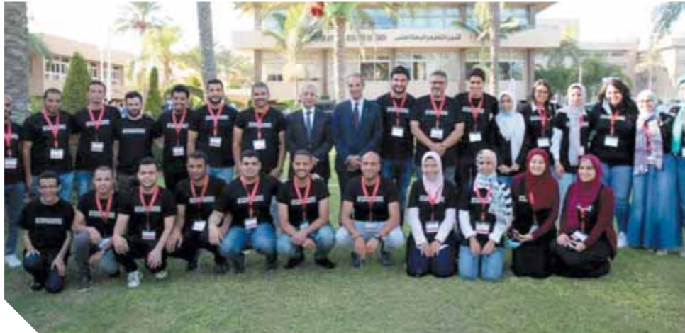
عمرو طلعت يكرم الفريق المصرى الفائز فى الأولمبياد الدولية للمعلوماتية