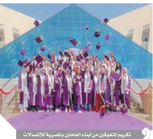
تكريم المتفوقين من أبناء العاملين بالمصرية للاتصالات

كرم المهندس عادل حامد عضو المكتب والرئيس التنفيذي للشركة المصرية للاتصالات، ٥٠ طالباً من المتفوقين من أبناء العاملين من الحاصلين على شهادات الثانوية العامة، والدبلوماسية، لعام ٢٠٢٠. يأتي ذلك ضمن مبادرة عائلة We، وقال الرئيس التنفيذي للشركة المصرية للاتصالات، إن أسرة الشركة وفريق عملها فخورون جداً بالطلاب المتفوقين وأسرههم الذين بذلوا المزيد من الجهد؛ لأجل مستقبل أبنائهم. كما أعرب العاملون بالشركة المصرية للاتصالات عن مسعادتهم بتكريم شركتهم بأبنائهم المتفوقين والمتميزين، مؤكداً أن الموظفين يشعرون أن الشركة مثل بيتهم وكانهم عائلة واحدة.