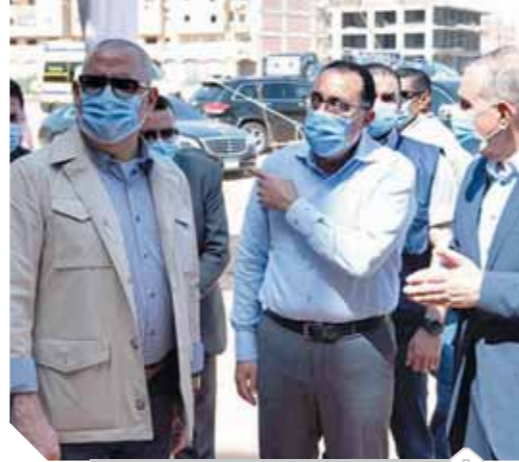
مدبولي، خلال تفقده عدد من المشروعات

ولفت مدبولي إلى أهمية توفير فرص عمل جديدة للشباب من خلال التوسع في المشروعات الصغيرة وإنتاج الكهرباء من البيوجاز وتوابع الصرف الصحي، والعمل على التسويق لها، ولاسيما أن المشروع الواحد