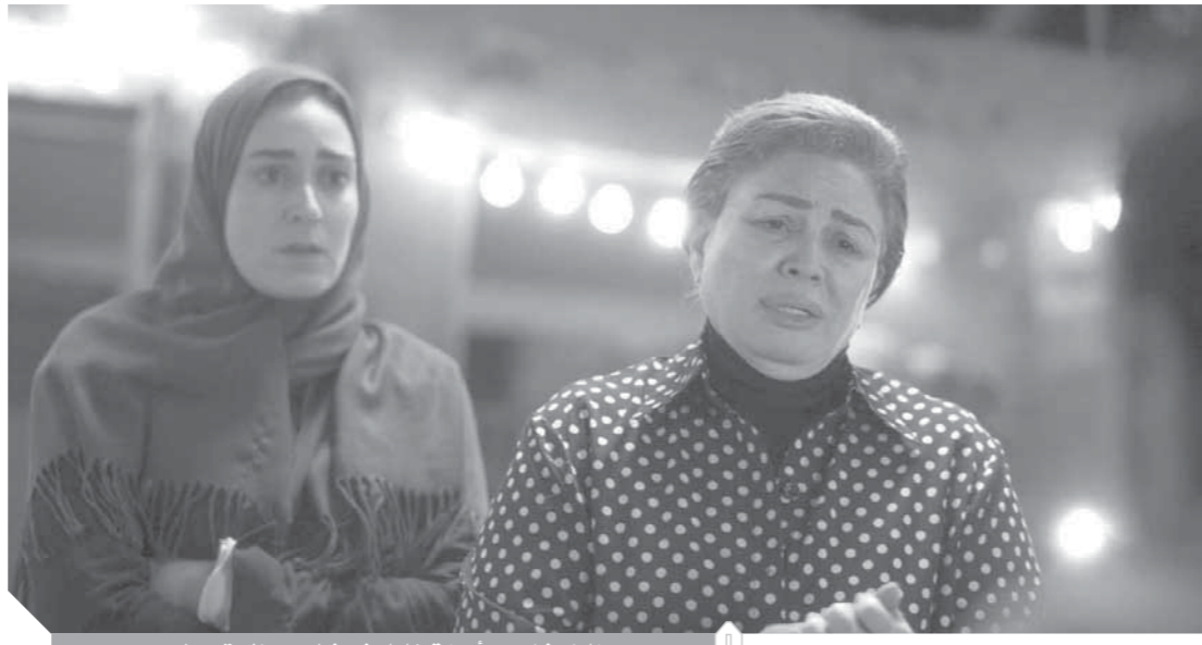
الإمام شاهين وأمينة خليل في فيلم «حظر تجوال»