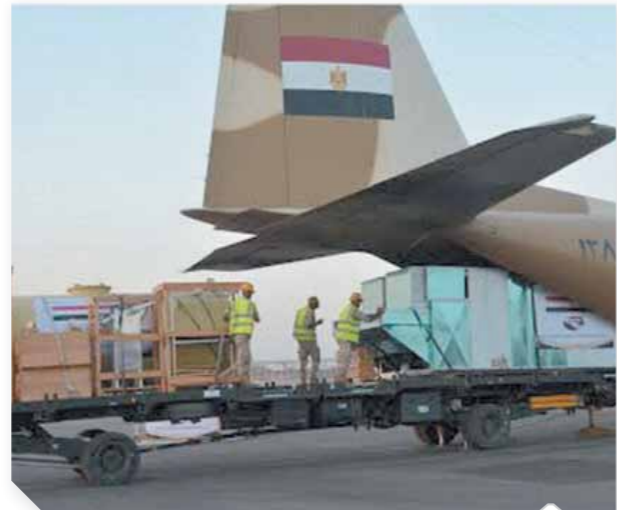
وصول الدعم إلى الشعب السودانى الشقيق