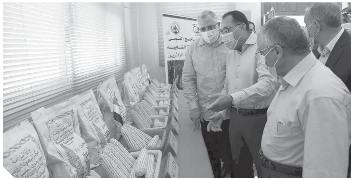
رئيس الوزراء أثناء جولته في كفر الشيخ