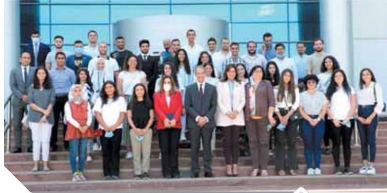
وفد من الدارسين بالخارج بالقرية الذكية

كرم طلعت وعبدالغفار، الفريق المصرى الذى تروعا وزارة الاتصالات وتكنولوجيا المعلومات والفائز بأربع ميداليات دولية «ميدالية فضية وثلاث ميداليات برونزية»، فى الأولمبياد الدولية الثانية والثلاثين التى نظمتها هذه العام دولة سنغافورة افتراضيا بمشاركة ٢٤٧ متسابقا يمثلون ٨٧ دولة حول العالم، وتعد هذه هى المرة الأولى التى يحمل فيها جميع أعضاء الفريق المصرى بالكامل على ميداليات. أكد طلعت أن هذه النتيجة المتميزة تعكس حجم الاهتمام الذى توليه وزارة الاتصالات وتكنولوجيا المعلومات لدعم التميز الرقى وتنمية وبناء القدرات الرقابية للشباب المصرى، بما يزيد من فرصهم على المنافسة الدولية في مجال الاتصالات وتكنولوجيا المعلومات، مشيراً إلى الدعم الكبير الذى تقدمه الدولة لهذا الملف لإيجاد حلول تكنولوجية مبتكرة للتحديات التى يواجهها المجتمع، وتعليم فرص الشباب المصرى في مواجهة متطلبات سوق العمل