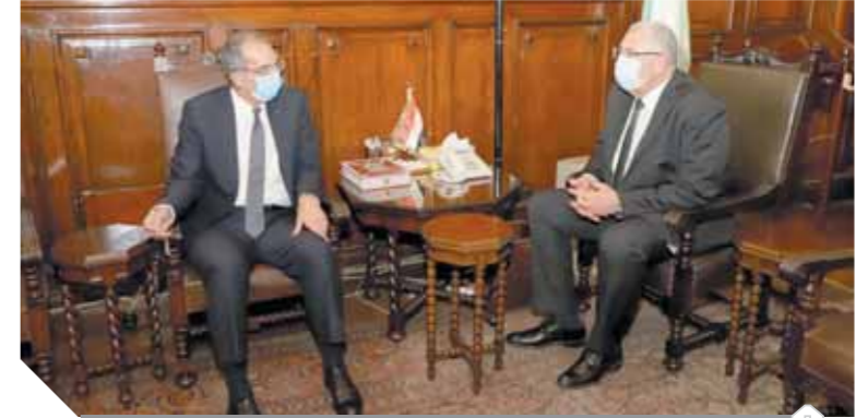
وزير الاتصالات والزراعة يبحثان استخدام تكنولوجيات الذكاء الاصطناعى