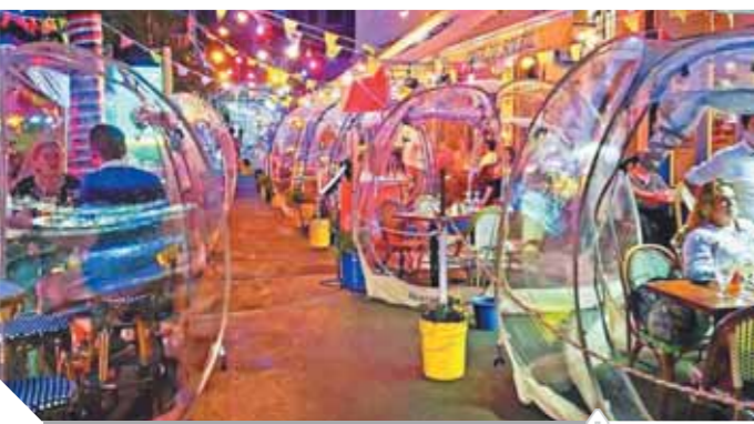
تناول الطعام داخل بالونات بلاستيك