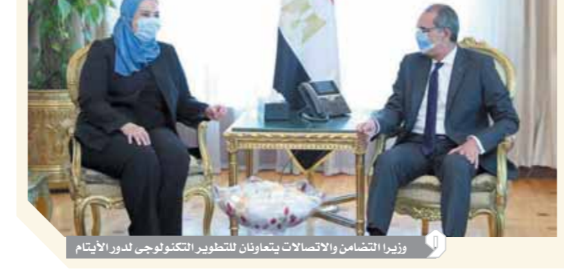
وزير التضامن والاتصالات يتعاونان للتطوير التكنولوجى لدور الأيتام

شهد الدكتور عمرو طلعت وزير الاتصالات وتكنولوجيا المعلومات، والدكتورة نيفين القباج وزيرة التضامن الاجتماعى توقيع اتفاقية تعاون بين وزارة الاتصالات وتكنولوجيا المعلومات، ووزارة التضامن الاجتماعى؛ بشأن التطوير التكنولوجى لمؤسسات الرعاية الاجتماعية ودور الأيتام، والاتاحة التكنولوجية لخدمات وزارة التضامن الاجتماعى للأشخاص ذوى الإعاقة. تضمن الاتفاقية على الاتاحة التكنولوجية للموقع الرسمى لوزارة التضامن الاجتماعى لاستخدام الأشخاص ذوى الإعاقة، وكذلك الاتاحة التكنولوجية للخدمات التى تقدمها وزارة التضامن الاجتماعى كافة؛ لتيسير حصول الأشخاص ذوى الإعاقة عليها. بموجب الاتفاقية تجهز وزارة الاتصالات ١٥٠ قاعة تدريبية داخل دور أيتام ومؤسسات رعاية اجتماعية تابعة لوزارة التضامن الاجتماعى بواقع قاعة واحدة لكل دار أو مؤسسة، من خلال تقديم الدعم الفنى بتوفير أجهزة الحاسب الآلى والعرض الضوئى والطابعات والشبكات الداخلية والبرامج