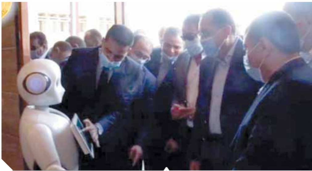
الروبوت خلال استقباله رئيس الوزراء

فوجئ الدكتور مصطفى مدبولي، رئيس مجلس الوزراء، خلال زيارته لجامعة كفر الشيخ بروبوت يستقبله في بداية الزيارة ويصطحبه في الجولة استهل رئيس الوزراء زيارته للمحافظة بالتأكيد على ضرورة استمرار الالتزام بتطبيق الإجراءات الوقائية والاحترازية، للتصدي لفيروس كورونا، ولا سيما في مواقع العمل والمشروعات الجاري تنفيذها في أرجاء المحافظة.