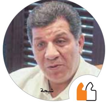
كتبت - فاطمة عياد

تجتمع اليوم اللجنة العليا للحج والعمرة برئاسة مجدى شلبي، وكيل أول وزارة السياحة لقطاع الشركات، والمستشار حمدى أبوزيد، مستشار وزير السياحة، لمناقشة واعتماد