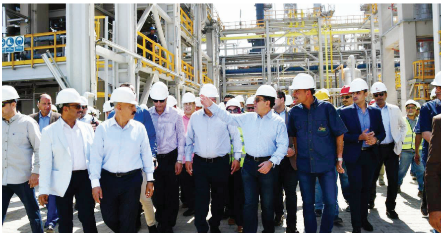
«الملا» خلال تفقده مشروع إنتاج البنزين عالي الأوكتين

قال وزير البترول طارق الملا، أمس، إن مصر أوقعت استيراد الغاز الطبيعي المسال من الخارج، بعدما تسلمت آخر شحناتها المستوردة منه الأسبوع الماضي، ولم يذكر تفاصيل ولا عدد الشحنات التي تسلمتها مصر هذا العام. أضاف «الملا»، أن مصر حققت الاكتفاء الذاتي في الغاز الطبيعي، بينما تعمل على التحول إلى مركز لتداول الطاقة في المنطقة من خلال تسهيل الغاز وإعادة تصديره بعد عدة اكتشافات كبيرة، وبلغ إنتاج مصر اليومي من الغاز الطبيعي 6.6 مليار قدم مكعبة يومياً هذا الشهر، مقارنة بـ 6 مليارات قدم مكعبة يومياً في يوليو الماضي، والإنتاج المصري ينمو باستمرار منذ بدء تشغيل حقل «طهر» في ديسمبر الماضي. من ناحية أخرى، تقدم «الملا» أعمال التشغيل التجريبي لمشروع إنتاج البنزين عالي الأوكتين 95، 92 لشركة الإسكندرية الوطنية للتكرير والبتروكيماويات