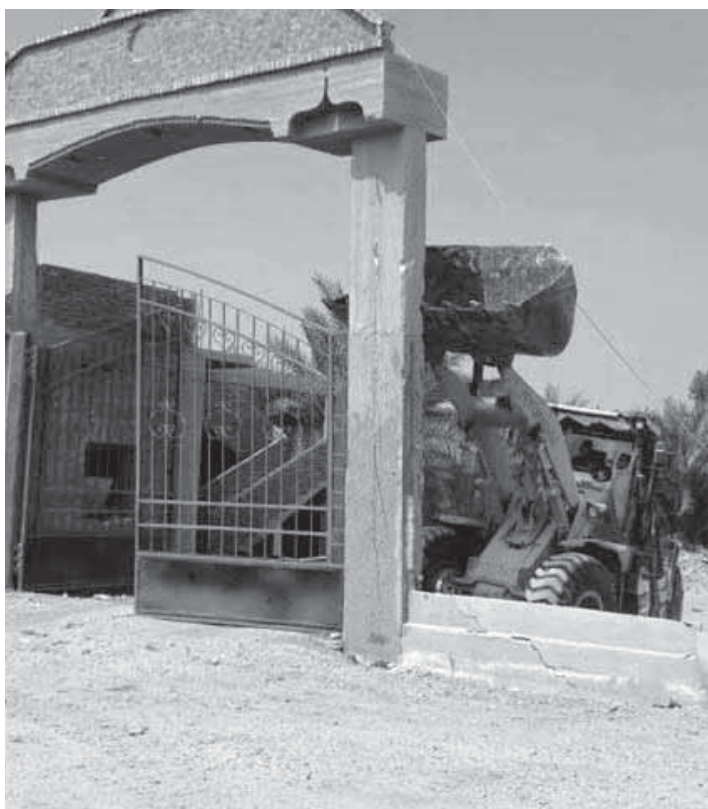
الغربية - منى أبوسكين

قرر اللواء مهندس هشام السعيد محافظ الغربية إحالة جميع موظفى الإدارة الهندسية بحى ثان المحلة الكبرى للتحقيق لتقاعسهم فى إصدار قرارات الإزالة وعدم تنفيذ الإزالات فى المهدي، كما قرر المحافظ نقل نائب رئيس حى ثان المحلة الكبرى إلى الوحدة المحلية بمركز ومدينة سمندو.