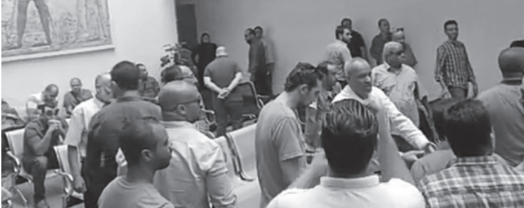
أهل المتوفى يجتمعون داخل المستشفى