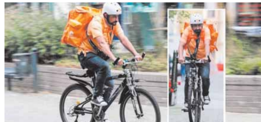
الوزير الأفغانى سيد أحمد شط سعدات يقوم بتوزيع البيرة فى ألمانيا

فى شقة مساحتها ٧٠ متراً بعد حياة الرفاهية، ويقوم بنقل البيتزا مقابل ١٥ يورو فى الساعة، وينتقل فى شوارع لايبزيغ على متن دراجة هوائية مرتدياً سترة برتقالية فاتحة، لكنه سعيد ويتعلم اللغة الألمانية من