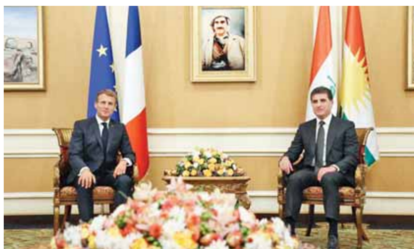
الرئيس نيغيرفان بارزانى خلال لقائه مع الرئيس ماركون

أعلى منصب فى إقليم كردستان. إن المتبحر فى علاقات نيغيرفان الخارجية، والداخلية يراها واضحة، فهو يقف على مسافة واحدة من الجميع: فعلى المستوى الخارجى انتقل بإقليمه إلى العالمية، وعلى المستوى الداخلى يجول على مقرات الأحزاب فى إقليم كردستان، وجعل العلاقات مع بغداد مُرضية بعدما نجح فى مد جسور التفاهم مع (مصطفى الكاظمي) رئيس الوزراء العراقى، منذ أن شكل حكومته فى (مايو) ٢٠٢٠، سواء من خلال المواقف التي أطلقها حول العلاقات على خط أربيل-بغداد، أو من خلال الزيارات المتعددة التي قام بها إلى العاصمة الأحادية لرأب أى صدع، ولتصحيح العلاقات الداخلى والخارجية ناجحة.