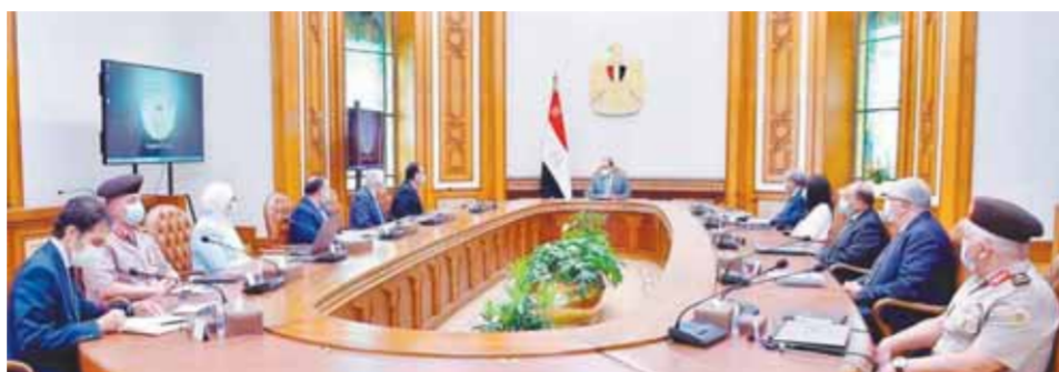
الرئيس السياسى خلال اجتماعه ومدبولى وعدد من الوزراء أمس

والسكية والداجنة. وصرح السفير بسام راضى المتحدث الرسمي باسم رئاسة الجمهورية بأن الاجتماع تناول متابعة عدد من مشروعات وزارة الزراعة خاصة ما يتعلق بالصادرات الزراعية المصرية، وتنمية الثروة الحيوانية والسكية، ومراكز تجميع الألبان. وأوضح المتحدث الرسمي بأن وزير الزراعة استعرض خلال الاجتماع موقف الصادرات الزراعية المصرية والتي تشمل ٣٥٠ منتجاً زراعياً متنوعاً تصدّر إلى أكثر من ١٥٠ دولة حول العالم، حيث سجلت معدل زيادة بمقدار حوالى ١٤٪ مقارنة بالعام الماضى لتلجم المنتجات الزراعية المصدرة للخارج، مشيراً في هذا الصدد إلى أن مصر تحتل المركز الأول عالمياً في تصدير الموالج. كما عرض وزير الزراعة المنظومة الجديدة الخاصة بميكنة وتكويد المزارع على مستوى الجمهورية، بهدف إعداد خريطة رقمية مفصلة للمزارع التصدريّة في جميع محافظات الجمهورية توفر قاعدة بيانات كاملة باستخدام أحدث الوسائل، بما في ذلك رفع إحدائيات المزارع بتقنيات GPS، فضلاً عن توفير التوصيات الفنية الخاصة بالممارسات الزراعية الجيدة وكذلك المعايير الخاصة بالدول المستوردة لكافة المحصولات