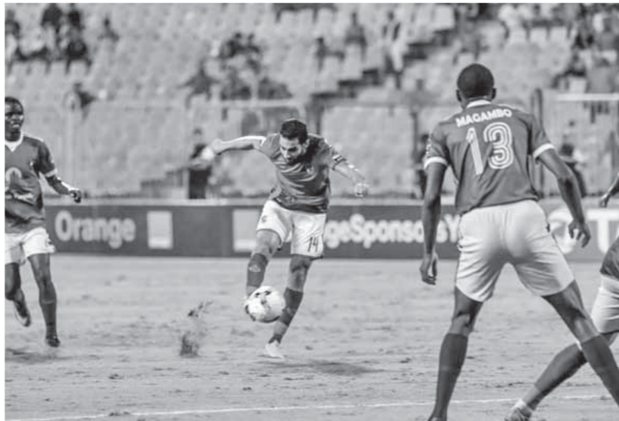
الأهلى تخلى عقبة كمبالا

وطلب الأهلي إرسال خطاب للاتحاد الإسكتلندى يبلغه بعدم قانونية إتمام الصفقة لوجود غرامة ضد اللاعب قدرها مليون و400 ألف دولار نتيجة هروبه وعدم التزامه بعقده.