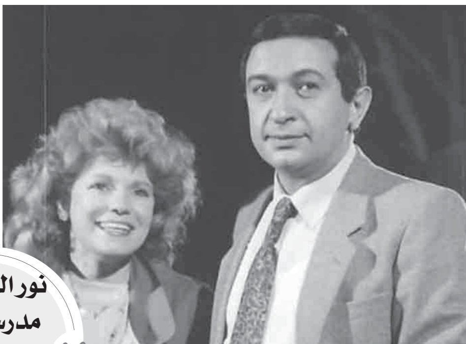
مشهد من فيلم «حاتم زهران»

في حياتي لكن بالفعل يظل فيلم «زمن حاتم زهران» هو الأكثر قرباً منى وبعده فيلم الصرخة، لأن لكل منهما واقعة كانت تعكس عمق علاقتى بصديقي الجوائز داخل وخارج مصر.