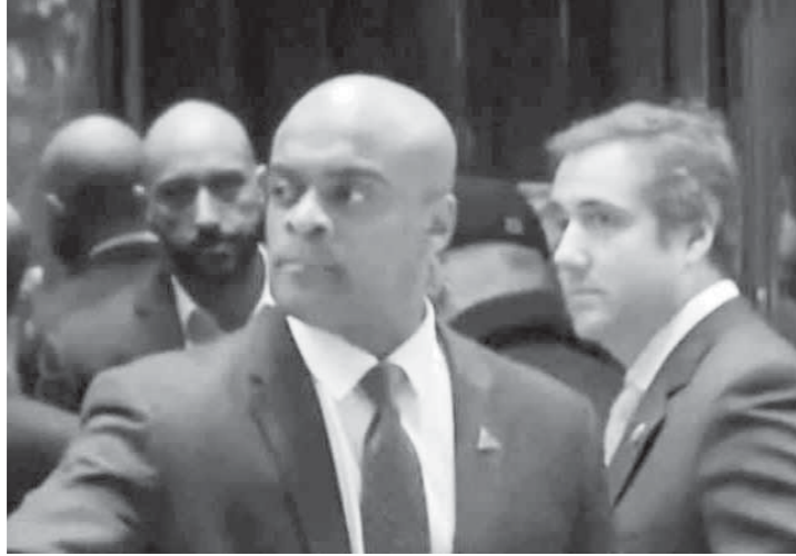
الريميحي بصحبة وفد يهودي في برج ترامب