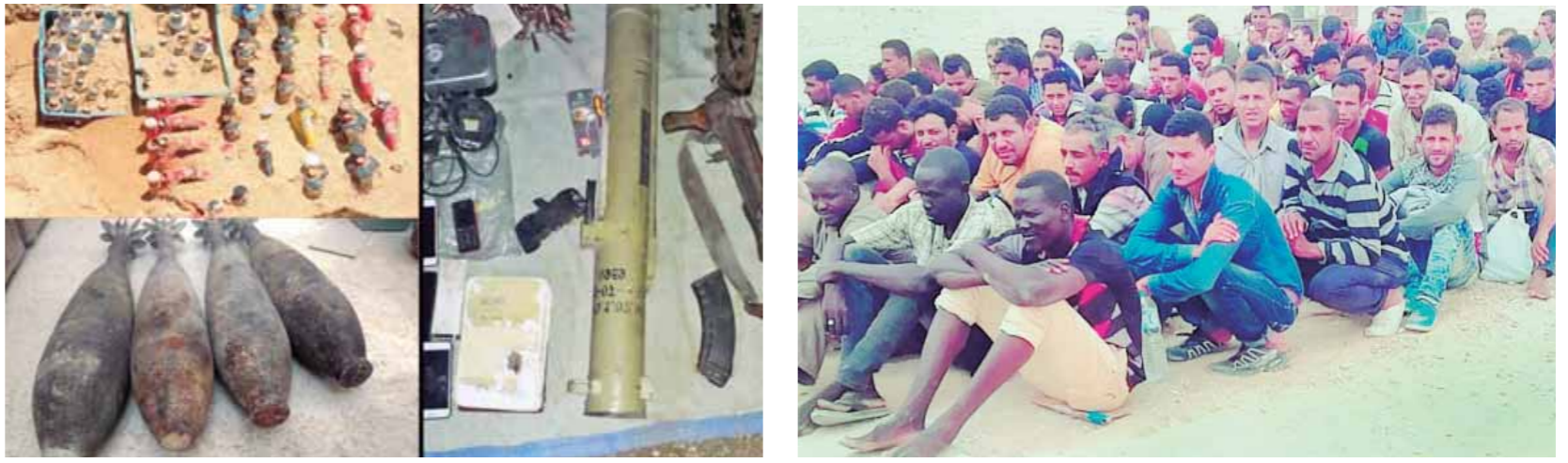
عدد من القبول عليهم لتحصين