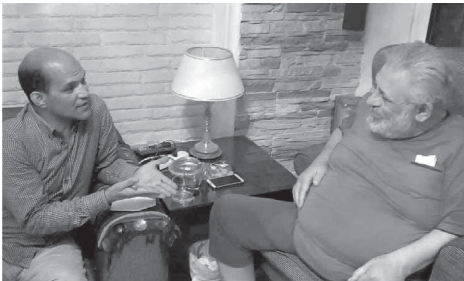
المخرج محمد النجار أثناء حديثه لـ «الوفد»