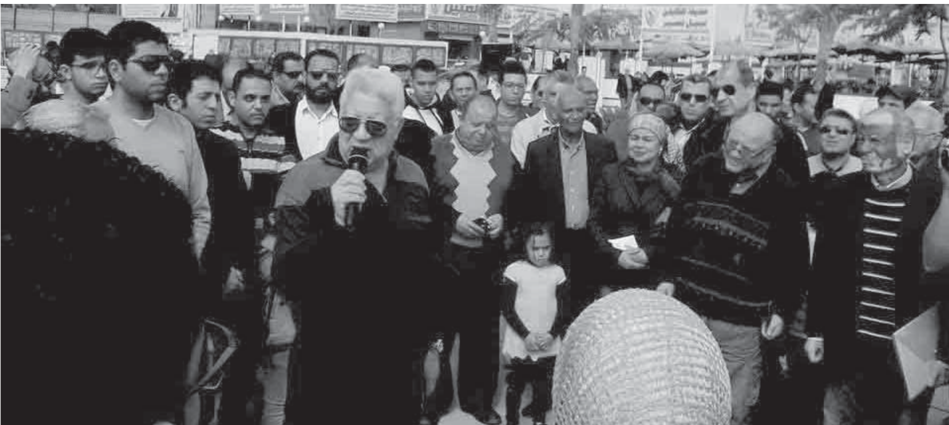
الجمعية العمومية للزمالك دائماً ما تكون حاشدة

وقال رئيس الزمالك إنه يتوقع أن تشهد الجمعية العمومية المقبلة للزمالك العادية وغير العادية، حضور ما لا يقل عن 25 ألف من أعضاء النادي من أجل المشاركة في جدول أعمال الجمعيتين وما يستجد من أمور باعتبار أن ذلك واجب عليهم وأنه يجب عليهم الوقوف بجوار ناديه ومجلس إدارته والتصدي لكافة محاولات التخريب التي تقوم بها فئة معروفة للجمع يخططون للعودة مرة أخرى رغم الكوارث التي تمت خلال تواجدهم والتي جعلت الزمالك يقعد الكثير من شعبيته وجهاميته.