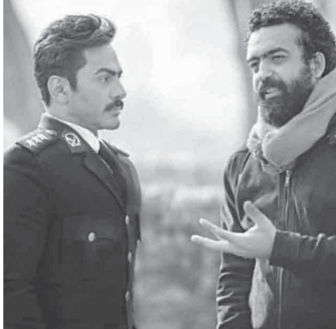
المخرج ماندو العدل أثناء كواليس العمل

ويسعدهم ويقدم لهم ما يريدونه، لأن فى النهاية لكل فنان جمهوره والعمل الجيد قادر على فرض نفسه، أعلم تماماً أن موسم العيد السينمائي شرس وتنافسى للغاية، ولكن هذا أمر طبيعى وكل ما يجب فعله هو الاجتهاد وتقديم أفضل ما لديك، وفى النهاية «اللَّهُ لَنْ