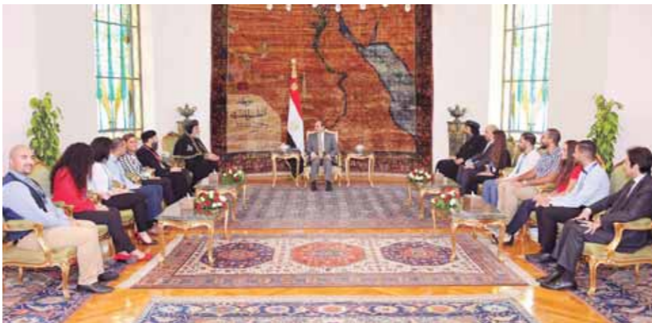
الرئيس السيسي خلال استقباله البابا تواضروس ووفد الكنيسة القبطية الأرثوذكسية

أعرب الرئيس عبدالفتاح السيسي عن خالص تقديره واحترامه للكنيسة المصرية تحت قيادة قداسة البابا تواضروس الثاني بابا الإسكندرية وبطريك الكرازة المرقسية كشخصية وطنية كان لها دور بارز خلال السنوات الماضية، مشيراً إلى اعتزاز مصر بأبنائها الأقباط وقهرها بما يقدمونه من إنجازات ونجاحات في الداخل والخارج، مؤكداً أن الوحدة الوطنية في مصر ثابتة على مدار الزمن، وأن أبناء شعب مصر يسلمهم ومسيحيهم جميعهم روابط قوية من الأخوة والمحبة، كما أكد السيسي كذلك أن مصر لا تتطر لأبنائها وفقاً لأي منظور سوى منظور وطني يعلى قيم المواطنة وعدم التمييز والتسامح والشراكة الكاملة في الوطن، جاء ذلك خلال استقبال السيسي، أمس، قداسة البابا تواضروس الثاني بابا الإسكندرية وبطريك الكرازة المرقسية، وبمصطفى وفد من ملتقى الشباب العالمي الأول للكنيسة القبطية الأرثوذكسية.