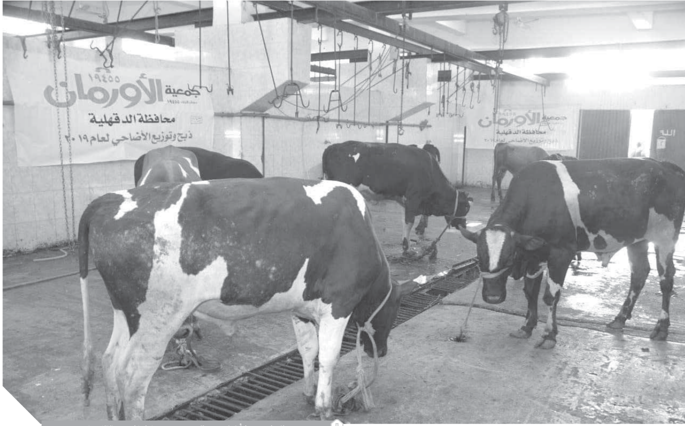
صك لحوم الأضاحي يتراوح من ١٨٠٠ إلى ٣٣٠٠ جنيهه

الأضحية هي أبرز سمات عيد الأضحى، ومنها اشتق العيد اسمه، وتشمل الأضاحى والأيل والبقر والضأن والماعز وهذا العيد ذو طابع خاص، حيث يأتي متزامناً مع فترة صعبة يعيشها المواطن في ظل أزمة كورونا.. الظروف الاقتصادية دفعت البعض إلى السعى وراء صك الأضحية وهو عبارة عن توكيل من المضحى لوزارة الأوقاف والجمعيات الخيرية، بشراء سهم في الأضحية والذبح عنه، اعتبرته دار الإفتاء المصرية جائزاً كنوع من الوكالة.. وتعد الجمعيات الخيرية ووزارة الأوقاف هي الأكثر خبرة في مجال الشراء لاعتمادها على أشخاص ذوي خبرة إلى جانب الشراء بأسعار أقل من التي يشتري بها المواطن أو التاجر. وشهدت صكوك الأضاحى هذا العام إقبالاً كبيراً من المواطنين لدرجة أن مديرية أوقاف القاهرة حققت قبل ٥ أيام من يوم العيد رقماً قياسياً غير مسبق في مشروع صكوك أضاحى الأوقاف، وحصلت على ٧٠٢٥ صكاً وهو أعلى بأكثر من ٥٠٠ صك عن نفس الفترة من العام الماضي.