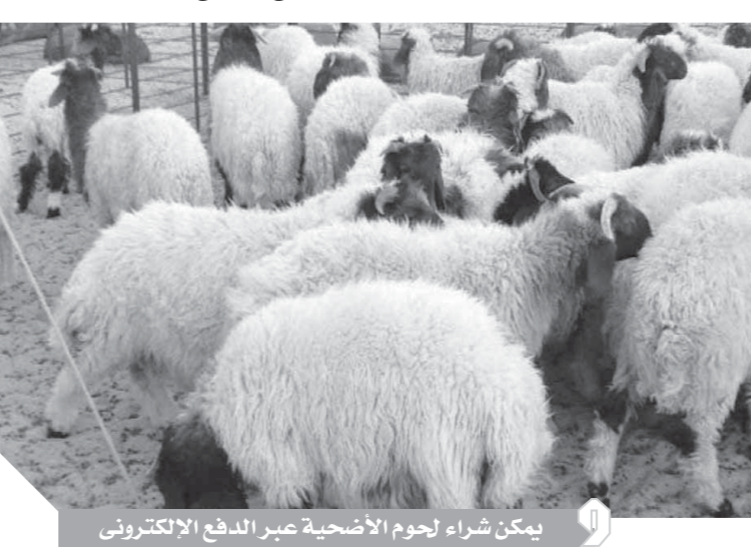
يمكن شراء لحوم الأضحية عبر الدفع الإلكتروني

وتفاصيل شراء صكوك الأضحية بها، ويصل سعر صك الأضحية مؤسسة بنك الطعام المصري للعجل البلدى إلى ٣٣٠٠ جنيه، بزيادة تصل إلى ٣٠٠ جنيه عن العام الماضى. أما سعر صك الأضحية للعجل المستوردة فبلغ ١٩٠٠ جنيه، بزيادة ٥٠٠ جنيهها عن العام الماضى ويبلغ وزن صك الأضحية للحوم الأورمان فتقدم صك الأضحية جنيهه ويبلغ نصيب الفرد من أضحية الصك البلدى ٩ كيلوجرامات، بعدما يقوم بالتواصل مع المؤسسة لتحديد موعد استلام الكيلوات الخاصة به ويمكن للفرد شراء الصك عن طريق رقم المؤسسة أو منافذ شركات المحمول. أما جمعية الأورمان فتقدم صك الأضحية هذا العام بلدى، وصك مستورد «صغير وكبير»، ويمكن تقسيط قيمة الصك، حيث يصل سعر صك الأضحية إلى ٢١٠٠ جنيه للعجل البلدى، وهو نفس سعر العام الماضى، أما سعر صك الأضحية فيبلغ ٢٥٥٠ جنيه للعجل المستورد الكبير، وهو نفس سعر العام الماضى وسعر صك الأضحية ١٩٥٠ جنيه للعجل المستورد الصغير، وهو نفس سعر العام الماضى، الصك البلدى (١٠٠٠) جنيه شهرياً لمدة ٥ شهور (٥ شهور)، ويبلغ النصيب الشرعى للفرد ٩ كيلوجرامات، أما الصك المستورد الكبير ٣٥٠٠ جنيهًا مقدم، و٢٦٠٠ جنيهًا شهرياً لمدة ٥ شهور. ويبلغ النصيب الشرعى للفرد ١٢ كيلوجراماً، أما الصك المستورد الصغير ٧٥٠ جنيهًا مقدم، و٢٤٠٠ جنيهًا شهرياً لمدة ٥ شهور ويبلغ النصيب الشرعى للفرد ٩ كيلوجرامات. وأيضاً يمكن شراء الصك لجمعية الأورمان من خلال فروع، أو مصرية، أو مصرية، أو من خدماتى، أو BEE أو من خلال جميع البنوك باسم جمعية الأورمان، أو عن طريق رقم المؤسسة. فيما يصل سعر صك الأضحية في مؤسسة