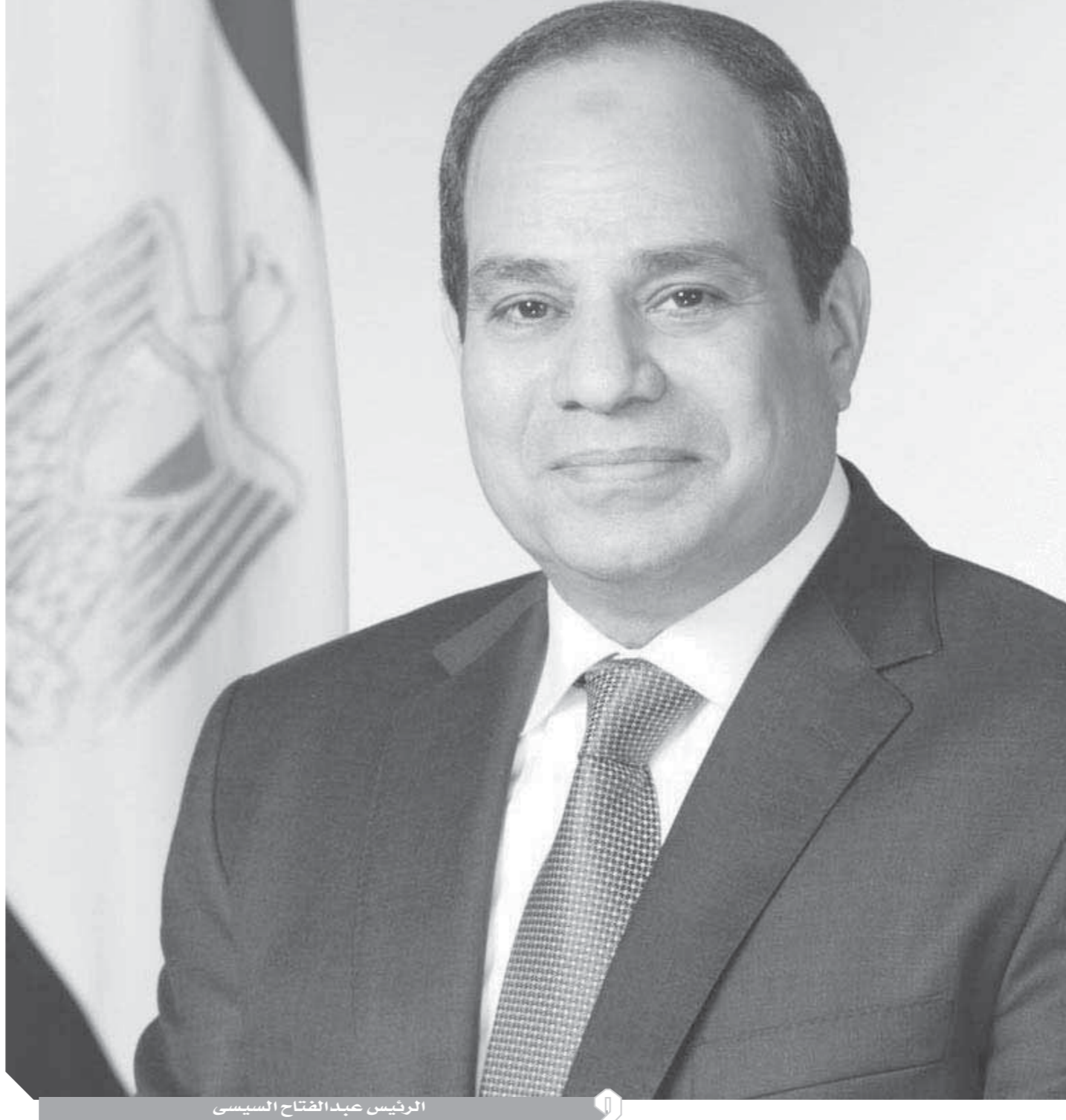
الرئيس عبدالفتاح السيسي

لذلك تمت تسمية الحديقة «حديقة الوحدة الوطنية»، لذلك هناك نداء لوزير الثقافة بالإشراف على المكتبة وعلى الكتب الموجودة خلال موطف من طرفها، لأن الفكرة حضارية وأتمنى تعميمها في كل محافظات مصر وهذا يدخل في الدور الاجتماعي والثقافي للوزارة إيناس عبدالدايم التي سوف يشهد لها التاريخ بدورها المميز برعاية الثقافة في مصر ومكافحة التعصب.