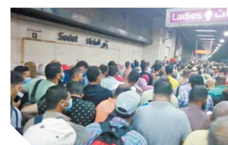
تكدس شديد في محطات الخط الأول

العطل، مؤكداً أنه على الفور انتقلت فرق الطوارئ إلى مكان العطل وتم إصلاح العطل وعودة حركة القطارات إلى طبيعتها مع الدفع بعدد قطارات فارغة من الركاب بعدد من محطات الخط الأول، وذلك لامتناص أى زحام ناتج عن التجمع على الشبكة الهوائية المغذية للمترو في محطة غمرة.