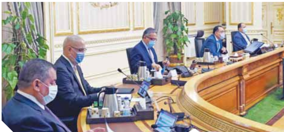
مجلس الوزراء خلال اجتماعه أمس برئاسة مديولى

في البيان الإعلامي الصادر بشأن فيروس «كورونا» المستجد بتاريخ ٢٧ يوليو الجاري. وأشارت الدكتور هالة زايد إلى أن مصر هي أول دولة في العالم تتجه في القضاء على فيروس سي، فيقول اليوم العلني للإنتهاء الكندي في ٢٨ يوليو، تحفل مصر بخلوها من فيروس سي، ومن جانبه قدم الدكتور محمد معيط، وزير المالية، عرضاً حول التدابير الأولية للبلاد المالي لعام المالي ٢٠١٩/٢٠٢٠. خلال اجتماع مجلس الوزراء وأشار وزير المالية، إلى أنه من المتوقع أن ينخفض قيمة الناتج المحلي الإجمالي بنحو ٢٠٢ مليار جنيه مقارنة بالناتج الذي نبيت على أساسها الموازنة ليحقق الاقتصاد المصري معدل نمو حقيقي قدره ٢.٨٪ في ٢٠٢٠/٢٠١٩ مقارنة بنحو ٢.٦٪ في تقديرات الموازنة، وذلك نتيجة التأثير لجائحة فيروس كورونا على النشاط الاقتصادي، منوها إلى أن جمهورية مصر العربية تعد من الدول المحدودة جداً التي استطاعت أن تحقق معدل نمو حقيقي موجب خلال عام ٢٠٢٠، كما أن معدل النمو المحقق بها يعتبر هو الأعلى على مستوى العالم.