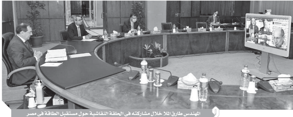
المهندس طارق الملا خلال مشاركته فى الحلقة النقاشية حول مستقبل الطاقة فى مصر

كتب - محمد بحيرى: أكد المهندس طارق الملا وزير البترول والثروة المعدنية أن الإصلاحات الاقتصادية والمالية المهمة التى تم تنفيذها خلال السنوات الخمس الماضية ساعدت على تخفيف آثار أزمة فيروس كورونا وأن أنشطة قطاع البترول لم تتوقف واستمرت رغم التحديات التى فرضتها الأزمة مع تطبيق الإجراءات الوقائية، مشيراً إلى نجاح قطاع البترول فى إنهاء ١٢ اتفاقية بحث واستكشاف عن البترول والغاز بالصحراء الغربية وشرق وغرب البحر المتوسط والبحر الأحمر، حيث وافق البرلمان مؤخراً على الاتفاقيات وجرى الأعداد للتوقيع النهائى مع الشركات الأجنبية الفائزة بالمنافق.