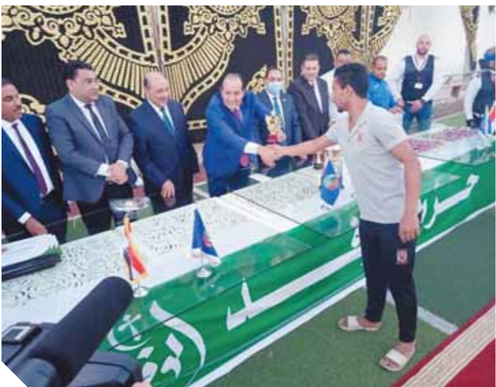
اللجنة العامة للوفد فى البحيرة أثناء تكريم المشاركين فى بطولة كرة القدم