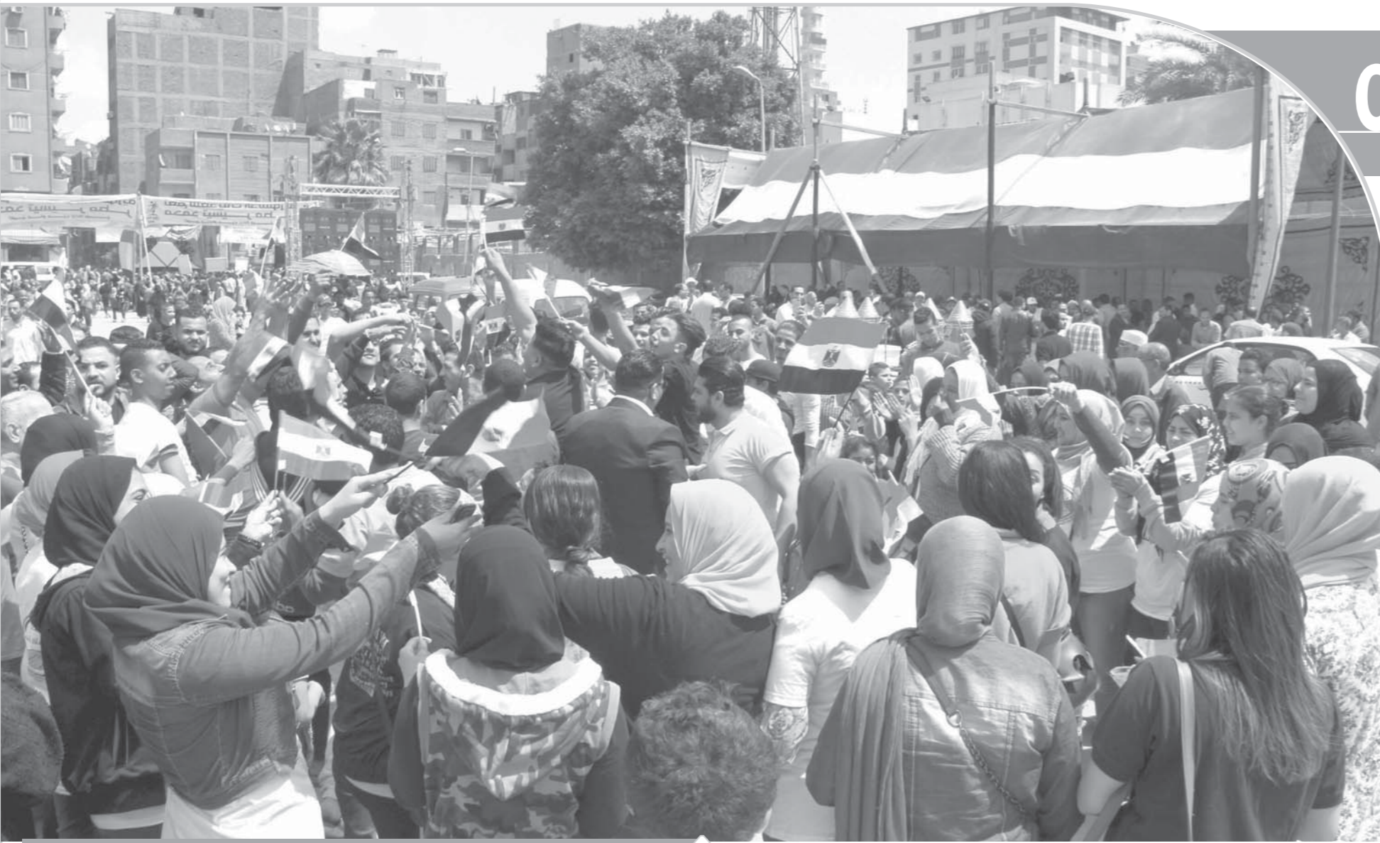
الاستفتاء على التعديلات الدستورية شهد مشاركة واسعة من المصريين