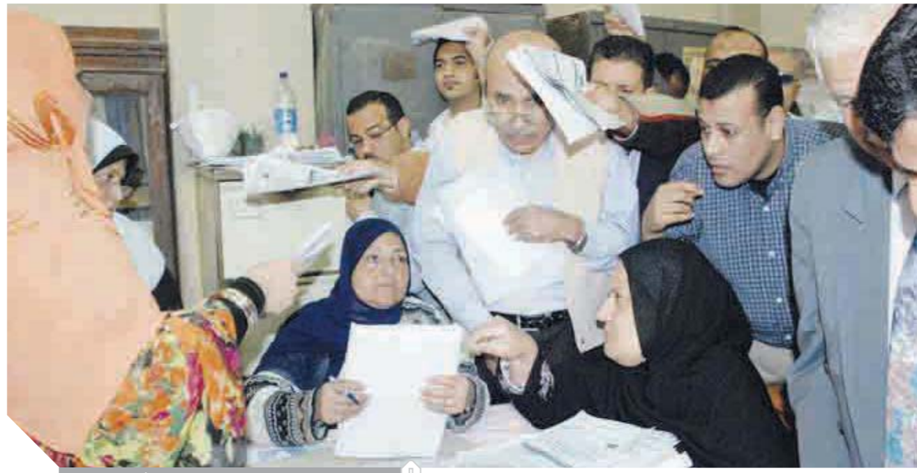
لا ضرائب جديدة على الموظفين - صورة أرشيفية

وأشار المركز إلى أنه وفقاً للبيانات المتاحة خلال عام ٢٠١٧ بالكاتب الإحصائى السنوى للسكان الصادر عن الأمم المتحدة، يضاعف عدد مصر لعدد فى قائمة الدول الأعلى فى نسب المطلق. وكشف المركز الإحصائى وشركة الأوبلر الفريد للمطبات فى مجال التصنيع الاجتماعى أن مشاركة جميع النجوم فى إعلانات حملة «الإيمان» تتم بشكل تطوعى ودون أى مقابل منهم، لإيمانهم بأهمية الحملة، ورغبة منهم فى حماية الشباب المصرى من مخاطر الإدمان وتعاطى المخدرات.