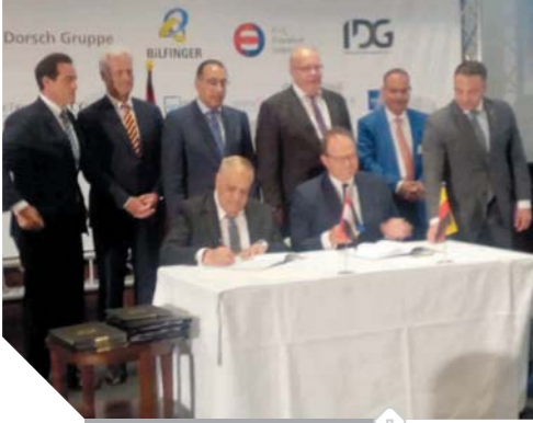
جانب من توقيع الاتفاقيات

كتب - محمد صلاح وابوزيد كمال وسامية فاروق: