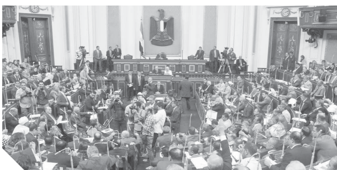
مجلس النواب لعب دوراً بارزاً في إقرار تشريعات وقوانين حققت أهداف ثورة ٣٠ يونيو

كما شمل حصاد البرلمان التشريعي إقرار عدة قوانين من بينها قانون ذوى الإعاقة والمجمعات العمرانية، وتنظيم السجون والشركات المساهمة وشركات الشخص الواحد، التي تدعم الاستثمار وفتح آفاق جديدة له، وإنشاء الهيئة القومية لسلامة الغذاء، وزيادة المعاشات وتعديل بعض أحكام قوانين التأمين الاجتماعي، وتعديل بعض أحكام القانون رقم ١٢ لسنة ١٩٧٦ بإنشاء هيئة المحطات النووية لتوليد الكهرباء، ومشروع قانون الحكومة بإنشاء الجهاز التنفيذي لإدارة مشروعات إنشاء المحطات النووية، ومشروع قانون