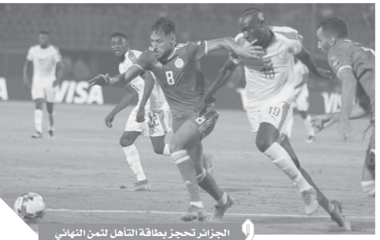
الجزائر تحجز بطاقة التأهل لثمن النهائي

السنغال «العنيد» ورفضت الطموحات، عودة الروح القتالية التي غابت عن المحاربين طوال سنوات ماضية، مصحوبة بجماعية والهجومى. منتخب الجزائر أثبت أنه لا يستقر إلا عندما يلعب مع الكبار- رغم تجاهل الحكم الزامى سيكاזורى ضربة جزاء صحيحة للسنغال في الشوط الثاني- بعد أن تم « فرم» سايدو مانى من مدافع الجزائر لكن الأداء في مجمله كان لصالح الخضر لعباً ونتيجة.