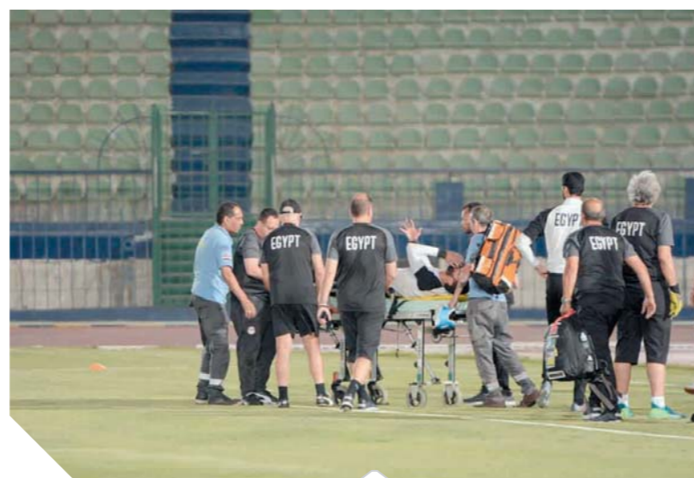
أثناء خروجه من الملعب

الأفريقي التي تمنع الاستبدال. وتواصل لجنة الإصابات مطاردة حراس الفراثة في الكان، بعدما تعرض المنتخب المصري لموقف مشابه في النسخة الماضية من أمم أفريقيا بالجابون. وتعرض شريف إكرامى للإصابة في تدريب الفراثة قبل المباراة الافتتاحية أمام مالي، وبعد مرور دقائق من اللقاء أصيب الحارس الأخر أحمد الشناوي، وتم استبداله بعصام الحضري، الذي كان الحارس الثالث في حسابات جهاز الفراثة. وفي المباراة الثانية للمنتخب المصري