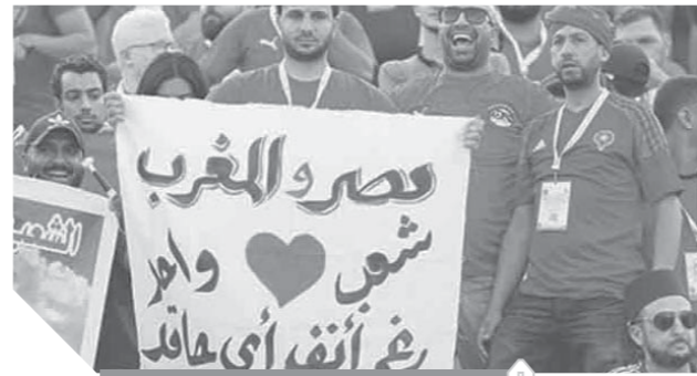
الجماهير المغربية يعلب السلام

رفعت جماهير المغرب ومصر التي تواجدت في مدرجات ملعب السلام، لافتة مكتوباً عليها «مصر والمغرب شعب واحد رغم أنف الحاقدين» كما تواجد علم مصر بجوار العلم المغربى، في المدرجات، خلال مازرة أسود الأطلسى أمام كوت ديفوار في المباراة التي انتهت بفوز المغرب بهدف دون رد. وتصدر أسود الأطلسى المجموعة الرابعة، برصيد ٦ نقاط، في حين جاء المنتخب الإفوارى في المركز الثاني برصيد ٢ نقاط، خلفه المنتخب الجنوبى أفريقى بنفس عدد النقاط، ومنتخب مائيبيا، متديلاً المجموعة بدون رصيد.