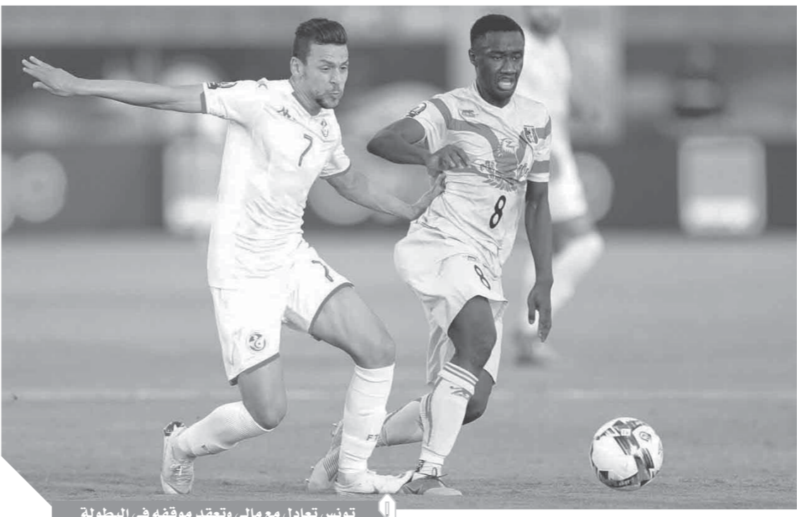
تونس تعادل مع مالى وتمتد موقفه في البطولة

حافظ المنتخب المالى على حظوظه الكبيرة في التأهل للدور ثمن النهائي ببطولة كأس الأمم الإفريقية، عقب التعادل مع نظيره التونسي، بهدف لكل فريق، ضمن منافسات الجولة الثانية بالمجموعة الخامسة، التي تستضيفها محافظة السويس. ورفعت مالى رصيدها إلى ٤ نقاط، في صدارة المجموعة، بتعادلهما مع نسور قرطاج والنور على موريتانيا في الجولة الأولى، بينما نالت تونس النقطة الثانية لها بالتعادل مجدداً، مما يزيد موقف الفريق تحديداً. وظهر نسور قرطاج بمستوى أفضل من المباراة السابقة أمام أنجولا، بعدما تخلى الفرنسي آلان جيريس المدير الفني للفريق عن فكرة تغيير مراكز اللاعبين، وخاض اللقاء بتشكيل متوازن، إلا أنه فشل في تحقيق الفوز الأول له في البطولة. وأبدى جيريس ارتياحه من تجنب فريقه الخسارة من مالى، قائلاً: «نحن راضون لعدم خسارتنا، ولا يجب أن نكتفى بنتيجة التعادل وعلينا السعي لتحسين فرص التأهل في المباراة المقبلة».