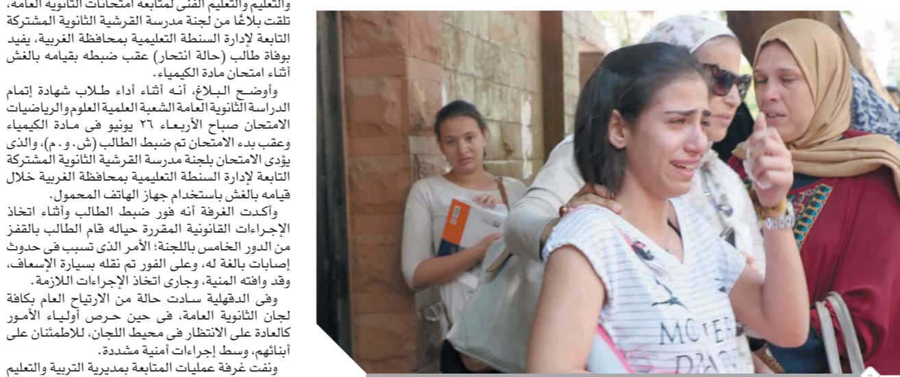
الخدمة - التفاضل والتكامل، على وجود الطالبات

والتعليم والتعليم الفنى لمتابعة امتحانات الثانوية العامة، تلقت بلاكاً من لجنة مدرسة القرشية الثانوية المشتركة التابعة لإدارة السطة التعليمية بمحافظة الغربية، يفيد بوقوع حالة (حالة انتحار) عقب ضبطه بقيامه بالبحث أثناء امتحان مادة الكيمياء.