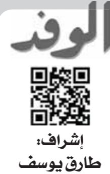
إشراف: طارق يوسف