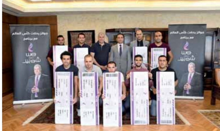
الفائزون برحلات روسيا