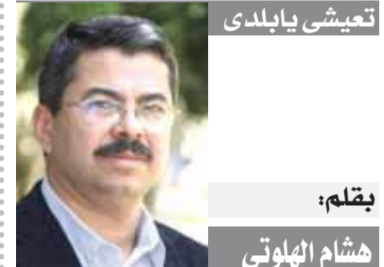
بقلم: هشام الهلوتي

لا أظن أن حكومة إسرائيل ستقدم على اقتحام رفح في القريب العاجل أو المتأخر بعد اندلاع مظاهرات الطلبة في الجامعات الأمريكية خوفا من تزايد مظاهرات الطلبة في الجامعات الأمريكية.