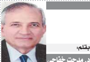
بقلم: د. مervat حجاجي

طالما تحدثت قدمت أعمالا قوية، وعندما أوافق على عمل أهم شيء، أن أرى عوامل النجاح، وهو ما شاهدته