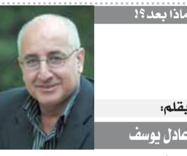
بقلم: عادل يوسف

وقال رئيس مهرجان الإسكندرية: «معتاداً تحدياً فقررتنا الاستعانة بطريق الاستعانة بالفنان أحمد السقا إلى جانب مشاركة الخيالة العرب في عروض توعوية تجسد قصص الفروسية العربية والبطولات فيها، إلى جانب تشييد متحف الفروسية المصرية الذي تقدمه الرئيس عبد الفتاح السيسي رئيس الجمهورية لتاريخ الفروسية المصرية منذ عهد الفرعانه وصولاً إلى العصور المختلفة.