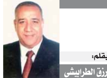
بقلم: رزق الصرايشي