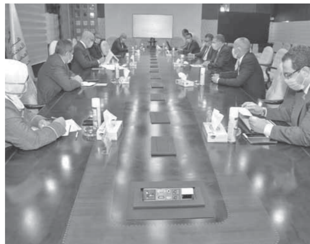
وزيرا الإسكان وقطاع الأعمال يبحثان التعاون المشترك بين الوزارتين بحضور قيادات الإسكان وقطاع الأعمال