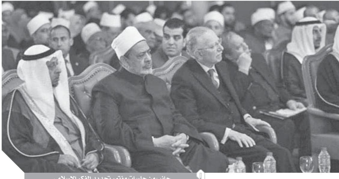
جانب من جلسات مؤتمر تجديد الفكر الإسلامي