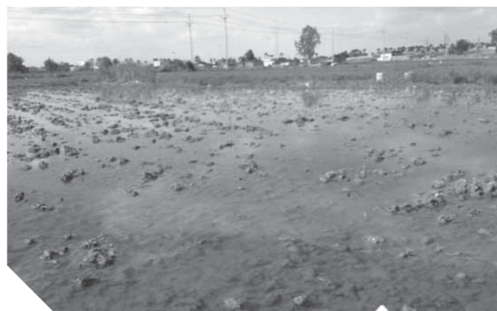
الجارى تحاصر أهالى الدوار