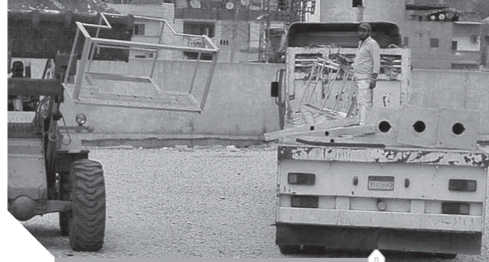
العصاوجي بلا خدمات