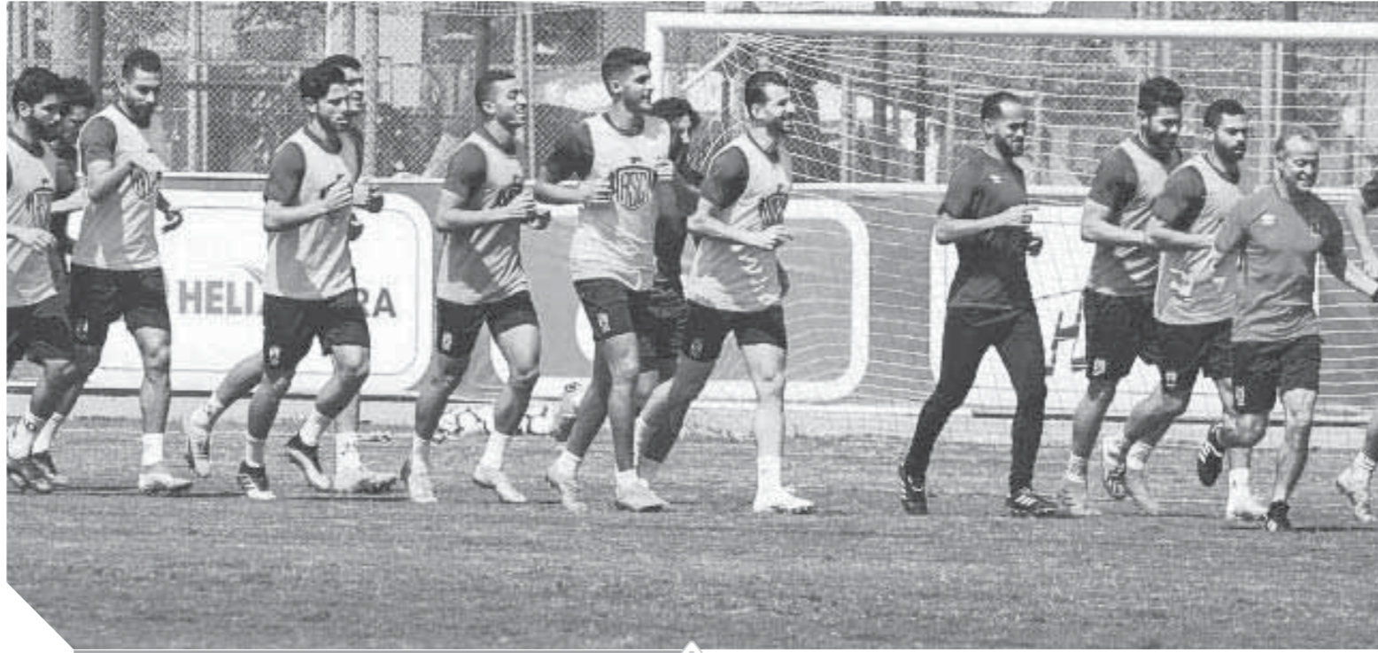
جديدة وإصرار في تدريبات الأهلي