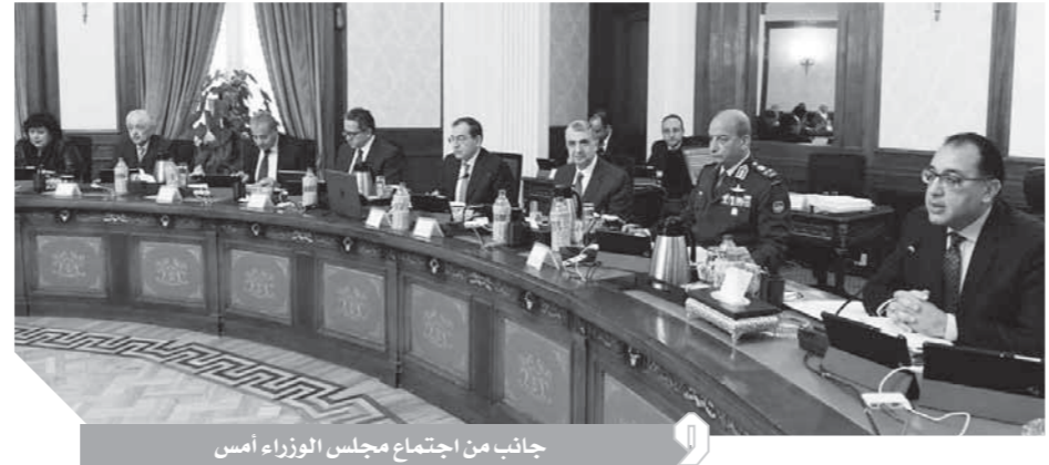
جانب من اجتماع مجلس الوزراء أمس

كتب - عبدالرحيم أبوشامة وأحمد دراز وشيرين عجمي: وجه الدكتور مصطفى مدبولي، رئيس مجلس الوزراء، خلال اجتماع الحكومة الأسبوعي أمس، كلا من المستشار عمر مروان، وزير العدل، والمستشار محمد عبدالوهاب، رئيس الهيئة العامة للاستثمار والمناطق الحرة، بمراجعة كل قرارات لجنة فض منازعات الاستثمار، وحضر القرارات التي لم تنفذ، للعمل على سرعة تنفيذها وبدء تنفيذها على الفور، مشيراً إلى أن تطبيق هذه القرارات يسهم في تحسين مناخ الاستثمار في مصر، وإعطاء صورة إيجابية عن أن الدولة تنفذ قراراتها التي تنهت في حل مشكلات المستثمرين. وأهل رئيس الوزراء الجهات المعنية بعد أقصى أسبوعين لتطبيق القرارات، وفي حالة وجود إشكاليات المودة للمجلس.