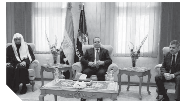
الضريق ربيع يستقبل النائب العام ونظيره السعودي