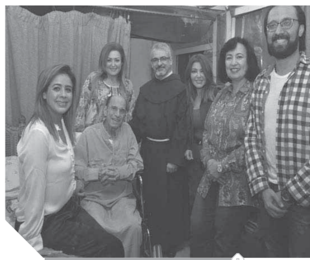
الموسيقار جمال سلامة في المستشفى