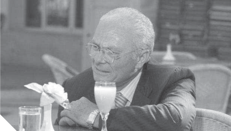
يوسف فوزي في مشهد من مسلسل أوبرا عايدة

في قمة مجدها في ٦ أفلام أبرزها «عصر القوة» ومهمة في تل أبيب، و٢٤ ساعة في إسرائيل، وشبكة الموت»، كما وقف أمام الزعيم عادل إمام في «حتى لا يطير الدخان» ١٩٨٤ وحضفى الأبهة، ١٩٩٠. كان يوسف فوزي حريصاً على تطوير أدائه الفني والتوسع في اختياراته؛ لذا تواصل مع النجوم الجدد الذين برزوا في فترة التسعينيات مثل محمد سعد وأحمد حلمي وهاني رمزي ورامز جلال، وقدم معهم مجموعة من الأفلام المهمة مثل «اللمبي ٨»، «جيجا»، «وغش الزوجية»، و«طرف طارق»، و«الشبح».