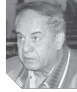
د. نبيل توفيق بباوى يكتب: