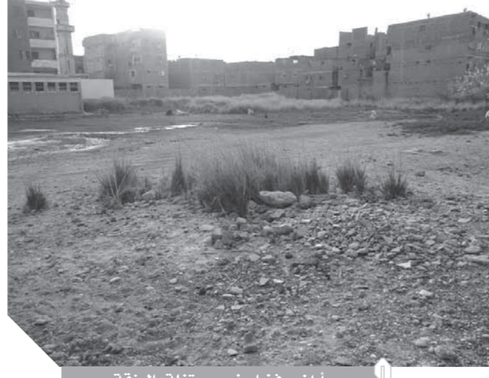
أراضي فضاء غير مستغلة بالرزقة

الرحمانية قائلاً: مشكلة المشكلات الصرف الصحي الذي يمر من أمام المدارس وحلّة صهرج المياه والذي يضر بصحة تلاميذ وأبناء الصهرج نتيجة التمامة المتواجدة بالصرف والتي قد تسبب أيضاً تطفل وانسداد مجرى المياه بالصرف، والبنية التحتية للقرية متهاكلة سواء ماسير صرف صحي أو ماسير مياه الشرب وبنية نتيجة لتوقف العمل بحلّة الصهرج يتم ضخ المياه مباشرة بالماسير.