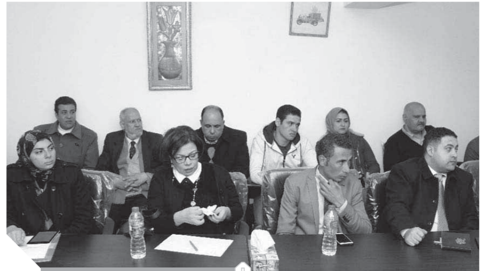
جانب من الحضور خلال الندوة