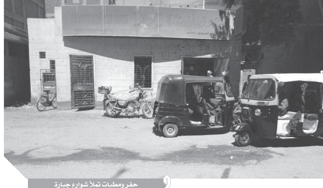
حضر ومطبات تملأ شوارع جبارة