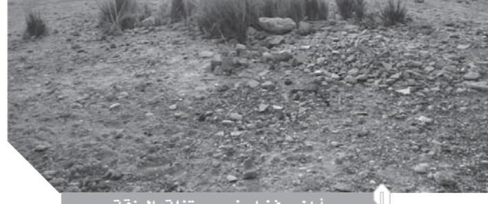
أراضي فضاء غير مستغلة بالرزقة

قروي بخاس لا توجد به مدرسة ثانوية حتى الآن، ما يضطر أبناء القرية والقرى التابعة لها، للجوء لمدارس القرى الأخرى، كمدرسة الكبح الثانوية التابعة لمركز نجع حمادى، والتي تبعد عن القرية بأكثر من ١٢ كيلومتراً، في حين يلجأ