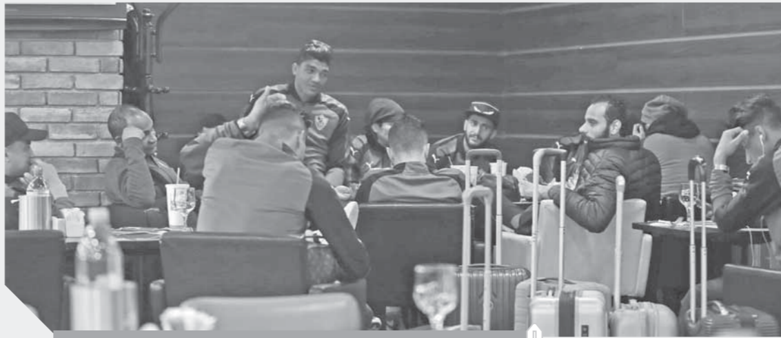
لاعبو الزمالك في المطار خلال رحلة السفر الطويلة

كاشفا عن أن قيد احمد عيد ومحمود عبد الرحيم جنبش في القائمة الإفريقية بمثابة إضافة للفريق. وطالب كارتيرون اللاعبين الذين تقرر سفرهم مع الفريق باستغلال الفرص في ظل غياب مجموعة كبيرة من التشكيلة الأساسية وتقديم عرض قوى وتحقيق نتيجة ايجابية وأن عليهم استغلال الفرصة لإثبات وجودهم بين صفوف الفريق والمنافسة مع باقي زملائهم في الفترة القادمة ، في ظل غياب طارق حامد وفرجاني ساسي ومحمد عبد الشافي ومحمود شيكابالا ومحمود علاء ومحمد أبو جبل وحازم إمام.