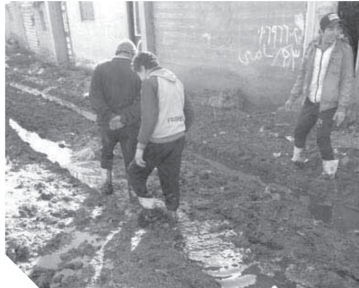
شوارع الفقى تفرق في مياه الصرف