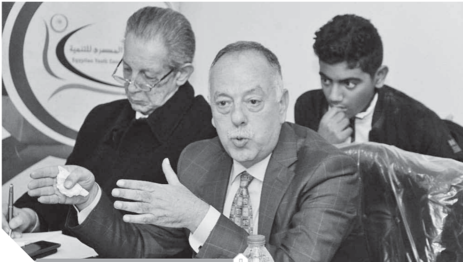
النائب جمال الشريف يتحدث في الندوة