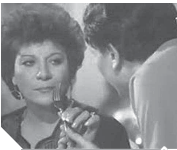
عايدة عبدالعزيز في مشهد من فيلم النمر والأثني