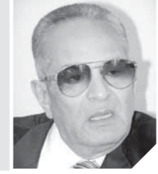
بهاء الدين أبوشقة