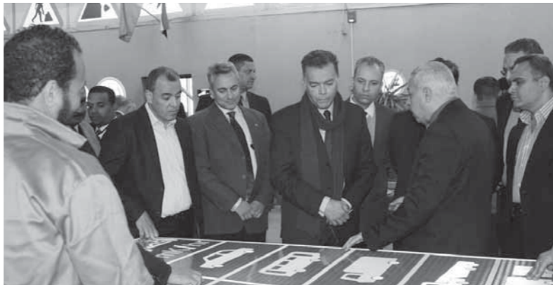
وزير النقل يتفقد ماكيت التطوير

المختلفة، وإلى أهمية البعد الاقتصادي له؛ حيث يوفر المصنع ما يقرب من 50 مليون جنيه للدولة، وهو مبلغ فرق السعر من القيمة السوقية إذا اشترته الدولة، بالإضافة إلى الدخل الإضافي من خلال تصنيع اللوحات للجهات الخارجية، سواء مؤسسات أو أفراداً. يذكر أن المصنع تم إنشاؤه عام 1990م