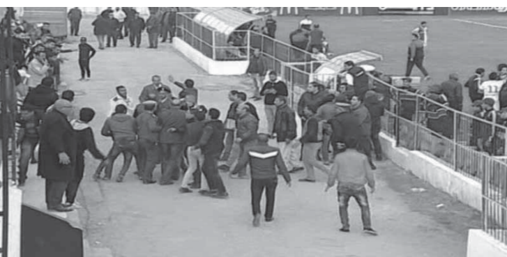
شغب الجماهير يعود للاعب من جديد