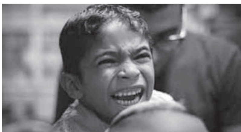
الطفولة البريئة تضيق وسط الطلاق