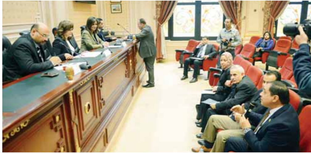
اجتماع لجنة السياحة والآثار بمجلس النواب

عقوبة سرقة الآثار بحيث لا تقل عن مليون جنيه بالإضافة للسجن المؤبد لكل من شكل عصابة تستهدف سرقة وتهريب الآثار، وأقرت التعديلات بتفعيل إجراءات سريعة تكفل حماية المواقع والأراضي الأثرية، وتشمل إيقاف أعمال التعدي في مهدها بقرار وزاري، وشدد القانون على آلياته إلى حد يصل لمرحلة تحول دون إزالة البنيان بناء على الدراسات والتقارير الأمنية في هذا الشأن، نظراً لما تستغرقه الإجراءات من مراحل تهدر مزيداً من الوقت يكون خلاله المتعدى قد وصل بتعبه لمرحلة تصعب معها الإزالة، كما تقرر التعديلات إلزام كل الجهات المعنية بعدم منح تراخيص مرافق أو غيرها للأعمال الناتجة عن التعدي مع عدم الإخلال بالمقويات المنصوص عليها في القانون لإحباط أي تعد على التراث الحضاري للبلاد.