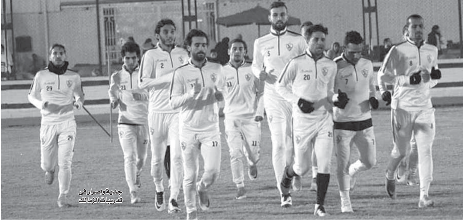
جديدة وأصراف في تدريبات الزمالك