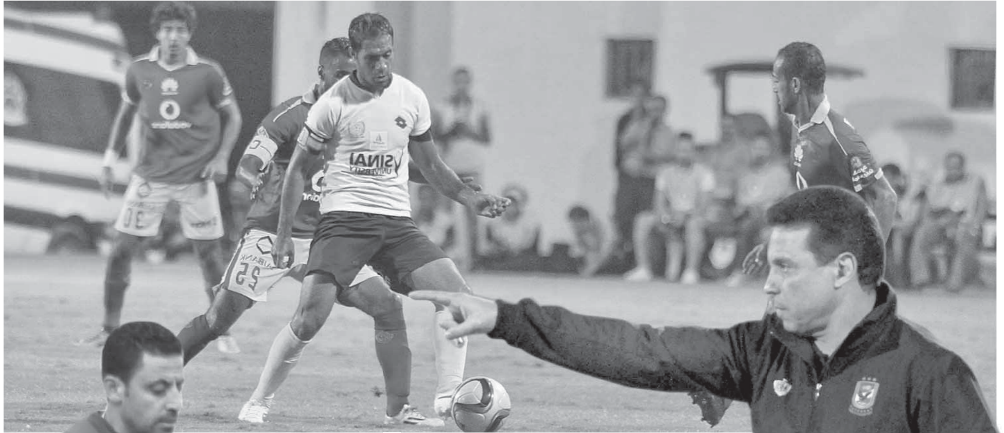
الأهلى يبحث عبورا للإسماعيلي