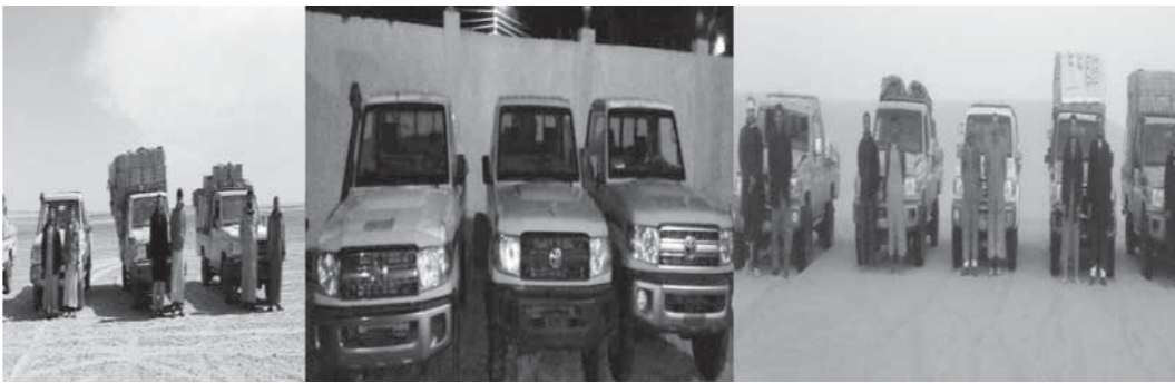
سيارات الدفع الرباعي المضبوطة

فرداً من المهربين، وجر اتخاذ الإجراءات القانونية حيالهم، وضبط 12 فرداً أثناء محاولات التسلل والهجرة غير الشرعية عبر الحدود الغربية. كذلك ضبط مركب صيد بمنطقة التصير بالبحر الأحمر عثر بداخله على 300 لفافة نبات البانجو المخدر.