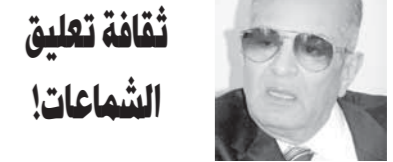
ثقافة تعليق الشماعات!