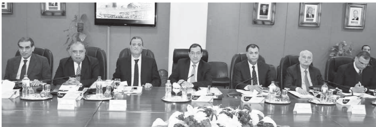
«الملا» خلال اجتماع الجمعية العامة لشركة بلاصيم

وان العام المالي الجديد سيشهد الاستثمار في تلك الإجراءات للوصول إلى أفضل النتائج. وأشار إلى أن خطة العمل تستهدف حفر 20 بئراً للزيت الخام في منطقة أبورديس جنوب سيناء بالإضافة إلى أنشطة صيانة الآبار وتحسين كفاءة تسهيلات الإنتاج بالمنطقة والتي تهدف للحفاظ على معدلات الإنتاج البتروولي منها.