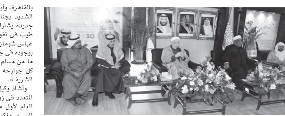
جانب من الجناح السعودي

ووقعت الكاتبة السعودية الدكتورة بسمة السيوبي أحدث إصداراتها تحت عنوان «يوميات مع حلمات» بالصالون الثقافي للجناح السعودي بحضور المحلق الثقافي لسفارة خادم الحرمين الشريفين بالقاهرة الدكتور خالد بن عبدالله التامي، وعدد من رواد الجناح؛ حيث عبّرت «السيوية» عن سماتها البالغة للمشاركة في جناح المملكة، وأن معرض القاهرة للكتاب هو إحدى المنارات الثقافية العربية والعالمية.