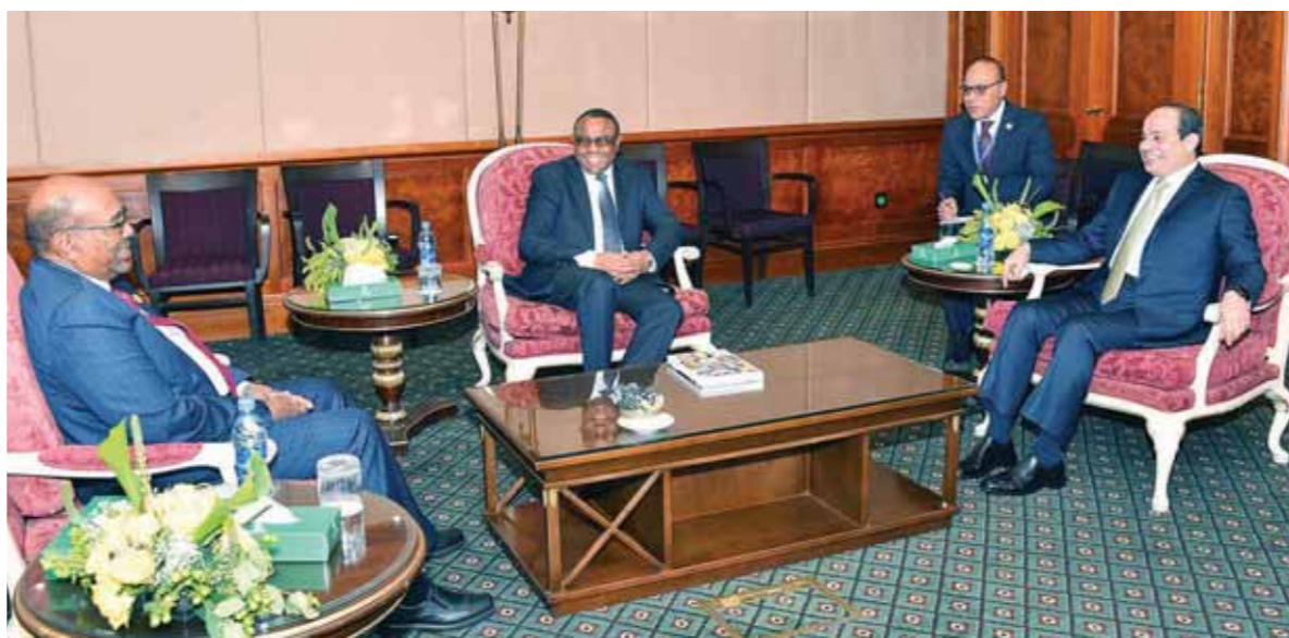
قمة ثلاثية بين «السيسى»، و«البشير»، و«ديسالين» اتسمت بالروح الإيجابية

وأضاف المتحدث الرسمي بأنه تم الاتفاق خلال القمة على عقد اجتماع مشترك يضم وزراء الخارجية والرى من الدول الثلاث واللجنة الوطنية الثلاثية، ورفع تقارير نهائية خلال شهر تتضمن حلولاً لكل المسائل الفنية والعلاقة، بما يضمن التنفيذ الكامل لأحكام اتفاق إعلان المبادئ وعدم التأثير سلباً على مصالح مصر والسودان المائية، كما تم الاتفاق على تبادل الدراسات الوطنية والمعلومات الفنية بين الدول الثلاث. وذكر السفير بسام راضى، إن الرئيس أكد ضرورة أن تتحلّى المفاوضات بالروح الإيجابية والحفاظ على المصالح المشتركة، معلناً جميع المسؤولين المعنيين بالمفاوضات من الدول الثلاث بتفويضات القادة وإحجاز عملهم وفق الإطارات المحدد. كما أكد رئيس الوزراء الإثيوبي خلال المحادثات أن المزارعين في مصر والسودان لن يتأثروا سلباً بسد النهضة، مؤكداً أن عدم الإضرار بمصالح شعوب الدول الثلاث هو الأساس الذي تنطلق منه المفاوضات، ومن جانبه، أعرب الرئيس السوداني عن عزم