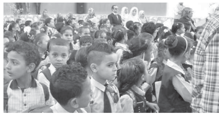
استئناف الدراسة، السبت،

والثقافية على مستوى الكليات والجامعة خلال الفصل الدراسي الثاني. وأضاف أن صندوق التكافل الاجتماعي بالجامعة سيقيم بيحث التطلبات التي تقدم إليه لسداد الرسوم الدراسية للطلاب الذين لم يسددوها وفقاً لحالتهم، مشيراً إلى أن ما يقرب من 80% من نتائج الامتحانات تم إعلانها بالفعل للطلاب ويبدأ الفصل الدراسي الثاني بالجامعات على مستوى الجمهورية، وسط تأمين للولايات من خلال شركة فالكون للتأمين والحراسة، المسؤولة عن تأمين بعض الجامعات ويتنقد العمداء تقفدوا سير المحاضرات بيوم الدراسة الأول وبدأت الكليات في إعلان نتائج الامتحانات وتم التشديد على عدم التهاون في مواجهة أي خروج عن الأعراف الجامعية. وتم وضع خطة متكاملة وقوية لتأمين الحرم الجامعي بالتعاون مع شركة فالكون والأمن الإداري. وأعلن المجلس الأعلى للجامعات، أن الأسبوع الأول من الدراسة أفر فرصة أمام الجامعات لإظهار النتائج. وأعلنت وزارة التربية والتعليم أن المدارس استعدت لاستقبال الفصل الدراسي الثاني والكتب الجوهرية، وصلت المديرات التعليمية بنسبة 95%، مشيراً إلى أن نسبة الطباعة في جميع المناهج والكتب الدراسية لجميع الصفوف بلغت نسبة الـ99% مؤكداً أن الوزارة تسعى إلى وصل جميع الكتب المقررات إلى المدارس والمديريات خلال الأسبوع الأول من بدء الترم الدراسي.