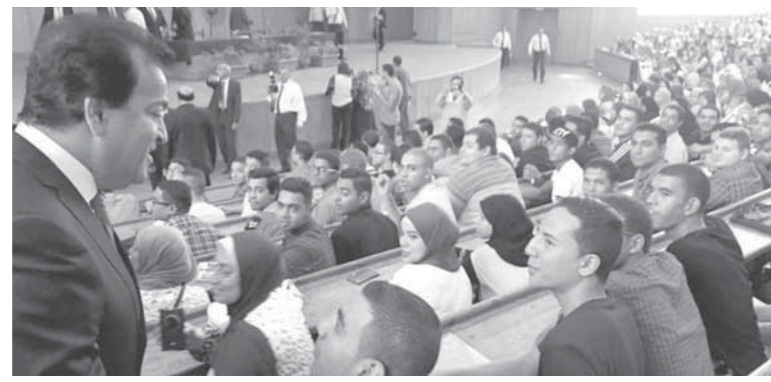
وزير التعليم، في جولة تفقدية- صورة أرشيفية

مع حصر الفوائت التي تأتي على الجامعة بناء على هذا الأمر، وتم إعداد برنامج للأنشطة الطلابية الرياضية والفنية