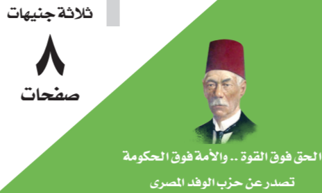
الحق فوق القوة .. والامة فوق الحكومة تصدر عن حزب الوفد المصري