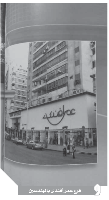
فرع عمر أفندي بالمهندسين