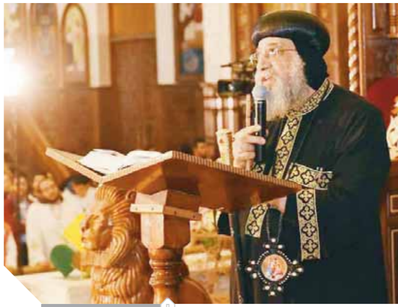
البابا تواضروس الثاني

ترأس قداسة البابا تواضروس الثاني بابا الإسكندرية - بطريرك الكرازة المرقسية التسبحة الكيهيكية الشبابة «سينرجيا 2» مساء أول من أمس الخميس - بالكاتدرائية المرقسية بالعياضية، بحضور نحو 5 من أساقفة المجمع المقدس، وعشرات الكهنة، وآلاف الشباب. وكشفت الكاتدرائية من إجراءات التفتيش على بوابتها الرئيسية، في حين حددت الدخول لطلاب الجامعة، والشباب حتى سن 30 عاماً. ورفع البابا تواضروس الثاني صلوات بخور باكر عقب انتهاء تسبحة كيهك، فيما انطلقت الزغاريد في محيط الكاتدرائية تزامناً مع «أمح في البتول»، وحرص البابا على التقاط الصور التذكارية مع الشباب. وتضمنت عظة البابا تواضروس التي ألقاها خلال التسبحة الكيهيكية 4 رسائل للشباب من إنجيل «لوقا» بتلورت