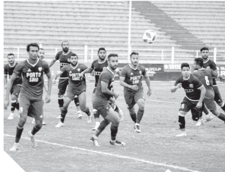
بورتلو السويس اوقف انطلاق سيرايمكا كلبوترا