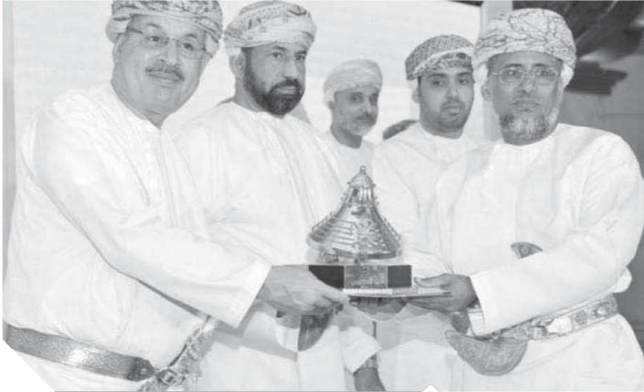
المسابقة السنوية تحظى باهمية كبيرة