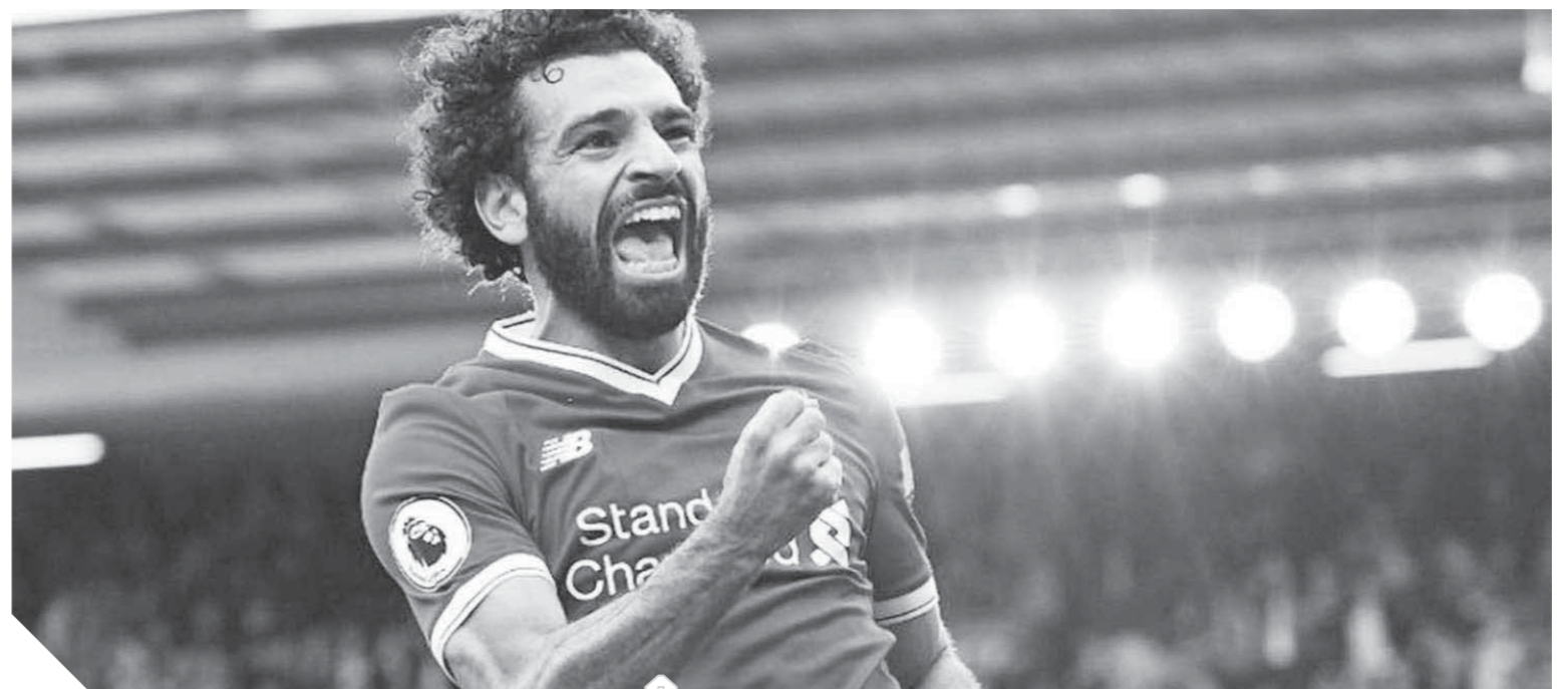
صلاح يسعى للتهديف أمام الأرسنال اليوم