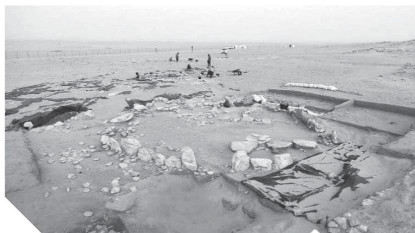
الموقع الأثري على الساحل الشمالي لخليج الكويت

أبلغ علماء الآثار العاملون في دولة الكويت عن اكتشاف مذهل في موقع «بحرة 1» الأثري على الساحل الشمالي لخليج الكويت، قد يغير المفاهيم السابقة بشأن بداية الحضارة الإنسانية المتطورة. وأعلن فريق علماء الآثار برئاسة البروفيسور بيوتر بيلينسكي، من المركز البولندي لعلم الآثار المتوسطي (PCMA) في جامعة وارسو، والذي تضمن عالمي الآثار الكويتيين سلطان الدويش وحفيد المطيري، عن اكتشافهم «مدينة المعبد» التي يبلغ عمرها 7500 عام. وحسب موقع «سبوتنيك الروسي» عثر العلماء على معبد جديد وساحة عامة، ما يشير إلى وجود مجتمع متقدم في تلك الفترة الزمنية، حيث كانت حضارة عبيد، التي لا يعرف عنها سوى القليل، تضم أول مستوطنين زراعيين انتقلوا إلى المنطقة التي أصبحت فيما بعد تعرف باسم «سومر» في المنطقة الجنوبية من بلاد ما بين النهرين القديمة.