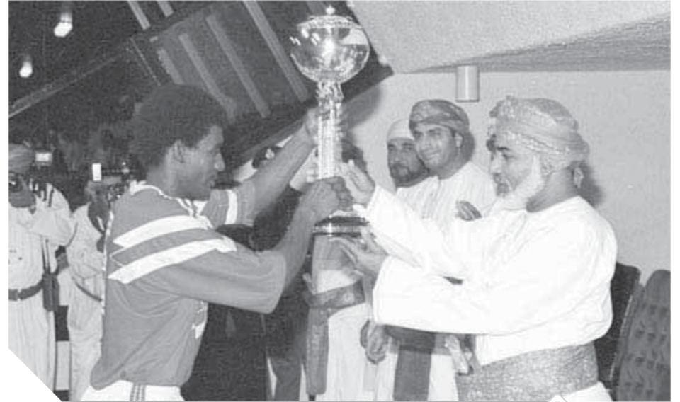
السلطان قابوس بن سعيد يكرم الشباب والرياضيين المتفوقين في مختلف المجالات