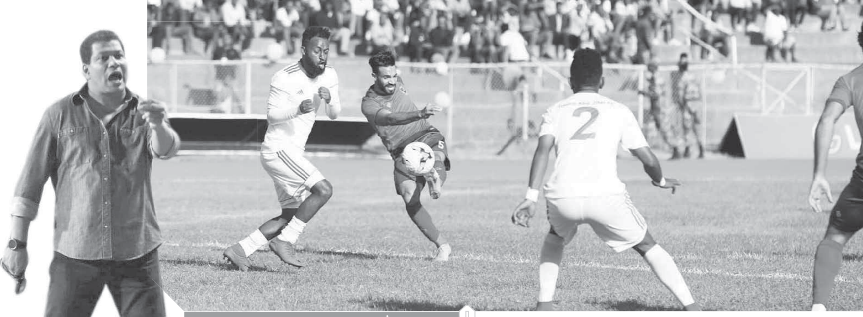
الاهلي يسعى لعبور عقبة الداخلية