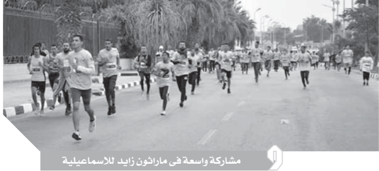
مشاركة واسعة في ماراثون زايد الإسماعيلية