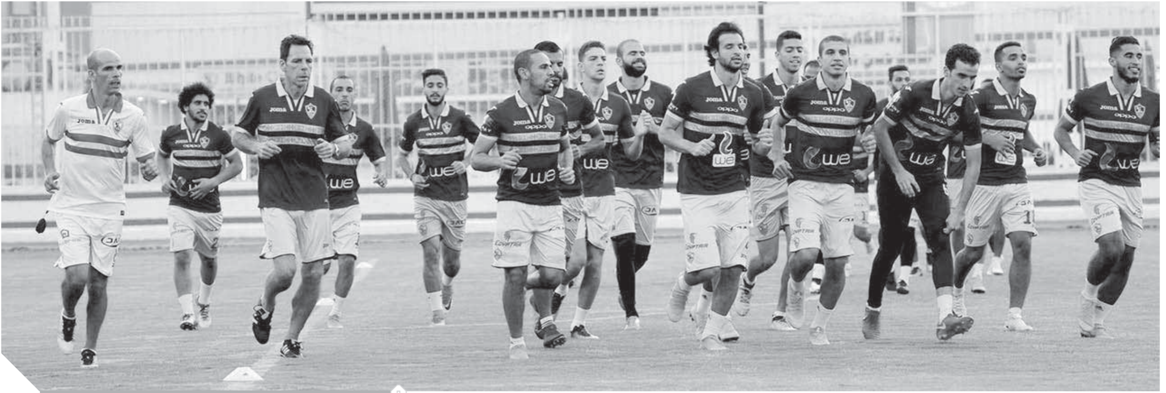
استعدادات جادة للزمالك للحفاظ على الصدارة