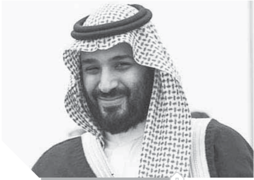
محمد بن سلمان

دافعت روسيا عن «حق» ولي العهد السعودي محمد بن سلمان في تولي عرش المملكة بعد وفاة والده الملك الملك عبد العزيز. وحذرت روسيا الولايات المتحدة من ممارسة أي ضغوط للتأثير على ترتيب الخلافة داخل الأسرة الحاكمة في السعودية. يأتي ذلك وسط مطالبات بالحيولة دون تولي ولي العهد السعودي محمد بن سلمان عرش المملكة خلفاً لوالده المريض.