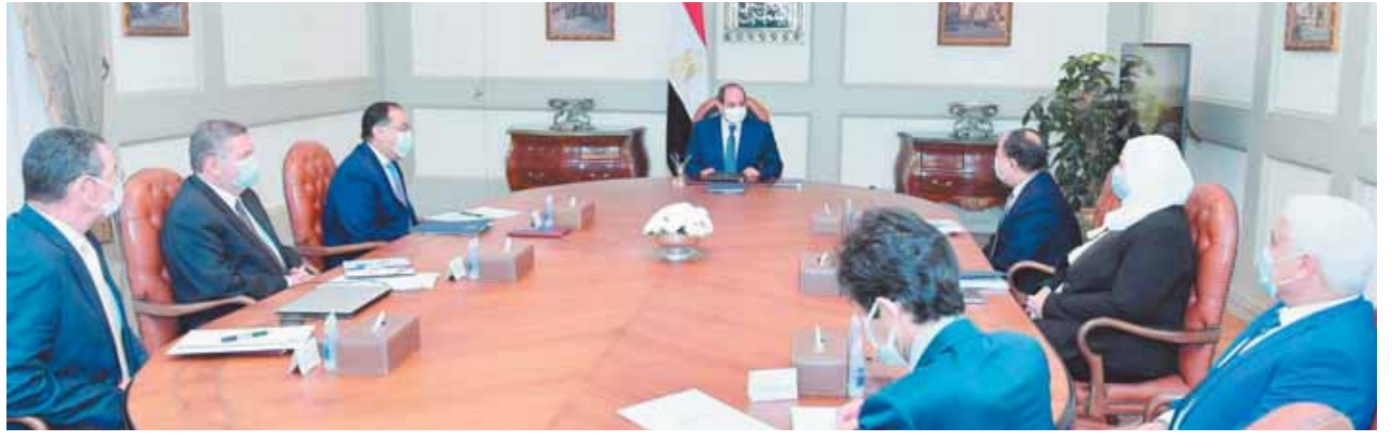
الرئيس خلال اجتماعه أمس برئيس الوزراء ووزير قطاع الأعمال