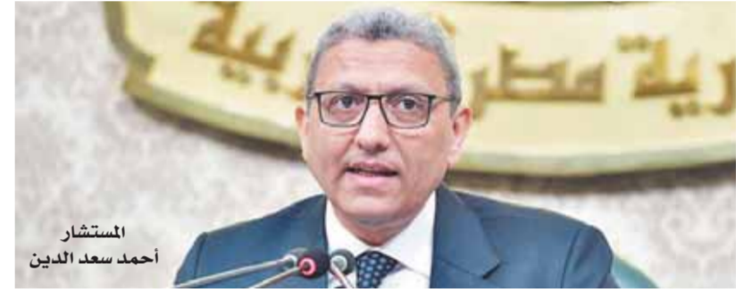
المستشار أحمد سعد الدين

وافق مجلس النواب في جلسته العامة برئاسة المستشار أحمد سعد الدين، وكيل المجلس، على قرار رئيس الجمهورية رقم 508 لسنة 2021 بتعديل بعض فئات التعريف الجمركية. عرض الدكتور فخرى الفقى، رئيس لجنة الخطة والموازنة تقرير اللجنة، مشيراً إلى فلسفة القرار الجمهوري، حيث إن التعريف الجمركية تتعامل مع المتغيرات الاقتصادية على المستويين الدولي والمحلى، والعمل على تحقيق أهداف المشروعات الإنتاجية، وذلك من خلال عمل توازن بين عوامل تشييط العملية الإنتاجية والتجارية سواء على المستوى المحلى والعالمى من خلال وضع فئات ضريبية ملائمة للسلع الواردة من الخارج، وإجراء