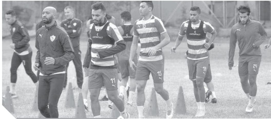
السرية شعار الزمالك في مرانه الأخير