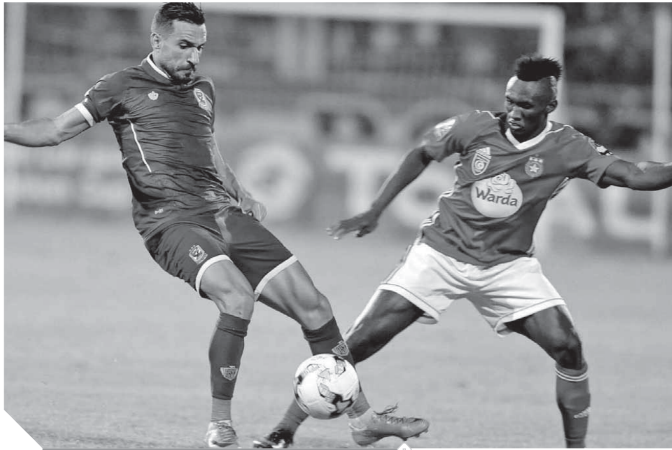
الأهل والنجم الساحلي.. مواجهة من العيار الثقيل

ويكفي ما حدث قبل ذلك مع لاعبين في نفس السن كانوا حققوا بطولات قارية وصعدوا على منصة التتويج وبعد ذلك اختفوا بسبب المبالغة في تكريمهم وتفاوض الأندية معهم والتدليل الزائد لهم وهو ما أدى إلى هبوط مستواهم وبإختصار لابد من وضع معايير للحفاظ على المواهب الصاعدة.