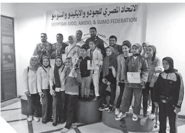
جودو استاد المنصورة بطل الجمهورية يجذارة

الاهلي بدأ مشواره في البطولة القارية هذا الموسم بالفوز على أطلس بره بطل جنوب السودان في الدور الأول وعبور عقبة كانو سيورت بطل غينيا الاستوائية بينما صعد النجم الساحلي على حساب هافيا كوناكاري الغيني في الدور الأول وكوتوكو الغاني في الدور الثاني.