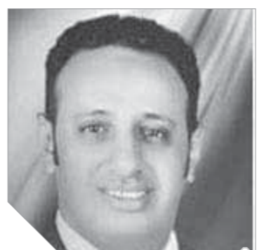
المقدم على الصغير

فقد همس في أذنى أحد مصادرنا السرية أن الزوج المبلغ كان يغار على زوجته بطريقة غريبة نظراً لما تتمتع به من جمال أثر وأن جمالها جعله يشك في سلوكها رغم أنها تتمتع بسمعة طيبة في المنطقة، فأخبرت العميد خالد الشاذلى مدير مباحث سوهاج - آنذاك - بتلك المولومة، وقمنا باستئذان النيابة العامة بالقبض على الزوج وإعادة استجوابه.