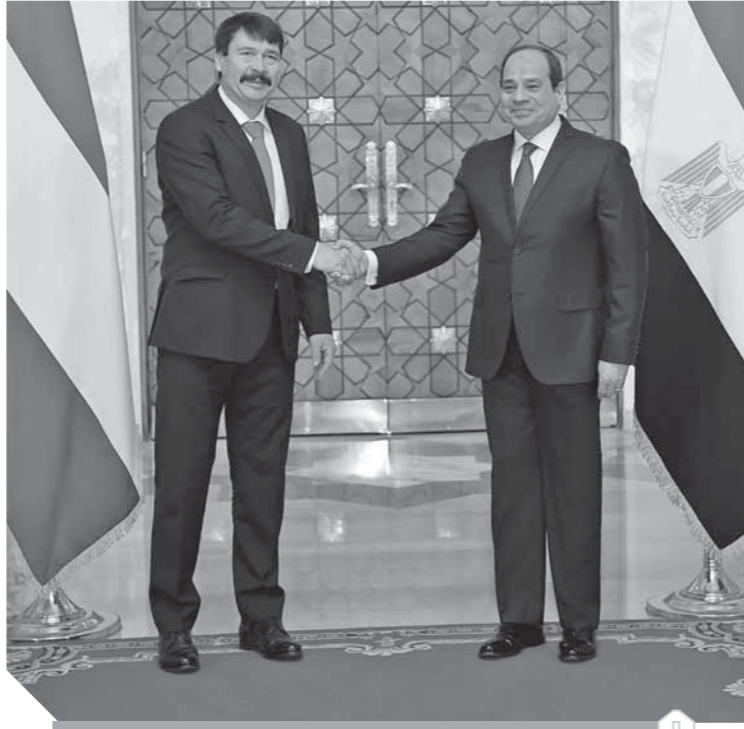
السيسي مع نظيره المجري يانوش أديري في قصر الاتحادية

الرئيس المجري: مكافحة الإرهاب والهجرة غير الشرعية لن تنجح بدون مصر