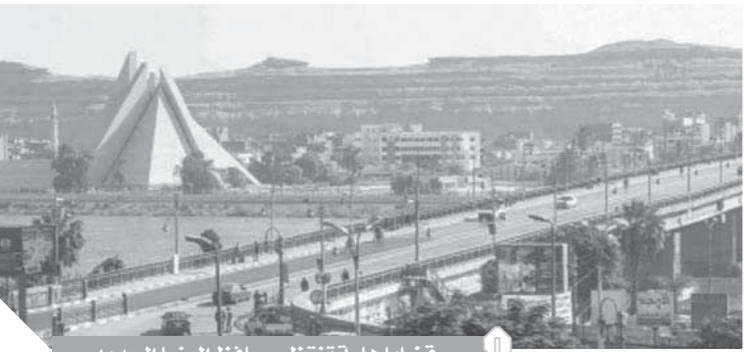
قضايا هامة تنتظر محافظ المنيا الجديد

نتيجة لعدم إحلال وتجديد الشبكة منذ سنوات والاكتفاء بأعمال صيانة محدودة، فضلاً عن زيادة الضغط عليها نتيجة لاستمرار البناء المخالف بمختلف أنحاء المدينة. ملف مواجهة مياه الأمطار ورفع كفاءة شبكة الصرف الصحي، وهو أحد الملفات الهامة التي فرضت نفسها