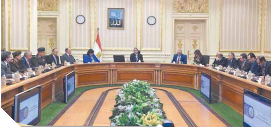
مدبولي، خلال الاجتماع الخاص بتطوير القاهرة الإسلامية

الترسيمة بالقاهرة الإسلامية، والعمل على إزالة أي تعديات موجودة بالمناطق، قائلاً: سنتعامل في تطوير هذه المناطق التاريخية كعمليات جراحية، لإنقاذ الآثار الموجودة بها من أي تعديات قائمة، مؤكداً أنه سيتم البدء في تنفيذ عدد ضمن مشروع تطوير القاهرة التراثية، والذي يضم عدداً من المشروعات منها تطوير شارع باب الوزير، وسوق السلاح ومنطقة الخيامية، وكذا تطوير باب العزب، ودرب الباننة، والحطاية، وسكة المحجر.