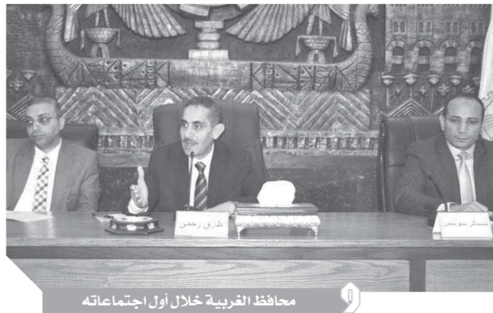
محافظ الغربية خلال أول اجتماعاته

استهل الدكتور طارق رحمى محافظ الغربية أول لقاءاته بالديوان العام للمحافظة بعقد اجتماع موسع مع مقدمى الخدمات الصحية بجميع مراكز المحافظة بحضور الدكتور أحمد عطا نائب المحافظ واللواء شاكى يونس السكرتير العام للمحافظة ووكلاء الوزارة بجميع القطاعات ومديرى المستشفيات العامة. فى بداية اللقاء أكد محافظ الغربية حرصه الشديد خلال الفترة القادمة على رفع الأعباء عن كامل المواطنين التى تخص حياتهم اليومية من (صحة - تعليم - نظافة - مرور) والارتقاء بمستوى الخدمات كافة، مكلفاً مديري المستشفيات بعمل تقرير مفصل عن الإمكانيات المتاحة والمشاكل والحلول المقترحة الخاصة بكل مستشفى للعمل على توفير كافة الاحتياجات للارتقاء بمستوى الخدمة الطبية، مشدداً على حسن معاملة المرضى والتخفيف عنهم والحرص على تحقيق التكامل بين جميع المستشفيات والتنسيق مع جامعة طنطا وأيضاً الالتزام الكامل بكافة إجراءات الوقاية ومكافحة العدوى من خلال متابعة أعمال النظافة بالمستشفيات، مشيراً إلى أن صحة الأفراد