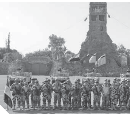
جانب من القوات المشاركة فى التدريب المصرى البريطانى المشترك

كتب - محمد صلاح وأبو زيد كمال وسامية فاروق: