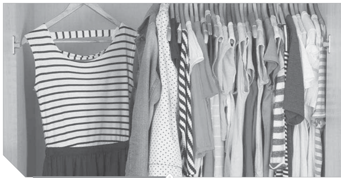
رغم التقسيط، الركود سيد الموقف