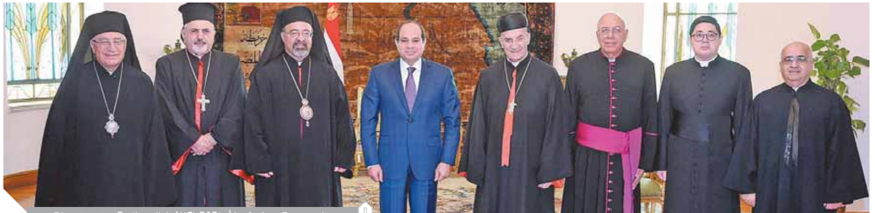
السيسي يتوسط وفد الأساقفة الكاثوليك برئاسة إبراهيم اسحاق