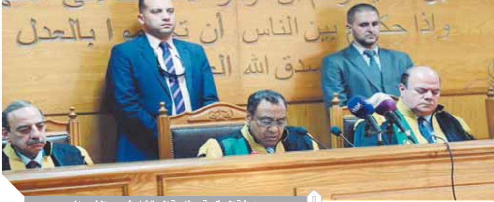
هيئة المحكمة برئاسة المستشار شبيب الضمرانى

ويمارسونه فهو مغاير تماماً لما جاء به القرآن الكريم والسنة النبوية الشريفة، ولا خوف على حاضر مصر ومستقبلها في ظل هذا الشعب الواعى والمدرك للمصلحة العليا للوطن ورجال شرطتها المخلصين. وأنهى كلمته بالقول: حمى الله مصر ونصر شعبها وجيشها ورجال أمنها في حرمهم المقدسة ضد قوى الشر والإرهاب، وأمدوا بعونه في سعيها للبناء والتنمية الشاملة من أجل المستقبل الأفضل، واختتم بنبأ الآية الكريمة: «فَأَمَّا الرَّبْدُ فَيَهْبَثُ خِثَاءً وَأَمَّا مَا نَبَتْهُ فَالْتَمِسْ حَيْثُكَ مِنَ الْأَرْضِ».