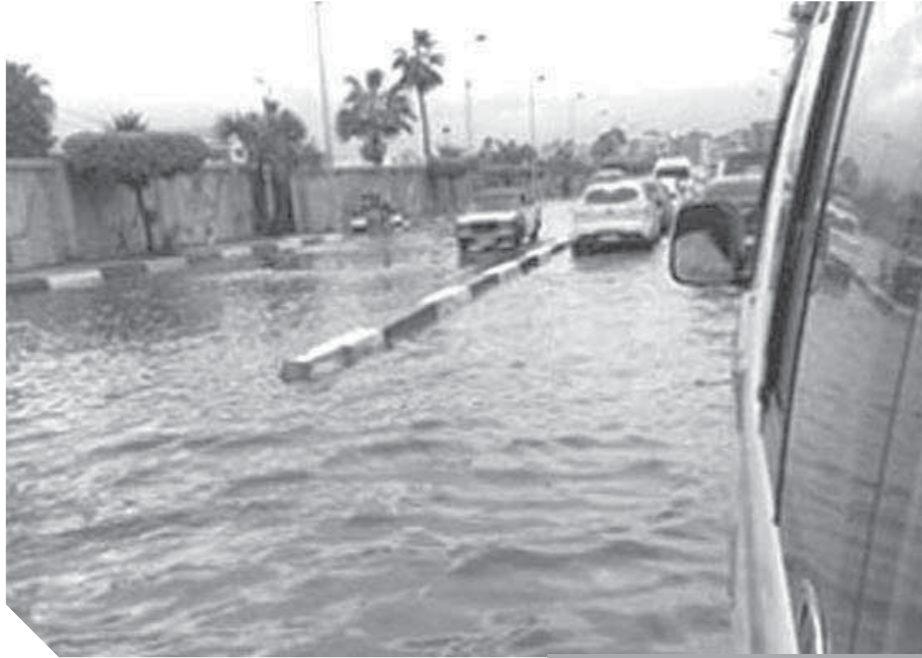
الأزمات تحاصر الإسكندرية وتنتظر المحافظ الجديد لحلها