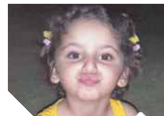
الطفلة المجنى عليها