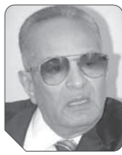
بهاء الدين أبوشقة