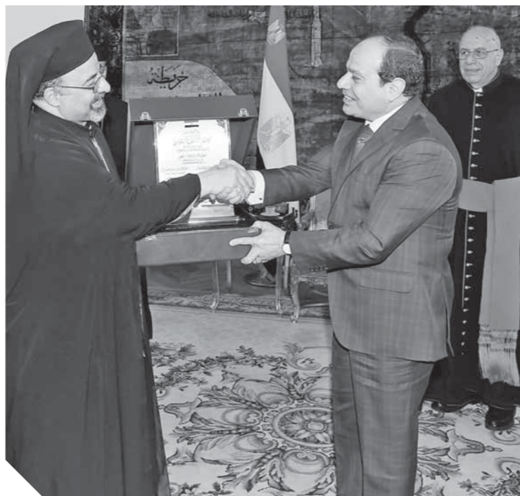
السيسي يستقبل بطيريك الإسكندرية لأقباط الكاثوليك