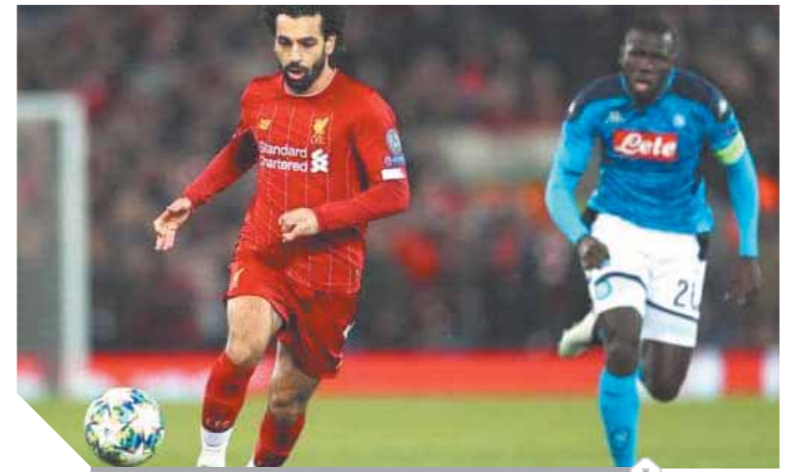
محمد صلاح نجح في مراوغة صخرة دفاع نابولي للمرة الثالثة

استأنف فرع ثقافة البحيرة حفلاته على مسرح قصر ثقافة دمنهور في أول عروضه عقب افتتاح وزيرة الثقافة له وقدمت لفرة البحيرة للموسيقى العربية باقة متنوعة من الأغاني الوطنية بقيادة المايسترو إيهاب مبروك. كما تم تقديم عرض مسرحي بعنوان «سكمكنينو» وهو عرض غنائي استعراضى يعتمد على تقنية المسرح الأسود بالاشتراك مع كورال الأطفال. وأشاد اللواء هشام أمانة محافظ البحيرة بنشاط قصر ثقافة دمنهور منذ افتتاحه موجهاً بتكثيف احتفالات والفعاليات لتحقيق الرواج الثقافي والفكري.