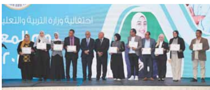
د. رضا حجازى أثناء كلمته فى عيد المعلم

رسالة يسعى لتحقيقها لخدمة ورفى وطنه ولا يختلف اثنان على أن المعلم هو شريان العملية التعليمية والقوة الدافعة للتعلم. وأعلن الوزير عن إطلاق عدة مبادرات وقرارات تقديراً لدور المعلم فى المجتمع ومنها: إطلاق مشروع «أنا المعلم» و«سند المعلم» وذلك بدءاً من الشهر المقبل، حيث أشار إلى أن منصة «أنا المعلم» هو برنامج تطلقه الوزارة لتبسيط كل المعلمين، ويشارك فيه شبكة من تجار مصر، ويمول مرحلته الأولى البنك المركزى. وأشار الوزير إلى أن المشروع يهدف إلى تأكيد أهمية دور المعلمين فى المجتمع، وبناء الثقة فى توجه الدولة نحو الاهتمام بالمعلمين، وتحقيق تمييز خاص للمعلمين أحمد شوقى واصفاً بها عظم دور المعلم، مشيراً إلى أن المعلم الإنسان هو صاحب فكر