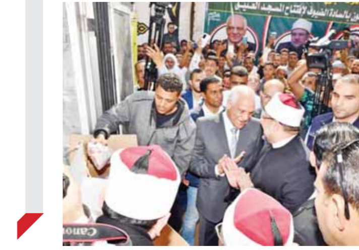
شباب وشيوخ فى إطار توجيهات الرئيس عبدالفتاح السيسى بشأن

رسالة يسعى لتحقيقها لخدمة ورفى وطنه ولا يختلف اثنان على أن المعلم هو شريان العملية التعليمية والقوة الدافعة للتعلم. وأعلن الوزير عن إطلاق عدة مبادرات وقرارات تقديراً لدور المعلم فى المجتمع ومنها: إطلاق مشروع «أنا المعلم» و«سند المعلم» وذلك بدءاً من الشهر المقبل، حيث أشار إلى أن منصة «أنا المعلم» هو برنامج تطلقه الوزارة لتبسيط كل المعلمين، ويشارك فيه شبكة من تجار مصر، ويمول مرحلته الأولى البنك المركزى. وأشار الوزير إلى أن المشروع يهدف إلى تأكيد أهمية دور المعلمين فى المجتمع، وبناء الثقة فى توجه الدولة نحو الاهتمام بالمعلمين، وتحقيق تمييز خاص للمعلمين أحمد شوقى واصفاً بها عظم دور المعلم، مشيراً إلى أن المعلم الإنسان هو صاحب فكر