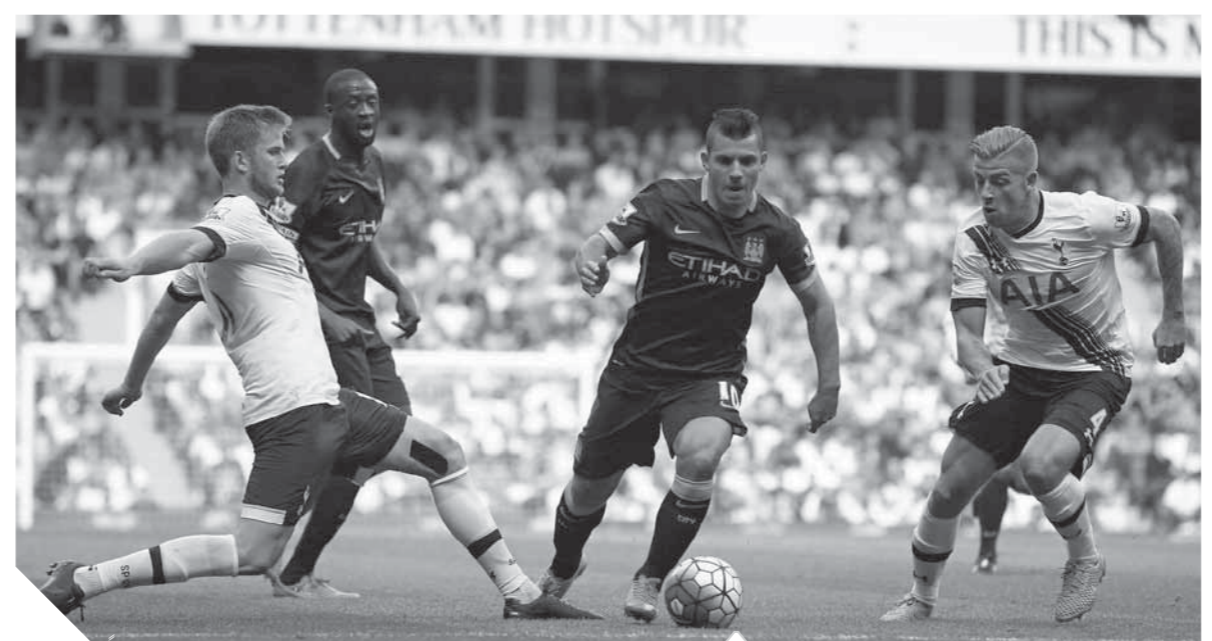
مباريات مانشستر سيتي وتوتنهام تتسم بالإثارة دائماً

ومن المتوقع أن يكون تشكيل توتنهام بقيادة مدرب بوتشيتينو أمام مانشستر سيتي، في حراسة المرمى: هوجو لوريس، وفي خط الدفاع: تريبير، سانشير، توبي الدرفايريلد، بن ديفيز، وفي خط الوسط: إيرك داير، موسى ديمبيلي، سون، لاميليا، إيريكسين، وفي الهجوم: هاري كين.