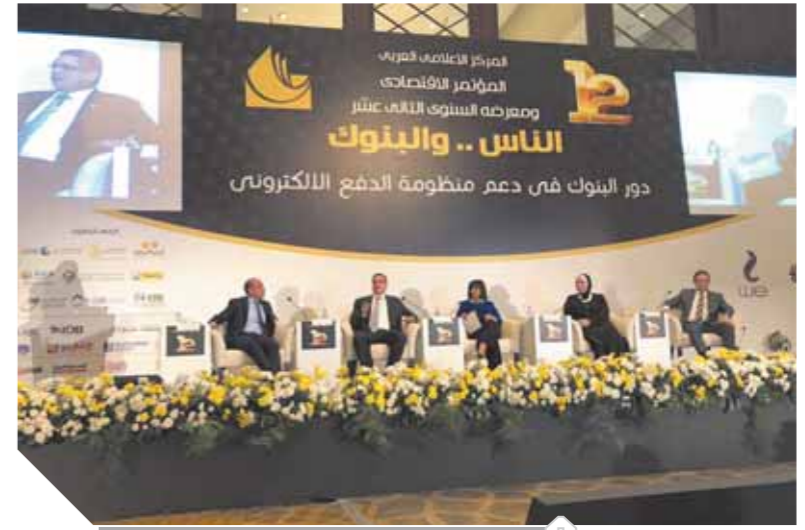
مؤتمر البنوك والناس يدعم المدفوعات الإلكترونية

الإترى: ضغ 21 مليار جنيه فى قطاع المشروعات الصغيرة والمتوسطة