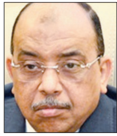
لواء / محمود شعراوى

حتى سطح الأرض وفى المقابل قدم السكان ما يفيد الطعن على القرار وطالبهم بإعادة النظر فى صفة الخطورة الداهية كذلك مكتبة وزارة الإسكان لجنة متابعة تطبيق قانون البناء برئاسة مستشار الوزير . والتي دونت لماذا الإصرار من حى الأزركية على عدم عقار تسليم إنشائياً ولا يوجد ما يؤيد هدمه مما دفع اللواء شعراوى بمراجعة اللواء صبرى محمد عبد رئيس حى فى المستندات الجديدة التى قدمها السكان لعدم هدم العقار .