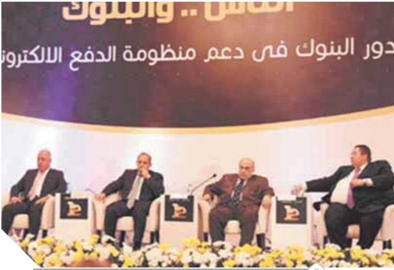
البنوك المصرية تشجع العملاء على استخدام مدفوعات الموبايل