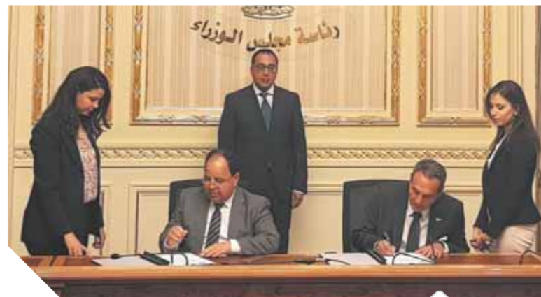
الإترى وزير المالية خلال توقيع البروتوكول

وقع بروتوكول التعاون مشترك مع وزارة المالية لتسوية نحو 2 مليار جنيه مستحقة لبنك مصر من وزارة المالية. قال محمد الإترى، رئيس بنك مصر: إن البروتوكول يهدف إلى إنهاء المنازعات الضريبية بين الطرفين، والتنسيق بين الجانبين لوضع إطار قانونى وآلية تنفيذ محددة لتسوية المبالغ المستحقة لبنك مصر بما يحقق مصالح الطرفين ولا يضر بالخزانة العامة للدولة وعدم تحميلها أعباء جديدة. موضحاً أن بنك مصر يستحق مبلغ يصل إلى 2 مليار جنيه على وزارة المالية نتيجة فروق ضريبية منذ عام 1993، وقد تجاوزت وزارة المالية مع المساعي المحمودة لبنك مصر لرد تلك الفروق بالإضافة إلى العوائد المستحقة عنها وذلك بشأن ضرائب عن عوائد سندات أصدرتها وزارة المالية تخص السلع التموينية عن السنوات 1993 وحتى 1997.