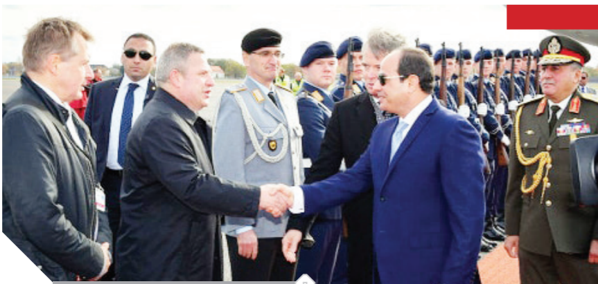
السييسى خلال وصوله إلى ألمانيا