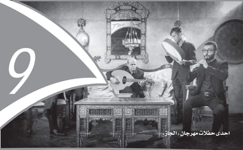
أحدى حفلات مهرجان الجاز