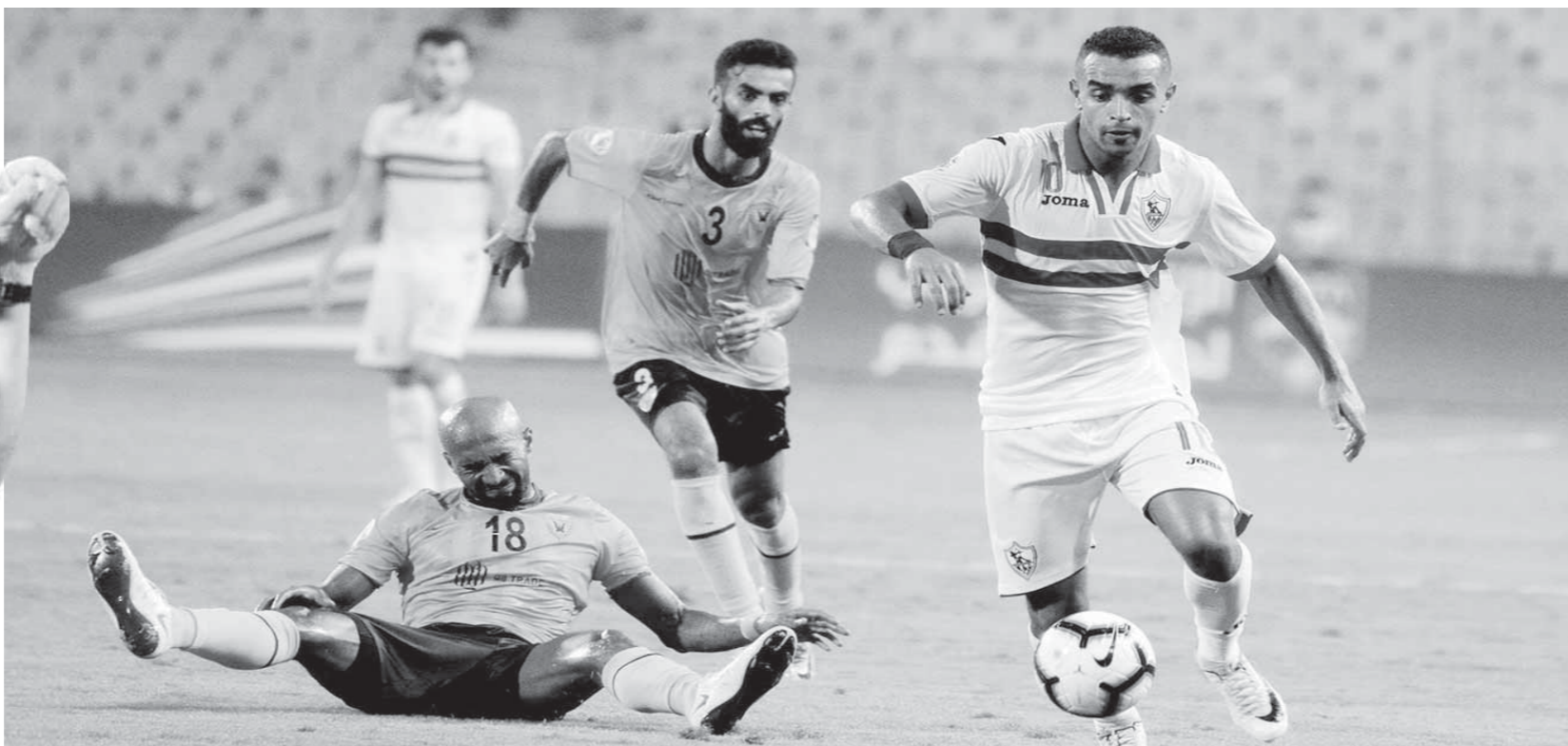
الزمالك خلال مباراة القادسية بالبطولة العربية

وأشار المدير الفني للزمالك إلى أنه لن يغير كثيراً من برنامجه التدريبي الذي كان معداً سلفاً للاستعداد لمباراة الإسماعيلي التي كانت ستقام في الجولة العاشرة يوم ٦ أكتوبر لافتاً إلى أنه سيعقد جلسة مع الجهاز ليعلمون غدا الأحد بوضع البرنامج التدريبي المناسب لتحديد موعد السفر إلى الرياض.