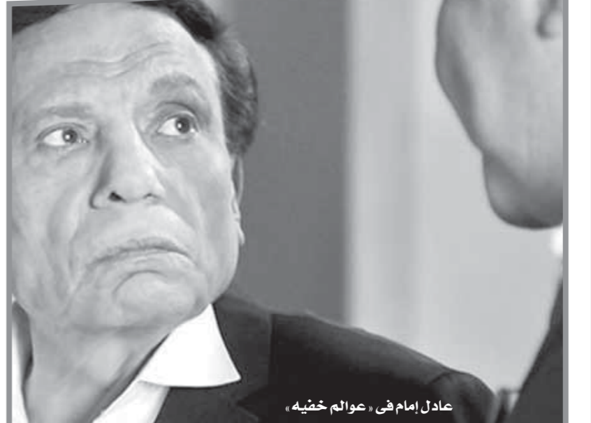
عادل امام في «عوالم خفيه»

المن، أصبح هناك فنانون حقيقيون يجلسون في منازلهم، لأن تجار الفن يرفضون التعامل مع كل ما هو فنان بجد، هناك ممثلون ومخرجون وملحنون كبار أجبروا على الاعتزال، في الوقت الذي يسمع فيه بمن يملك لغة الفهولة واللعب على كل الأوتار للتواجد، وأصبحت «الثلث» هي المتحكمة في المشهد الفني المصري، وفي النهاية تلك الأعمال ضعيفة المستوى التي ساهمت في تدمير الأسرة المصرية، وأمام هذه الحالة على الدولة أن تكون أكثر قوة في القضاء على أطفال الشوارع الذين تسربوا إلى الفن المصري، فتتحول من فن الريادة إلى فن خيبة الأمل. ولأسف هذا الفن الهزيل الضعيف غير المتعمد للإلتجار، تدعّمه بعض البرامج الفضائيات التي تقدم محتوى إعلامياً فاسداً بكل ما تحمله الكلمة من معنى، وبهذا اكتملت منظومة القضاء على الشخصية المصرية، عودوا إلى «اليالي الحلمية» و«رافت الهجان» و«جمعة الشوان» و«بوابة الحلواني» و«الوسيلة» و«جمال البنون» و«الشهد والمدموع» و«بابا عبده» و«المرسى والبحار» و«اللبل وأخبره» و«أم كلثوم»، عودوا إلى دراما القيم والأخلاق بعيداً عن تجار الفن الرخيص.