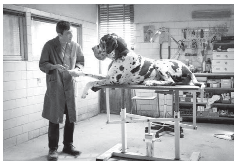
مشهد من فيلم «الرجل والكلب»

وعنوانية نظيره «سيمونى» الواصلة إلى حد الهوس، وكأنه الوجه الآخر لمارتشيلو الذى تواجد فى تلك الأماكن بقوانينه هو والمعتمده على حماية نفسه من بطش سيمونى باحضان المخدرات؛ ولكن يظل المخرج يؤكد بسياسته لمارتشيلو الجميلة بمشاركته كلابه طيبة اليومى من الكرونة، ويعقب تلك المشاهد برحلات بحرية مع ابنته دافعا فيها كل ما يملك؛ الحياة تسير على تلك الوتيرة وكان لها قانونها الخاص الذى نجح كاتب السيناريو فى نسجها من خلال ملائكة البطل وإنسانيته؛