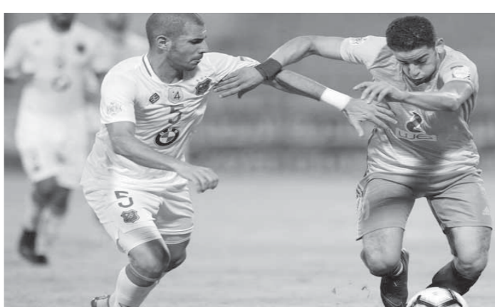
الإسماعيلي تأهل على حساب الكويت الكويتي بصعوبة