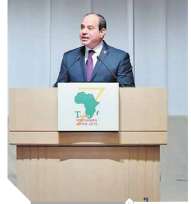
السيسي خلال لقاء كلمته

أدعو المؤسسات الدولية إلى الاستثمار في القارة السمراء «أبي» يعلن دعم اليابان لجهود مصر في مكافحة الإرهاب