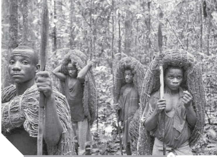
غابات افريقيا توصف برئة الأرض الثانية