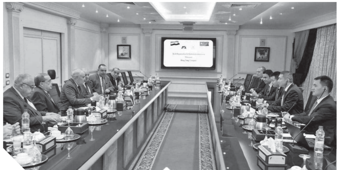
اجتماع العربية للتصنيع، مع وفد «هينج تونج»

الفنية وتدريب الكوادر البشرية وتوطين تكنولوجيا صناعة الكابلات الكهربائية وفقاً لمواصفات الجودة العالمية بالإضافة لبحث أطر التعاون والشراكة بين الهيئة العربية للتصنيع والشركة الصينية، لتلبية احتياجات السوق المحلى والمنطقة العربية، وفتح منافذ للتصدير لإفريقيا. وأضاف أن كابلات الكهرباء تشمل كابلات الجهد المنخفض والمتوسط والعالى والكابلات البحرية ودراسة فتح آفاق للتعاون في مجال كابلات الألياف الضوئية لنظم الاتصالات وكابلات الطاقة المتجددة وخطوط اتصالات السلك الحديدية مشيراً إلى أهمية الإسراع بتفعيل آليات التعاون والشراكة لتلبية الطلب المتزايد من الكابلات