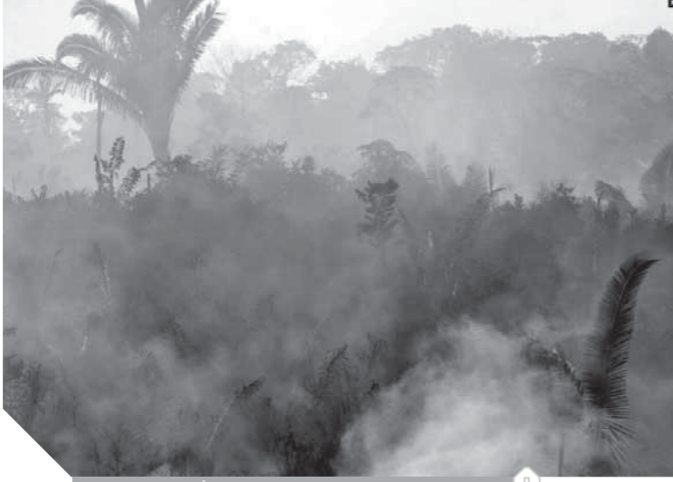
احترق مساحات من غابات الأمازون