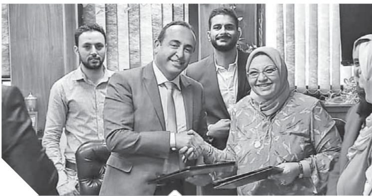
جانب من توقيع العقود

خطاب الإسناد يوليو ٢٠١٩، تأتي مثل هذه الأعمال تأكيداً لتوجهات رئيس الجمهورية الرئيس عبدالفتاح السيسي لتدعيم الشبكة الكهربائية بمحافظة مصر المختلفة.