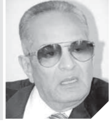
بهاء الدين أبو شوق