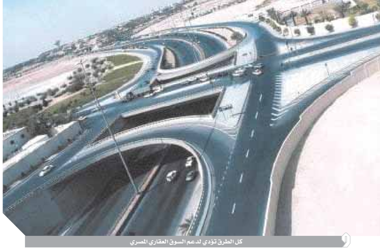
كل الطرق تؤدي لدعم السوق العقاري المصري

وتوقع حسن أن السوق العقاري سيستفيد من تخفيض الفائدة وهو ما نسعي لمواجهته بتدبير مزيد من الأراضي والوحدات السكنية.