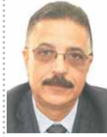
بقلم: سامى أبو الوفاء