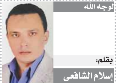
يقلم: إسلام الشافعي