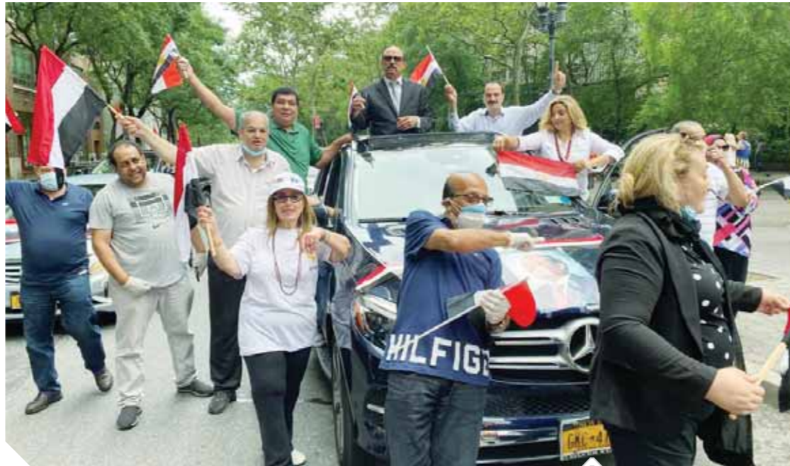
جانب من احتفالات المصريين بالذكرى السابعة لثورة ٣٠ يونيو أمام مبنى الأمم المتحدة