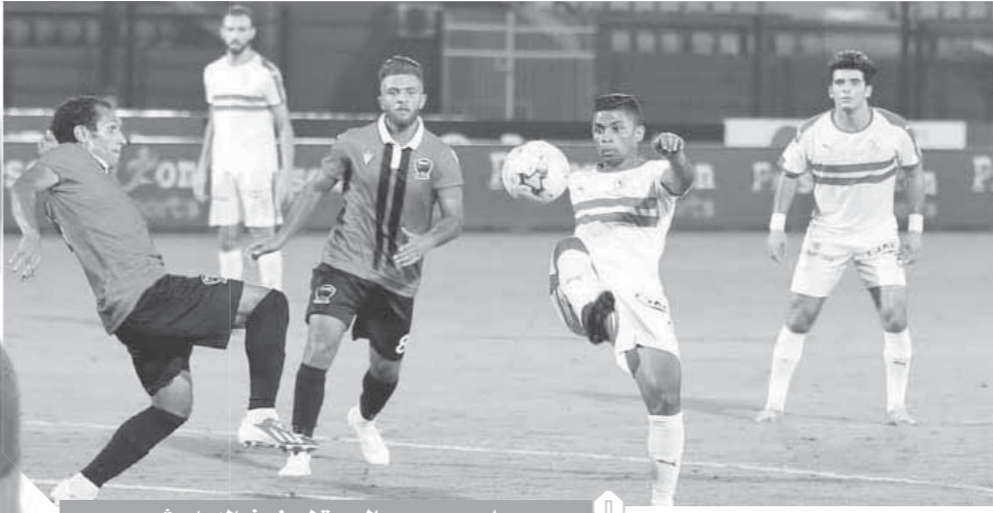
بامبو يرحب بالعودة لصفوف الدراويش

وأشارت صحيفة جريدة الشروق التونسية إلى أنّ بن يوسف تلقى عرضاً من أحد الأندية التونسية ويحاول حسم موقفه فى حالة زيادة عقده السنوي مع الدراويش. وأبلغ اللاعب مسئول الإسماعيلي بأنه مع فتح الطيران سيعود للإسماعيلية لعقد جلسة مع المسئولين لحسم بعض