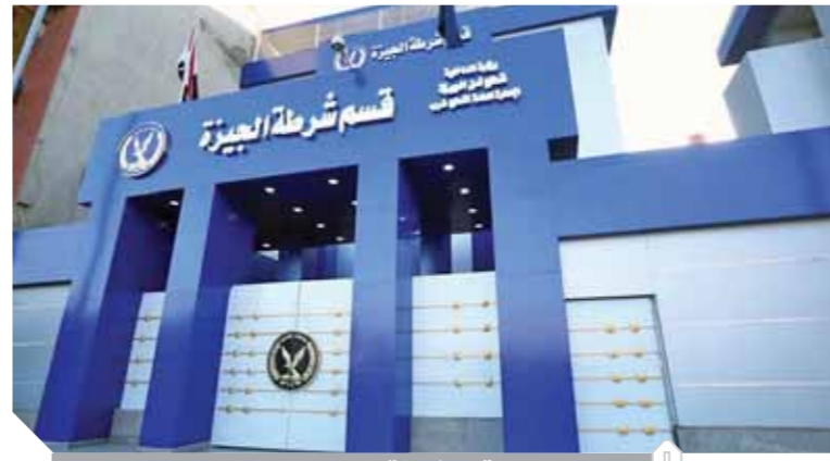
قسم شرطة الجيزة بعد التطوير