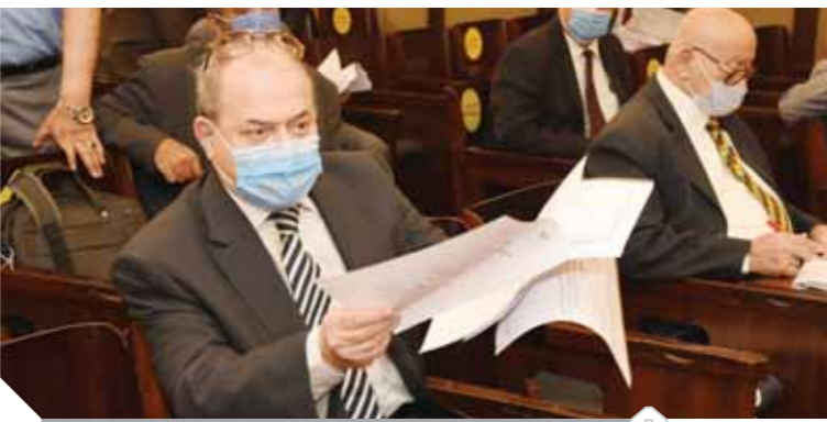
جانب من اجتماع اللجنة

ويعاقب بالمادة ذاتها، على الشرع فى ارتكاب أى من الأفعال المنصوص عليها فى الفقرة السابقة بالحسب مدة لا تقل عن سنة وبغرامة لا تقل عن ١٠ آلاف جنيه ولا تزيد على ٥٠ ألف جنيه أو بإحدى العقوبتين.