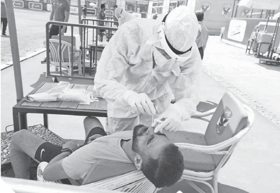
لاعبو الفريق خلال إجراء المسحة