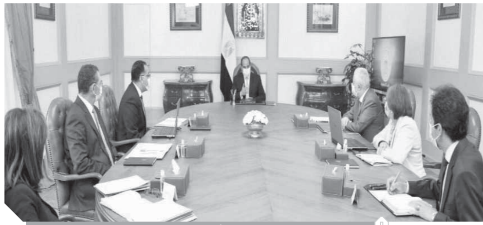
الرئيس السيسي خلال اجتماعه أمس برئيس الوزراء ووزير التربية والتعليم