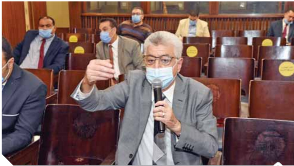
النائب الؤدى هانى أباطة يتحدث فى مشروع القانون

ألقت مباحث قسم عين شمس القبض على عاقلين حطما ماكينة صراف آلى تابعة لأحد البنوك بمنطقة عين شمس، وخلال التحقيق أفاد المتهمان بأن أحدهما حاول استخدام ماكينة الصراف لسحب مبلغ مالي، إلا أن الماكينة «ابتلعت» كارت الفيزا الخاص به ولم تخرج مرة أخرى، فعاولوا استخراجها باستخدام قطعة حديد شتما بها واجهة الماكينة، وعندما فشلوا فى استعادة الكارت فحرا من المكان باستخدام دراجة نارية كانت بحوزتهما.