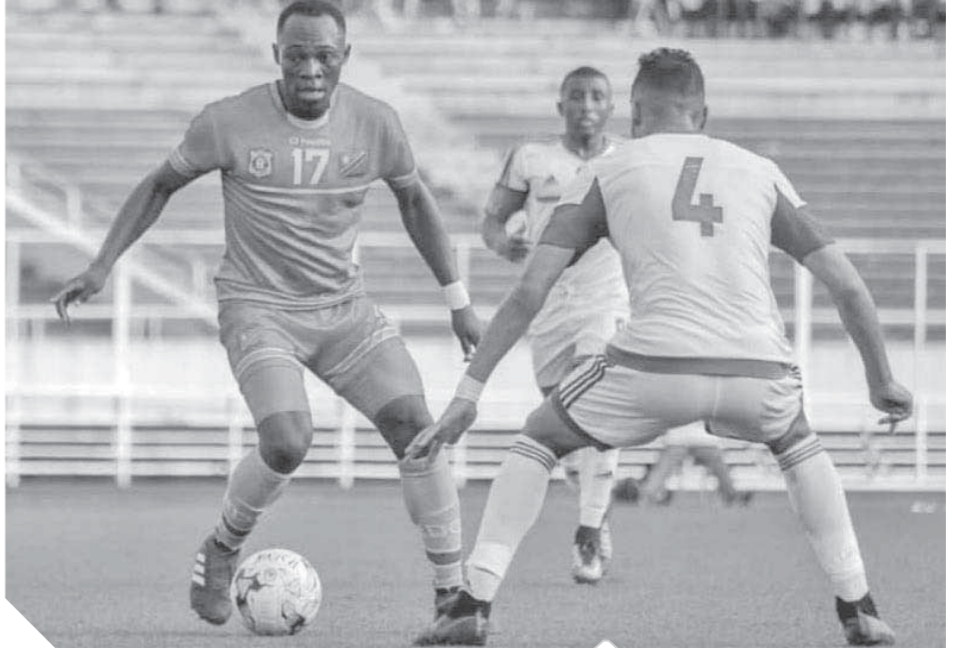
الأهلي يجدد محاولات التعاقد مع موليكيا