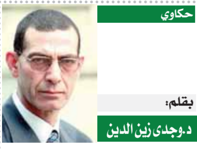
بقلم: دوحى زين الدين

كثير من المعتقدات لدينا فيها شطحات خيال لا تقوم على أسس علمية، فهي نابعة من خرافات وأساطير قديمة ترسخت داخل وجدان الإنسانية تقفلتها البشرية جيلا بعد جيل، وكل محاولات التصحيح لتلك الخرافات والأوهام أو حتى فك الاشتباك بينها وبين الحقيقة يقابلها كثير من البشر بمقاومة كبيرة، وقد تصل لحد اتهام هذا الشخص بالكفر، لذلك لا تستمر هذه المحاولات كثيرا، ولدينا حتى الآن الكثير من الأساطير مثل «قصة كيف خلقت الأرض» فالخلافات بينهم تتعلق باختلاف الحضارات وهي خلافات بسيطة جدا، فالكل مُعجم أن الله خلق آدم من تراب ونفخ فيه الحياة ثم خلق له هوا، ولكن اغواهم إبليس فاكل من الشجرة، فعاقبها