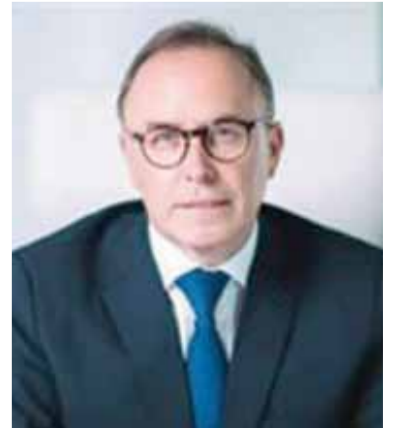
جون بيير ترينيل

ويلخص التقرير التقدم المحرز لخلق الأثر الإيجابي على تصدير ٦ رؤوس أموال أساسية للاستدامة والممارسات المسؤولة وهي: رأس المال، والمادي، والفكري، والتصنيعي، والبشري، والاجتماعي، والطبيعي.