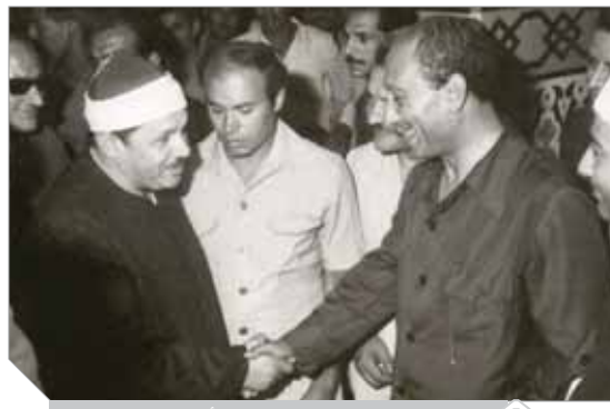
يصفح السادات، في المسجد الأحمدي بطنطا