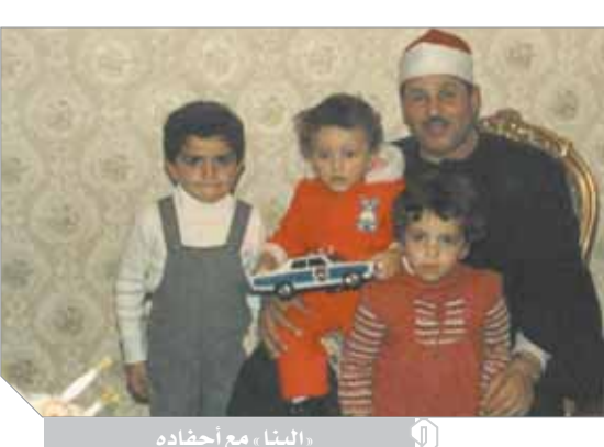
البنا مع أحفاده