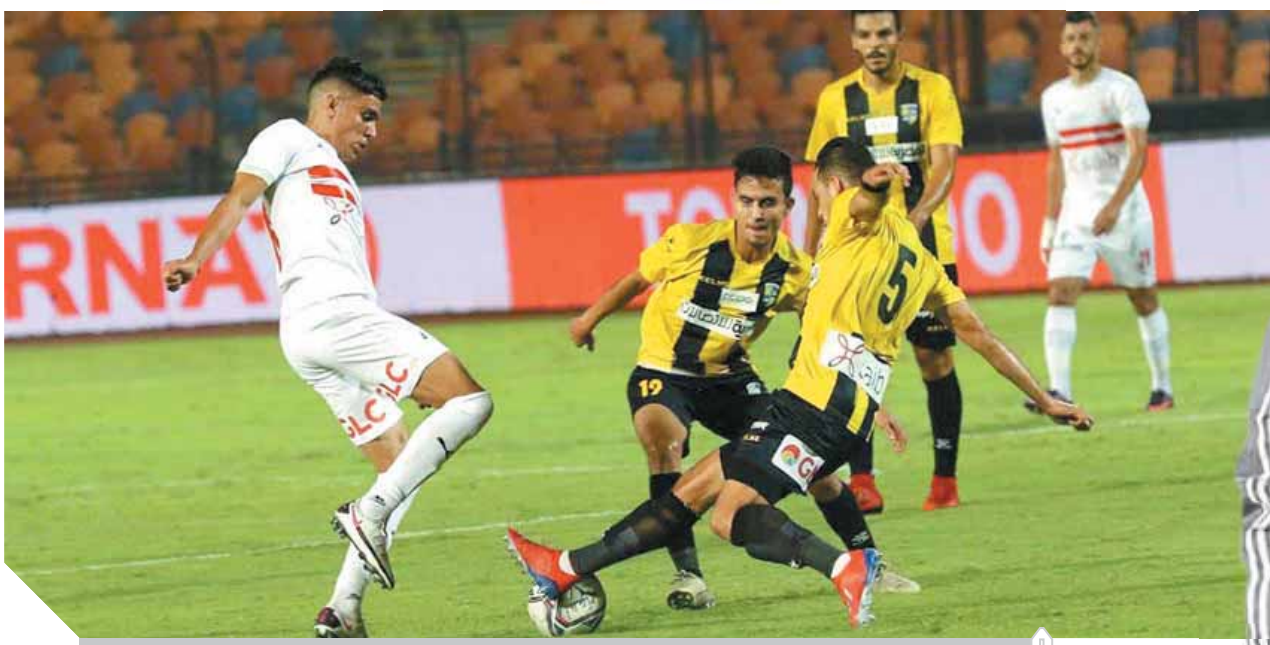
الزمالك فاز على المقاولون فى الدورى ويسعى لتكرار الانتصار الليلة

من جانبه، عبر بيتسو موسيماني المدير الفنى للأهلى عن رضاه بتحقيق الفوز على حساب المصرى