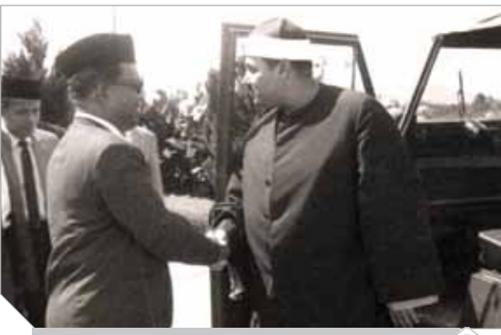
حاكم إحدى ولايات ما ليزيا يستقبل البنا - لحظة وصوله