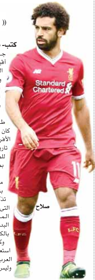
كتب- محمد سعيد:

«بركات»: اتفقنا على ودية مع بوروندي.. والجميع رحب بمنح «صلاح» الشارة