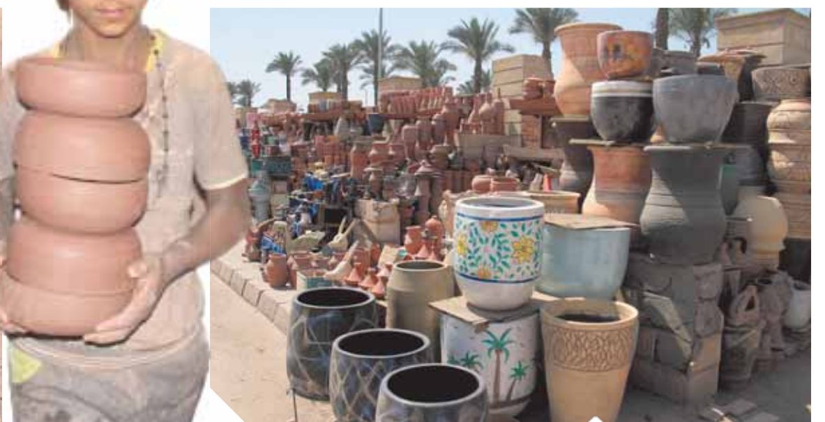
الفواخيري في منتجات الفسفاط