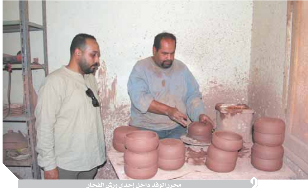
محرر الوفد داخل إحدى ورش الفخار

وأشارت نائب المحافظ إلى أنه تم إنشاء موقع إلكتروني يسمى «أيادي مصر» كمنحة من وزارة التنمية المحلية للمساعدة والتشجيع وتوصيل المنتج إلى السوق الإقليمي والمحلي. وتكمن آمال أصحاب هذه الحرفة النادرة داخل قرية «الفواخير» في تقنين أوضاعهم وتعمل محافظة القاهرة والمنطقة الجنوبية للمحافظة على تكثيف الجهود وضغط الإجراءات المتعلقة بتطوير القرية ولتدليل أي عقبات مع كافة الجهات المعنية ذات الصلة وتقنين أوضاع فناني هذه الحرفة، وذلك من أجل تحقيق نقلة تراثية وحضارية إلى جانب تحقيق آمال العاملين بها والذين يعتززون جداً بمهنتهم الراقية التي يطلق عليها صناعة «جواهرية الطين».