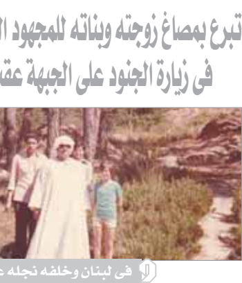
الشيخ البنا في شبابه

● ماذا عن جهود الشيخ البنا في تأسيس نقابة القراء؟ ● كان مهموماً باستقبال القراء ومدراء الهيئة، إذا ما أمته بعد العمر إلى سن العاشم وقد بعضهم القدرة على العمل ورأى أنه لابد من ضمان اجتماعي يعينهم على الكبر، واخترت فكرة النقابة في رأسه، وكانت أولى الخطوات إعداد مشروع قانون إنشاء النقابة من خلال مكتب المحامى عصمت الهوري، بعدها سعى البنا لعرض المشروع على مجلس الشعب، وعرض الأمر على الدكتور صوفى أبوإبالي رئيس المجلس وقتها وأوائل الثمانينات، وندم تأخر الطلب، سعى لمقابلة الرئيس السادات في مقر الرئاسة بالقاهرة، لكنه لم يجده وكان وقتها في استراحته بالقطار الخيرية فلم يتردد واصفح مع الشيخ أحمد الرزقي لمقابلة الرئيس في القطار، ونجح في مساعيه والتقى الرئيس، حتى اقتنع السادات، وأمر بإرسال خطاب لمجلس الشعب يؤيد فيه قانون نقابة القراء ويستعمل موافقة المجلس عليه، وكان له ما أراد حتى صدر القانون رقم ٩٢ لسنة ١٩٨٣ بإنشاء أول نقابة لمصحفي وقراء القرآن الكريم بمصر وكان أول نقيب لها الشيخ عبدالبيسط عبدالصمد أول نقيب للقراء الشيخ البنا، ثانياً له والشيخ أحمد الرزقي أمماً عامًا لها.