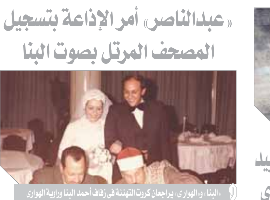
«عبدالناصر» أمر الإذاعة بتسجيل المصحف المرتل بصوت البنا

● ماذا عن الشهر الموافق والظرف في حياة الشيخ رحمه الله؟ ● كان من أشهرها عندما تشرف بدخول بيت رسول الله في إحدى رمضان عن زائر بيت الرسول من الشخصيات البارزة ورجال الدين هناك وليلتها بكى الشيخ أثناء تلاوته بالروضه الشريفة أمام قبر الرسول وقالبته دموعه وهو يتلو «يا أيها النبي إنا أرسلناك شاهداً ومبشراً ونذيراً وداعياً إلى الله مما يرضاه سراجاً مبيناً» الأحزاب (٥٠ - ٤٦) وموقف آخر كان الشيخ البنا يزور والديه كل أسبوع في بلدته شيراباس وهو في طريقه قطع بعض النصوص على الطريق في الظلام وأوقفوا سيارته ليأخذوا ماله فأخبرهم أن هذا رزق لوالديه وعندما عرفوا شخصيته تركوه، وعندما فعل ذلك على والديه، أخبروه والده أن أمه كانت تدعو الله بعد صلاة العشاء أن يعطفه من شر الطريق وأولاد الحرام.