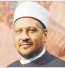
د. مجدى عاشور مستشار مفتى الجمهورية

● أنا رجل كبير في السن ومريض وأحتاج إلى شرب الماء كثيراً في الليل والنهار وبصفة مستمرة، ولا أقدر على الصيام فما الحكم؟ أولاً: ناطت الشريعة الإسلامية فريضة الصوم بالاستطاعة والمقدرة عليه من غير ضرر على الكلف والحاق الأذى به. ثانياً: رخص الشرع الشريف لأصحاب الأعذار أن يفطروا في رمضان، وعليهم القضاء بعد شفائهم حيث قال تعالى: «فمن شهد منكم الشهر فليصمه ومن كان مريضاً أو على سفر فعدة من أيام أخر» [البقرة: 185]. أما إذا كان مرضهم مستمراً لكبر سن أو لمرض لا يقدرون معه على الصيام بصورة مستمرة، فيجوز لهم في هذه الحالة الفطر وعليهم الفدية، بحيث يطعمون عن كل يوم مَدًا من طعام؛ كما في قوله تعالى: «وَأَعْلَى الَّذِينَ يُطِيقُونَهُ فِدْيَةٌ طَعَامُ مِسْكِينٍ» [البقرة: 184]. والخلاصة: أنك ما دمت لا تقدر على الصيام بصفة مستمرة بناء على مرضك فيرخص لك الفطر، لكن عليك الفدية بأن تطعم عن كل يوم مسكيناً، ويجوز إخراج قيمتها بما يساوي ٥١٠ جرامات من القمح أو غيره على ما عليه الفتوى، وإذا كنت فقيراً ولا تجد ما تخرجه فلا شيء عليك.