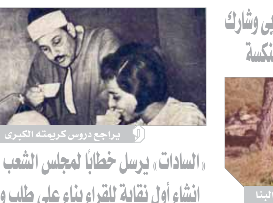
يراجح دروس كريمته الكبرى