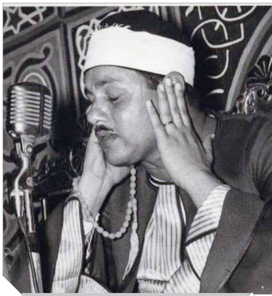
البنا يتلو القرآن في مسجد الرفاعي