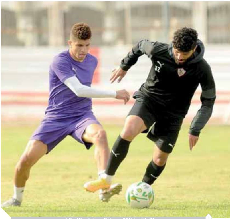
لقطة من التسمية الودية فى الزمالك

يستنضيف المنتخب الوطنى الأول، فى تمام السادسة مساء اليوم الاثنين، منتخب جزر القمر على ملعب استاد القاهرة، ضمن منافسات الجولة السادسة والأخيرة من المجموعة السابعة بالتصفيات المؤهلة إلى كأس الأمم الإفريقية المقررة ٢٠٢٢ بالكامبيرون. ولن يكون المنتخب الوطنى تحت أى ضغط بشأن التأهل بعدما ضمن كل من مصر وجزر القمر تأهلها للبطولة، وسيكون الصراع بين المنتخبين فى المباراة على صدارة المجموعة، إذ يتساوى كلا المنتخبين برصيد ٩ نقاط، بينما يتقدم الفراعنة بفارق الأهداف فقط. وتعادل المنتخب أمام نظيره الكينى يوم الخميس