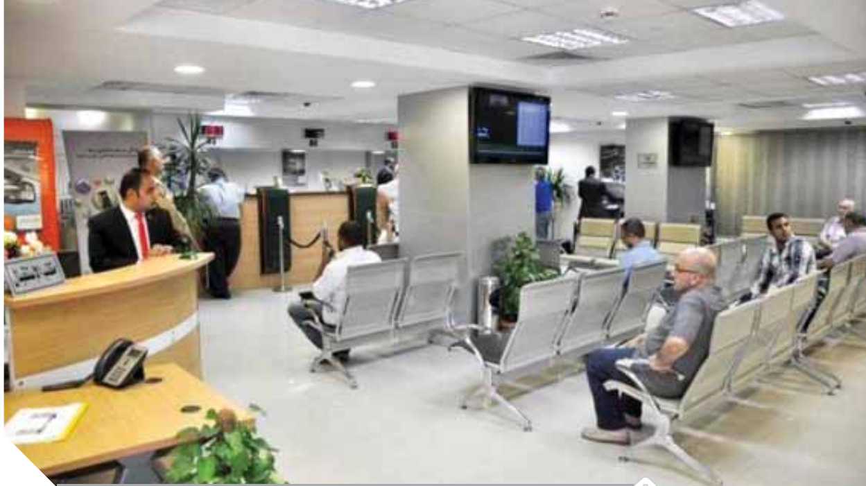
البنك المركزي يسهل إجراءات فتح الحسابات

وعضو فريق العمل الاقليمي لتعزيز الشمول المالي في المنطقة العربية يسعى لتهيئة بيئة تشريعية وبنية تحتية مالية مناسبة وإنشاء قواعد بيانات شاملة. موضحا أن قرار المركزي جاء متمشيا مع ما نلتمسه من انتعاش في النشاط الاقتصادي في كافة القطاعات الانتاجية وخدمة وحققا قيمة مضافة للاقتصاد الوطني من خلال تشجيع الشباب ودعمهم في القطاع المصرفي مما يساهم في زيادة وعيهم المالي والمصرفي والاستثماري لتأسيس مشروعات خاصة بهم بعد تخرجهم او بعد بلوغهم عام الواحد والعشرين ليصب في مصلحتهم أولا وتقلل من معدلات البطالة ثانيا. وطالب البنوك بتقديم خدمات مالية و طرح منتجات مصرفية متنوعة تناسب وتراعى طبيعة الفئة العمرية لهؤلاء الشباب (١٦ سنة- ٢١ سنة) حتى لا تتعرض مداخرتهم لاية مخاطر الامر الذي يجعلهم يفقدون الثقة في النظام المصرفي ككل.