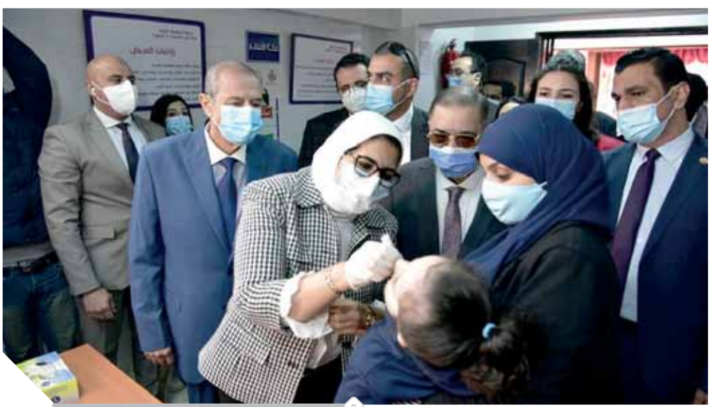
وزيرة الصحة تقوم بتطعيم طفلة

كتبت - منال رشاوى وأحمد بعزق: تواصل قوات الحماية المدنية بالقاهرة جهودها لاستخراج جثث ضحايا عقار جسر السويس المنهار. وكشفت رئيسة حى السلام أمام النيابة العامة عن مفاجأة تتمثل فى أنه سبق وجرى تحرير محضر مخالفة ضد صاحب العقار المنكوب، وإرساله إلى المحافظة، لاتخاذ الإجراءات القانونية وكان النائب العام قد أمر صباح أمس الأول بفتح تحقيق عاجل فى حادث انهيار عقار جسر السويس وتقديم المتورطين إلى المحاكمة.