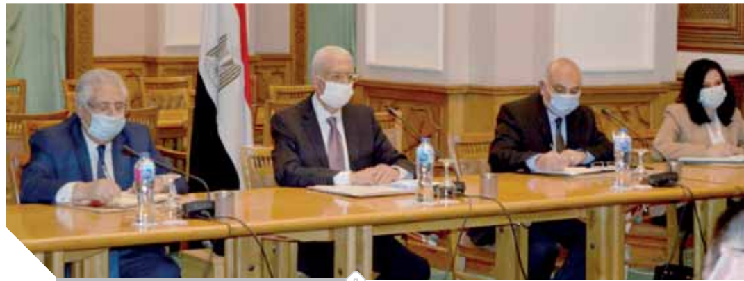
جانب من لقاء وزير الرى والبعوث الأمريكى

وأكد وزير الرى دعم مصر الكامل للمقترح السودانى والداعى لتشكيل رابعة دولية تقودها جمهورية الكونغو الديمقراطية، وتشارك فيها الولايات المتحدة والاتحاد الأوروبى والأمم المتحدة للتوسط بين الدول الثلاث، وأشار إلى أهمية أن تتسم المفاوضات بالفاعلية والجدية لتعظيم فرص نجاحها. وأوضح عبد العاطى أن مصر تدعم التنمية في جميع دول حوض النيل، لافتاً إلى سعى القاهرة لتحقيق المنفعة للجميع من خلال التوصل لاتفاق قانونى عادل وملزم للجميع يلبى طموحات جميع الدول في التنمية.