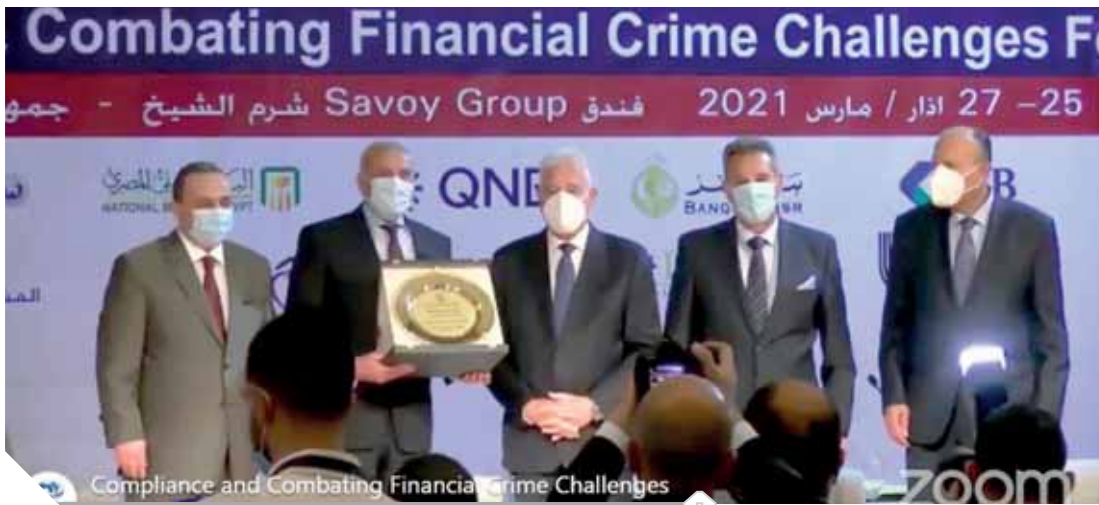
الجلسة الافتتاحية لمنتدى اتحاد المصارف