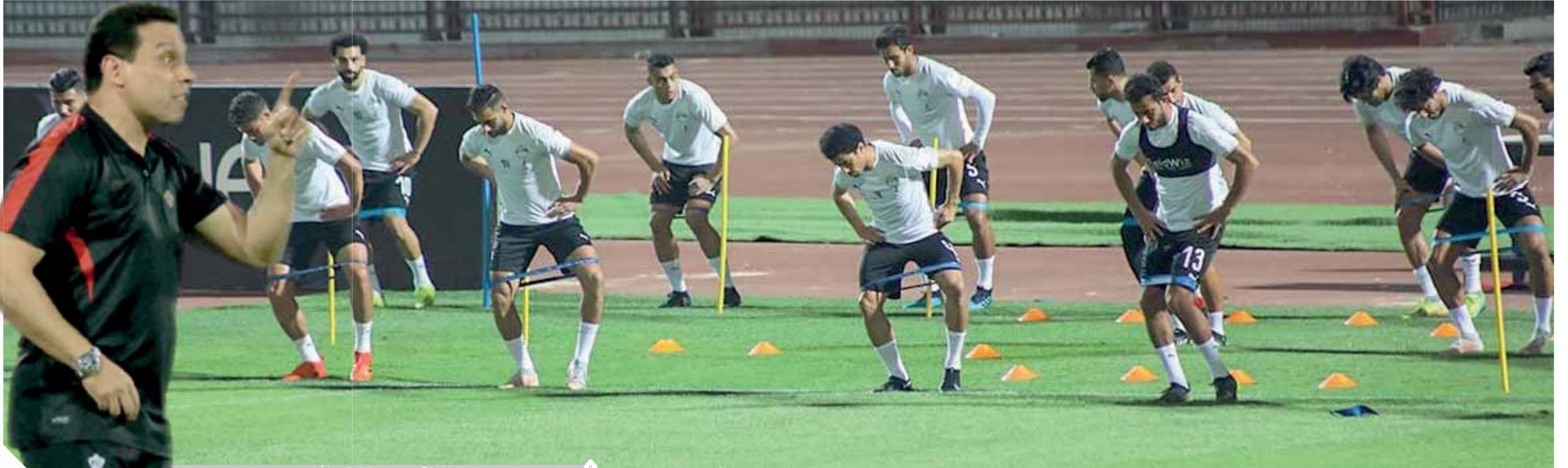
لقطة من مران المنتخب الأخير