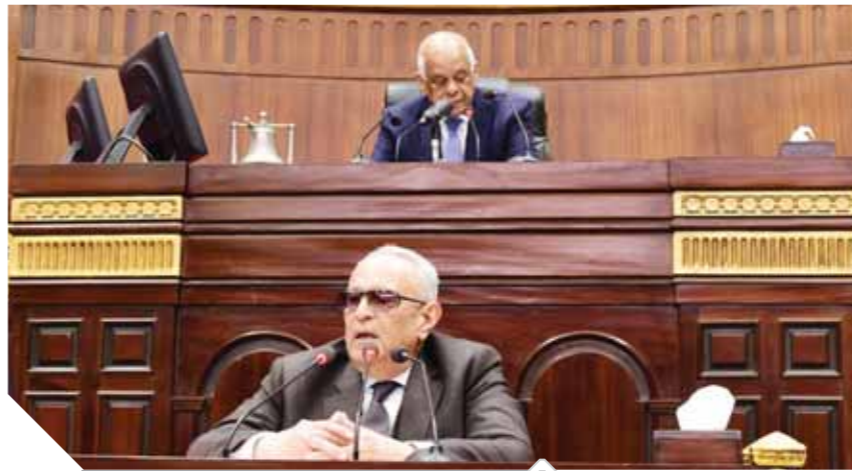
د. عبدالعال وأبوشقة أثناء جلسة الحوار المجتمعي

أكد د. على عبدالعال، رئيس مجلس النواب، أن جلسات الحوار المجتمعي بالبرلمان حول التعديلات الدستورية تأتي من منطلق الإحساس بالواجب الوطني، حتى يستطيع المواطن في النهاية أن يتخذ قراره المناسب، وأضاف أن من خصائص الحوار المجتمعي الناتج أن يكون شاملاً لجميع شرائح المجتمع ومفتوحاً وشفافاً. وقال رئيس مجلس النواب «لماذا نعدل الدستور؟ فهناك من يقول عشان يمددوا فترة الرئيس، وأنا باشوف بعض العناوين في بعض وسائل الإعلام، حافترض أنه عشان نمدد مدد الرئيس، الكثير من الدول ومنهم الدول الخمس دائمة العضوية في مجلس الأمن عدلت مدد الرئاسة ويدون سابق إنذار ولفترات كبيرة»، وأضاف «لكن ما تقوم به هو إصلاح سياسي وكنت عضواً في لجنة العشرة التي وضعت النسخة الأولى من الدستور، كنا نعمل في حالة طوارئ وحظر تجوال ومحدد لنا شهر واحد تنتهي من كتابته في ظل هذه الظروف، وكنا بنشغل أحياناً بأسلوب رد الفعل أي إيه اللي حصل في السابق وأشعل التيران ونطفتها بالنص الفلاني مثل حنة الـ 30 / 40 سنة (البقاء في الرئاسة) أي دستور رد الفعل لتطفن الحرائق».