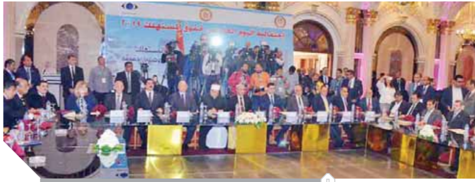
وزير الأوقاف يلقى كلمته في احتفالية اليوم العالمي لحقوق المستهلك

بأقوات الناس، وعلاجهم، مطالباً بوضع لائحة سوداء على موقع جهاز حماية المستهلك تضم أسماء من تسول له نفسه الغش ويتبث قيامه بما يضر بصحة الناس أو حياتهم، فالغش يتنافى مع المعاني الدينية والإنسانية. وفي ختام كلمته بين «جمعة»، أن مال الفشاش مال حرام وسحت، وكل ما نبت من المال الحرام مصيره إلى النار، حيث قال رسول الله صلى الله عليه وسلم: «كل جسد نبت من سحت فالتار أولى به». جاء ذلك خلال حضور الوزير احتفالية اليوم العالمي لحقوق المستهلك بمشاركة الدكتور على المصليحي وزير الترميم والتجارة الداخلية نيابة عن رئيس الوزراء ومحافظ القاهرة والجيزة والقليوبية والشرقية واللواء راضى عبدالمعطي رئيس جهاز حماية المستهلك.