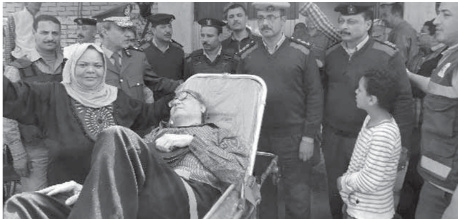
الجيش والشرطة في خدمة المرضى

كافة أوجه الرعاية والدعم للمواطنين ذوي الاحتياجات الخاصة وكبار السن، حيث تم تعيين فرد شرطة بكل مقر انتخابي بمقعد متحرك لمساعدة الناخبين كبار السن والمرضى وذوي الاحتياجات الخاصة، لتكنيتهم من الإدلاء بأصواتهم وممارسة حقهم الانتخابي.