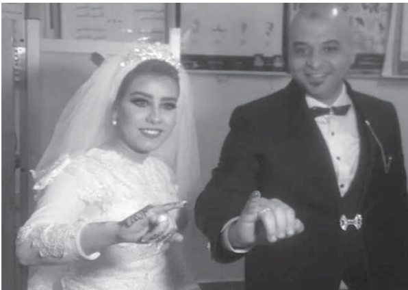
العروسان بعد الادلاء بصوتيهما