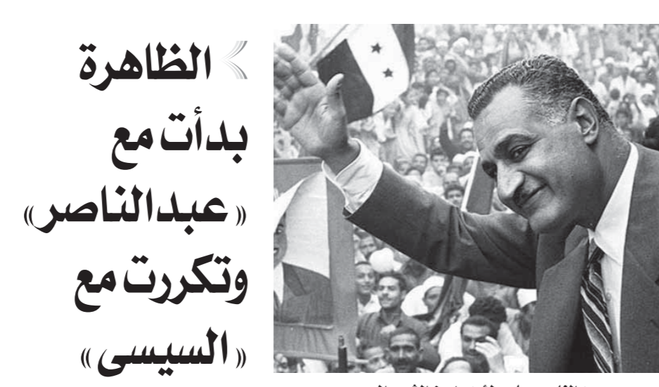
عبدالناصر، يلوح لمؤيديه من الشعب المصري

جميع الكتابات التي تناولت تاريخ الانتخابات في مصر، فلم أجد ما يفيد الإجابة عن السؤال، ولكن بعد بحث في الفيديوها الخاصة بالانتخابات المصرية وجدت أن أول مرة يفني فيها المصريون ويرقصون أيضاً، كانت في خمسينات والستينات، وفي ذلك الوقت كانت مصر قد خرجت لتوها من معنة العدوان الثلاثي الذي شنته إنجلترا وفرنسا وغنى كثير من المصريين لنصر وللعروبة وللمصر وسوريا.