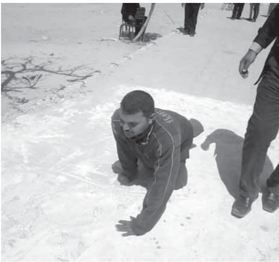
معاك القنطرة يصير علي الادلاء بصوته