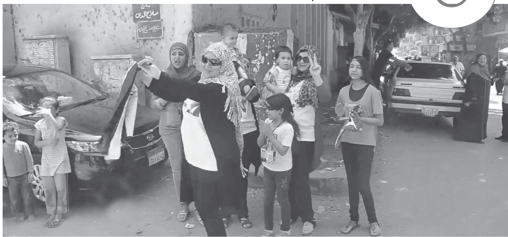
سيديات مصر حرصن على المشاركة بقوة في العرس الانتخابي

اختيار جمال عبدالناصر لفترة رئاسة جديدة، وفي هذه المرة شارك حوالي 7 ملايين مصري في الاستفتاء، وكان أغلبهم كان يحمل علم مصر، ويفني أمام لجان الاستفتاء الأغاني الوطنية.