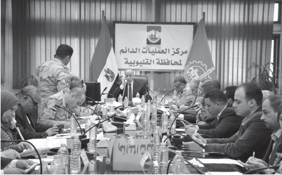
غرفة العمليات بالقليوبية برئاسة المحافظ