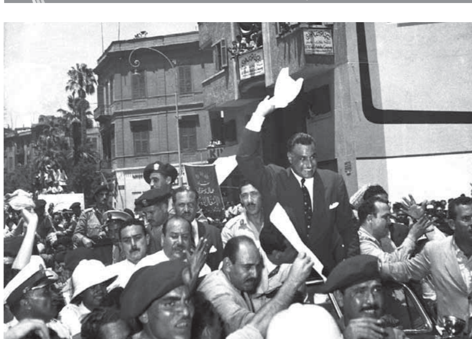
ملايين المصريين خرجوا للشوارع ليختاروا «عبدالناصر» رئيساً لمصر