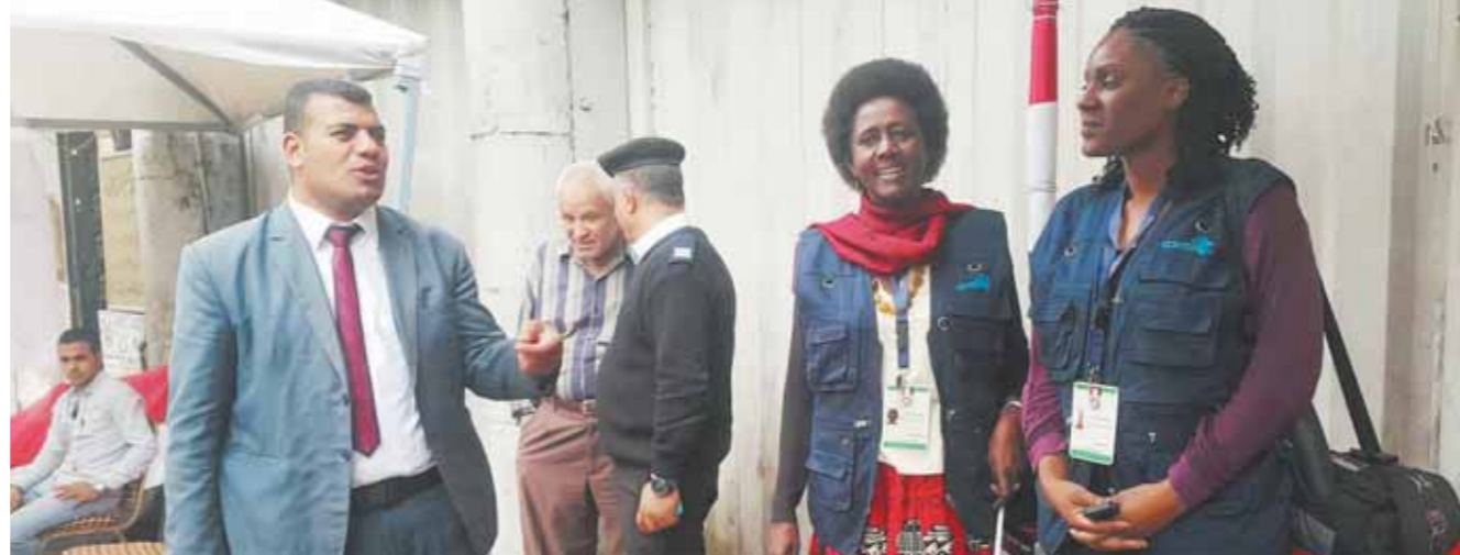
المراقبون الدوليون يتفقدون اللجان الانتخابية