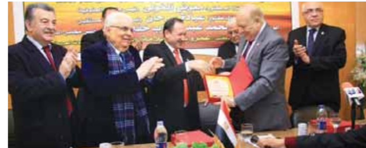
خفاجي أثناء تسلمه جائزة التكريم

وفقا لمعايير الجودة، والمستشار الدكتور محمد عبد الوهاب خفاجي نائب رئيس مجلس الدولة المصري لتمييز عطائه في مجال العلم القانوني وأثره على المجتمع. وقال الدكتور محمد خفاجي أمام حفل تكريم العلماء: إنه إذا كان الإنسان المصري القديم قد استطاع أن يشيد الأهرامات