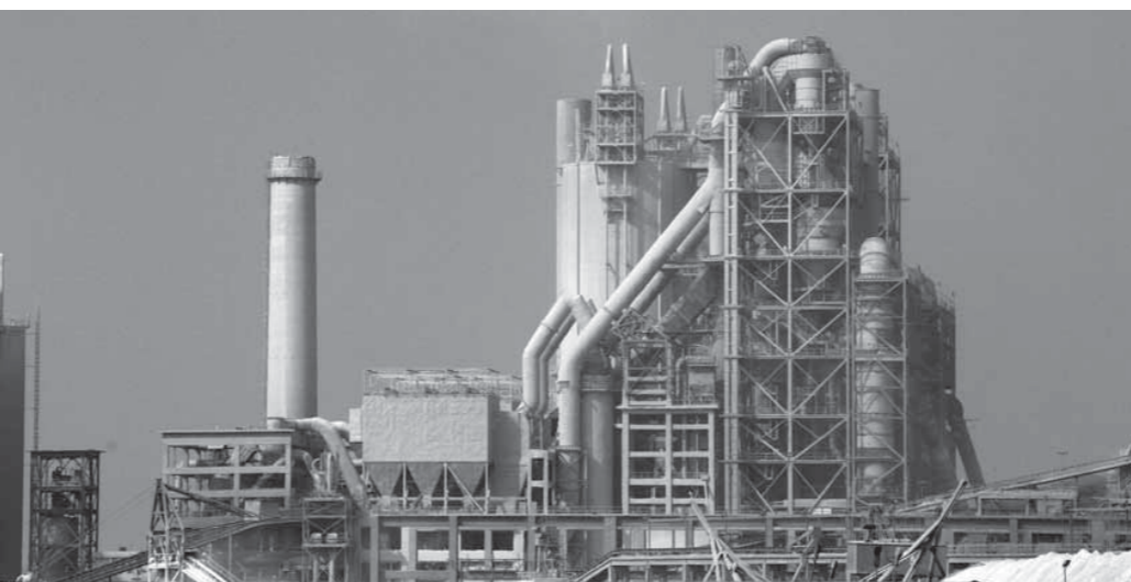
مصانع الأسمنت أصابة المصريين بالأمراض في كفر العلو