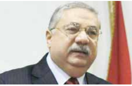
اللواء حسام نصر

ويضا بالتنسيق مع أكاديمية الشرطة لتوزيع الدليل على طلبة الكلية والضباط الدارسين بكافة الفرق التدريبية بالوزارة.