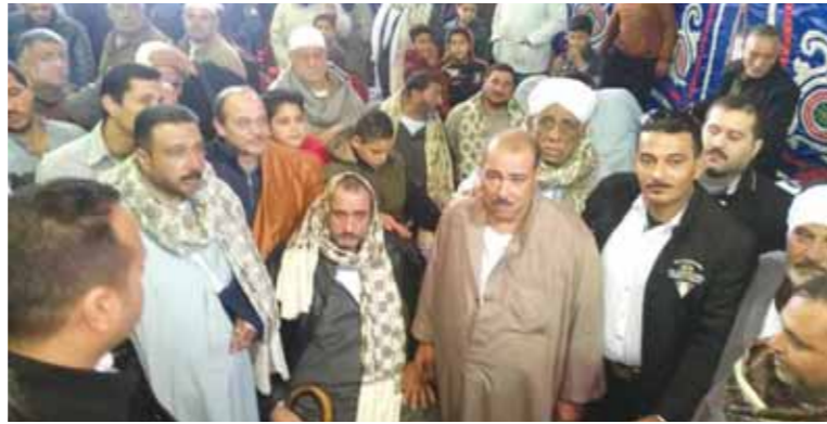
جانب من جلسة الصلح بين عائلتي ناصف وابوسليمان الجزار