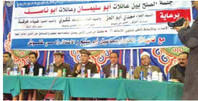
جانب من جلسة الصلح بين عائلتي ناصف وابوسليمان الجزار

الزرقا ومعاوناه التقيان خالد عبدالسلام وعصام إمبابي نيابة عن اللواء السيد شكري مدير المباحث الجنائية سنة- أحد أبناء عائلة ابوسليمان الجزار عام 2016 بسبب مشاجرة نشبت بين العائلتين لخلافات مالية بينهما، حضر الجلسة العرفية اللواء محمد خالد مساعد مدير الأمن نيابة عن اللواء مجدي أبوالعز مدير أمن دمياط والشيخ محمد سلامة وكيل وزارة الأوقاف بدمياط والمعيد أحمد محمد إدارة البحث الجنائي والرائد محمد معوض رئيس مباحث