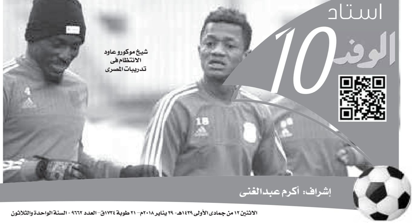
إشراف: أكرم عبد الفتى

الاثنين ١٢ من جمادى الأولى ١٤٢٩هـ - ٢٩ يناير ٢٠١٨م - ٢١ طوية ١٣٧٤ - العدد ٩٦٢٢ - السنة الواحدة والثلاثون