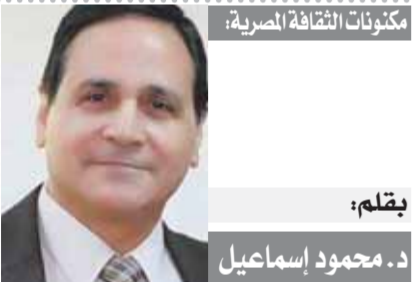
مكتوبات الثقافة المصرية:

من هنا يجب النظر إلى مستثمر الصعيد بنظرة مختلفة عن مستثمر الوادي حتى يذهب إلى هناك بمنحه المزيد من الحوافز وتخفيف أعبائه الضريبية مع فتح أسواق النقل لتسويق إنتاجه في الداخل وتشجيعه على التصدير للسوق الخارجي، لذلك كله لم يعد الصعيد جذاباً لمن يسكنه بعد إلا كما كان من قبل، وإنما بؤرة جذب يتساق عليها الكثيرون بعد أن أصبح الصعيد سعيداً.