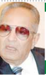
كلمة عدل بقلم: بهاء الدين أبو شقة

احتلت الجامعة الأمريكية بالقاهرة المرتبة الأولى في مصر وإفريقيا في التصنيف العالمى لجامعة إندونيسيا للجامعات المحافظة على اللون الأخضر GreenMetric World University Ranking. وتقدمت ٢٠ مركزاً هذا العام مقارنةً بعام ٢٠٢٠ لتحتل المركز ١٥٩ من ٩٥٦ مؤسسة حول العالم بدلاً من المركز ٢٢٢ ضمن ٩١٢ مؤسسة. ويعتبر هذا التصنيف منشوراً سنوياً بهدف زيادة الوعي تجاه الاستدامة داخل الجامعات، جدير بالذكر أن الجامعة الأمريكية بالقاهرة