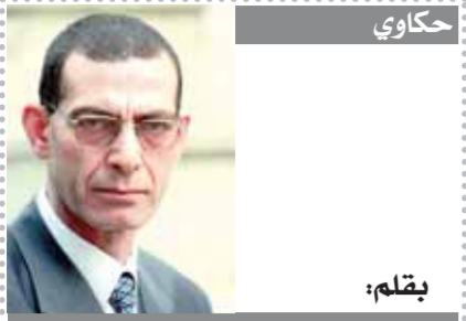
بقلم: د. وجاهي زين الدين