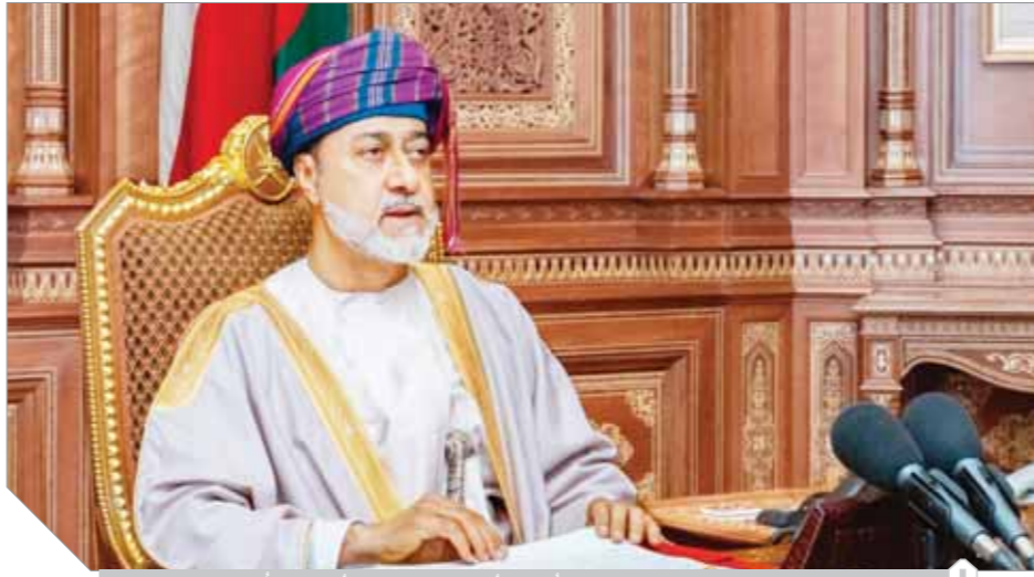
السلطان هيثم بن طارق سلطان عُمان، مؤسس النهضة العُمانية المتجددة.

وتتلاقى الرؤية المستقبلية في إحداث التنمية الاقتصادية والاجتماعية المستدامة بالسلطنة، من خلال تبنى مواطن القوة في المجتمع على أساس الالتزام بالقيم والبناء على الإنجازات والسعي نحو الفرض المتاح واستغلالها، مع الاعتماد بشكل أساسي على الإنسان العُمانى التسليح بالمعلم والمعرفة والتدريب، بحيث يمكن تجاوز التحديات بهمة وعزيمة وبالعامل الجاد المخلص، وتحقيق تنمية شاملة في مختلف المحافظات العُمانية بالشراكة مع القطاع الخاص وبما يتناسب مع الميزات التنافسية لكل محافظة لضمان توزيع مكتسبات التنمية وتوفير فرص العمل للمواطنين.