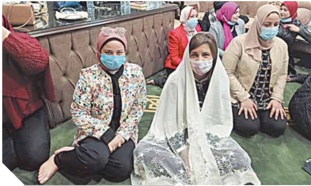
وزيرة الهجرة تستمع إلى خطبة الجمعة

كان مشهداً لافتاً حينما حضرت نبيلة مكرم خطبة الجمعة وهي مرتدية الحجاب بمسجد الرحمة بمحافظة دمياط، وأشادت بسرعة استجابة وزير الأوقاف لدعم جهود الوزارة لمكافحة مخاطر الهجرة غير الشرعية التي توجت بتوقيع بروتوكول تعاون بين الوزارتين ووجهت وزيرة الهجرة التحية لأهالي دمياط مؤكدة أن مصر تصدر للعالم مشهداً جميلاً.