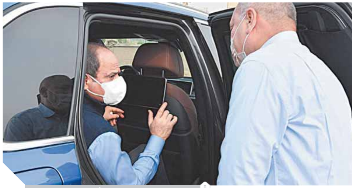
الرئيس خلال لقائه بأحد المواطنين