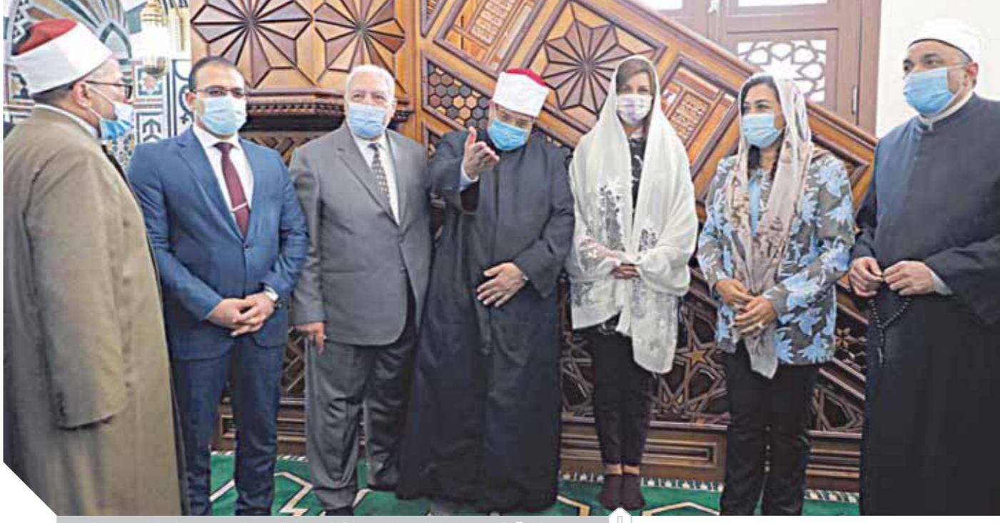
وزير الاوقاف مع وزيرة الهجرة ومحافظ دمياط داخل مسجد الصفا بدمياط