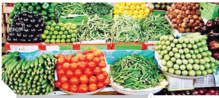
تكدس الحاصلات الزراعية بعد توقف التصدير

مثل البطاطس وهو أحد المحاصيل الرئيسية ويمثل المحصول الثانى لمصر على مستوى العالم في ٢٠١٠. ويؤيد ٢٠٠ مليون طن، وذلك خلال الفترة من يناير إلى يوليو ٢٠١٠. حيث بلغت كمية الصادرات خلال العام الماضى ٢٠١١ و٢٠١٠ ما يقرب من ٢٠٠ مليون و٢٠٠ مليون طن مقابل ٢٠١١ و٢٠١٠. إن طلت حركة التجارة مستمرة ولم يحدث الإغلاق مكان تلف محصولاً ما وفتح الباب لدولة أخرى أن تحل محل الدولة المتضررة للتصدير، الأمر كله يتعلق بالطبيعة وهي مسألة خارج السيطرة.