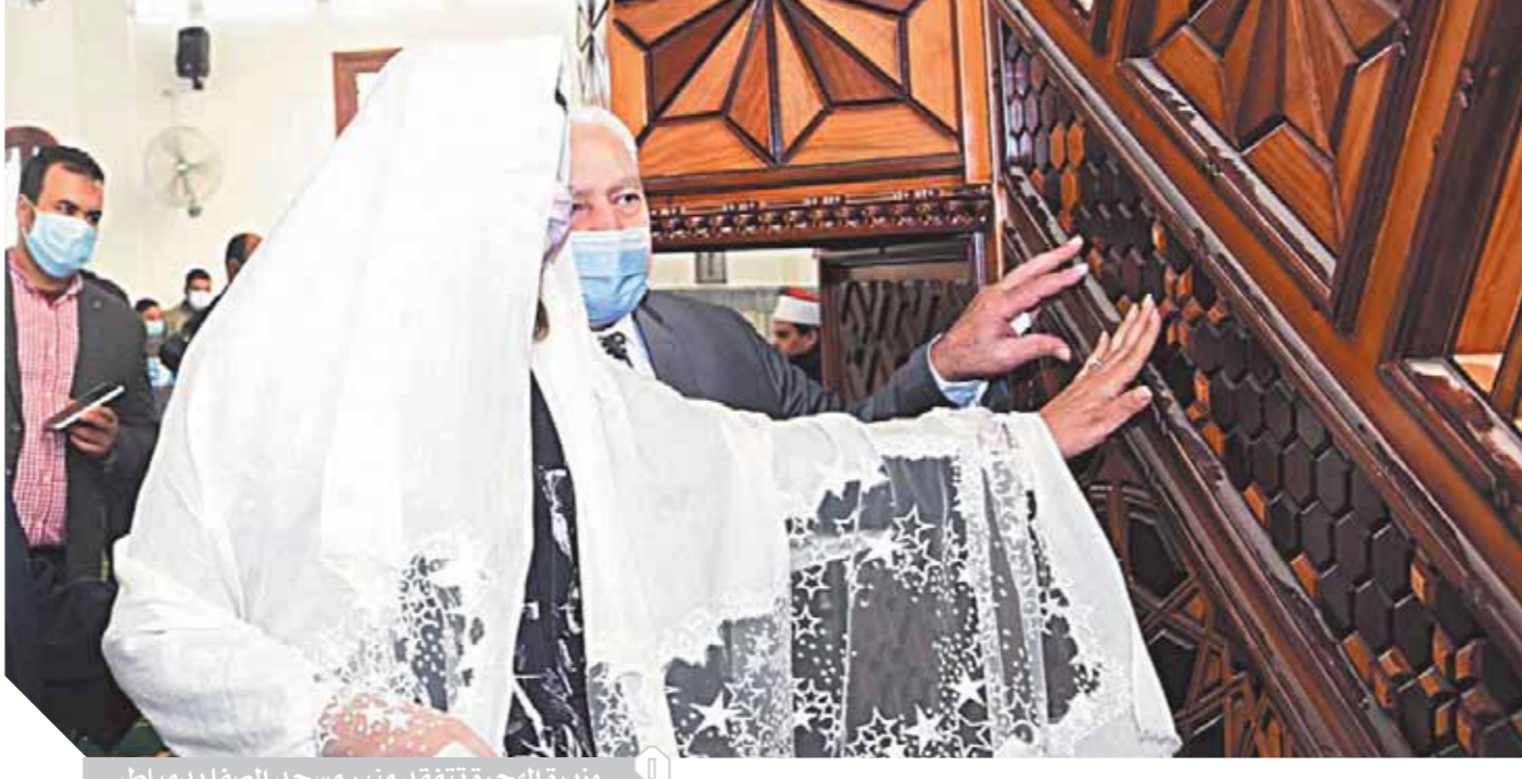
وزيرة الهجرة تتفقد منبر مسجد الصفا بدمياط

جاء ذلك خلال ندوة التوعية بمخاطر الهجرة غير الشرعية بمحافظة دمياط والتي نظمتها