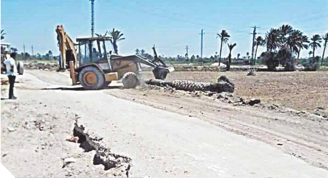
ما زالت الطرق في انتظار الإصلاح

الفيوم - محمد الهرايجي: تسلم الدكتور أحمد الأنصاري زمام الأمور في محافظة الفيوم في نهاية شهر نوفمبر من العام الماضي قداماً من محافظة سوهاج واستشرى عمله بهيئة الأسعاف والمجالس الطبية المتخصصة وحصول الهيئة خلال فترة توليه على المركز الثاني في جائزة الصحة العربية ونجح في حل العديد من المشكلات حتى تم تعيينه رئيساً لهيئة ثم أسندت إليه رئاسة بعثة الحج الطبية المصرية عام ٢٠١٧ ثم توليه منصب مدير مشروع إنهاء قوائم انتظار مرضى الحالات الحرجة وحقق فيها تقدماً كبيراً وتم إنهاء مشكلة قوائم انتظار مرضى الحالات الحرجة قبل الموعد المحدد لهم حتى تم تعيينه محافظاً لسوهاج.