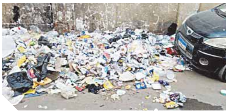
القاذورات تملأ شوارع الغريبة

سمنود والسدى توقف عن العمل وشرد عماله وأسرحهم أيضا بعد توقف العمل داخل المصنع وعدم حصول العمال على وواتهم بسبب تراكم الديون على المصنع وتهالك المكينات وعدم إجراء عمليات الصيانة، وفي قطاع النظافة تراكمت أكرام القمامة في عاصمة المحافظة مدينة طنطا بل وفى الشوارع والميادين الحيوية منها وعلى مرأى ومسمع من المسئولين الذين يهرون على حل الأمانك صباح مساء ولم يتحرك ساكن. أشار المحافظ في أكثر من مناسبة ولقاء مع الصحفيين إلى أنه بذل جهوداً مضنية فى حل مشكلة النظافة وتراكم القمامة، إلا أنها مشكلة مزمنة لأسباب عديدة أهمها السلوك الشخصى لبعض المواطنين الذين يلقون القمامة خارج الصناديق التي خصصت لجمع القمامة وكذلك وجود مكبس واحد فقط للقمامة داخل مدينة طنطا، أضف إلى ذلك المشاكل المزمنة والمستمرة بصنع تدوير القمامة بالمحلة الكبرى والتي لم تحل جذريا بالرغم من تعاقب المحافظين.