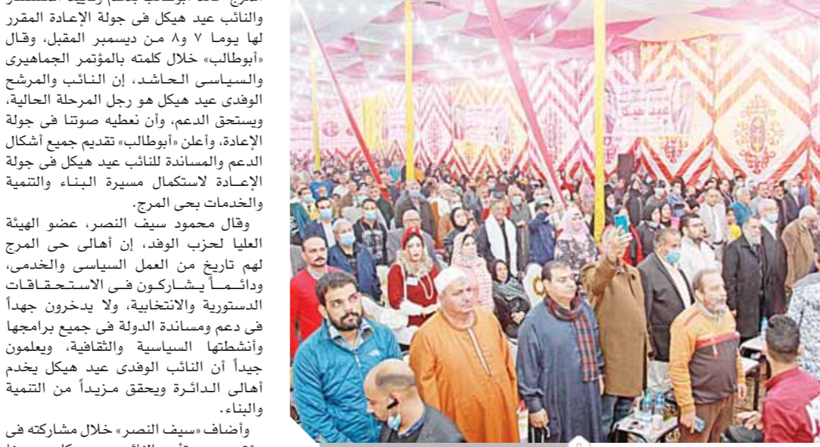
حضور كبير لمؤتمر مرشح الوفد