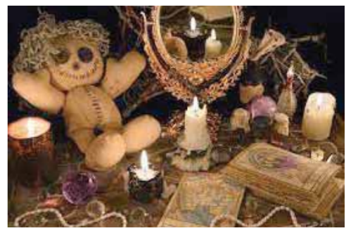
لمزيد من الأخبار والتقارير المصورة ALWAFD.NEWS