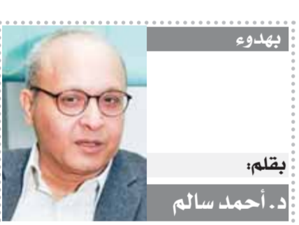
بقلم: د. أحمد سالم

الحكومة مشكورة تبنت ملف النظافة، وتم التعاقد مع شركتين على ما أتذكر لتحمل المسؤولية، وما فهمته من مسئول إحدى الشركتين قيامهما بإرسال مندوبيها للمنازل وحمل القمامة من خارج باب الشقة، تماما مثلما كان يفعل الزبال، زمان كنا نترك له كيس القمامة على الباب مساء وهو يجمله في الصباح نظير مبلغ شهري، ونسدد مبلغا مماثلا على فاتورة الكهرباء، الشركتان سوف تقومان بتحصيل قيمة الرسوم أيضا على فاتورة الكهرباء، من جنهين إلى أربعين جنبها شهريا بالنسبة للوحدات السكنية، ومن ثلاثين جنبها إلى مائة جنبه شهريا للوحدات التجارية المستقلة، والوحدات المستخدمة مزارع لأنشطة المهن والأعمال الحرة، ولا تتجاوز الرسوم خمسة آلاف جنبه شهريا للمنشآت الحكومية، والهيئات العامة، وشركات القطاع العام، وقطاع الأعمال العام، والمستشفيات، ومنشآت الرعاية الصحية، والمنشآت التعليمية الخاصة. الشركتان كما قيل سوف تمنعان البوابين وغيرهم من جمع القمامة من المنازل أو تجميعها أمام العمارة، كما ستقوم الشركتان، حسب تصريحات المسئولين بهما، برفع القمامة من الصناديق التي تضعها على نواصي الشوارع، كما ستقوم بمنع النباشين والفرانزين من التعرض للصناديق، وتشمل عقود الشركتان نظافة عملية الكس وشطف التراب وغيرها من الشوارع. هذا طيب وقد يساعد بالفعل على تنظيف الشوارع ورفع القمامة من البيوت، لكن هل البيئة المحيطة ستسمح بتفقيدها، هل الزبالون والبوابون سوف يرتضون إقصاءهما، الشركتان أكدتا استعانتهمما بالعمالة المهرة منهم، وأنهما لن تقوموا بإقصاء سوى غير المدرب، ومن تستعين به سوف يرتدى زي عمال الشركة ويحمل كارتينها ويصعد إلى المنازل أو يعمل القمامة من صناديق الشوارع أو يعمل في كس الشوارع.