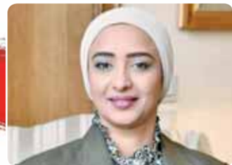
بقلم: أميرة أبو شقة