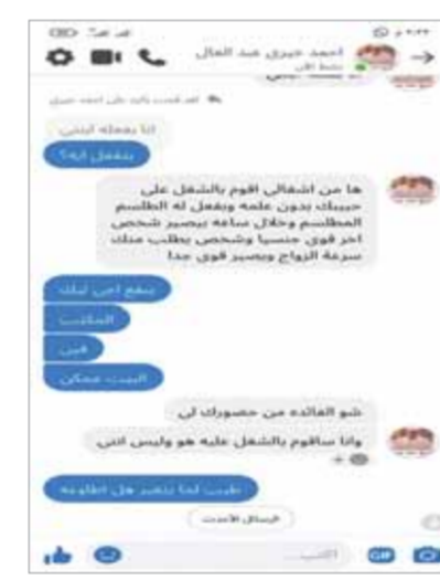
جانب من الحديث بين محرم، الوغد، والدجال

وقال «الجندي»: إن مشروع القانون يهدف إلى حماية المواطنين من جميع بعد تزايد الممارسات الخاطئة من يدعى «السوشيال ميديا» وتعرض الكثير لعمليات النصب، أعلنت الحكومة عن مشروع قانون التجارة الإلكترونية المقدم لمجلس النواب، وكشف محمد الجندي، خبير أمن المعلومات، تفاصيل حولها.