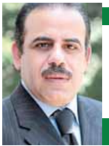
عبد العزيز النحاس

لقد وضعت الحكومة استراتيجية مصرية مائية للحفاظ على المياه وتخصيص نحو ٥٠ مليار دولار حتى عام ٢٠٢٧، تتضمن تنفيذ مشروعات كبرى لتحلية المياه، وخفض الاستهلاك، وحسن استخدام الموارد المائية. ولا شك أن هذا الاستعداد الذي يعكس يقظة ودقة ووعياً بأهمية الموارد المائية لا يعني أبداً أي تراخ أو تباطؤ في الموقف المصري تجاه سد النهضة. ففي تصوري، فإن هذه القضية تحدياً هي قضية حياة أو موت ولا تقبل