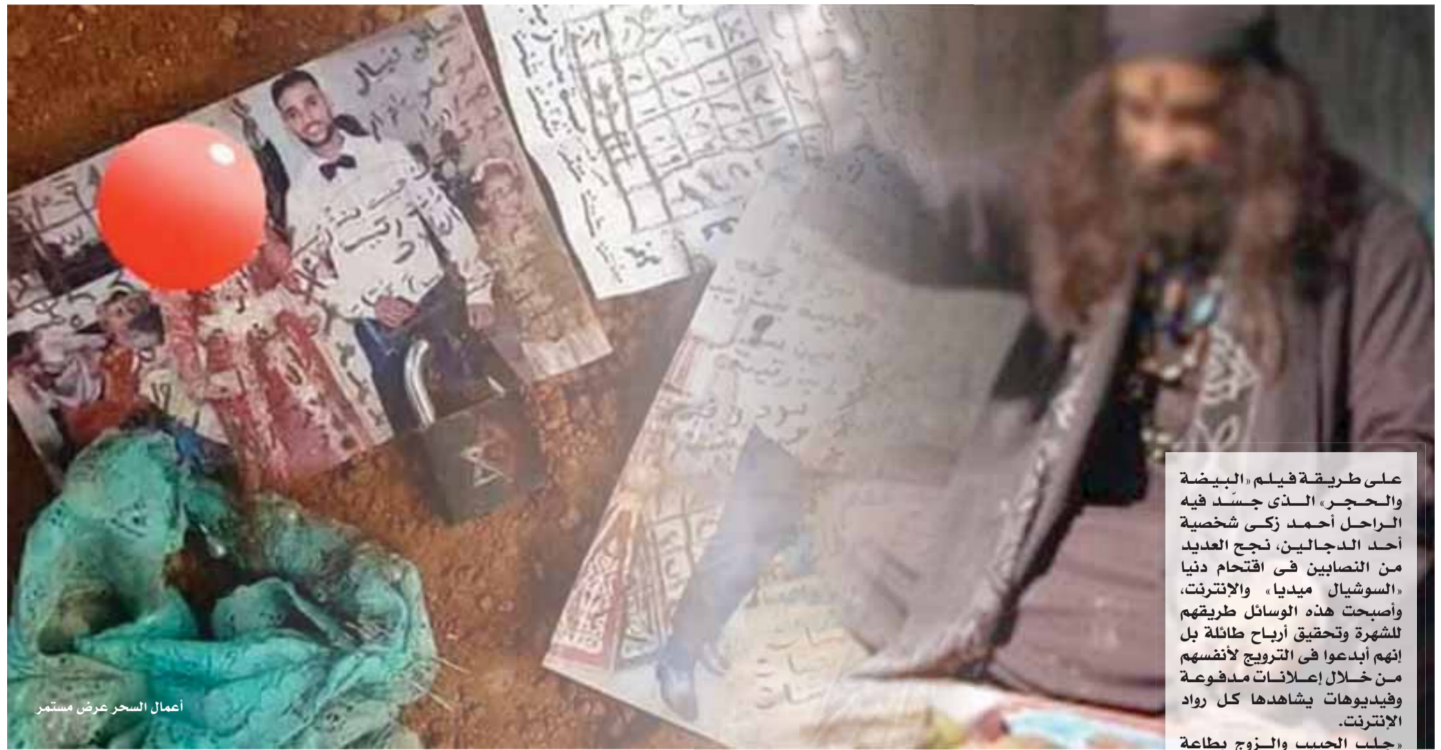
أعمال السحر عرض مستمر

على طريقة فيلم «البيضة والحجر» الذي جسّد فيه الراحل أحمد زكي شخصية أحد الدجالين، نجح العديد من النصابين في اقتحام دنيا «السوشيال ميديا» والإنترنت، وأصبحت هذه الوسائل طريقهم للشهرة وتحقيق أرباح طائلة بل إنهم أيدعوا في الترويج لأنفسهم من خلال إعلانات مدفوعة وفيديوهات يشاهدها كل رواد الإنترنت.