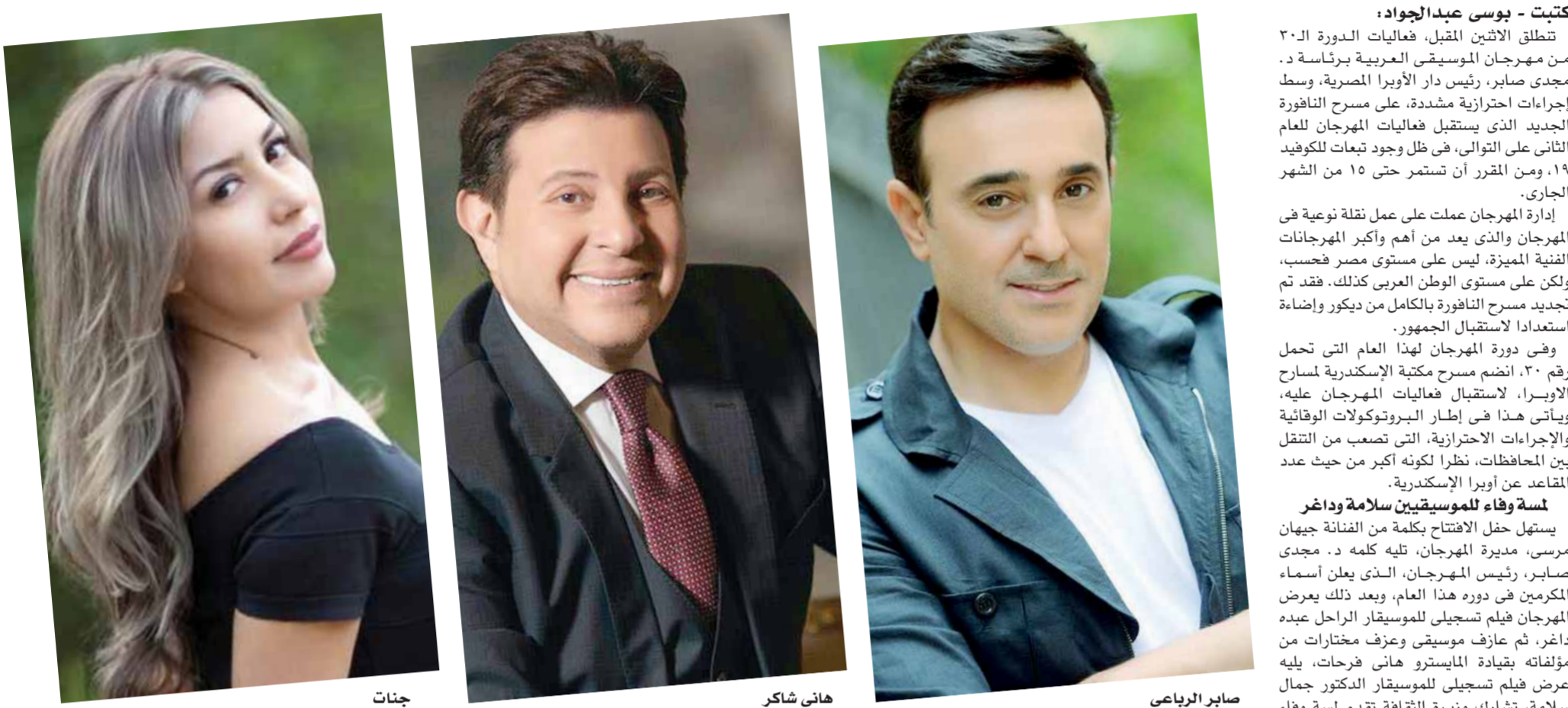
صابر الرباعي هانى شاكر جنتا