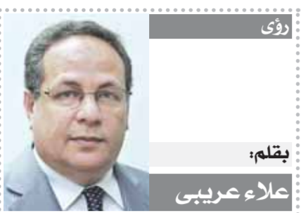
بقلم: علاء عربي