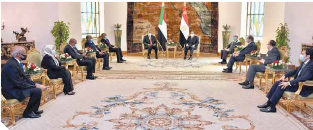
الرئيس السيسى خلال اجتماعه أمس برئيس المجلس السيسى السودانى

من جهة أخرى، اجتمع أمس وزراء الخارجية والرى لدول مصر والسودان وإثيوبيا، لاستئناف مفاوضات سد النهضة، بعد توقف شهرين. وأكد المهندس محمد السباعى المتحدث باسم وزارة الموارد المائية أن مصر تمتلك شواهد وثابتة ونقاط قانونية وفنية مهمة، ومستعدة للتفاوض بجدية لإنجاح هذه المحادثات من أجل اتفاق عادل ومتوازن، يحقق مصالح الدول الثلاث. ومن ناحية أخرى شارك سامح شكرى وزير الخارجية فى الاجتماع الوزارى القادم الذى دعت اليه جنوب إفريقيا.