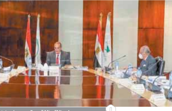
وزير الاتصالات يجتمع بمجلس إدارة البريد الجديد