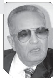
بهاء الدين أبوشقة