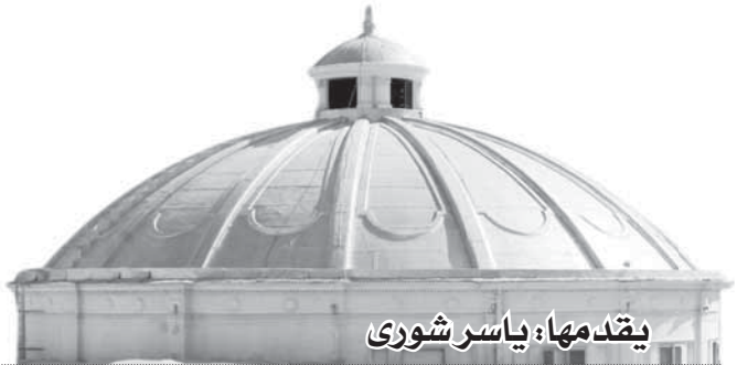
يقدمها: ياسر شوري