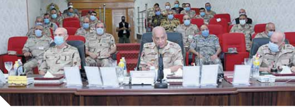
وزير الدفاع والإنتاج الحربي خلال لقائه قيادة قوات شرق القناة لمكافحة الإرهاب

قرار قائد قوات شرق القناة لمكافحة الإرهاب الذي تضمن شرحاً لكل مراحل العمليات والجهود المبذولة لملاقفة العناصر الإرهابية وتضييق الخناق عليها، كما استعرض كل من قائدتي الجيش الثاني والثالث الميدانيين مراحل سير العمليات