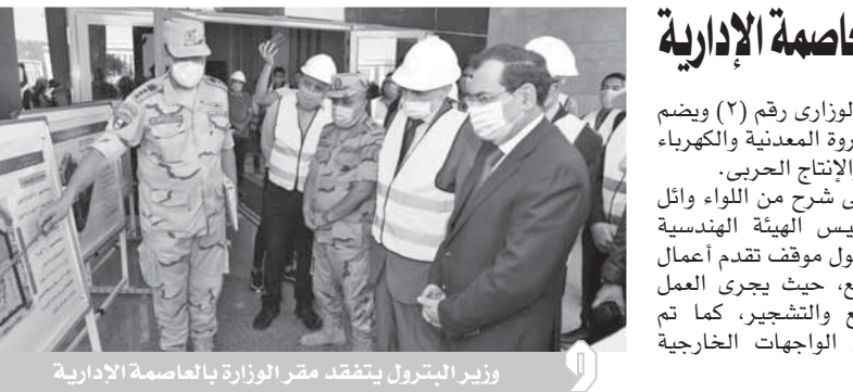
وزير البترول يتفقد مقر الوزارة بالعاصمة الإدارية

يقع ضمن المجمع الوزارى رقم (٢) ويضم وزارات البترول والثروة المعدنية والكهرباء والطاقة المتجددة والإنتاج الحربي. واستمع الوزير إلى شرح من اللواء وائل كمال، مساعد رئيس الهيئة الهندسية للقوات المسلحة، حول موقف تقدم أعمال الإنشاءات بالمجمع، حيث يجري العمل على تسويق الموقع والتشجير، كما تم الانتهاء من أعمال الواجهات الخارجية بنسبة ٩٩٪.