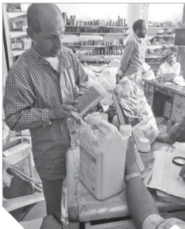
جانب من حملات التفتيش على محلات المبيدات

وأوضح التقرير أن تكاليف المبيدات المستخدمة فى الإنتاج الزراعى تبلغ ٢ مليار جنيه، وإجمالى المستهلك منها نحو ١٠ آلاف طن، بمعادل استخدام سنوي يصل إلى ١٠٠ جرام للفرد سنويًا وهو أقل كثيرًا من المتوسط العالمى ٢٨٥ جرامًا للفرد. ويبلغ عدد مصانع المبيدات فى مصر ٣٦ مصنعًا تساهم بثالث الاستهلاك السنوي من المبيدات.