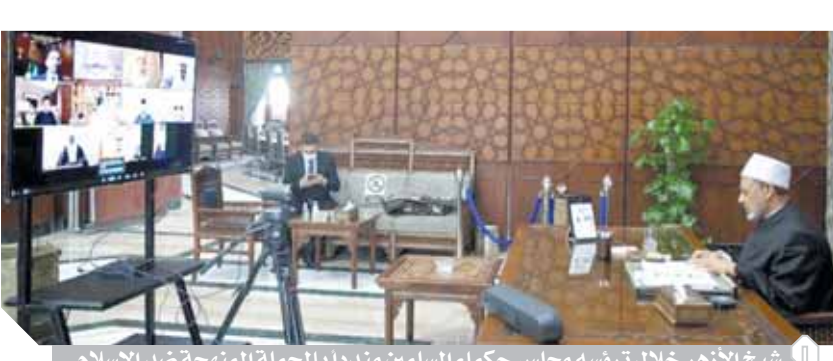
الشيخ الأزهر خلال ترؤسه مجلس حكماء المسلمين مندداً بالحملة الممنهجة ضد الإسلام

اليمنى الذى يستهدف تشويه الإسلام وترسيخ فكرة الإصافه بالإرهاب والانغزالية، ويروج للعداء ضد المسلمين. وأكد المجلس أن مواجهة هذا الإساءات ستكون من خلال القضاء وبالطرق القانونية، إيماناً من المجلس بأهمية مقاومة خطاب الكراهية والفتنة بالطرق السلمية والعقلانية والقانونية. وطالب المجلس المسلمين أيضاً بمواجهة خطاب الكراهية عبر المطالبة بسن تشريعات دولية تجرم التحريض على الكراهية والتمييز ومعاداة الإسلام، مطالباً بعلاء الغرب ومكبريه بالتندى للحملة الممنهجة على الإسلام ومعاداته والنزج به إلى ساحات الصراعات الانتخابية والسياسية وتهنئة البيئة الصحية للتعايش والأخوة الإنسانية. ومن جهة أخرى هنا مجلس جامعة الأزهر الأمة الإسلامية والرئيس السيسى والشعب المصرى بالمولد النبوى الشريف وأيد موقف الإمام الأكبر د. أحمد الطيب فى مواجهة الإساءة للرسول ومقاضاة «شارلى إيدو».