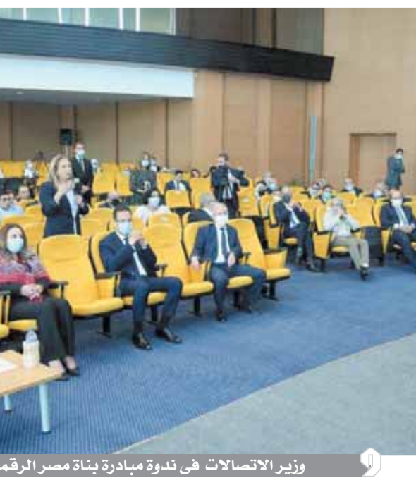
وزير الاتصالات في ندوة مبادرة بناء مصر الرقمية