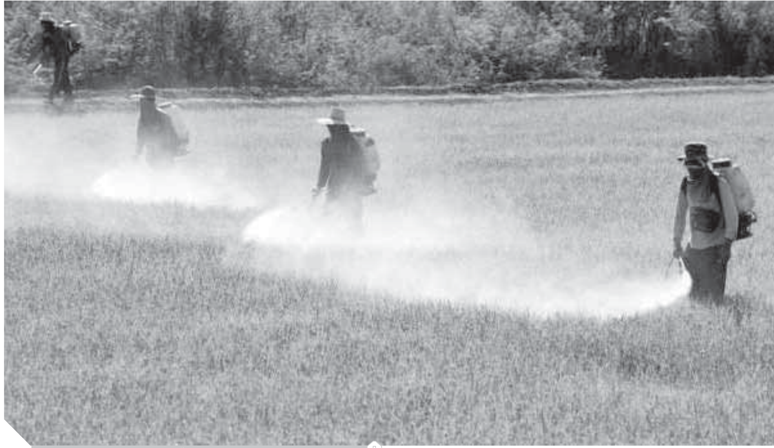
رئى المبيدات مهم لمواجهة الآفات وزيادة الإنتاج

التقاوى والمبيدات.. ثنائى تكمن فيه سر النهضة الزراعية، وبدونها لن تستطيع أى دولة زيادة إنتاجها من الخضراوات والفاكهة. وكشف وزير الزراعة السيد القصير فى اجتماع عقد مؤخرًا بمجلس الوزراء، أن الوزارة وضعت برنامجًا وطنيًا لإنتاج تقاوى الخضر، يستهدف تقليل فاتورة الاستيراد وتوفير العملة الأجنبية وتنمية الاقتصاد، من خلال استنباط أصناف وهجن خضر محلية تتساوى مع مثيلتها المستوردة أو تتفوق عليها. وقال وزير الزراعة إن إنتاج هذه الأصناف محليًا يؤدي إلى ضبط أسعار التقاوى، التى وصلت لأرقام مبالغ فيها للغاية، بما يحقق للمزارع أعلى نسبة ربح وعائد من زراعة محاصيل الخضر المختلفة.