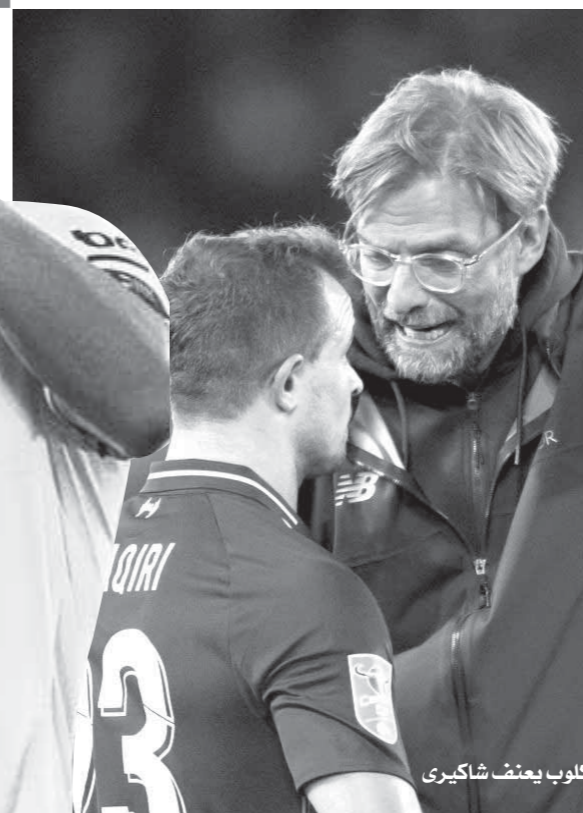
كلوب يعنف شاكيري