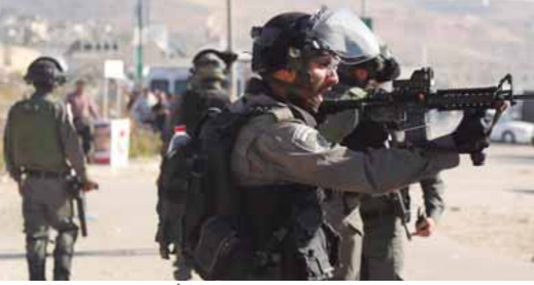
ما زالت الاعتداءات الصهيونية مستمرة على «الأقصى»

غير مقبولة. وقال وزير الدفاع الإسرائيلي ليرمان إنه لا يعير اهتماماً لتصريحات الرئيس الأمريكي دونالد ترامب حول احتمال حل الدولتين وقيام دولة فلسطينية، وفقاً لموقع روسيا اليوم. وقال ليرمان: «الدولة الفلسطينية ببساطة لا تهمي، أنا مهتم بالدولة اليهودية».