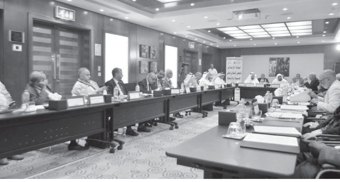
إحدى جلسات مؤتمر المجلس الإسلامي العالمي للدعوة والإغاثة بالقاهرة

منظمات المجلس الإغاثية للمتضررين من العدوان الحوثي الصفي الرافض لكل الحلول السلمية. وشجب المنظمات الأعضاء استمرار حرب الإبادة البوذية في ميانمار ضد مسلمي الروهينجا وتهجيرهم إلى بنجلاديش وممارسة كل أشكال الاضطهاد والإبادة ضدهم مما يتطلب تعاوناً دولياً جاداً لتوقف المساة التي بدأت من سنوات طويلة دون رادع دولي. وحثت أمانة المجلس للمنظمات الإغاثية والدعوية بالمجلس بمصانعة جهودها للتخفيف من المساة ودعوة أهل الخير والدعاة للتعاون الجاد لإغاثة المتضررين الروهينجا على حدود بنجلاديش مع الضغط على المجتمع الدولي لتوصيل المساعدات إلى الداخل للتخفيف من معاناة المسلمين المحاصرين الذين يتعرضون للاضطهاد في أقطاب صوره. ودعت أمانة المجلس لجنة أفريقيا إلى زيادة جهودها التنسيقية بين الجمعيات والمنظمات الدعوية والإغاثية العاملة في القارة الأفريقية التي يتعرض الوجود الإسلامي فيها لمخاطر وتحديات كبيرة يجب التعاون الجاد في مواجهتها سواء فيما يتعلق التبشير والتشيع الذي يقوده الصفيون الإيرانيون. في السياق ذاته حازت قضية دعم الطلبة الوافدين بالأزهر الشريف أهمية كبيرة في المناقشات، حيث طالب المجلس بزيادة المنح الدراسية لهم وحل مشكلاتهم وتوفير الظروف الملائمة لهم لاستكمال دراستهم لأنهم سفاء للإسلام في بلدانهم مع ضرورة إعدادهم دعواً وعقد دورات مستمرة لأنظمة ودعاة الدول الإسلامية غير العربية لنشر الوعي الديني بها. استحدث المجلس لجنة باسم «لجنة القرآن والسنة» ويرأسها فضيلة الدكتور عبدالله بن علي بفسر، الأمين العام للهيئة العالمية للكتاب والسنة التابعة لرابطة العالم الإسلامي.