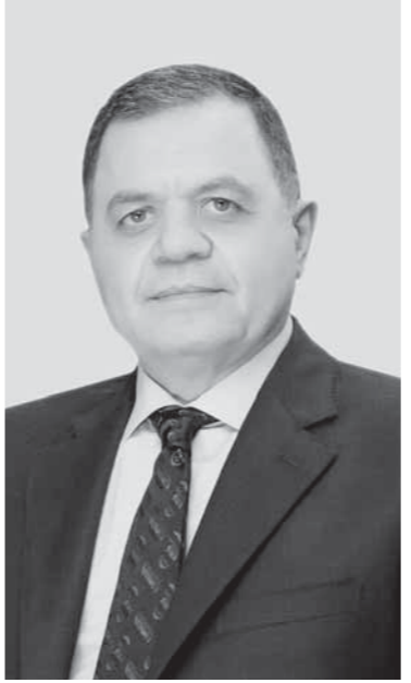
كتب: محمد عبدالفتاح

www.facebook.com/moiegy الصفحة الرسمية لوزارة الداخلية