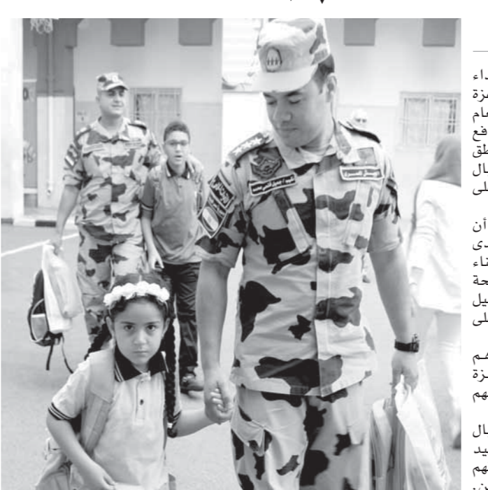
كتب: محمد صلاح وسامية فاروق

انطلاقاً من المسئولية الوطنية تجاه أبناء الشهداء واعتزازاً بالبور الوطني الذي قدموه من أجل عزة الوطن، وجه الفريق أول محمد زكي القائد العام للقوات المسلحة وزير الدفاع والإنتاج الحربي، يذفع لجان من القيادات والجيش الميدانية والمناطق العسكرية ومختلف الإدارات والأسلحة لاستقبال ومصاحبة أبناء الشهداء إلى مدارسهم وذلك على مدار الأسبوع الأول من الدراسة. وأكد الضباط المصاحبون لأبناء الشهداء أن تضحيات آبائهم سوف تظل دوماً نبراساً نهدي به ونسير على دربه ومصداً للفخر والعزة لأبناء الشهداء وأسراهم، وأن ما تقدمه القوات المسلحة من رعاية لأسر الشهداء إنما هو جزء من رد الجميل لرجال قدموا الغالي والتفيس من أجل الحفاظ على استقرار وأمن الوطن. وعبر عدد من أبناء الشهداء عن فخرهم واعتزازهم بما قدمه أبائهم في سبيل عزة الوطن وعن سعادتهم لرعاية القوات المسلحة لهم ولأسراهم. كما ألقى مدير المدارس التي شهدت استقبال أبناء الشهداء كلمة بطابور الصباح عن الشهيد ومنزلته، مؤكداً أن تضحية الشهداء تعكس إيمانهم العميق برسالتهم وشعورهم بالمسئولية تجاه الوطن.