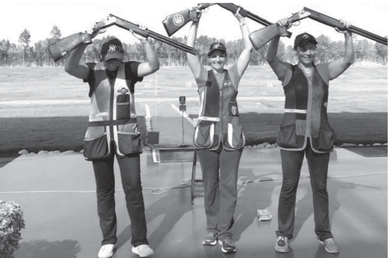
جانب من مناسبات البطولة

وأضاف: «إذا تم إخطارنا بوجود عقوبات سندرس الموقف سنستقدم بنظم: لأن الأهلي في الأدوار النهائية واللعب بدون جمهور في هذه الحالة سيكون عقوبة قاسية قد نلتبس ضدها إذا كانت حقيقية».