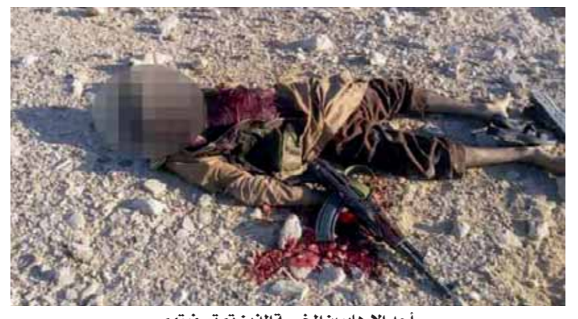
أحد الإرهابيين الخمسة الذين تم تصفيتهم

كتب - محمد عبدالفتاح ومحمد التهامي: نجحت الأجهزة الأمنية فى تصفية 5 عناصر إرهابية خلال مdahمة أمنية بمحافظة سوهاج، تم اتخاذ الإجراءات القانونية وتتولى نيابة أمن الدولة العليا التحقيق. وأعلنت الوزارة فى بيان لها أمس أنه استمرزا لجهود وزارة الداخلية فى مواجهة التنظيمات الإرهابية التى تستهدف تقويض الأمن والاستقرار وملاحقة العناصر الإرهابية الهاربة، والساعية لتنفيذ عمليات عدائية بالبلاد، اضطلع قطاع الأمن الوطنى بمشاركة أجهزة الوزارة المعنية بالعديد من العمليات التمشيطية حول أماكن تردد وتمركز العناصر المشتبه فيها خاصة الواقعة بالمناطق النائية بالوجه القبلى حيث تسعى هذه العناصر لاتخاذها كملأز للاختفاء