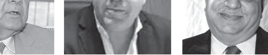
كتبت: مصطفى عبيد

اتسعت على مدى الأسابيع الأخيرة حدة الأزمة التي تواجه الصناعة المصرية بسبب انهيار الليرة التركية بنسبة تجاوزت 40%، ما دفع قطاع التجارة الخارجية بوزارة التجارة والصناعة إلى بحث كيفية اتخاذ تدابير للحد من الأزمة.