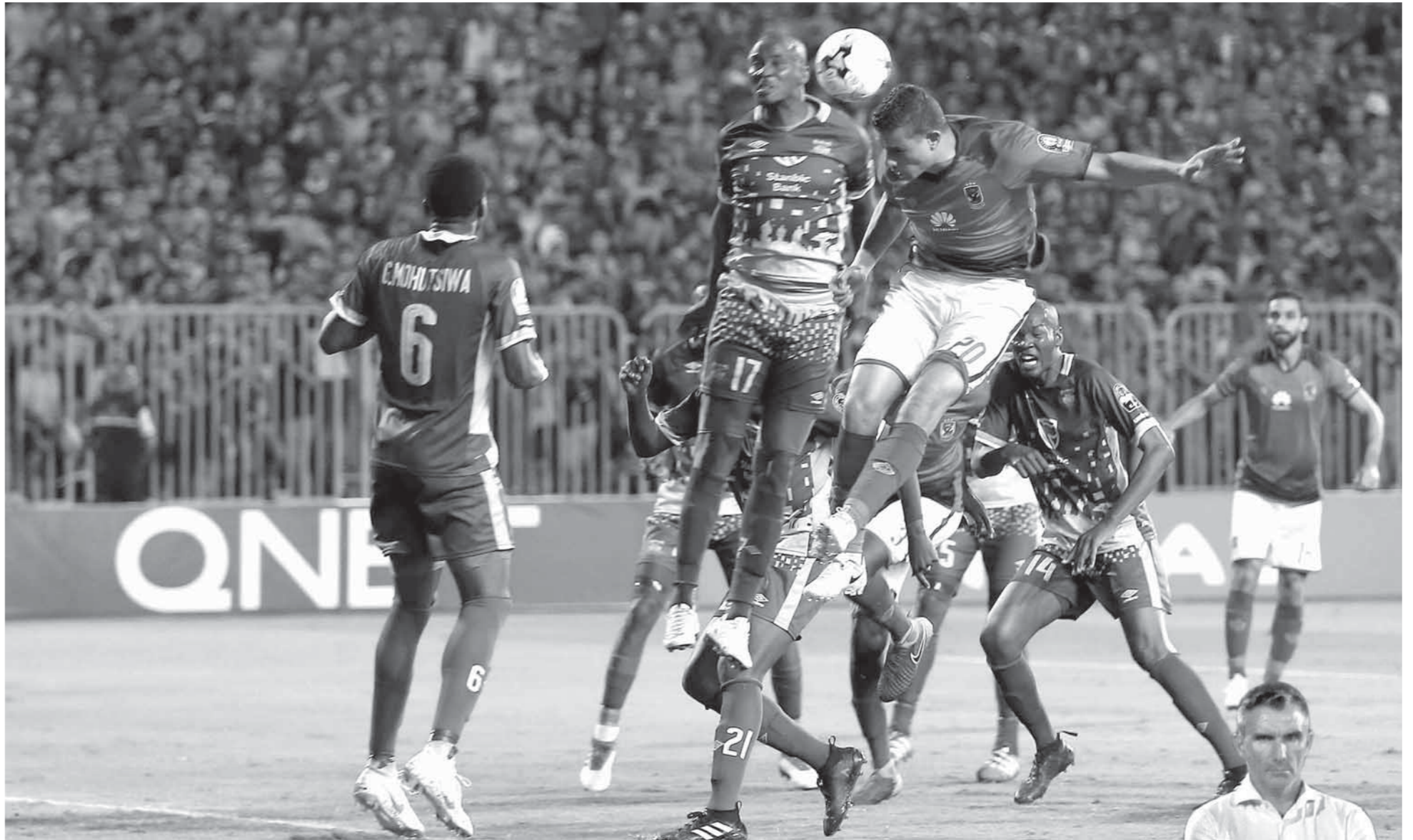
الأهلي يأمل عبور عقبة كمبالا

«كارتيرون» يتطلع للفوز الرابع على التوالي.. واختراق حصون أوغندا بدويتو الرعب