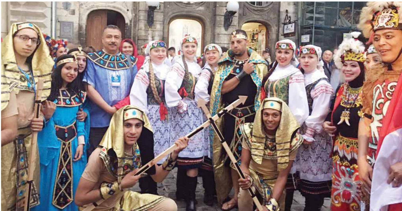
فريق منتخب جامعة بنها للفولكلور في أوكرانيا