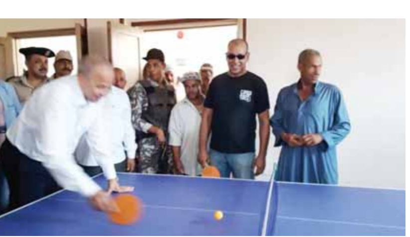
المحافظ أثناء لعبة تنس الطاولة

افتتح اللواء محمود عشماوى، محافظ القليوبية، أمس (اللاثين)، مركز شباب السلام بساحل دجوى بينها التابعة لمحافظة القليوبية بتكلفة قدرها ٢.٥ مليون جنيه. وقام المحافظ بلعب البلياردو داخل الصالة، كما قام بلعب تنس الطاولة مع النائب جمال كوش، عضو مجلس النواب عن دائرة مركز بنها.