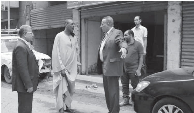
الدالي خلال تفقده نظافة الشوارع

للقمامة. ووجه «الدالي» بإزالة أي مخلفات وترش من جانبي شارع زغلول وكوبري أبو طالب والدفع بصناديق قمامة إضافية ورفع السيارات المتهاكلة، بالإضافة إلى رفع تراكمات الأرض القمامة.