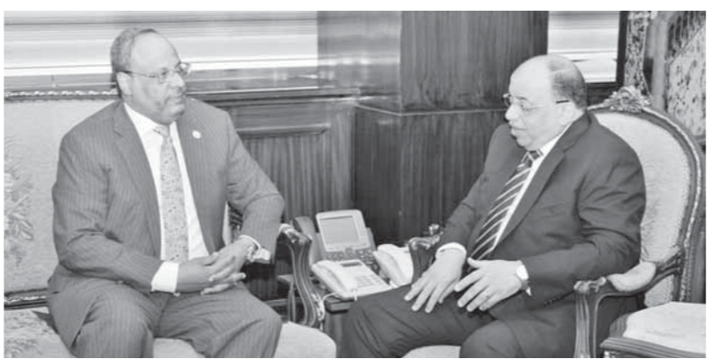
وزير التنمية يستقبل السفير الإماراتي