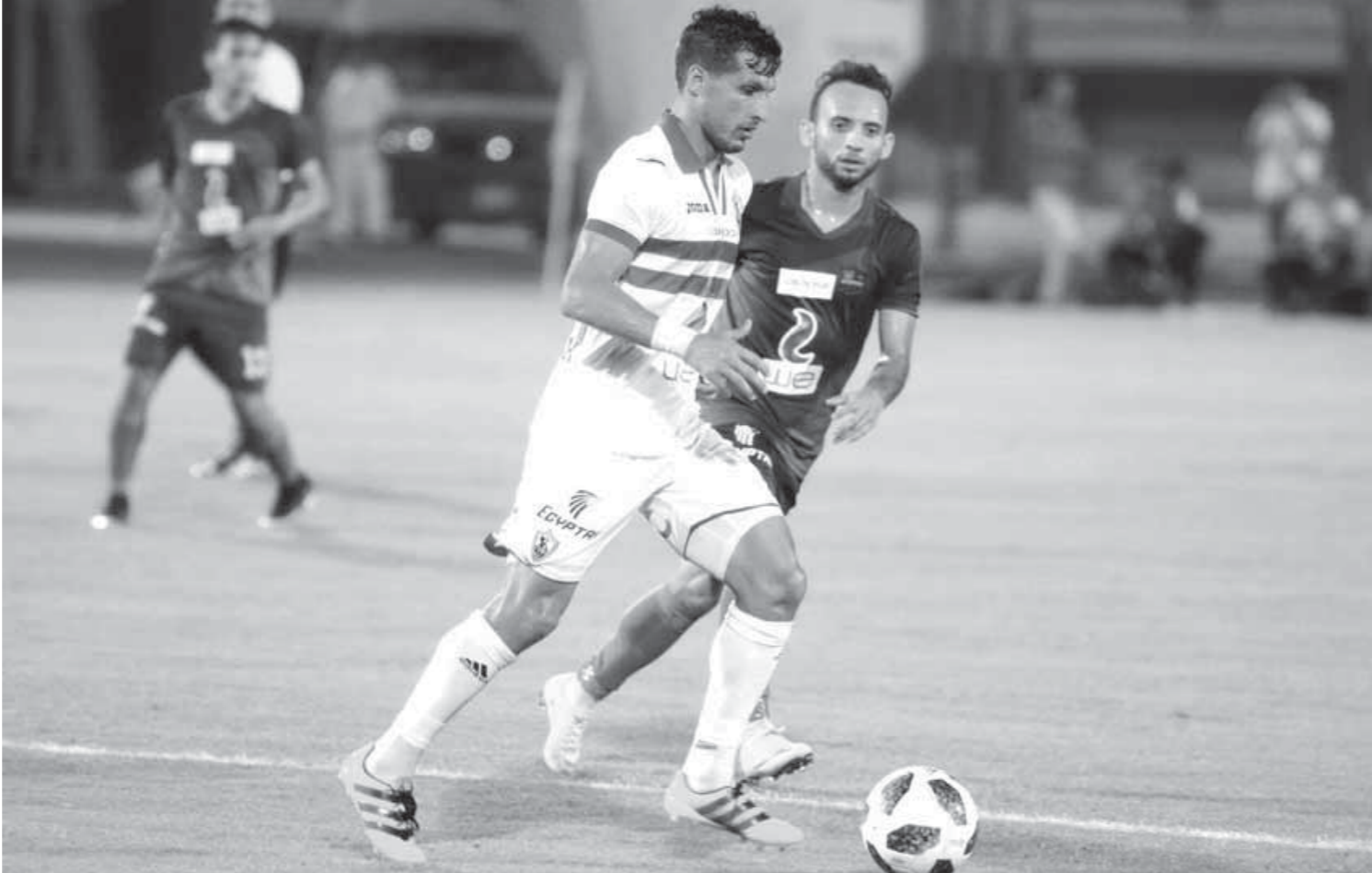
لائحة جديدة لطريق الكرة بالزمالك