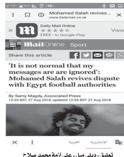
تعليق «ديلي ميل» على أزمة محمد صلاح

اتحاد الكرة في المرحلة القادمة بعد أن هاجم مسؤولي الاتحاد مركزاً على كلمات «صلاح» عبر تويتر. وأشارت صحيفة «ديلي ستار» البريطانية إلى أن صلاح أشعل الحرب ضد اتحاد الكرة بسبب أزمات عديدة نشبت في الفترة الأخيرة على رأسها استغلال حقوقه التجارية وإقحام صورته مع شركات أخرى مما جعل الأزمة تتفاقم بجانب أن صلاح اشترك من فوضى معسكر المنتخب في بطولة كأس العالم في روسيا. وأكدت الصحيفة أن صلاح يعاني منذ بطولة كأس العالم الماضية من آثار وتبعات ما تعرض له في معسكر منتخب مصر خاصة أن هناك حالة من الفوضى ضربت المعسكر. وأكد موقع «ليفربول إيكو» أحد أكبر المواقع الإلكترونية الجماهيرية الخاصة بنادي ليفربول أن صلاح هاجم اتحاد الكرة وربما يغيب عن مباريات منتخب مصر القادمة وهو ما يعزز فرض بقائه مع ليفربول خاصة في ظل المنافسة الشرسة على مركزه.