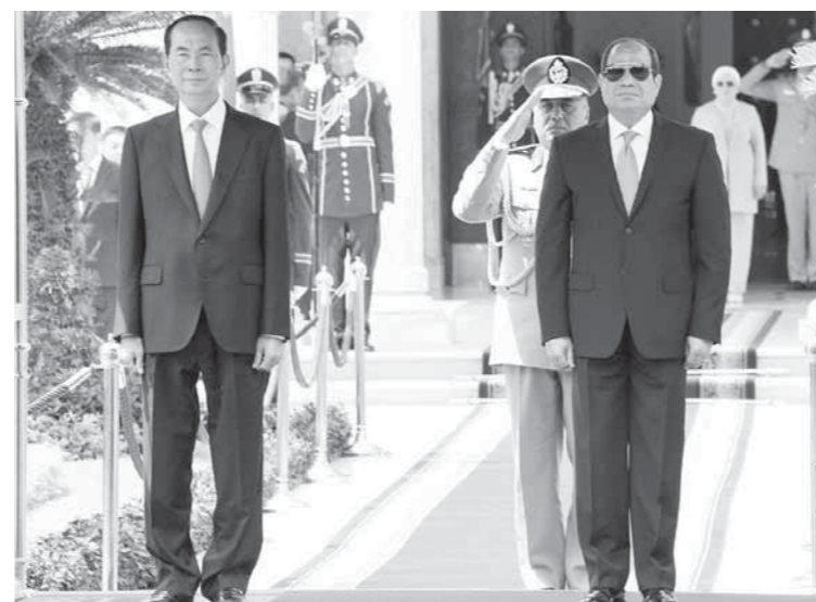
الرئيسان اثناء عزف السلام الجمهورى بقصر الاتحادية