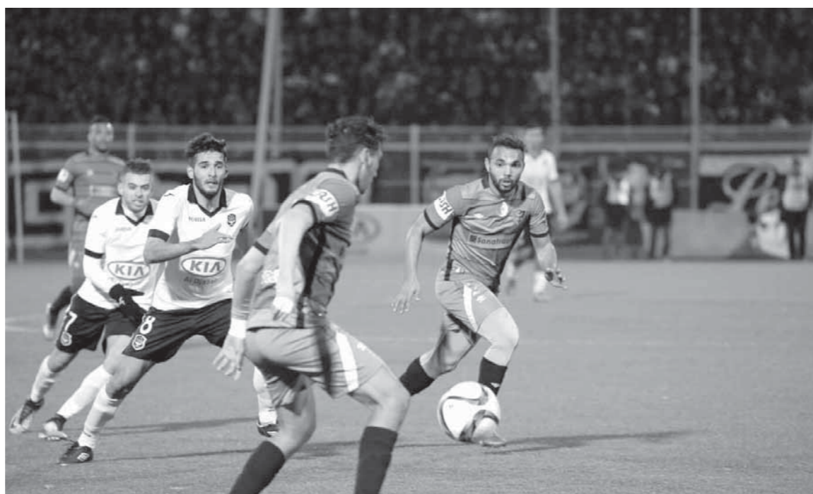
مواجهة وفاق سطيف مع الوددية تتسم المتاهل

يستضيف ملعب برج العرب بالإسكندرية في التاسعة مساء اليوم الثلاثاء اللقاء المرتقب الذي يجمع بين الأهلي وضييفه كمبالا سيتي الأوغندي بحضور 10 آلاف مشجع في الجولة السادسة والأخيرة للمجموعة الأولى بطولة دوري أبطال أفريقيا لكرة القدم. ويدخل الأهلي المباراة متصدراً ترتيب المجموعة الأولى برصيد 10 نقاط بعد أن انتفض الفريق الأحمر مع مديره الفني الفرنسي باتريس كارتيرون وحصد 3 انتصارات متتالية على حساب تاونشيب اليتسواني ذهاباً وإياباً بنتيجة 3-0، 1-0 ثم الفوز على الترجي التونسي في عقر داره بهدف نظيف بعد البداية المهزوزة بالخسارة أمام كمبالا في أوغندا والتعادل مع الترجي التونسي ببرج العرب. الأهلي ضمن التأهل إلى دور الثمانية بشكل رسمي مع الترجي، بينما يحتل كمبالا سيتي المركز الثالث برصيد 6 نقاط بعد الفوز على الأهلي وتاونشيب في أوغندا وخسر الفريق أمام الترجي ذهاباً وإياباً وأمام تاونشيب في بتسوانا. ويبحث الأهلي عن الثأر من كمبالا بعد أن خسر على يديه في أوغندا بثنائية دون رد، وهي المباراة التي تسببت في