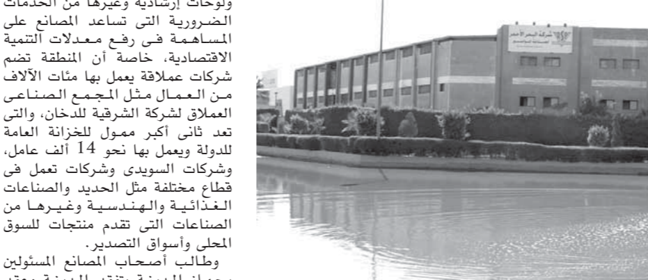
الصرف الصحى يفرق شوارع المنطقة الصناعية

كشفت صناع المنطقة الصناعية بمدينة 6 أكتوبر «اتجاه الواحات» عن تردى أوضاع المنطقة وغياب الخدمات منها وتجاهل المسؤولين بجهاز المدينة مشاكل المنطقة وعلاجها، أكد الصناع أن المنطقة الصناعية منذ فترة طويلة، لم يدخلها مسئول من جهاز المدينة إلا موظفى الأجهزة الرقابية الذين يترددون من وقت لآخر، وأكد أن الطرق بشوارع المنطقة متآكلة تماماً ولا توجد أعمدة إنارة أو لوحات إرشادية بتناوين الشوارع الرئيسية والفرعية مما أدى إلى قيام أعداد من أصحاب المصانع بعرضها للبيع أو عرضها للاستئجار.